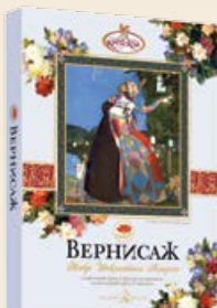
Набор конфет «Вернисаж» фундук / миндаль 190 г