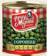
Зеленый горошек «Фрау Марта» ГОСТ 310 г