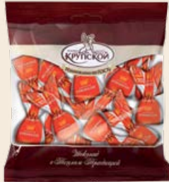
Конфеты «Трюфели» 200 г