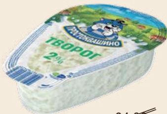
Творог «Простоквашино» 2% 220 г клинок