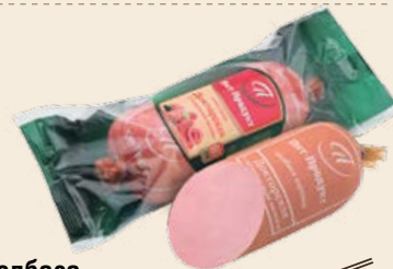
Колбаса «Докторская с натуральным молоком» вареная высший сорт 500 г (Пит-Продукт)