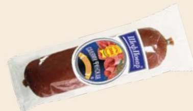
Колбаса «Салами Финская» полукопченая 400 г (Мясные деликатесы)