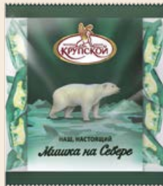
Конфеты «Мишка на Севере» 200 г