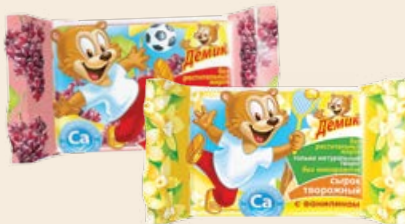
Сырок творожный «Демик» 12% ванилин / изюм 100 г