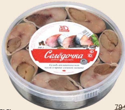
Сельдь «Викинг» в пряносолевой заливке 540 г (Санта)