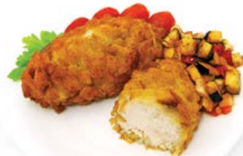
Котлета «Пожарская» 100 г