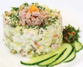
Салат «Оливье» 100 г