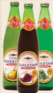
Напиток «Натахтари» газированный «Груша» / «Саперави» / «Тархун» в стеклянной бутылке 0.5 л