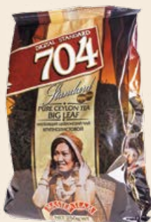
Чай «Мастер Тим» №704 черный в мягкой упаковке 250 г