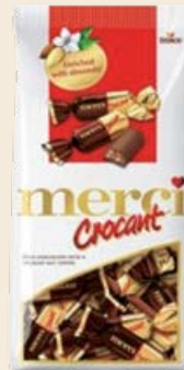
Набор конфет «Мерси» Crocant 125 г