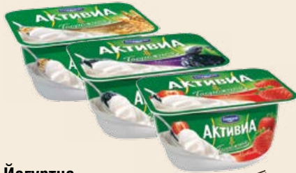
Йогуртно-творожный биопродукт «Активиа» 4.2% в ассортименте 130 г