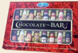
Набор конфет Шоколад-Бар 240 г