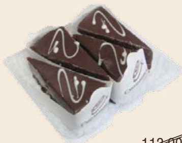
Набор пирожных «Суфлайт» 260 г (Смоленский)