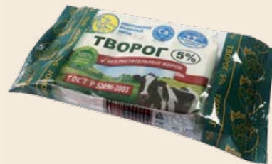
Творог 5% 180 г (ДМЗ)