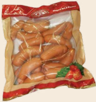
Сардельки «Телячьи» 1 кг (Черкизовский)