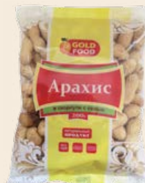
Арахис в скорлупе с солью 185-200 г (Gold Food)