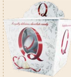
Набор конфет «Q» со сливочной на- чинкой с миндалем и кокосом 150 г