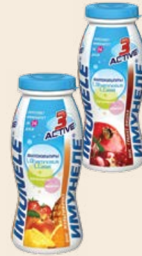
Кисломолочный напиток «Имунеле Neo» 1.2% в ассортименте 100 г