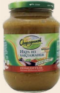
Икра из баклажанов «Огородников» Заморская в стеклянной банке 480 мл/ 490 г