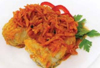
Рыба (треска) под маринадом 100 г