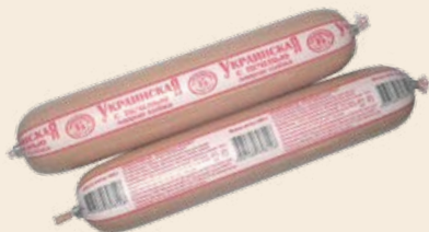
Колбаса «Украинская с печенью» вареная 400 г (Черкизовский)