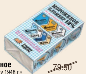
Мороженое «По рецепту 1948 г.» в брикете 200 г (Белгород)