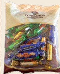
Конфеты «Конфэшн» батончики микс 200 г