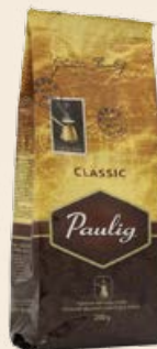
Кофе «Паулиг» Классик молотый (для заваривания в турке) 200 г