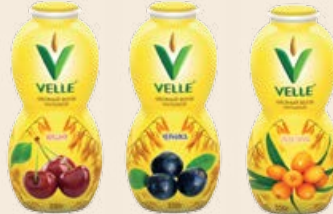
Продукт овсяный «Велле» питьевой в ассортименте 250 г