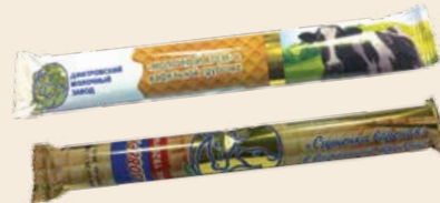
Вафельная трубочка с вареной сгущенкой / с молочным кремом и вареной сгущенкой 70 г (ДМЗ)