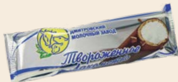
Сырок «Твороженное лакомство» 15% глазированный взбитый 55 г