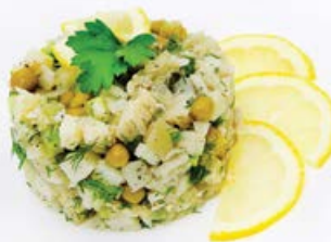
Салат «Рыбный» 100 г