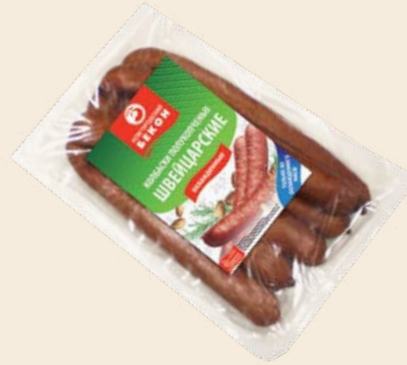
Колбаски «Швейцарские» полукопченые 350 г (ВНМД)