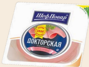
Колбаса «Докторская классическая» вареная в нарезке 270 г (Мясные деликатесы)