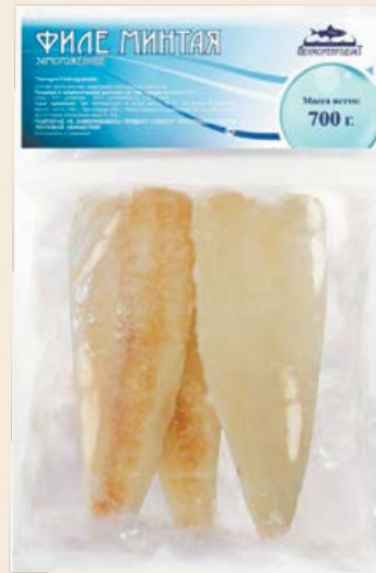
Минтай свежемороженое филе 700 г (Ленморепродукт)