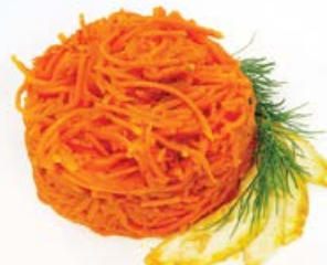
Салат «Морковь по-корейски» 100 г