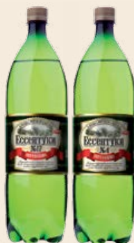
Вода минеральная «Эссентуи №17 ГОСТ Р 54316-2011» «Эссентуи №4 ГОСТ Р 54316-2011» газированная 1.5 л