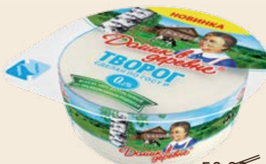
Творог «Домик в деревне» традиционный 0% 170 г