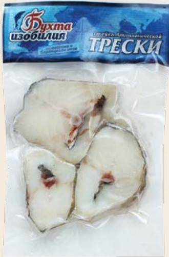
Треска атлантическая свежемороженный стейк 400 г (Бухта Изобилия)