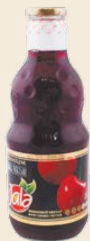
Нектар «Жале» вишневый в стеклянной бутылке 1 л