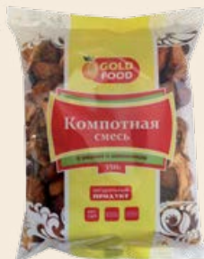
Смесь «Компотная» с шиповником и вишней 385-350 г (GoldFood)