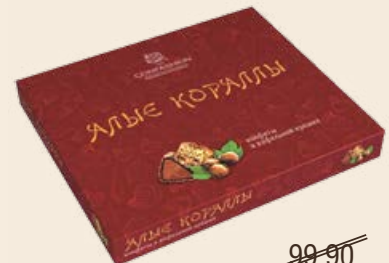
Набор конфет «Алые кораллы» 150 г