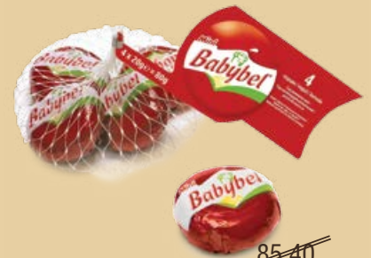
Сыр «Мини Бель» 80 г