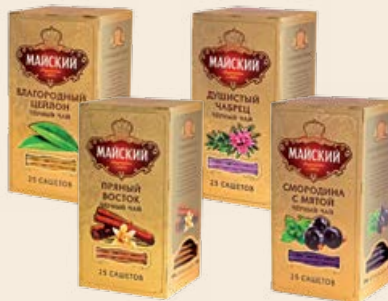
Чай «Майский» чёрный «Пряный Восток» / «Смородина с Мятай» / «Благородный Цейлон» / «Душистый Чабрец» 25 пакетиков с ярлычками