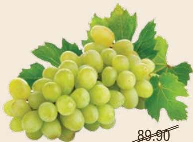
Виноград кишмиш 1 кг