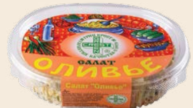
Салат «Оливье» с колбасой 300 г (Великоросс)