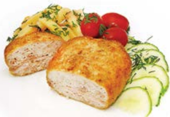
Котлета из птицы 100 г