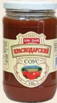
Соус «Краснодарский» 350 г (Unidan)