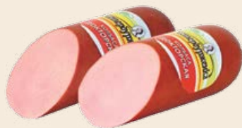
Колбаса «Докторская ГОСТ» вареная 1 кг (Петербурженка)