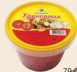
Томатный соус «Хреновина» с хреном 400 г