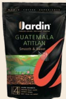
Кофе «Жардин» растворимый «Гватемала Атитлан» в мягкой упаковке 150 г