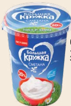
Сметана «Большая кружка» 20% 350 г / 330 г