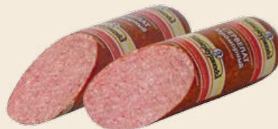
Колбаса «Сервелат Мраморный» варено-копченая порционная 1 кг (Петербурженка)