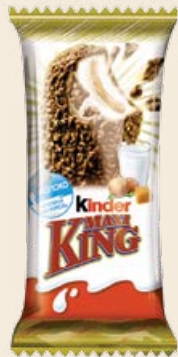
Пирожное «Киндер» Макси Кинг 26% 35 г