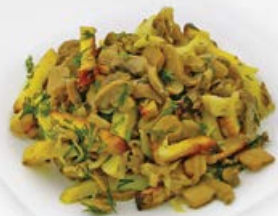
Картофель жареный с грибами 100 г