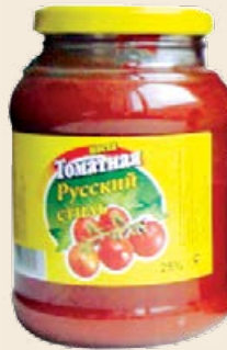
Паста томатная «Русский стиль» 265 г