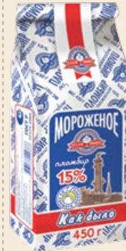
Мороженое «Как было» пломбир 15% в пакете 450 г