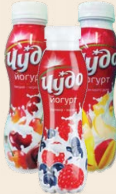
Йогурт «Чудо» питьевой 2.4% в ассортименте 290 г