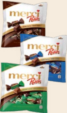
Набор конфет «Мерси Пети» ассорти / темный шоколад / молочный шоколад / шоколад с миндалем 125 г