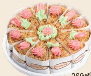
Торт «Ностальжи» 1 кг