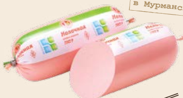
Колбаса «Молочная» вареная, 1 сорт 400 г (Мелифаро)