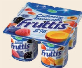
Йогуртный продукт «Фруттис» 5% в ассортименте 115 г