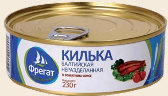
Килька «Фрегат» в томатном соусе с ключком 230 г