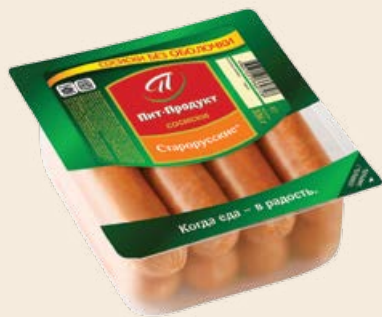
Сосиски «Старорусские» 336 г (Пит-Продукт)