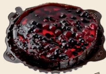
Пирог «Ганноверский Ягодный» 0.7 кг