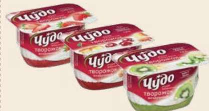
Творожный десерт «Чудо творожок» 4-4.2% в ассортименте 100 г