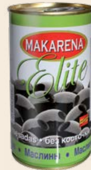
Маслины «MAKARENA ELITE» черные без косточки 370 мл