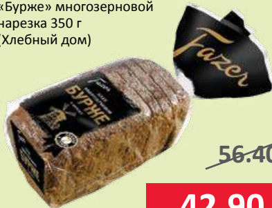
Хлеб «Бурже» многозерновой нарезка 350 г (Хлебный дом)