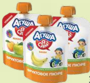
Пюре «Агуша» Я САМ! в ассортименте 90 г