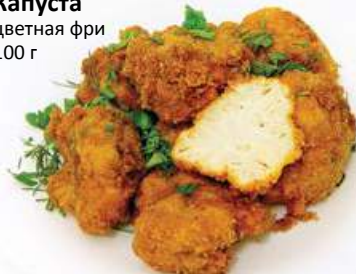
Капуста цветная фри 100 г