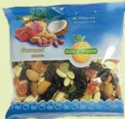
Смесь «Фитнес» 285 г (Gold Food)