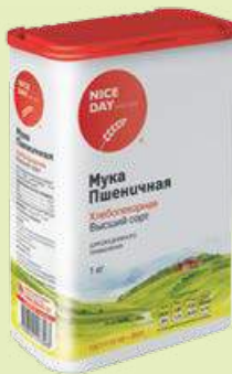
Мука «Nice Day» пшеничная хлебопекарная в/с 1 кг