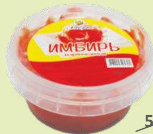
Имбирь маринованный 160 г (Альянс)