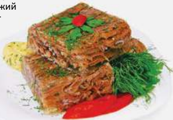
Студень говяжий 100 г