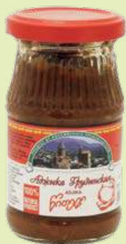
Аджика «Грузинская» 190 г