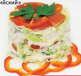
Салат «Ассирийский» 100 г