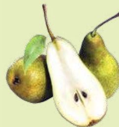
Груша «Конференц» 1 кг