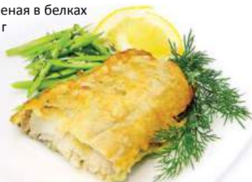
Треска жареная в белках 100 г