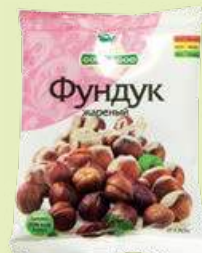
Фундук жареный 130 г (Gold Food)