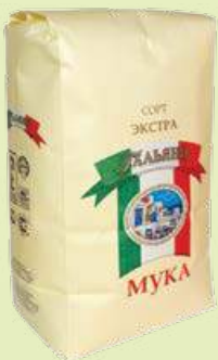
Мука пшеничная хлебопекарная ГОСТ «Гальяни» 2 кг