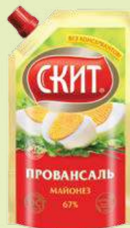
Майонез «СКИТ» провансаль 67% 675 мл