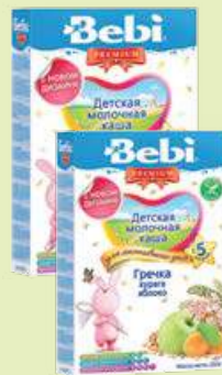
Каша «Беби» Премиум - 7 злаков с черникой и молоком - гречневая с кургагой, яблоком и молоком 200 г