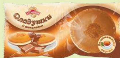
Оладушки с шоколадной начинкой 2 × 50 г