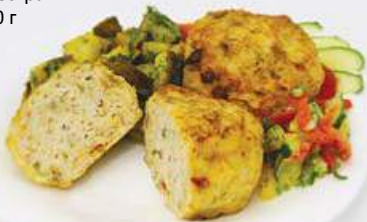
Котлета «Пестрая» 100 г