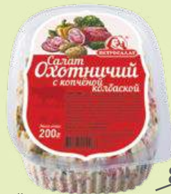
Салат «Охотничий» 200 г (Великоросс)