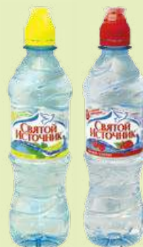
Вода питьевая «Святой Источник» - лимон-мята - малина-клюква 0.5 л