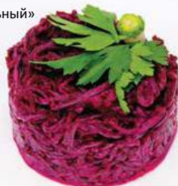
Салат «Свекольный» 100 г