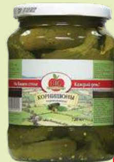
Корнишоны «BIG» 3–6 см 680 г