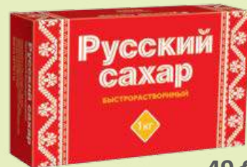
Сахар-рафинад 1 кг