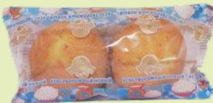
Кекс «Творожный» 2 × 75 г (Аладушкин)