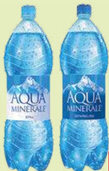
Вода «Аква Минерале» - газированная - негазированная 2 л