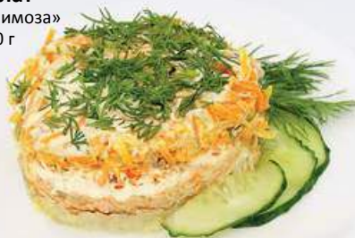
Салат «Мимоза» 100 г