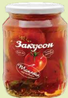
Томаты маринованные «Закусон» 720 мл