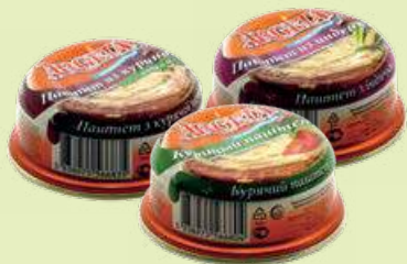
Паштет «Аргета» в ассортименте 95 г (Халал)