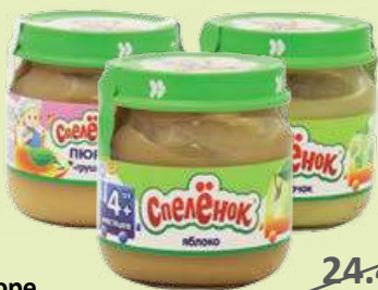
Пюре «Спеленок» кабачок / груша / яблоко 80 г