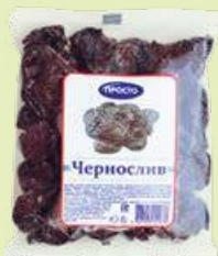
Чернослив «Просто» без косточки 400 г