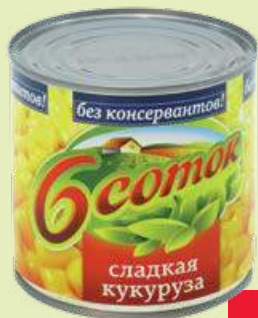
Кукуруза «Шесть соток» 212 мл