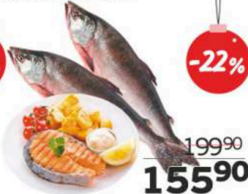
Горбуша с головой, свежемороженая, 1 кг