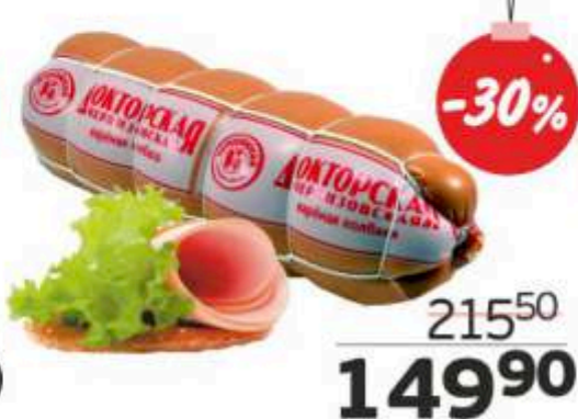
Колбаса вареная «Докторская черкизовская», ЧМПЗ, 1 кг