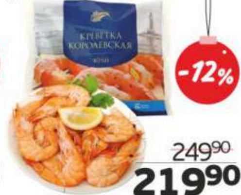
Креветки «Королевские», 450 г