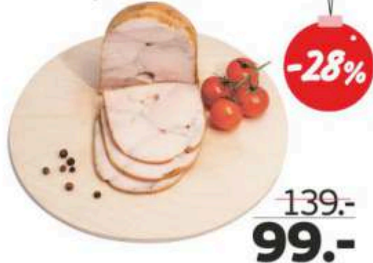
Деликатес куриный «Бужарские деликатесы», копчено-вареный, 400 г