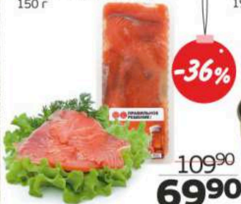
Набор: семга/форель, 150 г