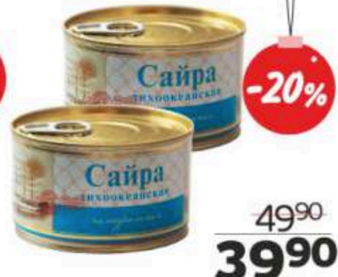
Сайра натуральная, с ключом, 240 г