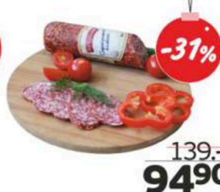
Колбаса сырокопченая «Бородинская», 300 г