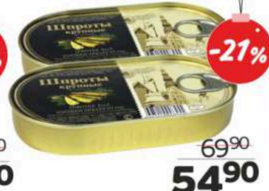
Шпроты крупные в масле, с ключом, 190 г