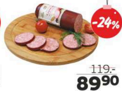
Сервелат «Бужарские деликатесы», ГОСТ, 300 г