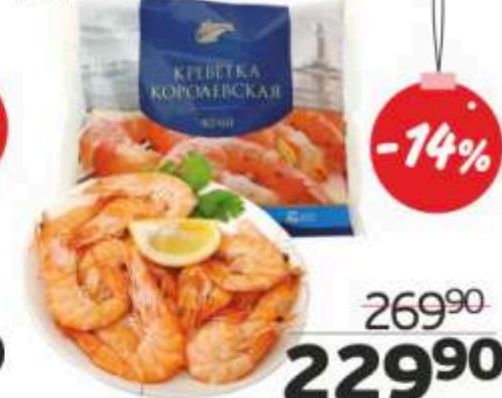
Креветки «Королевские», 450 г