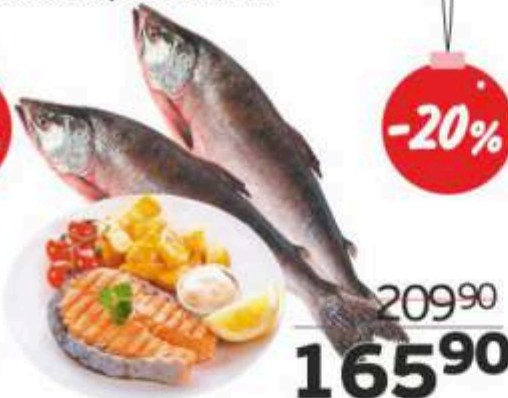
Горбуша с головой, свежемороженая, 1 кг