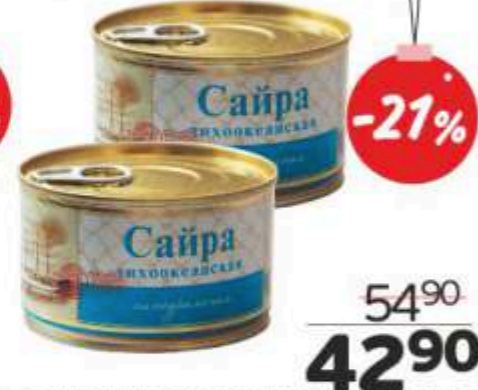
Сайра натуральная, с ключом, 240 г