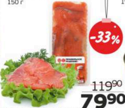
Набор: семга/форель, 150 г