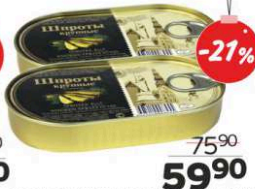
Шпроты крупные в масле, с ключом, 190 г