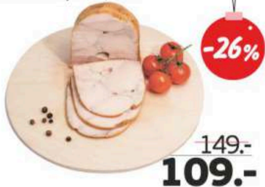
Деликатес куриный «Бужарские деликатесы», копчено-вареный, 400 г