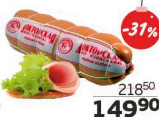
Колбаса вареная «Докторская черкизовская», ЧМПЗ, 1 кг