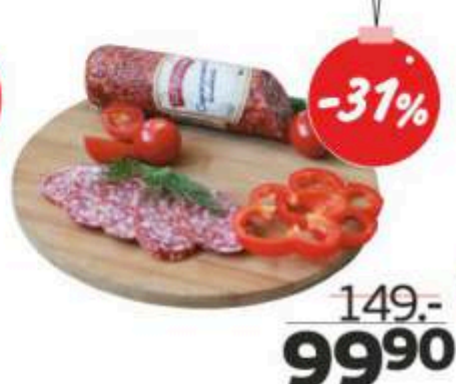
Колбаса сырокопченая «Бородинская», 300 г