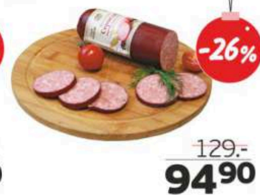
Сервелат «Бужарские деликатесы», ГОСТ, 300 г