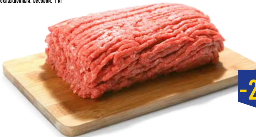
ФАРШ ДОМАШНИЙ ПО-ДЕРЕВЕНСКИ, охлажденный, весовой, 1 кг