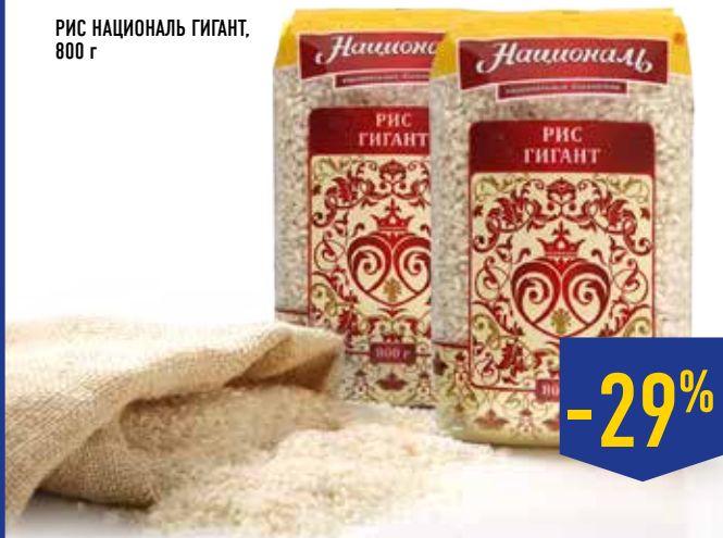
РИС НАЦИОНАЛЬ ГИГАНТ, 800 г