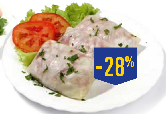
ГОЛУБЦЫ С МЯСОМ И РИСОМ, охлажденные, весовые, 1 кг