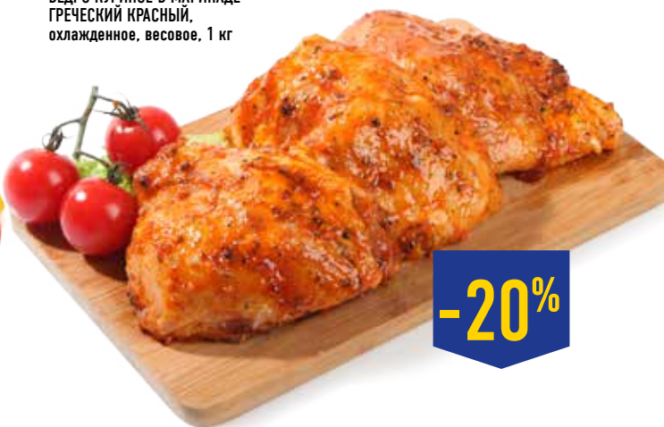
БЕДРО КУРИНОЕ В МАРИНАДЕ ГРЕЧЕСКИЙ КРАСНЫЙ, охлажденное, весовое, 1 кг