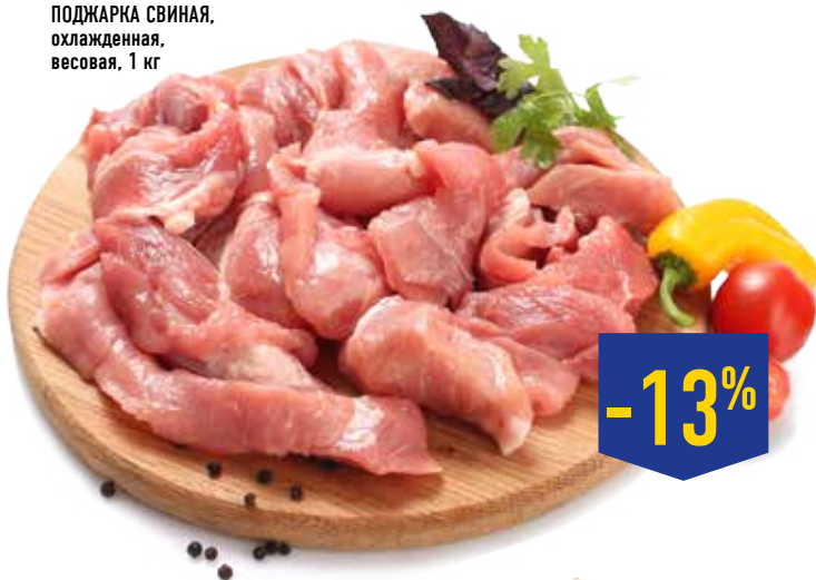
ПОДЖАРКА СВИНАЯ, охлажденная, весовая, 1 кг