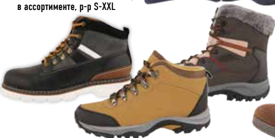
ОБУВЬ МУЖСКАЯ ТРЕКИНГОВАЯ, в ассортименте, р-р S-XXL