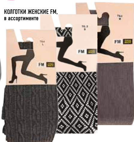
КОЛГОТКИ ЖЕНСКИЕ FM, в ассортименте