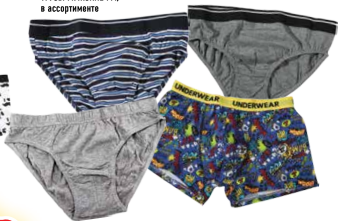
ТРУСЫ МУЖСКИЕ FM, в ассортименте