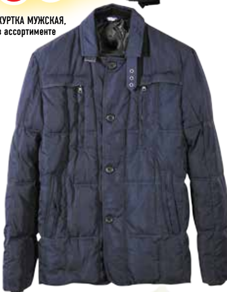
КУРТКА МУЖСКАЯ, в ассортименте