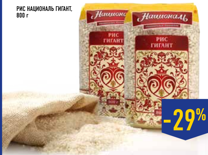
РИС НАЦИОНАЛЬ ГИГАНТ, 800 г