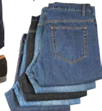
БРЮКИ/ДЖИНСЫ МУЖСКИЕ, в ассортименте