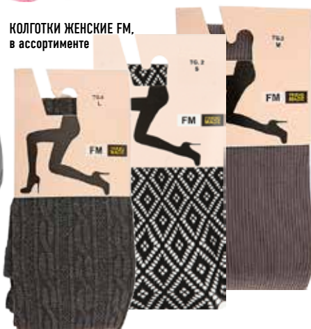
КОЛГОТКИ ЖЕНСКИЕ FM, в ассортименте