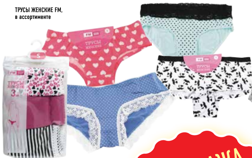
ТРУСЫ ЖЕНСКИЕ FM, в ассортименте