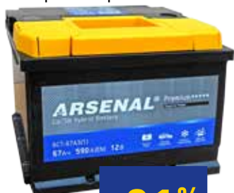
БАТАРЕЯ АККУМУЛЯТОРНАЯ ВАТТ ARSENAL Premium, 67 А/ч, 590 А, в ассортименте: - прямая полярность - обратная полярность