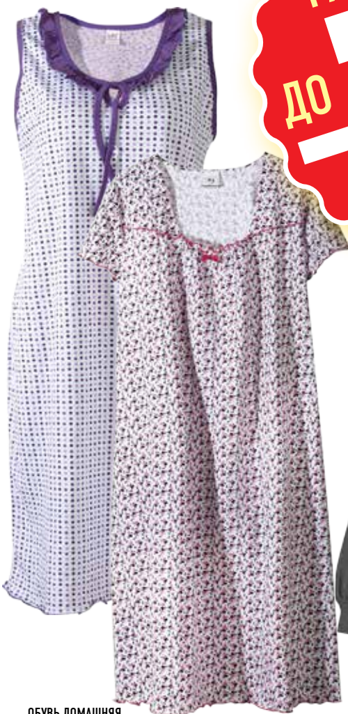
СОРОЧКА ЖЕНСКАЯ, в ассортименте