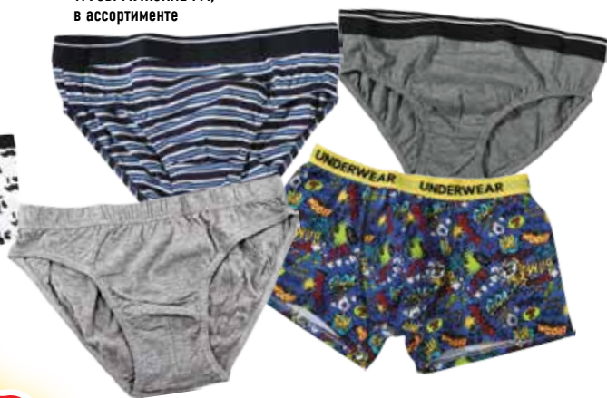
ТРУСЫ МУЖСКИЕ FM, в ассортименте