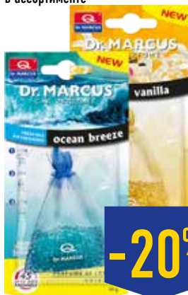
АРОМАТИЗАТОР DR.MARCUS FRESH BAG, в ассортименте