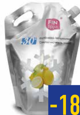
СТЕКЛООЧИСТИТЕЛЬ FIN TIPPA, до -30°C, 2 л