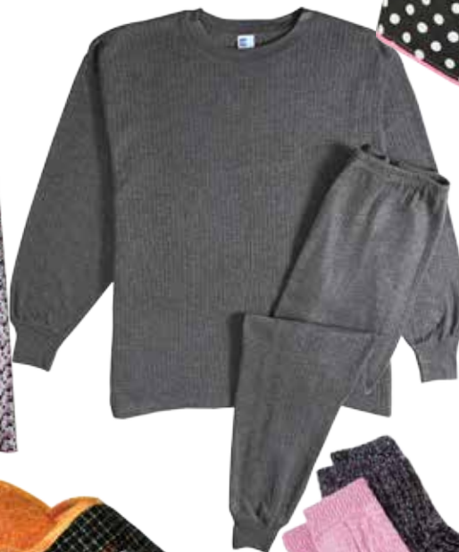
ТЕРМОБЕЛЬ МУЖСКОЕ/ЖЕНСКОЕ, в ассортименте