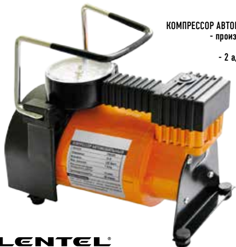
КОМПРЕССОР АВТОМОБИЛЬНЫЙ LENTEL 580 - производительность 35 л/мин - давление 10 Атм - 2 адаптера, игла, манометр - сумка для хранения