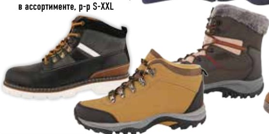
ОБУВЬ МУЖСКАЯ ТРЕКИНГОВАЯ, в ассортименте, р-р S-XXL