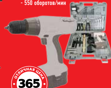
ДРЕЛЬ АККУМУЛЯТОРНАЯ 365 ДНЕЙ SDO06BMC - в кейсе с набором инструментов - емкость батареи 1000 мА - максимальный крутящий момент 9 Н/м - 550 оборотов/мин