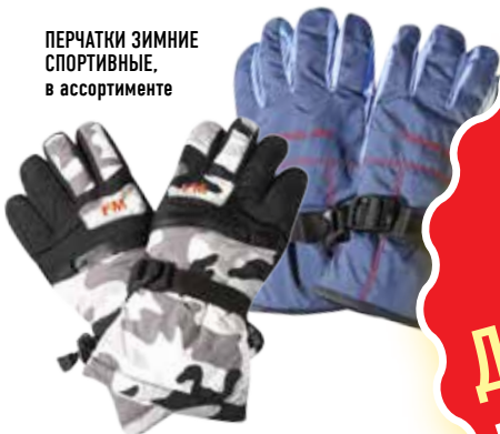
ПЕРЧАТКИ ЗИМНИЕ СПОРТИВНЫЕ, в ассортименте