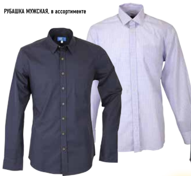
РУБАШКА МУЖСКАЯ, в ассортименте