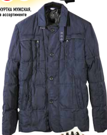
КУРТКА МУЖСКАЯ, в ассортименте