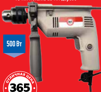
ДРЕЛЬ УДАРНАЯ 365 ДНЕЙ - максимальная скорость 2800 об/мин - максимальный диаметр сверления 13 мм металл, 25 мм дерево