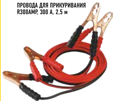
ПРОВОДА ДЛЯ ПРИКУРОВАНИЯ R300AMP, 300 А, 2,5 м