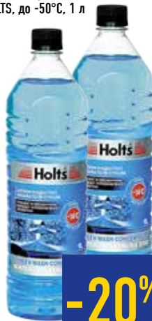
СУПЕРКОНЦЕНТРАТ ОМЫВАТЕЛЯ СТЕКЛА HOLTS, до -50°C, 1 л