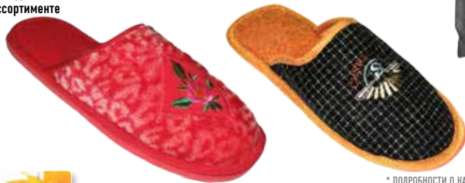
ОБУВЬ ДОМАШНЯЯ, в ассортименте