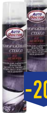
РАЗМОРАЖИВАТЕЛЬ ДЛЯ СТЕКОЛ АУТОДОСТОР, 300 мл