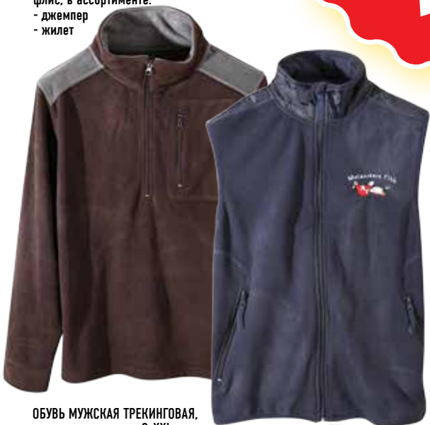
ОДЕЖДА МУЖСКАЯ, флис, в ассортименте: - джемпер - жилет