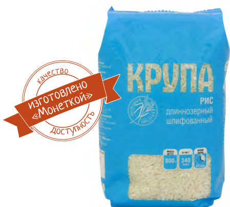
Рис длиннозерный, 800 г