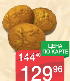
ЩЕРБЕТ АРАХИСОВЫЙ, КАВКАЗСКИЙ, 1КГ