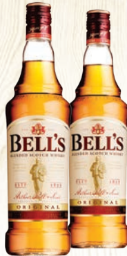
ВИСКИ БЭЛЛС ОРИДЖИНАЛ 40%, 0,7Л, ШОТЛАНДИЯ