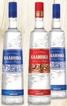
ВОДКА КАЛИНКА ХОЛПОМА, ГЖЕЛЬ 40%, 0,5Л, РОССИЯ