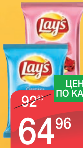
ЧИПСЫ ЛЕЙС НАТУРАЛЬНЫЕ С СОЛЬЮ, СМЕТАНА И ЛУК, КРАБ, СМЕТАНА И ЗЕЛЕНЬ, СЫР, ЗЕЛЕНЬ ЛУК 150Г