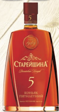
КОНЬЯК СТАРЕЙШИНА 5 ЛЕТ 40%, 0,5Л, РОССИЯ