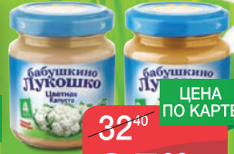
ПЮРЕ МЯСНОЕ ТЕМА 100Г ЖЪБ