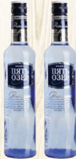
ВОДКА ПЯТЬ ОЗЕР ПРЕМИУМ 40%, 0,5Л, РОССИЯ