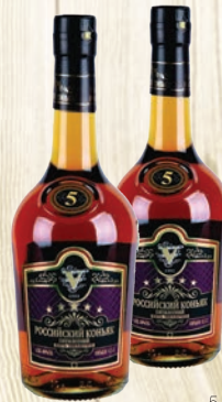
КОНЬЯК РОССИЙСКИЙ ПЯТИЛЕТНИЙ 5 ЗВЕЗДОЧЕК 40%, 0,5Л, РОССИЯ