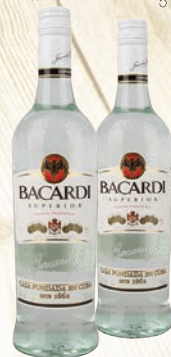
РОМ БАКАРДИ СУПЕРИОР 40%, 0,75Л, МЕКСИКА