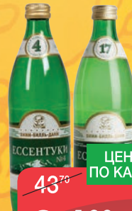
МИНЕРАЛЬНАЯ ВОДА ЭССЕНТУКИ №4, №17 0,54Л С1Б