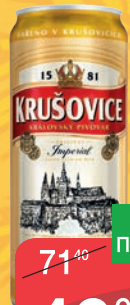
ПИВО КРУШОВИЦЕ СВЕТЛОЕ 4,2%, 0,5Л ЖБ