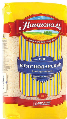
РИС «НАЦИОНАЛЬ», Краснодарский, Ангстрем, 900 г