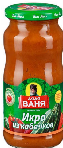
ИКРА ИЗ КАБАЧКОВ «ДЯДЯ ВАНЯ», 420 г