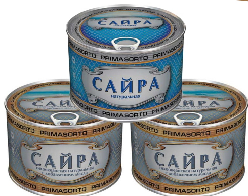
САЙРА НАТУРАЛЬНАЯ Примасорто, 250 г