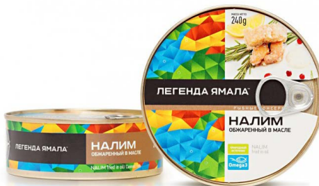
НАЛИМ ОБЖАРЕННЫЙ В МАСЛЕ, Легенда Ямала, 240 г