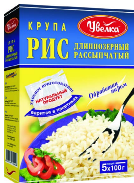
РИС ШЛИФОВАННЫЙ В ПАКЕТИКАХ, обработан паром 5 по 100 г, Увелка, 500 г