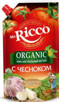
КЕТЧУП «МР. РИККО» с чесноком, 350 г