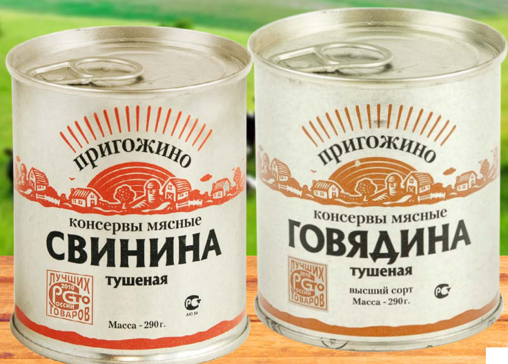
ГОВЯДИНА / СВИНИНА ТУШЕНАЯ «ПРИГОЖИНО», Курганский МК, 290 г