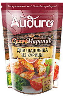
СУХОЙ МАРИНАД ДЛЯ ШАШЛИКА / для шашлыка из курицы «АЙДИГО», 150 г