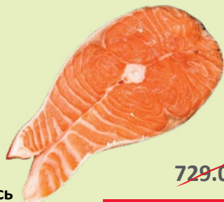
Лосось стейк охлажденный 1 кг