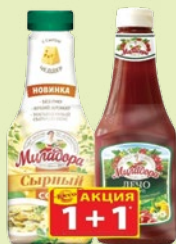
Набор «Миладора» соус «Сырный» 310 г + кетчуп «Лечо» 330 г