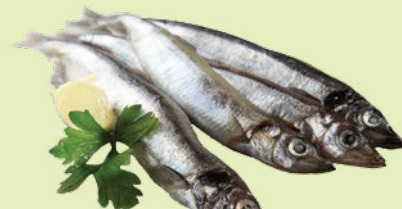
Мойва свежемороженая 1 кг