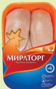
Куриное филе охлажденное 750 г (Мираторг)