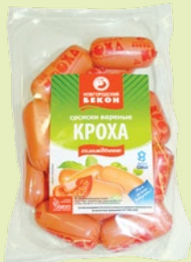
Сосиски «Кроха» 330 г (ВНМД)