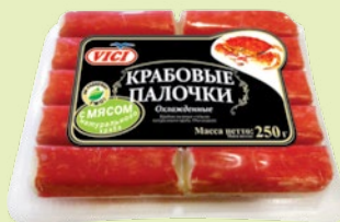
Крабовые палочки охлажденные с мясом краба 250 г (VICI)