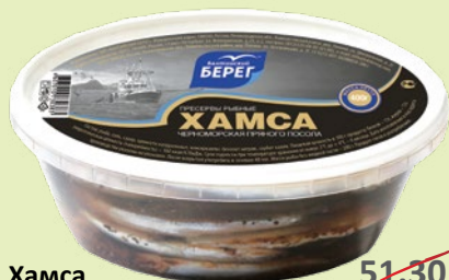
Хамса черноморская 400 г (Балтийский берег)