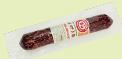
Колбаса сырокопченая «Деликатесная по-Черкизовски» 300 г (ЧМПЗ)