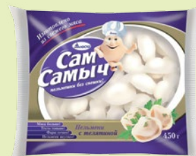
Пельмени «Сам-Самыч» с телятиной 450 г