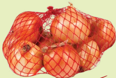
Лук репчатый фасованный 1 кг