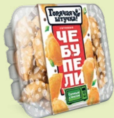
Чебупели сочные с мясом 300 г (Поком)