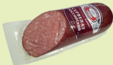
Колбаса варено-копченая «Сервелат Российский» 300 г (Тавр)