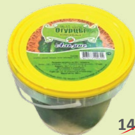
Огурцы малосольные 600 г