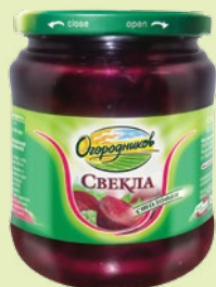
Свекла столовая «Огородников» нарезанная маринованная 450 мл в стеклянной банке