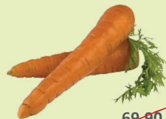
Морковь 1 кг