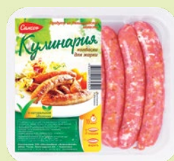
Колбаски для жарки охлажденные 400 г (Самсон)