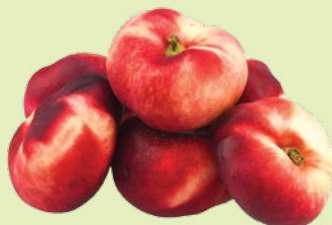
Нектарин инжирный 1 кг