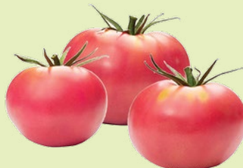
Томаты розовые 1 кг