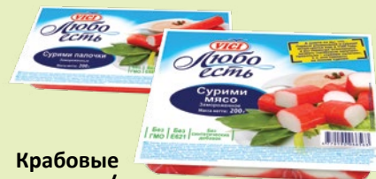
Крабовые палочки / Крабовое мясо «Любо есть» замороженные 200 г (VICI)