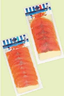
Семга / Форель холодного копчения ломтики 150 г (А Море)