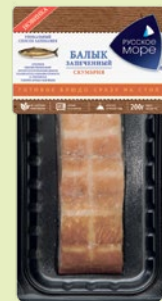
Скумбрия копчено-запеченная «Балык мраморный» 200 г (Русское море)