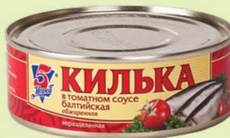
Килька в томатном соусе 240 г (5 морей)