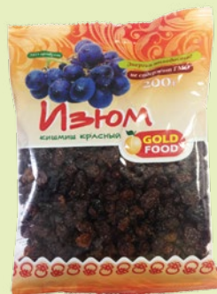
Изюм «GOLD FOOD» кишмиш красный 200 г