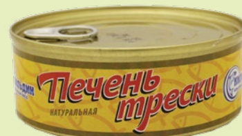
Печень трески натуральная 230 г