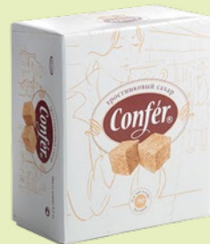
Сахар «Конфер» тростниковый 500 г