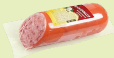
Колбаса полукопченая «Чесночная» 420 г (ОМПК)