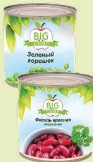
Фасоль «Биг» красная 400 г