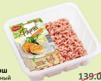
Фарш куриный охлажденный 400 г (Самсон)