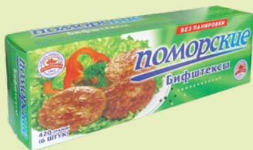
Бифштексы «Поморские» 420 г (ТПКК)