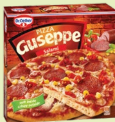
Пицца «Джузеппе» с салиами 380 г