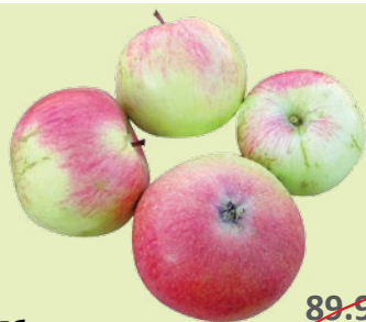
Яблоки «Садовые» 1 кг