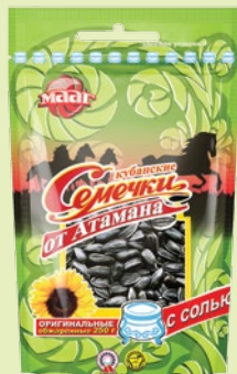
Семечки «Кубанские от Атамана» Оригинальные черные жареные соленые 250 г