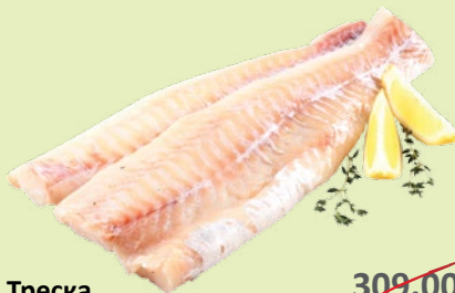
Треска филе без шкуры охлажденное 1 кг