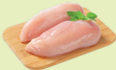
Индейка филе грудки охлажденное 1 кг