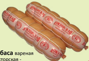
Колбаса вареная «Докторская - Черкизовская» в сетке 1 кг (Черкизовский)