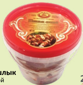
Шашлык свиной охлажденный 1 кг (Гатчинский МК)