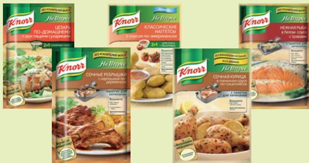
Кнорр «На Второе» в ассортименте 23-42 г