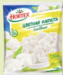
Цветная капуста замороженная «Hortex» 400 г