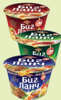
Лапша «Биг ланч» с тушёной курицей и луком / с ароматной говядиной / в соусе с бараниной 90 г