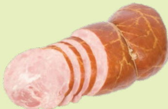
Ветчина «Московская» 1 сорт 1 кг (ВЛМК)