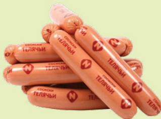
Сосиски «Телячи» 1 кг (ОМПК)