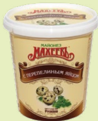
Майонез «Махеев» на перепелином яйце 50.5% 800 г