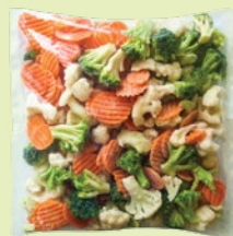
Овощная смесь замороженная цветная капуста с брокколи 800 г