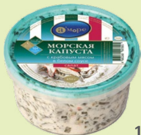
Морская капуста с крабовым мясом 450 г (А Море)