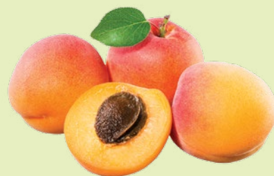
Абрикосы отборные 1 кг