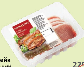
Стейк сочный охлажденный 500 г (Мираторг)