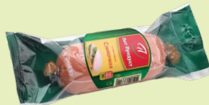
Колбаса вареная «Сливочная» 500 г (Пит-Продукт)