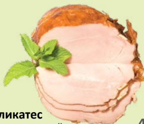
Деликатес варено-копченый «Шинка Тверецкая» 1 кг (ВЛМК)