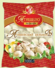
Пельмени «Атышевский пельмень» 1 кг