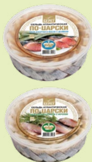
Сельдь филе в маринаде «По-Царски» с дымком / с укропом 500 г (Балтийский берег)