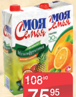
СОКИ И НЕКТАРЫ ФРУКТОВЫЙ САД 0,95Л