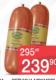
КОЛБАСА МОЛОЧНАЯ ПРАЙМ ХУТОРОК, 1КГ