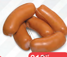
СОСИКИ АППЕТИТНЫЕ РОССИЯНКА, 1КГ