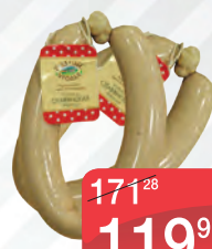
САРДЕЛЬКИ ТЕЛЯЧЬИ В НАТУРАЛЬНОЙ ОБОЛОЧКЕ ЧЕРКИЗОВСКИЙ МК, 1КГ