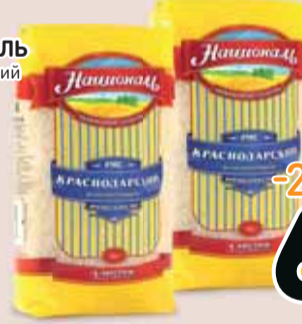
Рис НАЦИОНАЛЬ краснодарский круглый 900 г