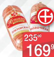
КОЛБАСА ДОКТОРСКАЯ СТАРОДВОРСКАЯ СТАРОДВОРСКИЕ КОЛБАСЫ, 500Г