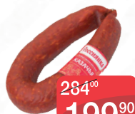
СЕРВЕЛАТ КЛАССИК СЫРОКОПЧЕНый ЧЕРНЫШМИНСКИЙ МК, 1КГ