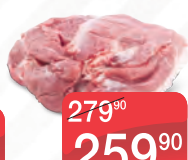
ОКОРОЧКА КУРИНЫЕ ОХЛАЖДЕННЫЕ, 1КГ