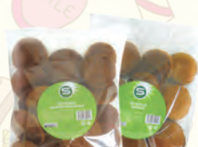
КЕКС SPAR С ИЗОМОМ, ТВОРОЖНЫЙ, 300Г