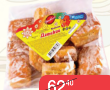
ВАФЛИ SMART ОРЕХОВЫЕ, НЕЖНЫЕ, ШОКОЛАДНЫЕ, 220Г