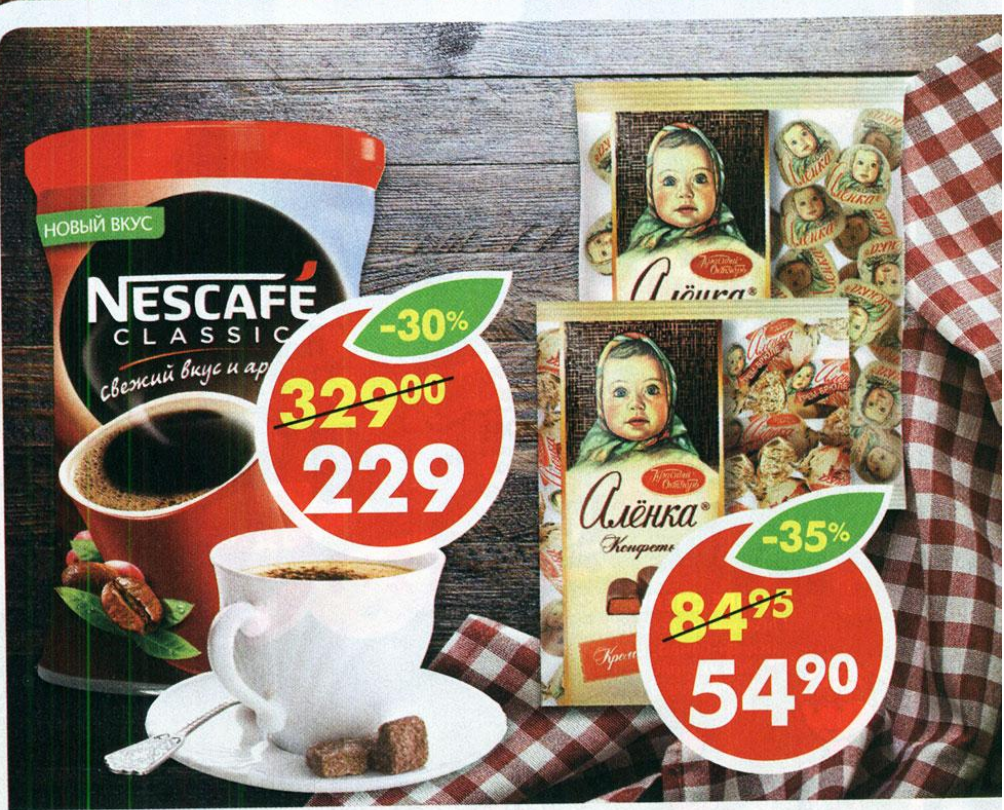
КОНФЕТЫ АЛЕНКА, крем-брюле купол; 250 г КОФЕ НЕСКАФЕ КЛАССИК, 250 г