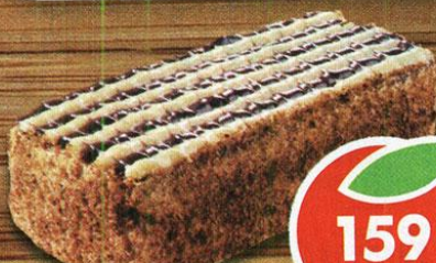
ТОРТ МЕДОВИК, с заварным кремом, Фантель, 350 г