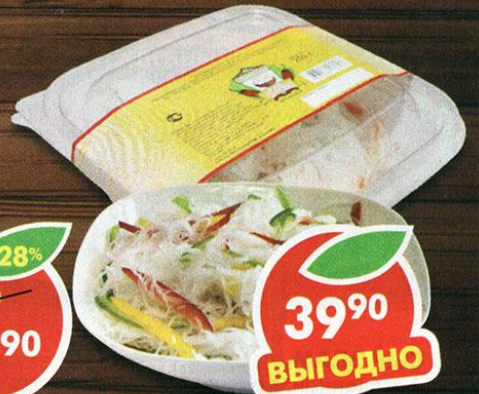
САЛАТ ФУНЧЕЗА, Кореяна, 200 г