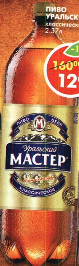
ПИВО УРАЛЬСКИЙ МАСТЕР, классическое, светлое 4,7%, 2,37 л