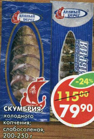
СКУМБРИЯ, холодного копчения, слабосоленая, 200-250 г