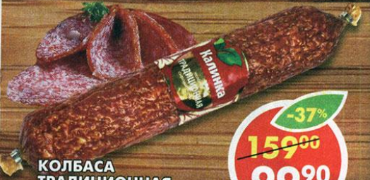
КОЛБАСА ТРАДИЦИОННАЯ, сырокопченая, Калинка, 200 г