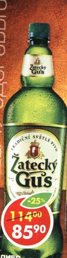
ПИВО ЖАТЕЦКИЙ ГУСЬ, светлое, 4,6%, 1,42 л

УМЕРЕННОЕ УПОТРЕБЛЕНИЕ АЛКОГОЛЯ ВРЕДИТ ВАШЕМУ ЗДОРОВЬЮ