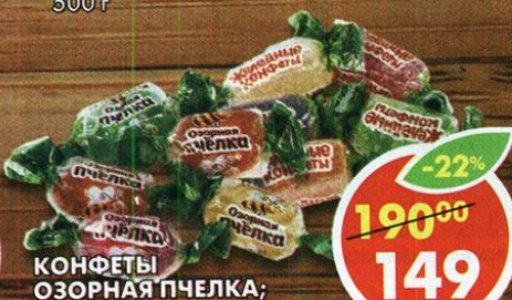
КОНФЕТЫ ОЗОРНАЯ ПЧЕЛКА; ПЧЕЛКА, желейные, неглазированные, 1 кг