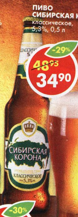
ПИВО СИБИРСКАЯ КОРОНА, классическое, 5,3%, 0,5 л