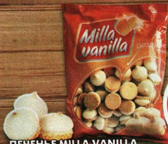
ПЕЧЕНЬЕ MILLA VANILLA, воздушное, 200 г