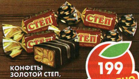
КОНФЕТЫ ЗОЛОТОЙ СТЕП, с арахисом и карамелью, Славянка, 1 кг