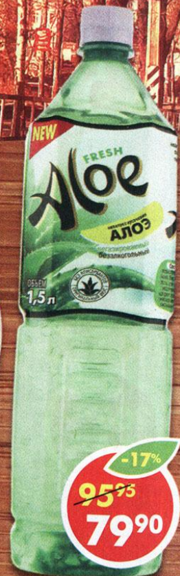
НАПИТОК FRESH ALOE, с кусочками алоэ, негазированный, 1,5 л