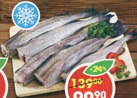
МИНТАЙ, 1 кг