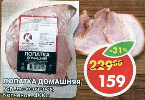
ЛОПАТКА ДОМАШНЯЯ, варено-копченая, Копченое, 400 г