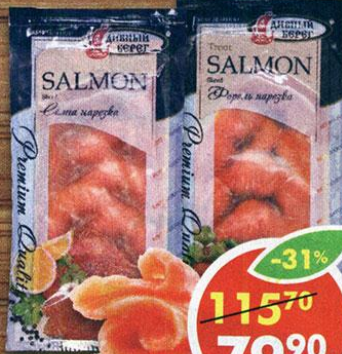
СЕМГА, ФОРЕЛЬ, слабосоленая, Дивный берег, 100 г