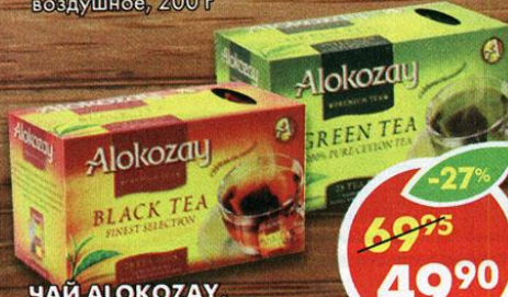
ЧАЙ АЛОКОЗАУ, Finest Selection, черный; 100% Pure Ceylon, зеленый, 25x2 г