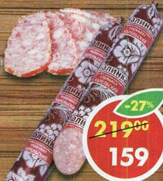
СЕРВЕЛАТ КАРЕЛЬСКИЙ, варено-копченый, Калинка, 350 г