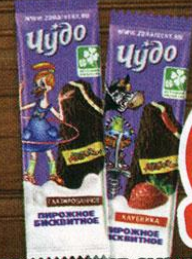
ОХЛАЖДЕННЫЕ СНЭКИ, Чудо-детки, бисквитные, с молочным кремом; клубника, 25%, 28 г