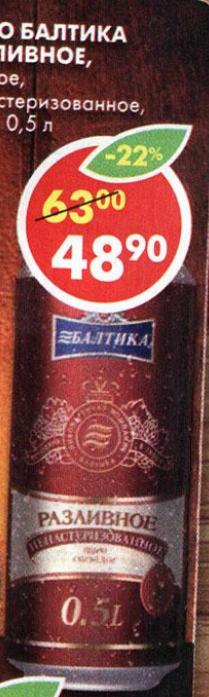
ПИВО БАЛТИКА РАЗЛИВНОЕ, светлое, не пастеризованное, 5,3%, 0,5 л