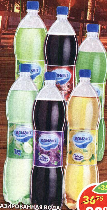
ГАЗИРОВАННАЯ ВОДА, с ароматом фейхоа; изабелла; киви-лайм; кола; лайм; лимонад, Ариант, 1,5 л