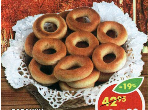
БАРАНКИ, с ирисо-сливочным ароматом; с ароматом топленого молока, Народный хлеб, 500 г