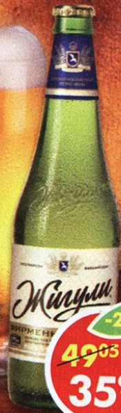
ПИВО ЖИГУЛИ БАРНОЕ, светлое, 5%, 0,5 л