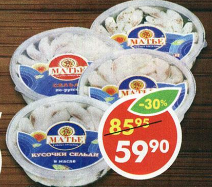
ФИЛЕ СЕЛЬДИ МАТЬЕ, в масле, душистые травы, с ароматом копчения, по-русски, Moris, 170 г