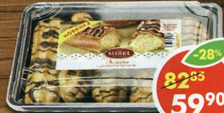
ЭКЛЕРЫ, с заварным кремом, Мирэль, 160 г