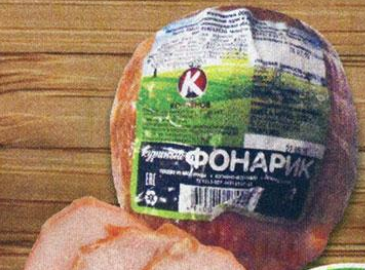
ФОНАРИК КУРИНЫЙ, копчено-вареный, Копченое, 370 г