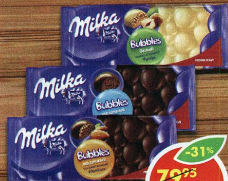
ШОКОЛАД МІЛКА, пористый, молочный; молочный, с миндалем; белый, с фундуком, 80-83 г