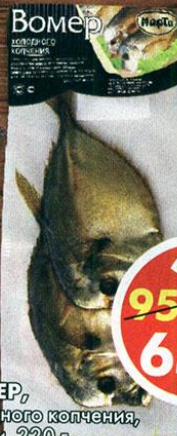
ВОМЕР, холодного копчения, Марти, 220 г