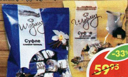
СУФЛЕ ШАРЛИЗ, топленое молоко, сливки-ваниль, 200 г