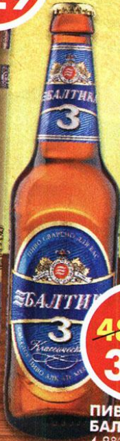
ПИВО БАЛТИКА №3, 4,8%, 0,5 л