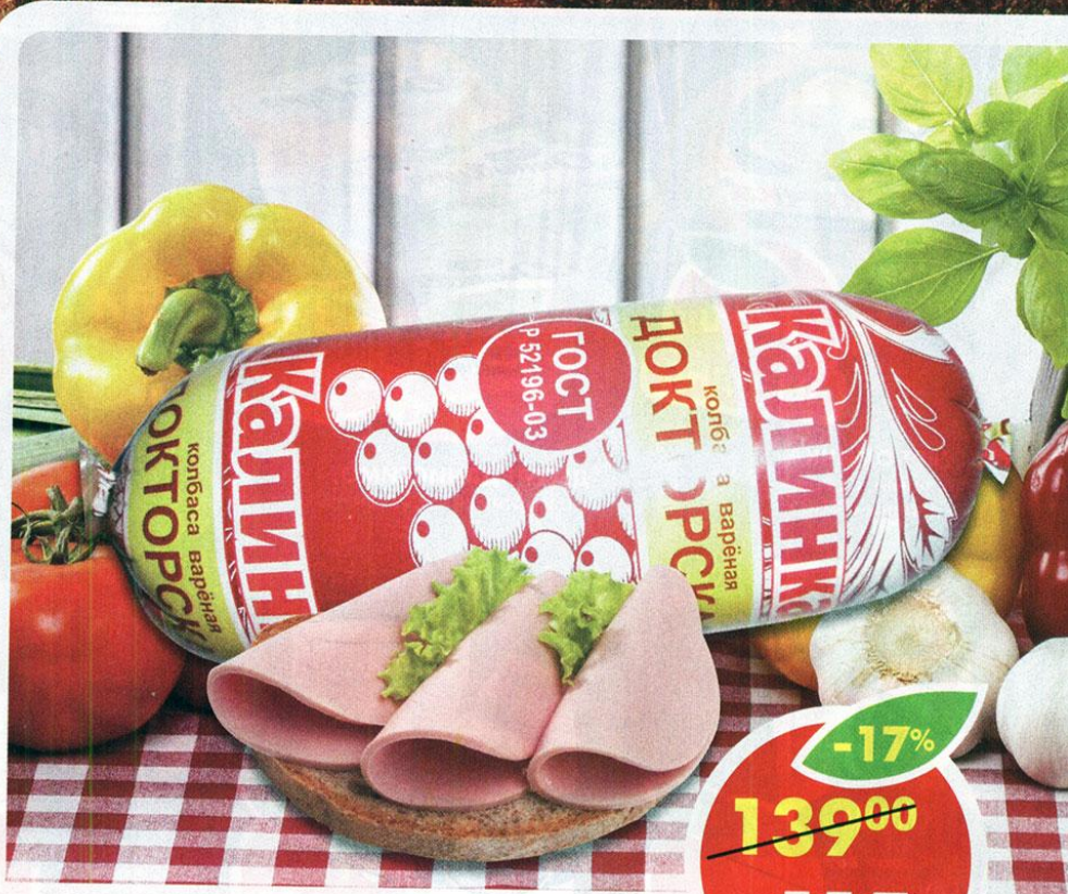
КОЛБАСА ДОКТОРСКАЯ, Калинка, 400 г