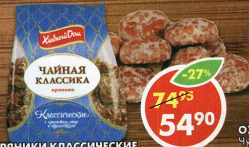
ПРЯНИКИ КЛАССИЧЕСКИЕ, 500 г