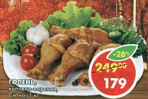
ГОЛЕНЬ, копчено-вареная, Ситно, 1 кг