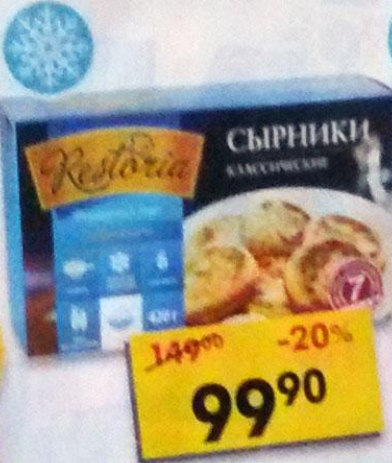
СЫРНИКИ, классические, Restoria, 420 г