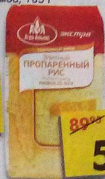
РИС АГРО-АЛЬЯНС ЭКСТРА, 900 г