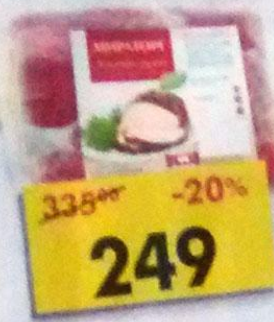
ЛОПАТКА, свинная, Мираторг, 1 кг