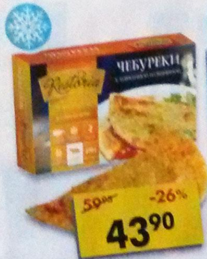
ЧЕБУРЕК, говядина-свинина, Restoria, 270 г