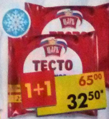
ТЕСТО ЦАРЬ, слоеное, бездрожжевое, пласт, 500 г