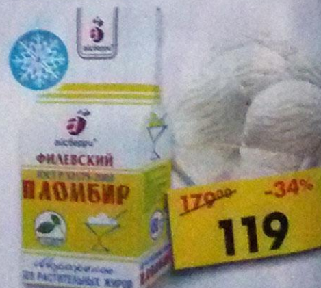
МОРОЖЕНОЕ АЙС-ФИЛИ, пломбир, Айсберри, 12%, 450 г