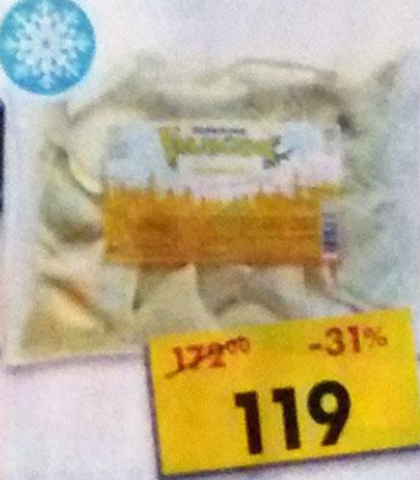
ПЕЛЬМЕНИ УРАЛЬСКИЕ, курные, 800 г