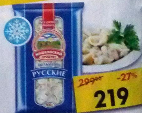
ПЕЛЬМЕНИ РУССКИЕ, Мишкины продукты, 900 г