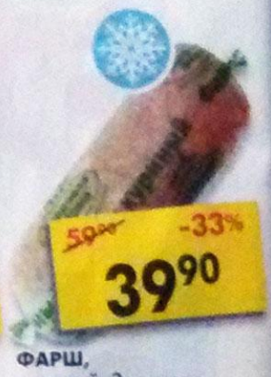
ФАРШ, куриный, Здоровая ферма, 500 г