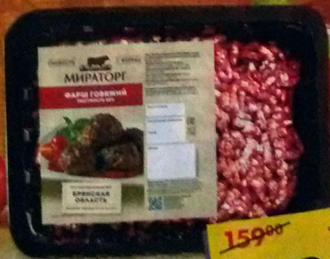
ФАРШ, говяжий, Мираторг, 400 г