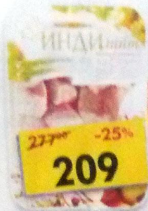
АЗУ ИЗ ИНДЕЙКИ, охлажденное, Индилайт, 700 г