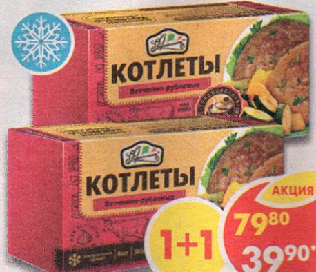
КОТЛЕТЫ, ветчинно-рубленые, Фаршеллони, 360 г