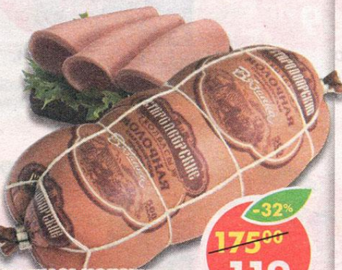
КОЛБАСА МОЛОЧНАЯ СТАРОВДОРСКАЯ, вареная, Стародворские колбасы, 500 г