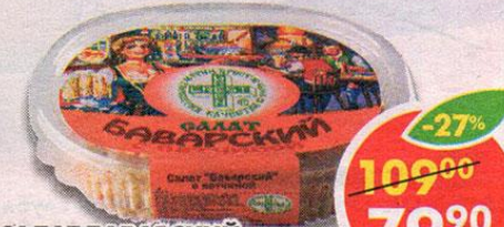
САЛАТ БАВАРСКИЙ, с ветчиной, Грин Крест, 300 г