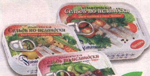
СЕЛЬДЬ ПО-ИСЛАНДСКИ, атлантическая, филе-кусочки, в соусе Викинг; в пряной заливке; в ликерно- вишневой заливке черри, Раптика, 115 г