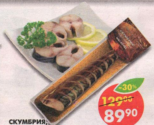
СКУМБРИЯ, атлантическая, сабля, кусочки, холодного копчения, 250 г