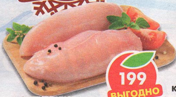
ФИЛЕ КУРИНОЕ, охлажденное, 1 кг