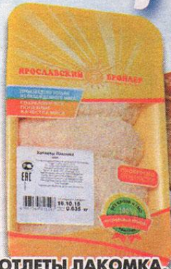
КОТЛЕТЫ ЛАКОТКА, охлажденные, рубленые, Ярославский бройлер, 635 г