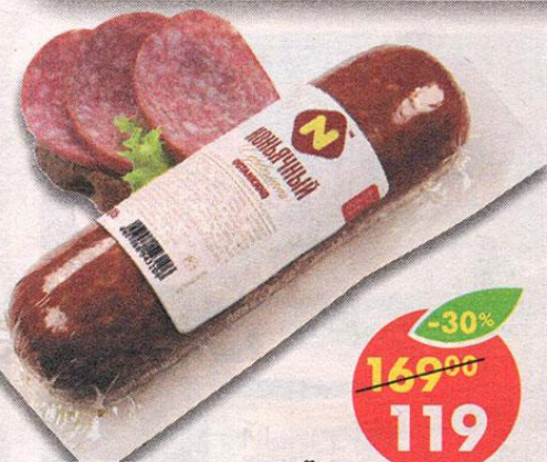
СЕРВЕЛАТ КОНЬЯЧНЫЙ, варено-копченый, Останкино, 300 г