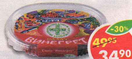
САЛАТ ВИНЕГРЕТ, овощной, Грин Крест, 150 г