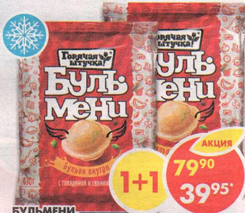
БУЛЬМЕНИ, с говядиной и свиной, Горячая штучка, 430 г