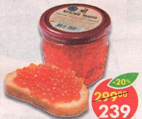
ИКРА КРАСНОЕ ЗОЛОТО, лососевая, 100 г