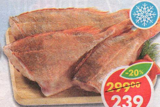
ОКУНЬ, морской, тушка, мороженный, 1 кг