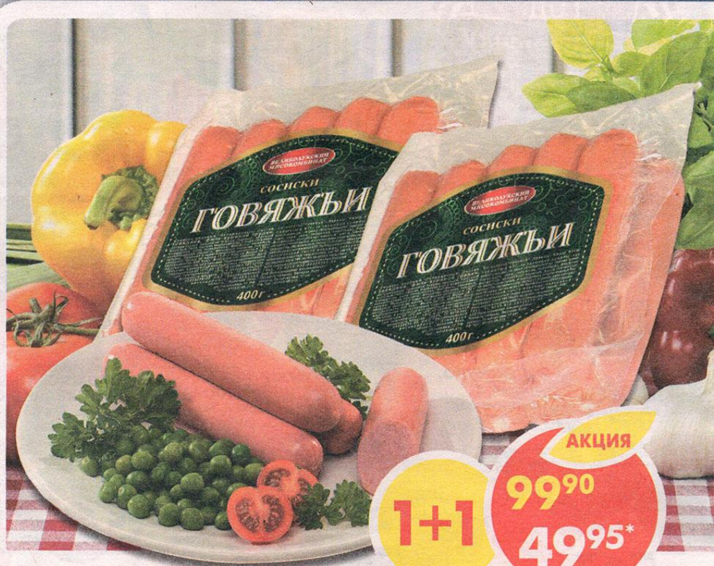
СОСИСКИ, говяжьи, Великолукский МК, 400 г