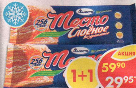
ТЕСТО БЕЗ ХЛОПОТ, слоеное, бездрожжевое, Талосто, 500 г