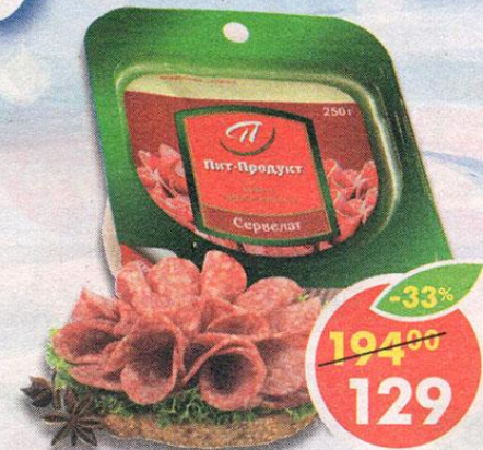
СЕРВЕЛАТ, варено-копченый, Пит-Продукт, 250 г