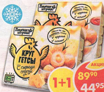
КРУГГЕТСЫ, из мяса птицы, сочные, с сырым соусом, Горячая штучка, 225 г