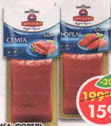
СЕМГА; ФОРЕЛЬ, слабосоленая, Санта Бремор, 170 г