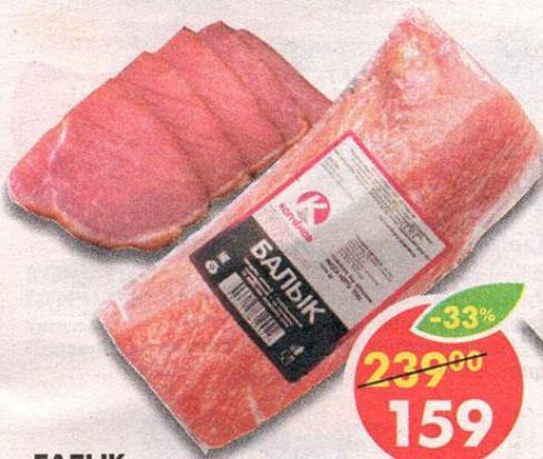
БАЛЫК, сырокопченый, Копченое, 250 г

*Цена указана за 1 уп. при покупке 2 уп. одновременно