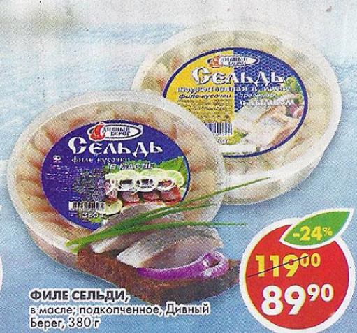
ФИЛЕ СЕЛЬДИ, в масле; подкопченное, Дивный Берег, 380 г