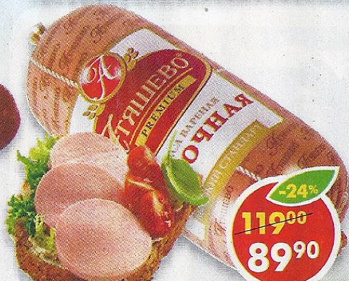
КОЛБАСА МОЛОЧНАЯ, вареная, высший сорт, Атяшево, 500 г