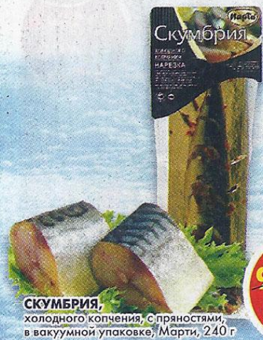
СКУМБРИЯ, холодного копчения, с пряностями, в вакуумной упаковке, Марти, 240 г