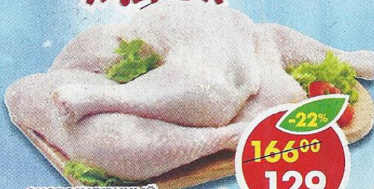
ОКОРОК КУРИНЫЙ, охлажденный, 1 кг