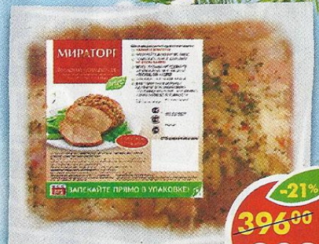
ЛОПАТКА ДОМАШНЯЯ, свинья, охлажденная, Мираторг, 1 кг