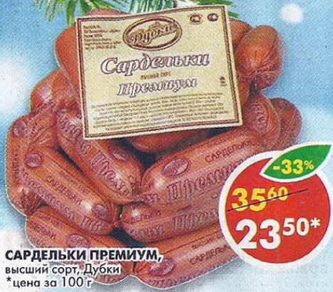
САРЕДЬКИ ПРЕМИУМ, высший сорт, Дубки *цена за 100г