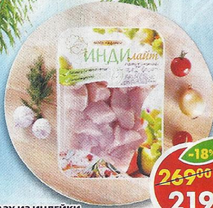
АЗУ ИЗ ИНДЕЙКИ, охлажденное, Индилейт, 700 г