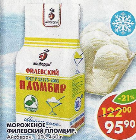
МОРОЖЕНОЕ экс-люкс ФИЛВСКИЙ ПЛОМБИР, Айсберри, 12%, 450 г