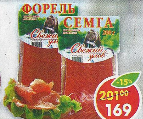
СЕМГА; ФОРЕЛЬ, слабосоленая, в вакуумной упаковке, Свежий Улов, 200 г