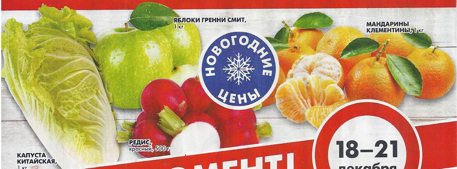
ЯБЛОКИ ГРЕННИ СМИТ, 1 кг