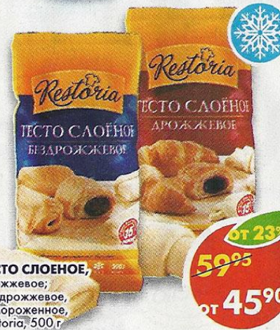
ТЕСТО СЛОЕНОЕ, дрожжевое; бездрожжевое, замороженное, Restoria, 500 г