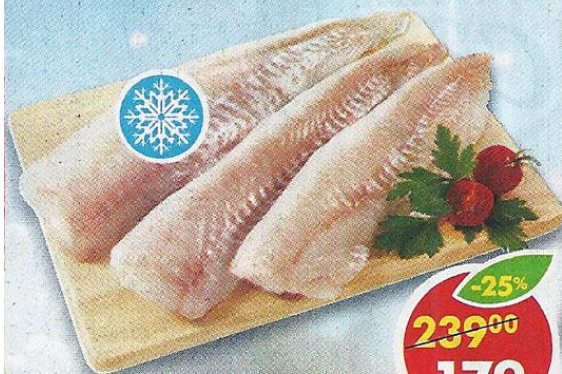
ТРЕСКА, филе, в вакуумной упаковке, замороженная, 500 г