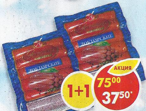
СОСИСКИ ДОКТОРСКИЕ, в вакуумной упаковке, Атяшево, 300 г