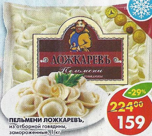
ПЕЛЬМЕНИ ЛОЖКАРЕВЪ, из отборной говядины, замороженные, 1 кг