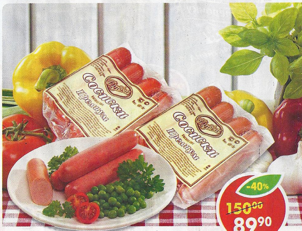
СОСИСКИ ПРЕМИУМ, высший сорт, в вакуумной упаковке, Дубки, 400 г

*Цена указана за 1 шт. при покупке 2 шт. одновременно.