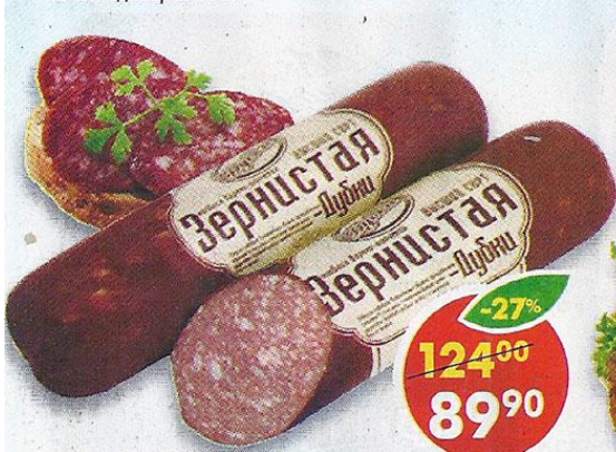
КОЛБАСА ЗЕРНИСТАЯ, варено-копченая, высший сорт, в вакуумной упаковке, Дубки, 300 г