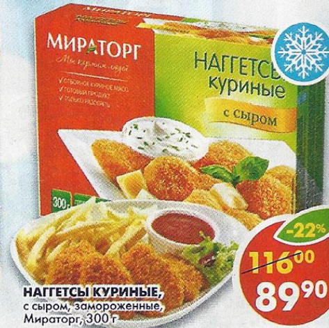
НАГЕТСЫ КУРИНЫЕ, с сыром, замороженные, Мираторг, 300 г