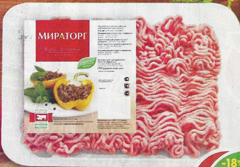
ФАРШ ДОМАШНИЙ, свинина и говядина, охлажденный, Мираторг, 500 г