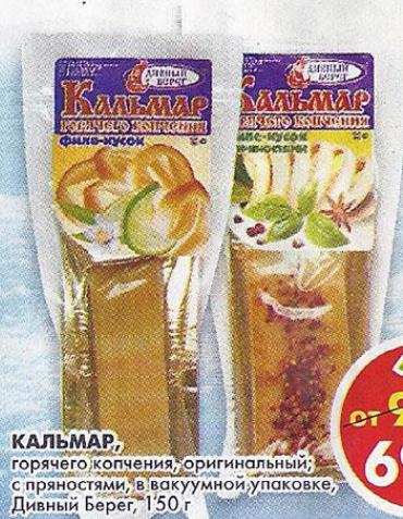
КАЛЬМАР, горячего копчения, оригинальный, с пряностями, в вакуумной упаковке, Дивный Берег, 150 г