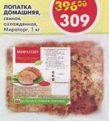
ЛОПАТКА ДОМАШНЯЯ, свиная, охлажденная, Мираторг, 1 кг