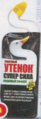
4 Для очищения унитаза

ТУАЛЕТНЫЙ УТЕНОК Супер сила Видимый Эффект, 750 мл