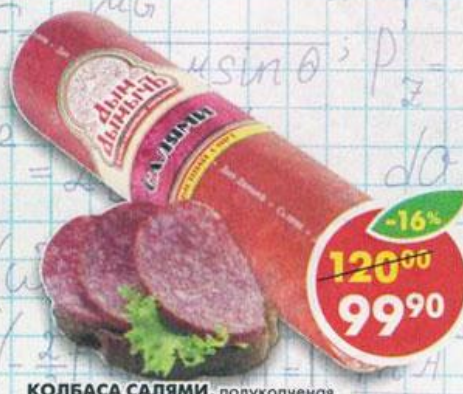
КОЛБАСА САЛЯМИ , полукопченая, высший сорт, в вакуумной упаковке, Дым Дымыч, 350 г