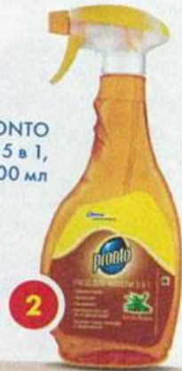
2 PRONTO Уход для мебели 5 в 1, 500 мл