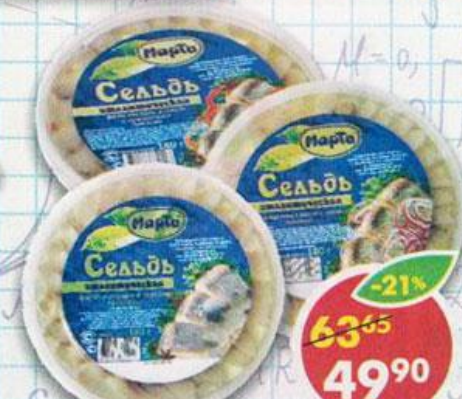
СЕЛЬДЬ , филе, в масле; с луком; с пряностями, Марти, 180 г