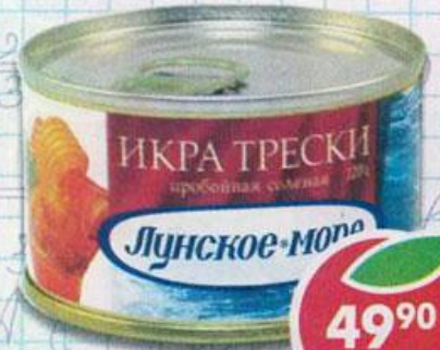
ИКРА ТРЕСКИ , соленая, Лунское Море, 120 г