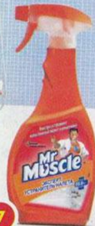
7 Mr Muscle