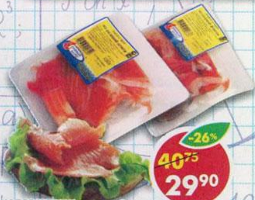
НАБОР К ПИВУ , из соленой семги; из соленой форели, Дикий Берег, 100 г