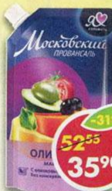
МАЙОНЕЗ ПРОВАНСАЛЬ, оливковый, 67%, 390 г