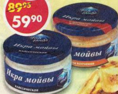
ИКРА МОЙВЫ, классическая, с копченым лососем, Fish House, 180 г