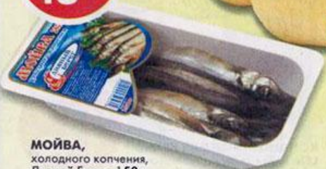
МОЙВА, холодного копчения, Дивный Берег, 150 г