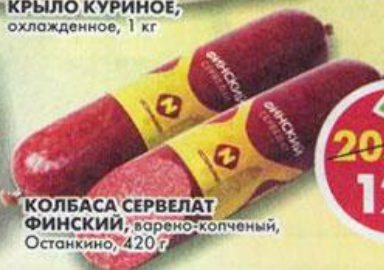
КОЛБАСА СЕРВЕЛАТ ФИНСКИЙ, варено-копченый, Останкино, 420 г