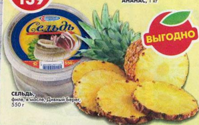
АНАНАС, 1 кг