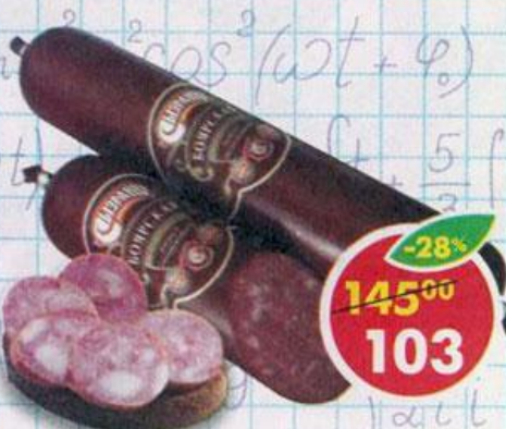
КОЛБАСА БОЯРСКАЯ , полукопченая, в вакуумной упаковке, Сызрань, 400 г