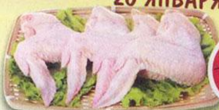
КРЫЛО КУРИНОЕ, охлажденное, 1 кг