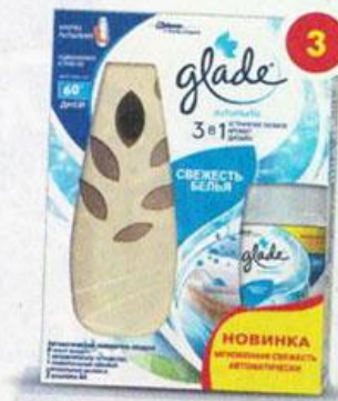
3 Освежитель воздуха GLADE автоматик СВЕЖЕСТЬ БЕЛЬЯ, 269 мл