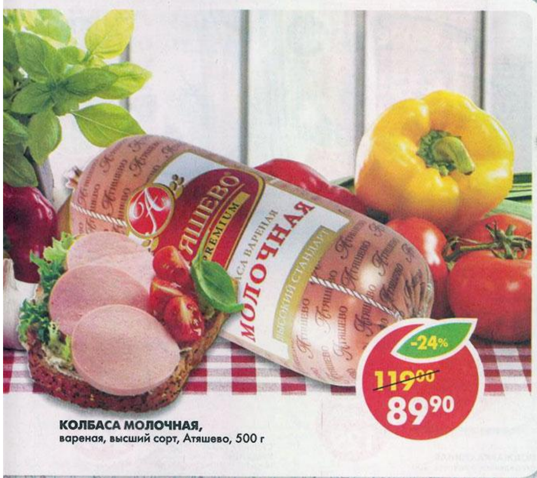
КОЛБАСА МОЛОЧНАЯ , вареная, высший сорт, Атышево, 500 г