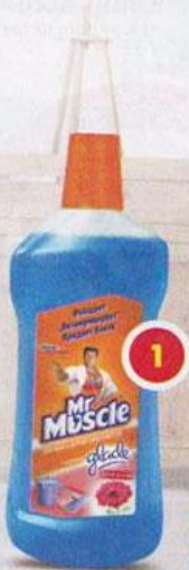
1 Mr Muscle для мытья полов и других поверхностей ПОСЛЕ ДОЖДЯ, 500 мл