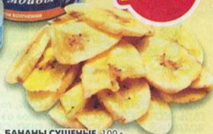
БАНАНЫ СУШЕНЫЕ, 100 г