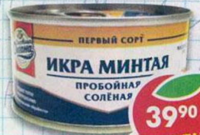
ИКРА МИНТАЯ , соленая, Сокровища Океана, 130 г