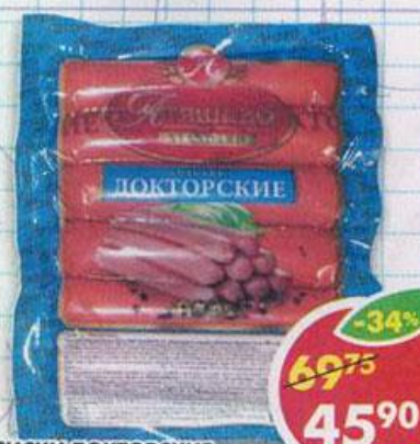
СОСИКИ ДОКТОРСКИЕ , в вакуумной упаковке, Атышево, 300 г