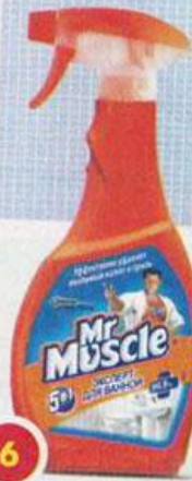
6 Для очищения поверхностей в ванной Mr Muscle