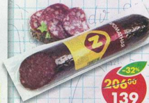
КОЛБАСА АРОМАТНАЯ , сырокопченая, Останкино, 250 г