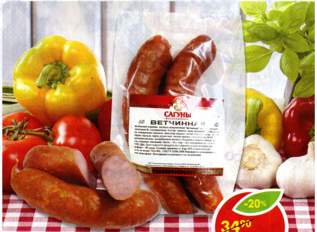
КОЛБАСА ВЕТЧИНАЯ, полукопченая, Сагуны, фасованная *Цена за 100 г