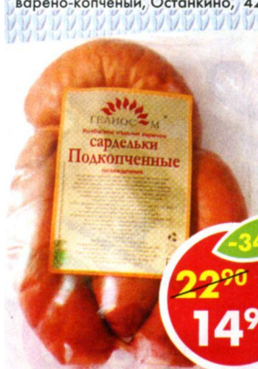
САРДЕЛЬКИ ПОДКОПЧЕННЫЕ, Гелиос-М *Цена за 100 г