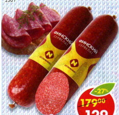
СЕРВЕЛАТ ФИНСКИЙ, варено-копченый, Останкино, 420 г