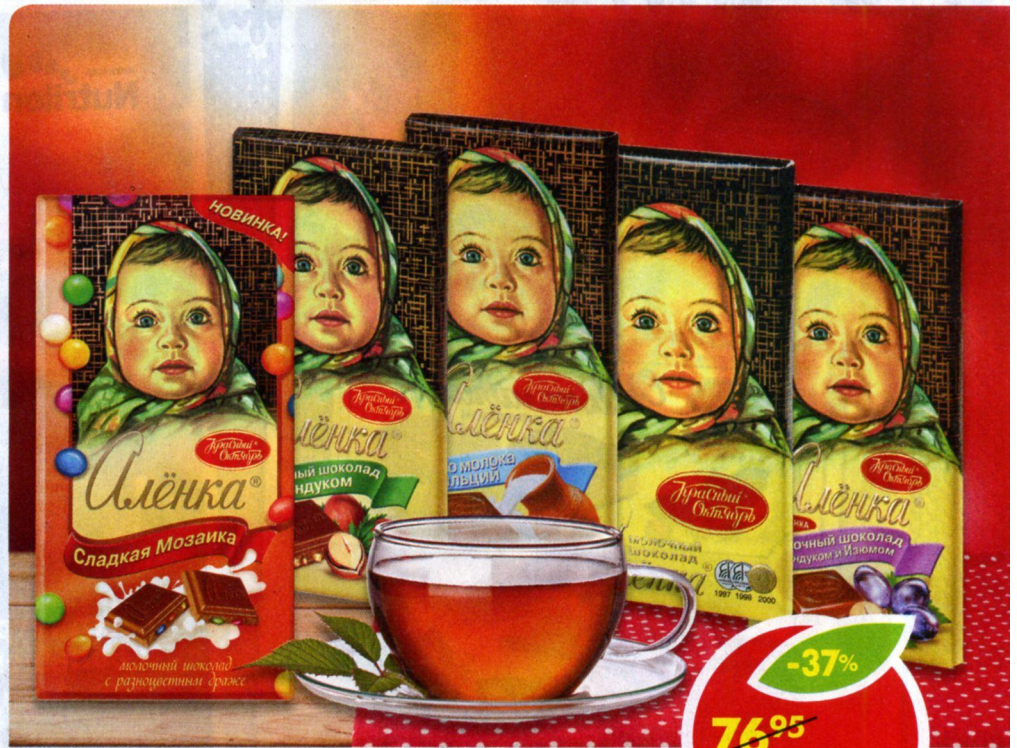
ШОКОЛАД АЛЕНКА, с разноцветным драже; молочный; фундук и изюм; фундук; много молока, 100 г