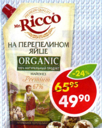
МАЙОНЕЗ MR.RICCO, На перепелином яйце, 67%, 400 мл