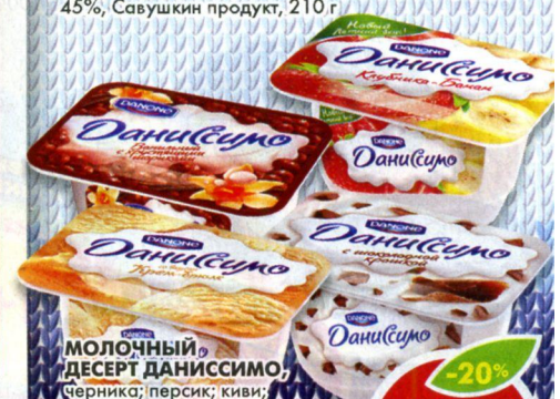
МОЛОЧНЫЙ ДЕСЕРТ ДАНИССИМО, Черника; персик; киви; крем-брюле; пломбир; клубника-банан; манго-апельсин; хрустящими шариками; ванильный; с хрустящими шариками; с кусочками шоколада, Danone, 130 г