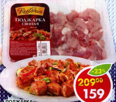
ПОДЖАРКА, свинная, охлажденная, Restoria, 500 г