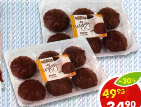
ЗЕФИР, ванильный глазированный, Шарлиз, 240 г