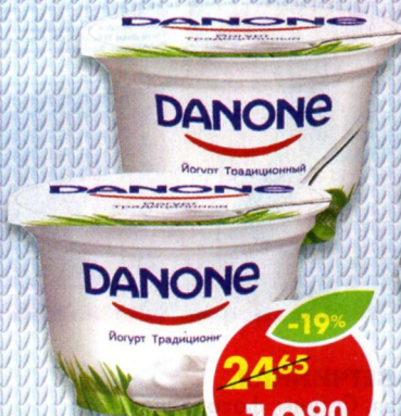
ЙОГУРТ ДАНОН, 3,3%, 170 г