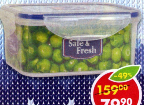
КОНТЕЙНЕР , прямоугольный, 600 мл, 1 шт.