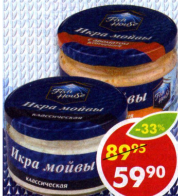
ИКРА МОЙВЫ FISH HOUSE, классическая; с ароматом копчения, 180 г