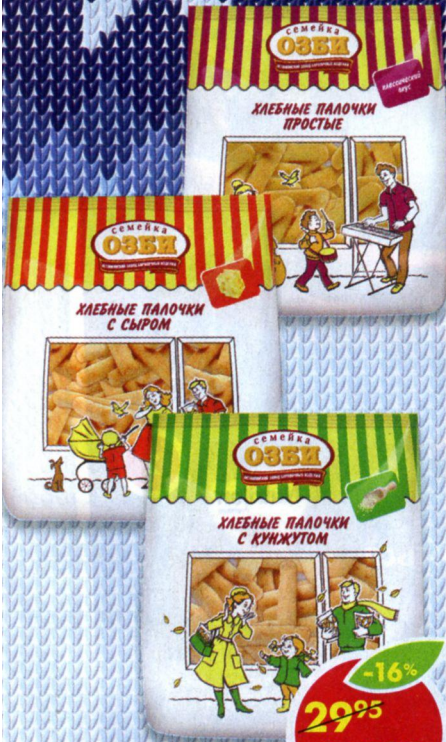
ХЛЕБНЫЕ ПАЛОЧКИ, простые; с сыром; с кунжутом, Семейка Озби, 150 г