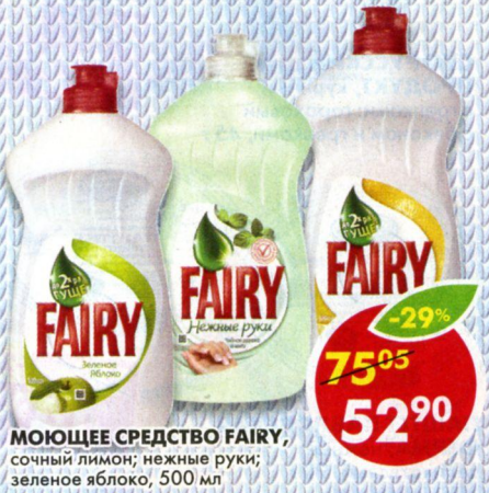
МОЮЩЕЕ СРЕДСТВО FAIRY , сочный лимон; нежные руки; зеленое яблоко, 500 мл