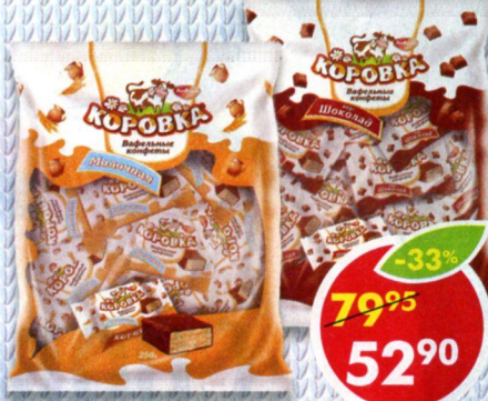
КОНФЕТЫ КОРОВКА, шоколадно-вафельные; молочные, 250 г