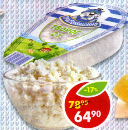
ТВОРОГ ПРОСТОКВАШИНО, 2%, 220 г