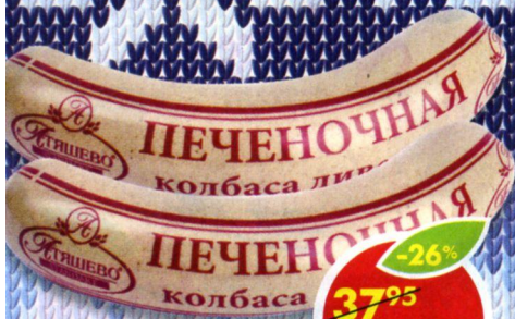
КОЛБАСА ПЕЧЕНОЧНАЯ, ливерная, Атяшево, 250 г