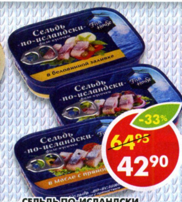
СЕЛЬДЬ ПО-ИСЛАНДСКИ, в беловинной заливке; в красновинной заливке; в масле с пряностями, Fish House, 115 г