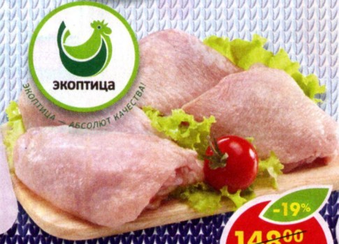
БЕДРО ЦЫПЛЕНКА-БРОЙЛЕРА, охлажденное, Экоптица, 1 кг