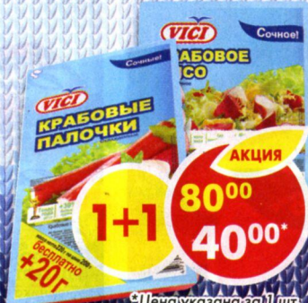
КРАБОВЫЕ ПАЛОЧКИ; КРАБОВОЕ МЯСО VICI, охлажденные, 220 г

1+1 80 00 40 00* *Цена указана за 1 шт. при покупке 2 шт. одновременно.