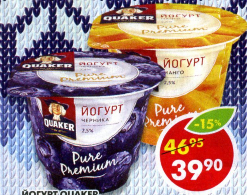
ЙОГУРТ QUAKER, с манго; с черникой, 2,5%, 180 г