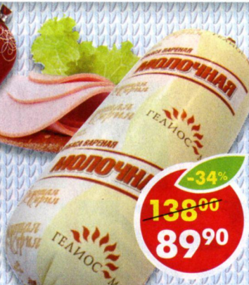
КОЛБАСА МОЛОЧНАЯ, Золотая серия, вареная, Гелиос-М, 500 г