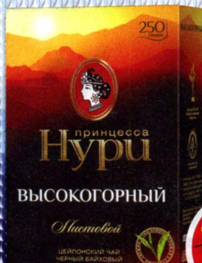
ЧАЙ ПРИНЦЕССА НУРИ, Высокогорный, черный, байховый, 250 г