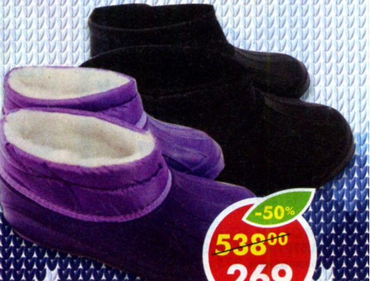
БОТИНКИ ЖЕНСКИЕ; МУЖСКИЕ ЭВА , морозостойкие, р. 37-45, 1 пара