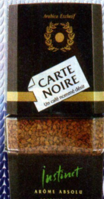
КОФЕ CARTE NOIRE, натуральный, растворимый, 95 г