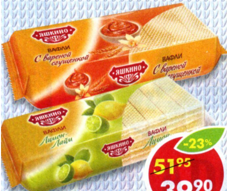
ВАФЛИ ЯШКИНО, вареная сгущенка; лимон-лайм, 300 г