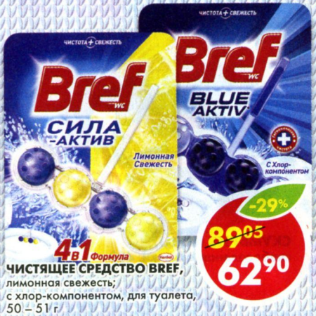
ЧИСТЯЩЕЕ СРЕДСТВО BREF , лимонная свежесть; с хлор-компонентом, для туалета, 50 - 51 г