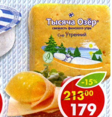
СЫР УТРЕННИЙ, 45%, Тысяча Озер, 300 г