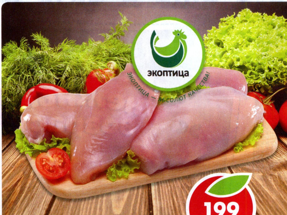
ФИЛЕ ЦЫПЛЕНКА, без кожи, Экоптица, 1 кг