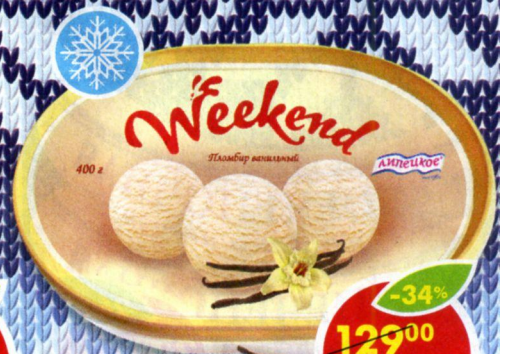
МОРОЖЕНОЕ WEEKEND, пломбир ванильный, Липецкое, 400 г