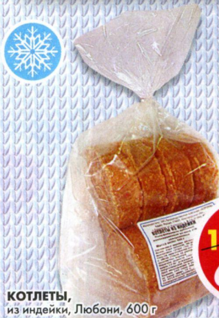
КОТЛЕТЫ, из индейки, Любони, 600 г