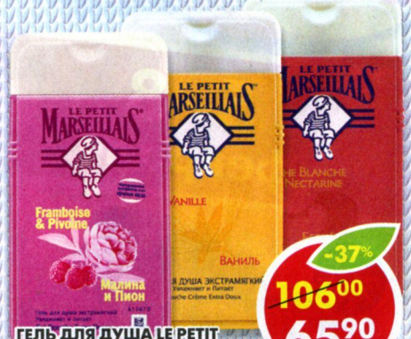
ГЕЛЬ ДЛЯ ДУША LE PETIT MARSEILLAIS® , белый персик и нектарин; ваниль; малина и пион, 250 мл