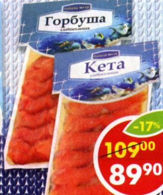
ГОРБУША; КЕТА; слабосоленая, Рябная мила, 150 г

1+1 80 00 40 00* *Цена указана за 1 шт. при покупке 2 шт. одновременно.