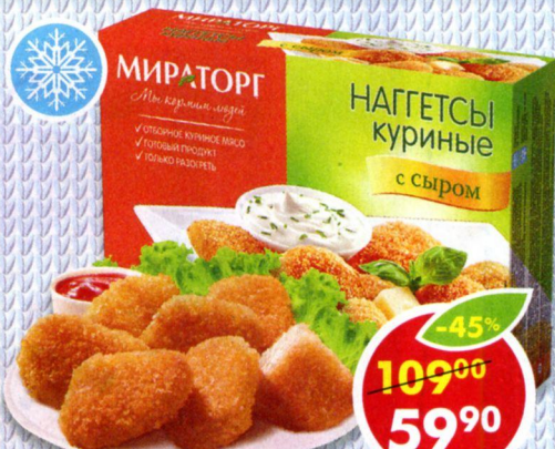
НАГГЕТСЫ МИРАТОРГ, куриные, с сыром, 300 г