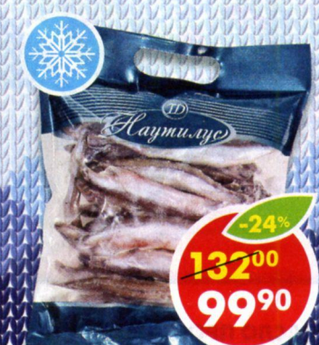
МОЙВА, замороженная, Наutilus, 600 г