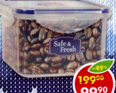
КОНТЕЙНЕР , пищевой, квадратный, 860 мл, 1 шт.