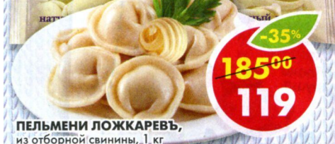
ПЕЛЬМЕНИ ЛОЖКАРЕВЬ, из отборной свинины, 1 кг