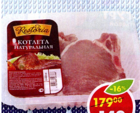
КОТЛЕТА НАТУРАЛЬНАЯ, свинная, охлажденная, Restoria, 450 г