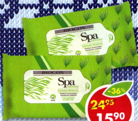
САЛФЕТКИ ВЛАЖНЫЕ, зеленый чай, Biotics, 15 шт., 1 уп.