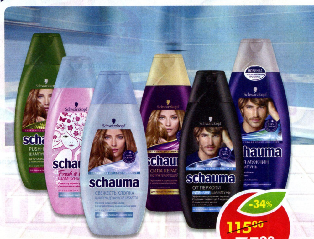
ШАМПУНЬ СЧАУМА , от перхоти, intensive; с хмелем, для мужчин; сила кератина; свежесть хлопка; fresh it up; 7 трав; push-up, 380 мл