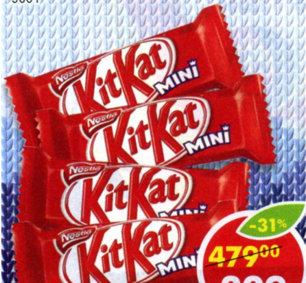
ШОКОЛАД КИТКАТ, молочный, с хрустящими вафлями, 1 кг