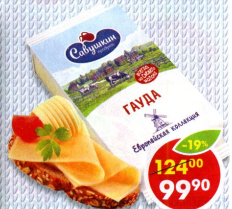
СЫР ГАУДА, 45%, Савушкин продукт, 210 г