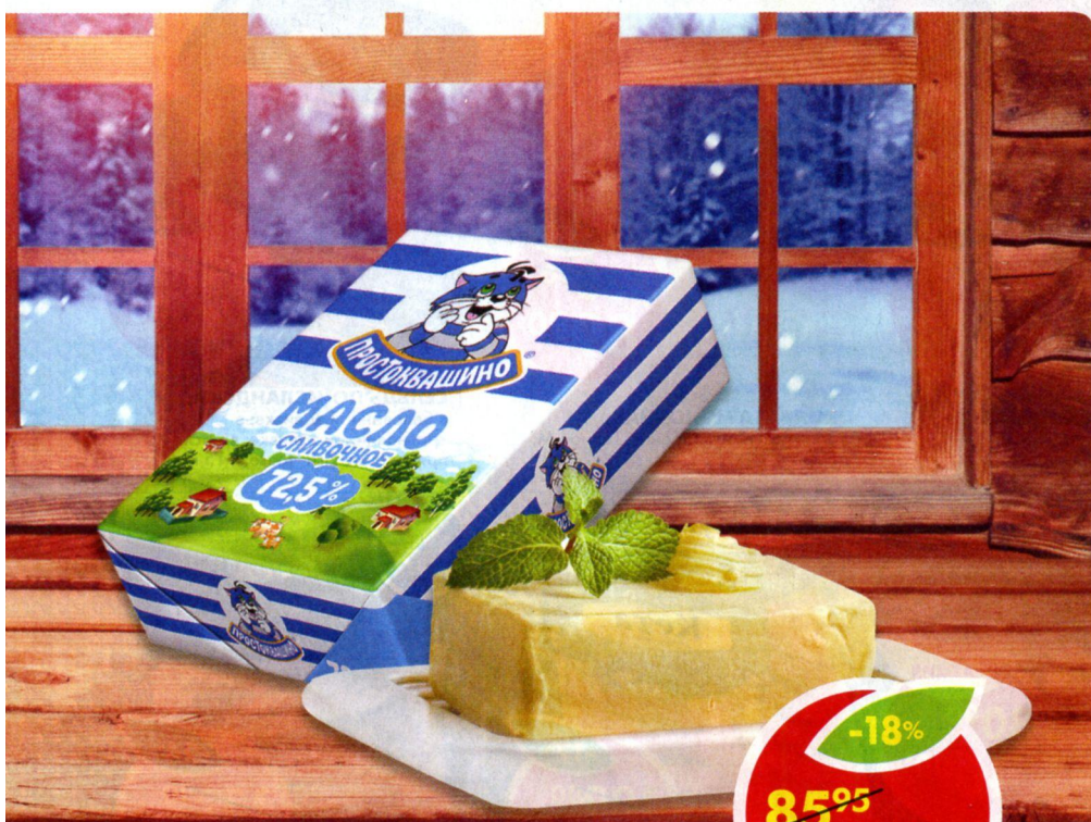
МАСЛО ПРОСТОКВАШИНО, сливочное, 72,5%, 180 г