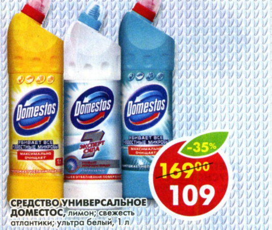
СРЕДСТВО УНИВЕРСАЛЬНОЕ ДОМЕСТОС , лимон; свежесть атлантики; ультра белый, 1 л