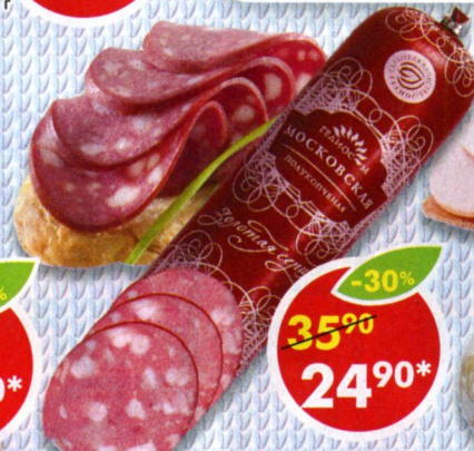
КОЛБАСА МОСКОВСКАЯ, полукопченая, Гелиос-М *Цена за 100 г