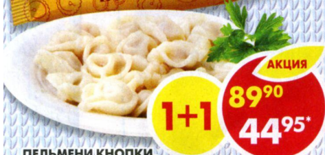
ПЕЛЬМЕНИ КНОПКИ, Белый край, 430 г