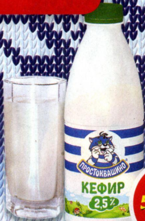
КЕФИР ПРОСТОКВАШИНО, 2,5%, 930 г