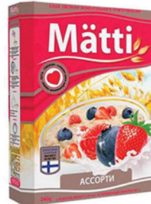
КАША МАТТИ АССОРТИ 6*40г