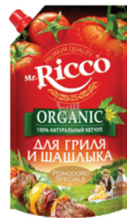
КЕТЧУП ДЛЯ ГРИЛЯ И ШАШЛЫКА MR.RICCO дой-пак 350г