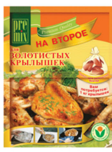
ПРИПРАВА PREMIX Для золотистых крылышек/Для сочной курицы с чесноком 30г