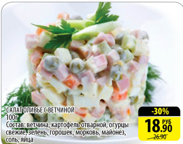
САЛАТОЛИВЬЕ С ВЕТЧИНОЙ 100г Состав: ветчина, картофель отварной, огурцы свежие, зелень, горошек, морковь, майонез, соль, яйца