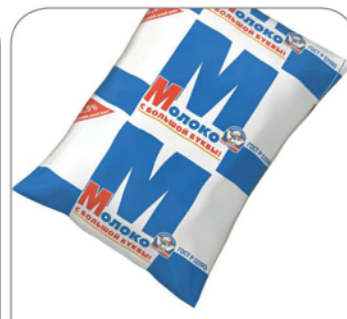
МОЛОКО М 2,5% 900мл