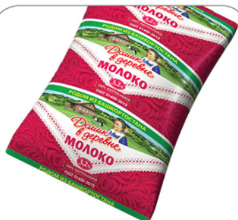
МОЛОКО ДОМИК В ДЕРЕВНЕ 3,2% ТФА 900г