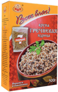
ГРЕЧНЕВАЯ ЯДРИЦА ВСЕХ БЛАГ 7*71,5г