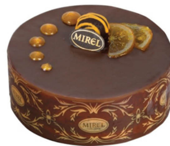
ТОРТ ШОКОЛАДНЫЙ АПЕЛЬСИН МИРЭЛЬ 850г