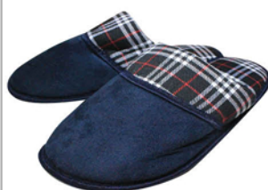
ТАПОЧКИ ДОМАШНИЕ МУЖСКИЕ