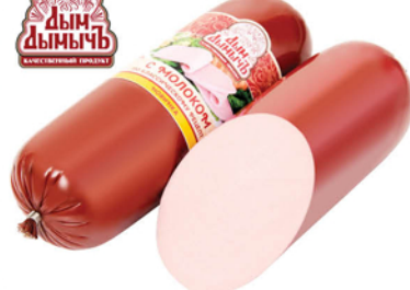
КОЛБАСА С МОЛОКОМ 450г