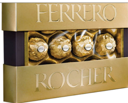
КОНФЕТЫ ФЕРРЕРО РОШЕ ПРЕМИУМ 125г, 10шт