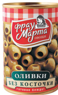
ОЛИВКИ ФРАУ МАРТА б/к, ж/б 300г