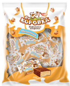
КОНФЕТЫ ВАФЕЛЬНЫЕ КОРОВКА МОЛОЧНАЯ 250г