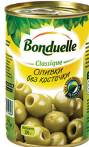
ОЛИВКИ БОНДЮЭЛЬ б/к, ж/б 300г