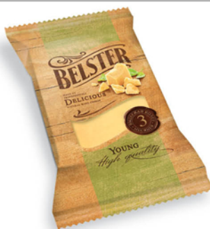
СЫР БЕЛЬСТЕР ЯНГ 40% БЕЛЕБЕЙ 300г