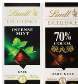
ШОКОЛАД ЛИНДТ ЭКСЕЛЛАНС Апельсин/Мята / Горький 70% какао / Горький 85% какао 100г