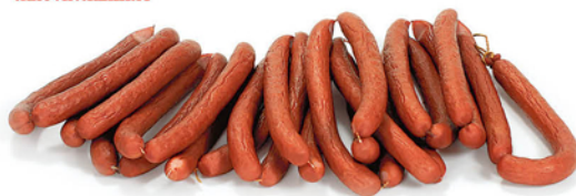
КОЛБАСКИ ОХОТНИЧЬИ п/к, в/с, в/у 1кг