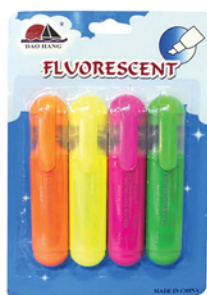
НАБОР МАРКЕРОВ ФЛУОРЕСЦЕНТ- НЫХ 4 ЦВЕТА УП. U31722263055