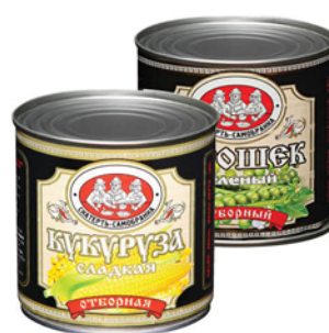
КУКУРУЗА/ГОРОШЕК СКАТЕРЬ-САМОБРАНКА ж/б 340/400г