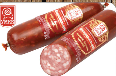
КОЛБАСА ШВАРЦВАЛЬДЕР в/к 1кг