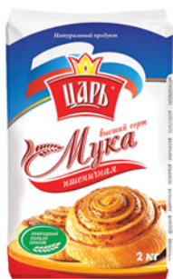
МУКА ПШЕНИЧ- НАЯ ЦАРЬ 2кг