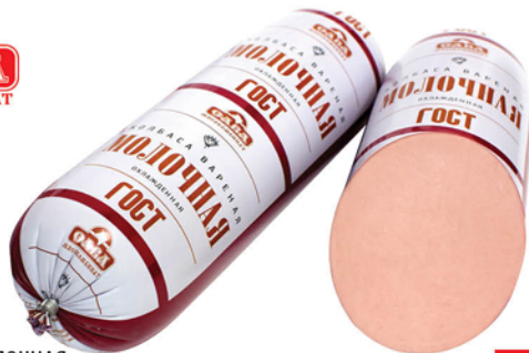
КОЛБАСА МОЛОЧНАЯ ГОСТ 1кг