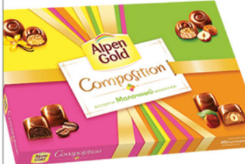
КОНФЕТЫ АЛЬПЕН ГОЛЬД 142г