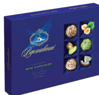
КОНФЕТЫ ВДОХНОВЕНИЕ Mini Cupcakes/Mini Desserts 165г