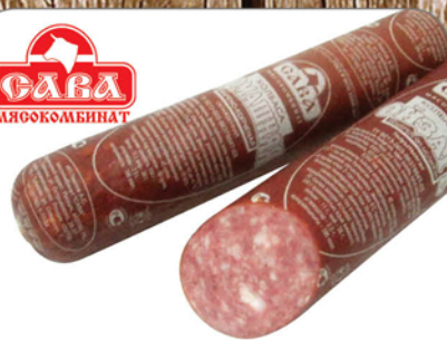
КОЛБАСА ДОМАШНЯЯ в/к, в/с, в/у 1кг