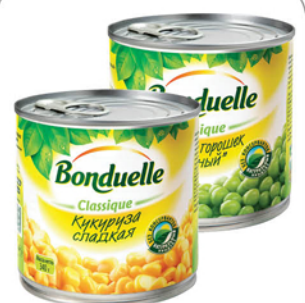
КУКУРУЗА/ ГОРОШЕК БОНДЮЭЛЬ ж/б 340/400г