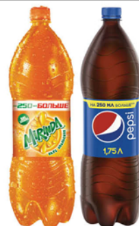
ВОДА ПЕПСИ/ПЕПСИ ЛАЙТ/7UP/МИРИНДА/ МАУНТИН ДЬЮ пл/б 1,75л