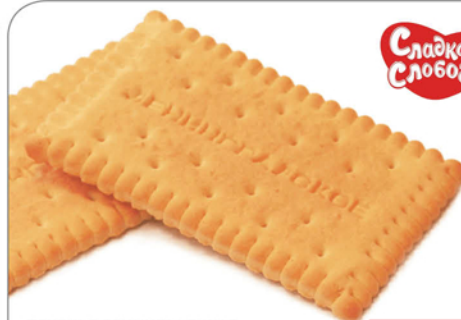
ПЕЧЕНЬ ЛЕНИНГРАДСКОЕ 1кг