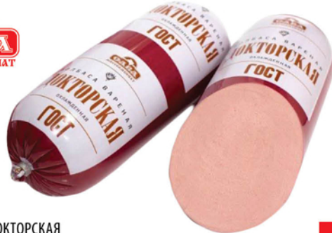
КОЛБАСА ДОКТОРСКАЯ в/с 1кг