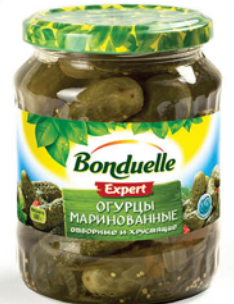
ОГУРЦЫ БОНДЮЭЛЬ ст/б 680г