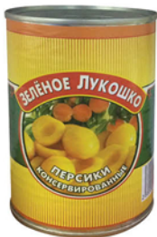
ПЕРСИКИ ПОЛОВИНКИ ЗЕЛЕНЕ ЛУКОШКО ж/б 425мл