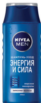
ШАМПУНЬ NIVEA MEN 250мл