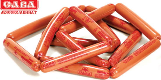
СОСИСКИ МОЛОЧНЫЕ 1С ГОСТ 1кг