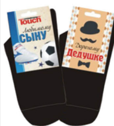
НОСКИ МУЖСКИЕ ПРАЗДНИЧНЫЕ в ассортименте