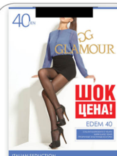
КОЛГОТКИ ГЛАМУР ЭДЕМ 40