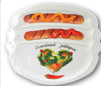
ТАРЕЛКА СЕМЕЙНЫЙ ЗАВТРАК 22,5*19,4*2,2СМ в ассортименте