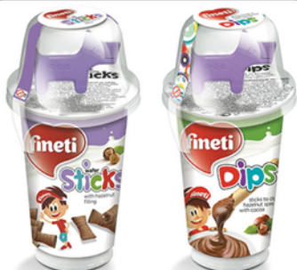
FINETI DIPS ПАСТА ОРЕХОВАЯ 45Г+ИГРУШКА/ ВАФЕЛЬНЫЕ ТРУБОЧКИ FINETI STICKS МИНИ 45Г+ИГРУШКА