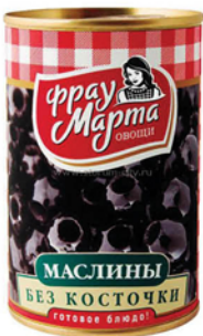
МАСЛИНЫ ФРАУ МАРТА б/к, ж/б 300г