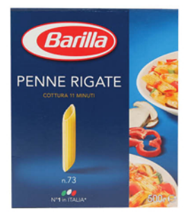
МАКАРОННЫЕ ИЗ ДЕЛИЯ BARILLA Пенне Ригате №73/ Фарфалле №065/Фузилли №98/Челлентани 500г