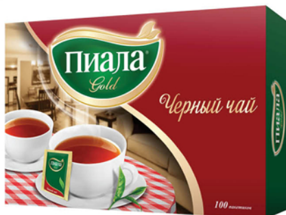
ЧАЙ ЧЕРНЫЙ ПИАЛА 100пакетиков*2г