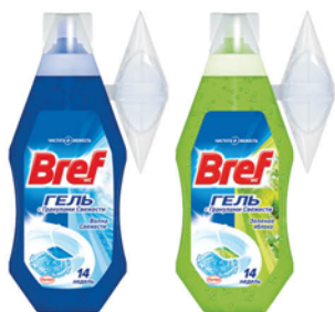
ОСВЕЖИТЕЛЬ ДЛЯ ТУАЛЕТА БРЕФ 360МЛ + ПОДВЕСКА ВОЛНА СВЕЖЕСТИ/ЗЕЛЕНЕЕ ЯБЛОКО