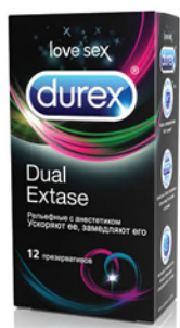
ПРЕЗЕРВАТИВЫ DUREX DUAL EXTASE 12шт