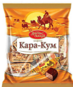
КОНФЕТЫ КАРА-КУМ 250г