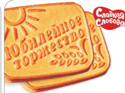
ПЕЧЕНЬ ЮБИЛЕЙНОЕ ТОРЖЕСТВО МОЛОЧНОЕ 1кг