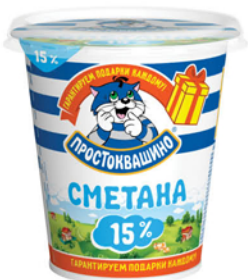
СМЕТАНА ПРОСТОКВАШИНО 15% 350г