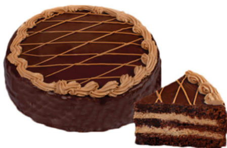
ТОРТ ПРАГА УФИМСКИЙ ХЛЕБ 0,8кг