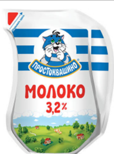
МОЛОКО ПРОСТОКВАШИНО 3,2% LP 0,9л