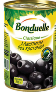
МАСЛИНЫ БОНДЮЭЛЬ б/к, ж/б 300г