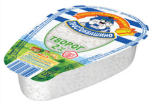
ТВОРОГ ПРОСТОКВАШИНО КЛАССИЧЕСКИЙ 2% 220г