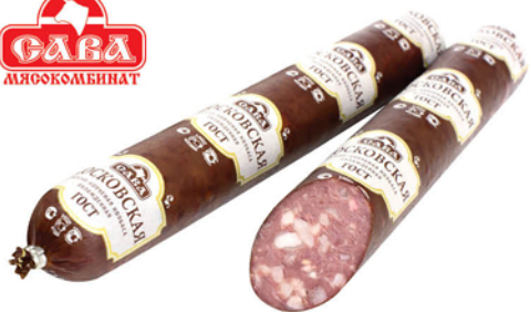
КОЛБАСА МОСКОВСКАЯ в/к, в/с, в/у 1кг