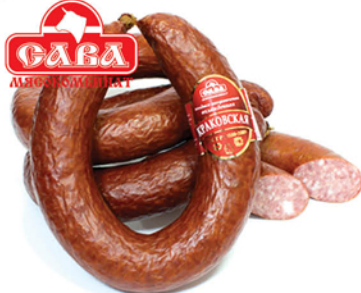
КОЛБАСА КРАКОВСКАЯ п/к, в/с 1кг