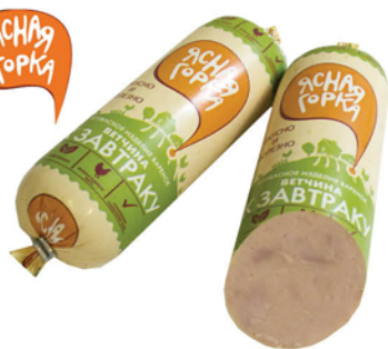
ВЕТЧИНА ВАРЕНАЯ К ЗАВТРАКУ 450г