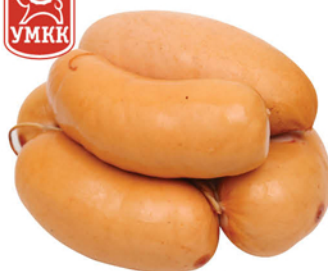
САРДЕЛЬКИ РОЩИНСКИЕ н/о 1кг