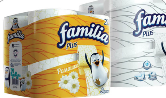
ТУАЛЕТНАЯ БУМАГА FAMILIA 2слоя, 8шт в ассортименте