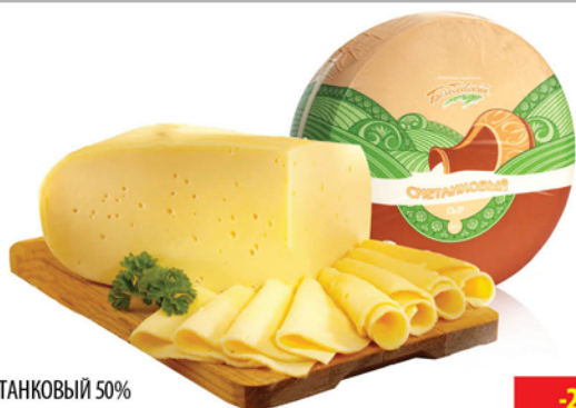
СЫР СМЕТАНКОВЫЙ 50% БЕЛЕБЕЙ КРУГ 1кг