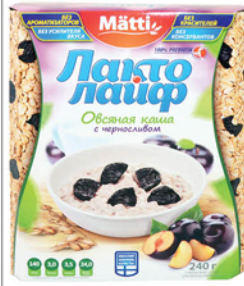
КАША ОВСЯНАЯ ЧЕРНОСЛИВ МАТТИ ЛАКТОЛИФ 6*40г