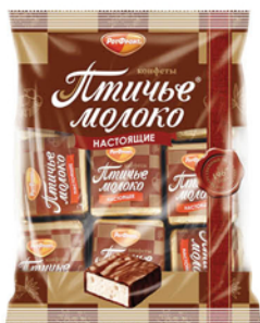
КОНФЕТЫ ПТИЧЬЕ МОЛОКО СЛИВОЧНО-ВАНИЛЬНЫЕ 225г