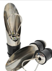
ДОЗАТОРЫ ДЛЯ ВИННЫХ БУТЫЛОК 2ШТ 4ПР. SCFC0651