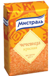
ЧЕЧЕВИЦА КРАСНАЯ МИСТРАЛЬ 450г