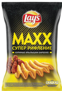
ЧИПСЫ ЛЕЙС МАКС Pizza four cheese/Кры- лышки Барбекю/Мясо на углях/Сыр и лук 145г