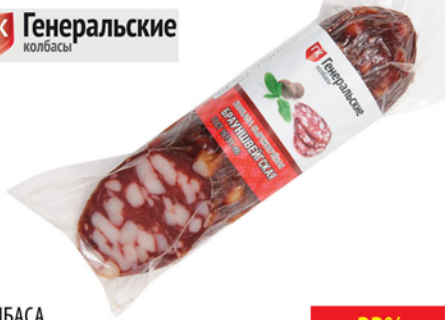
КОЛБАСА БРАУНШВЕЙГСКАЯ с/к, в/с, в/у 150г