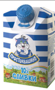
СЛИВКИ ПРОСТОКВАШИНО 10% 200г