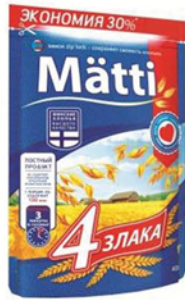
КАША МАТТИ 4 ЗЛАКА пакет 400г