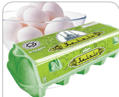
ЯЙЦО СТОЛОВОЕ С-1 ХАЛЯЛЬ АВДОН 10шт