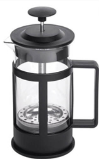
ЧАЙНИК ЗАВАРНИК 192263