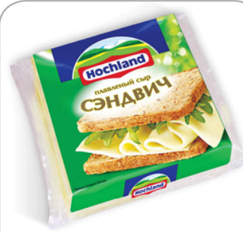
СЫР ХОХЛАНД 150г в ассортименте