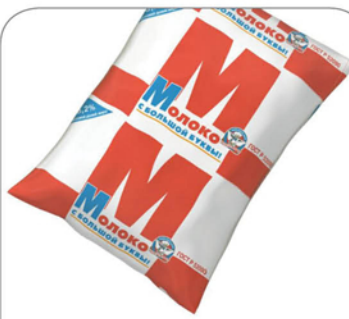
МОЛОКО М 3,2% 900мл