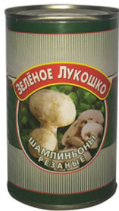
ГРИБЫ ШАМПИ- НЬОНЫ ЗЕЛЕНЕ ЛУКОШКО Резаные/Целые ж/б 425мл