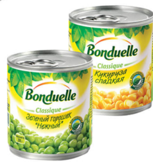
КУКУРУЗА/ ГОРОШЕК БОНДЮЭЛЬ ж/б 170/200г