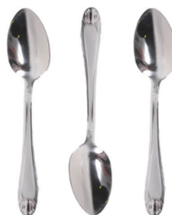
НАБОР ВИЛОК/ЛОЖЕК СТОЛОВЫХ/ЛОЖЕК ЧАЙНЫХ 3 ПРЕДМЕТА