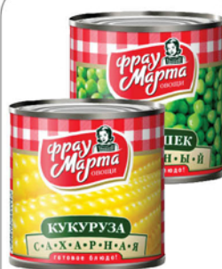
КУКУРУЗА/ ГОРОШЕК ФРАУ МАРТА ж/б 310г