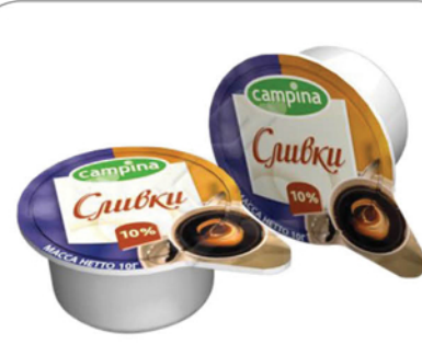
СЛИВКИ КАМПИНА 10% порц. 10г