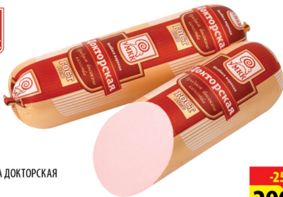
КОЛБАСА ДОКТОРСКАЯ 1кг