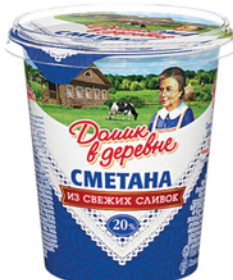
СМЕТАНА ДОМИК В ДЕРЕВНЕ 20% 330г