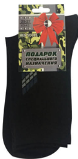
НОСКИ МУЖСКИЕ TOUCH РАЗ.25-27 АРТ.062