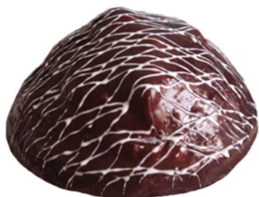
ТОРТ ДОМАШНИЙ СО СМЕТАНОЙ 800г