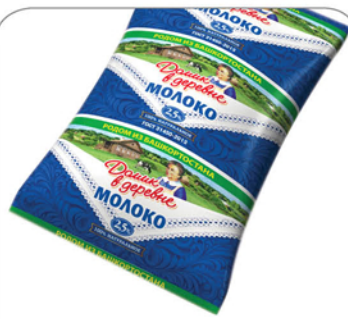
МОЛОКО ДОМИК В ДЕРЕВНЕ 2,5% ТФА 900г