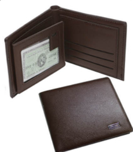
ПОРТМОНЕ МУЖСКОЕ ИЗ ИСКУССТВЕННОЙ КОЖИ USCFC600