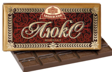
ШОКОЛАД ЛЮКС БАБАЕВСКИЙ 100г