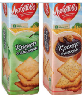
ПЕЧЕНЬ КРЕКЕР ЛЮБЯТОВО С МАКОМ/С ЯБЛОКАМИ 155г