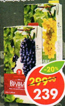
ВИНО РИСЛИНГ, белое; ВРАНАЦ, красное, сухое, Сербия, 1 л