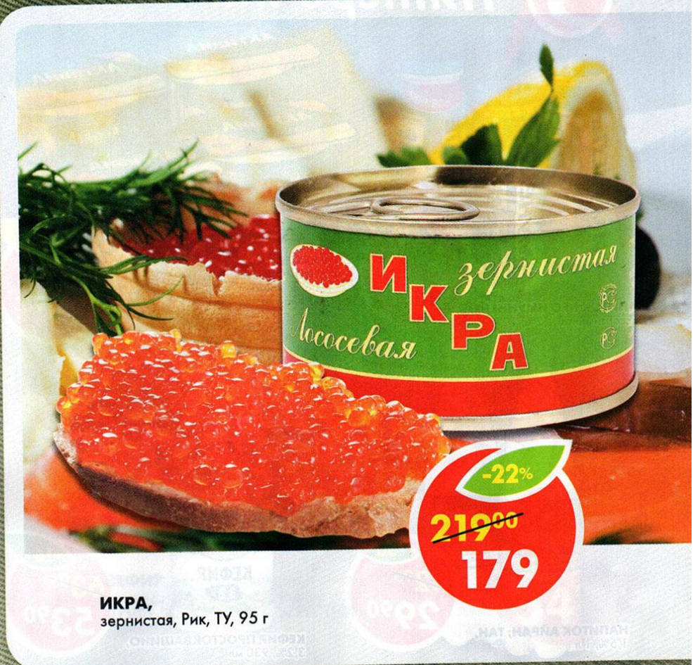
ИКРА, зернистая, Рик, ТУ, 95 г