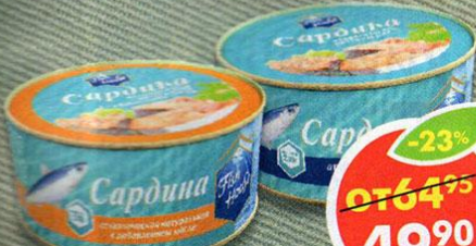
САРДИНА FISH HOUSE, натуральная; с добавлением масла, 230 г