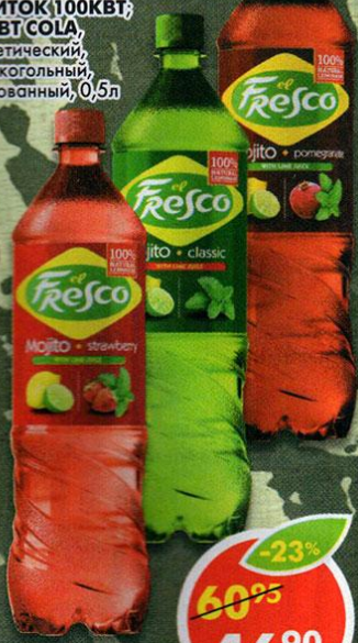
НАПИТОК ELFRESCO, мохито, со вкусом лайма; со вкусом клубники; со вкусом граната, 1,25л