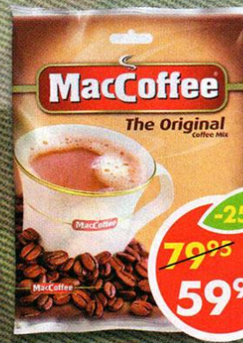
НАПИТОК КОФЕЙНЫЙ MACCOFFEE, 3 в 1, 10 шт x 20 г