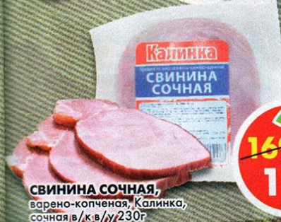
СВИНИНА СОЧНАЯ, варено-копченая, Калинка, сочная в/к в/у 230 г