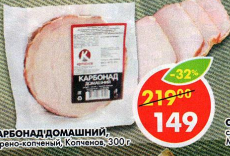
КАРБОНАД ДОМАШНИЙ, варено-копченый, Копченое, 300 г