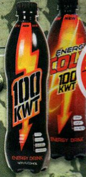
НАПИТОК 100КВТ; 100КВТ СОЛА, энергетический, безалкогольный, газированный, 0,5л