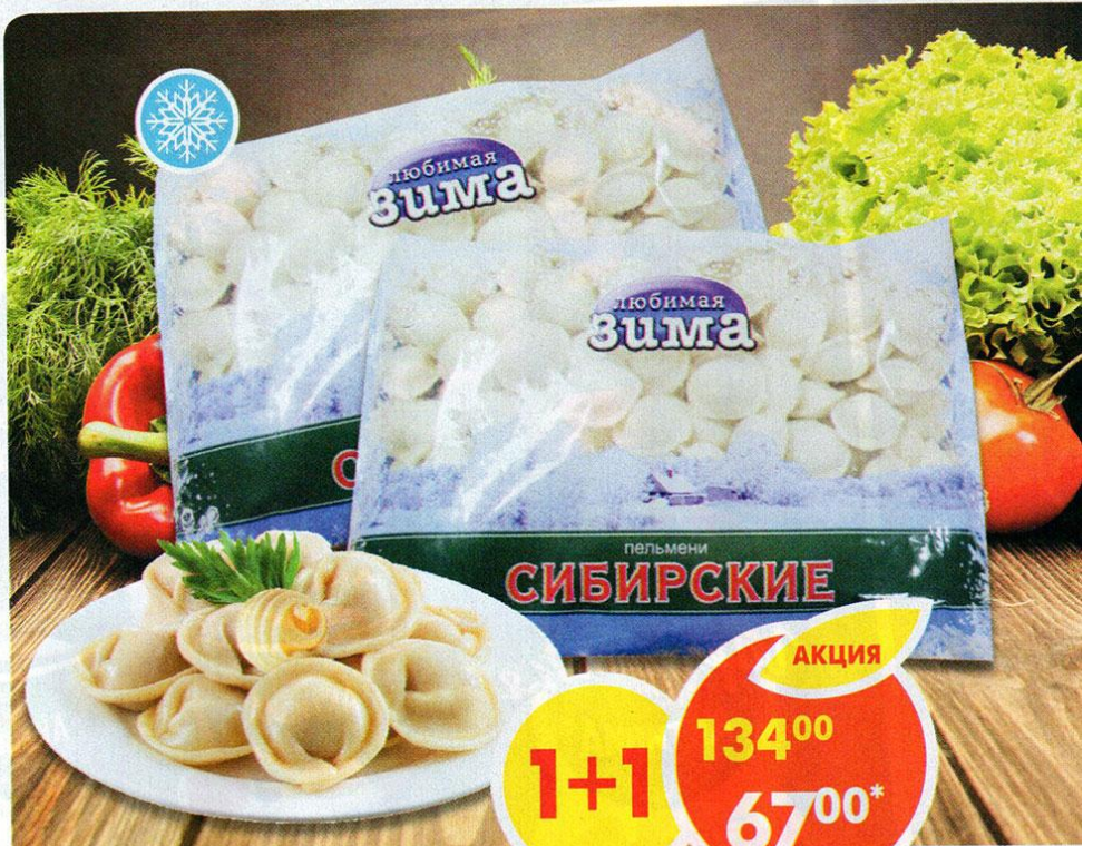
ПЕЛЬМЕНИ СИБИРСКИЕ, Любимая зима, 800 г