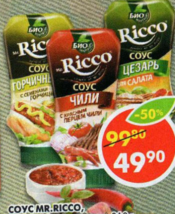
СОУС MR. RICCO, горчичный; цезарь; чили, 310 г