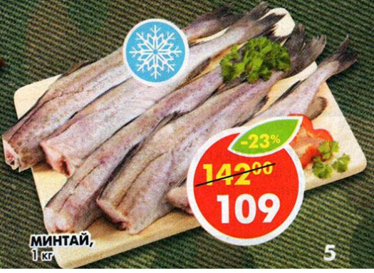
МИНТАЙ, 1 кг