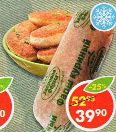
ФАРШ, куриный, Здоровая ферма, 500 г