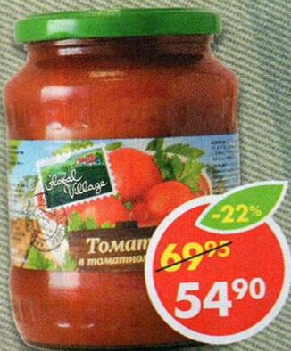
ТОМАТЫ GLOBAL VILLAGE, в томатном соке, 700 мл