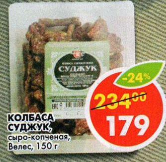
КОЛБАСА СУДЖУК, сыро-копченая, Велес, 150 г