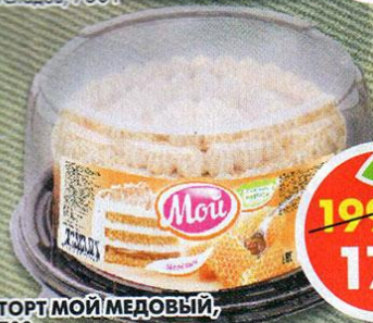
ТОРТ МОЙ МЕДОВЫЙ, 700 г