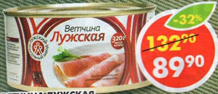
ВЕТЧИНА ЛУЖСКАЯ, Лужский КЗ, 320 г