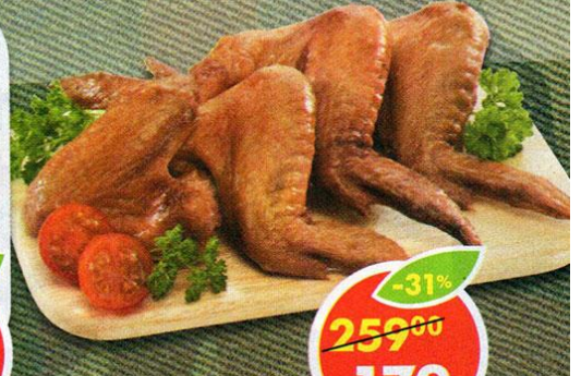
КРЫЛЬЯ ГРИЛЬ, 1 кг