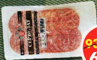
СЕРВЕЛАТ, варено-копченый, Велес, 150 г