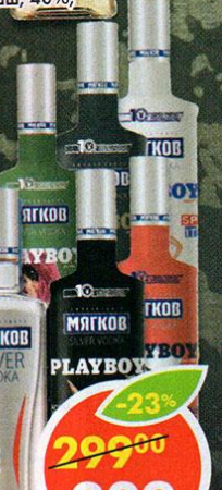
ВОДКА МЯГКОВ СЕРЕБРЯНАЯ, 40%, 0,5 л