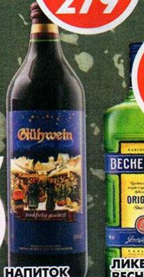
НАПИТОК ГЛИНТВЕЙН, 8,5%, Германия, 1,0 л