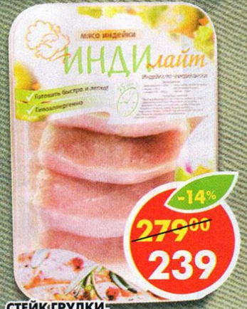
СТЕЙК ГРУДКИ, Индилейт, 700 г