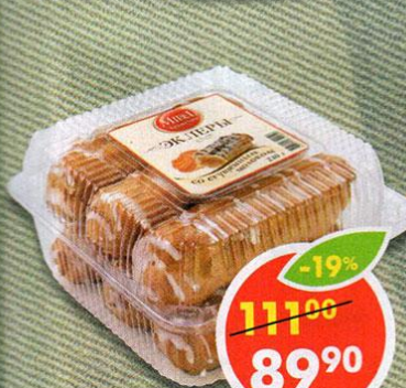
ПИРОЖНЫЕ ЭКЛЕР, со сгущенным молоком, Mirel, 210 г