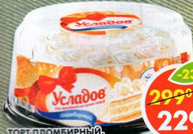
ТОРТ ПЛОМБИРНЫЙ, Усладов, 750 г