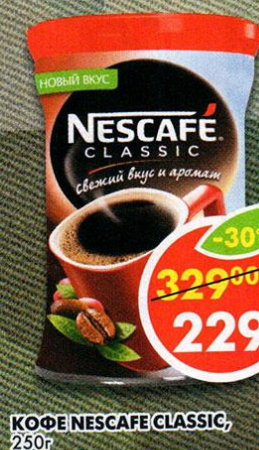
КОФЕ NESCAFE CLASSIC, 250 г