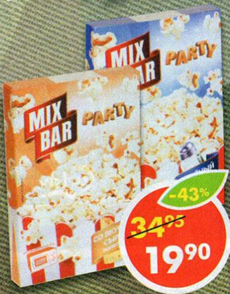
ПОПКОРН MIX BAR, сыр; соль, 85 г