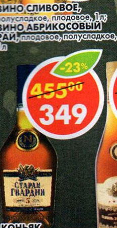
КОНЬЯК СТАРАЯ ГВАРДИЯ, пятилетний, Российский, 40%, 0,5 л