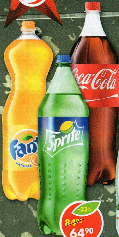
НАПИТОК СПРАЙТ; КОКА-КОЛА; ФАНТА, 2л