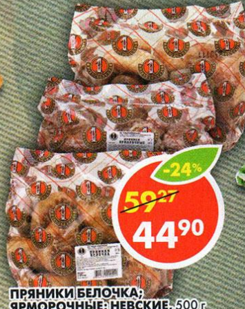
ПРЯНИКИ БЕЛОЧКА; ЯРМОРОЧНЫЕ; НЕВСКИЕ, 500 г