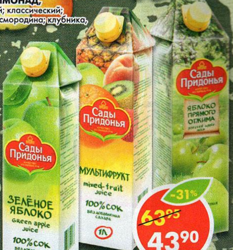
СОКИ И НЕКТАРЫ САДЫ ПРИДОНЬЯ, яблоко; мультифрукт; абрикос-яблоко; мультиовощной; яблоко-персик; яблоко- морковь; яблоко-вишня, 1л