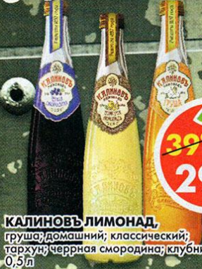
КАЛИНОВЪ ЛИМОНАД, груша; домашний; классический; тархун; черная смородина; клубника, 0,5л