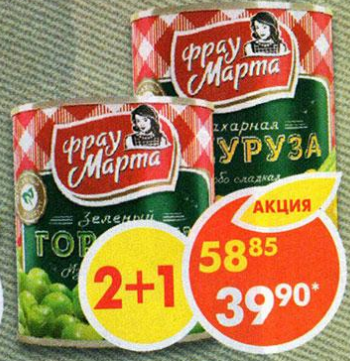
ГОРОШЕК ЗЕЛЕНый; КУКУРУЗА, Фрау Марта, 310 г *Цена указана за 1 шт. при покупке 3 шт. одновременно.