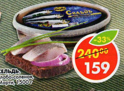
СЕЛЬДЬ, слабо-соленая, Марти, 1500 г