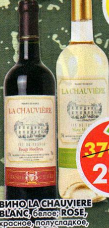
ВИНО LA CHAUVIERE BLANC, белое; ROSE, красное, полусладкое, Франция, 0,75 л