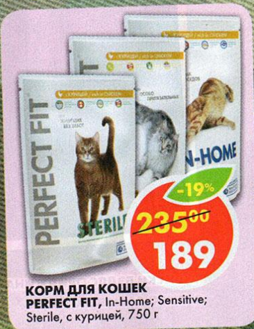
КОРМ ДЛЯ КОШЕК PERFECT FIT, In-Home; Sensitive; Sterile, с курицей, 750 г