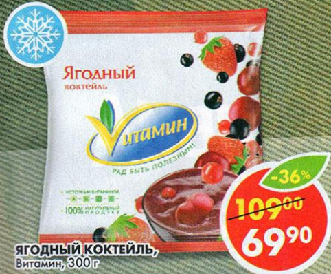
ЯГОДНЫЙ КОКТЕЙЛЬ, Витамин, 300 г