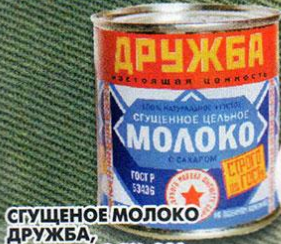
СПУЩЕННОЕ МОЛОКО ДРУЖБА, с сахаром, 8,5%, 380 г