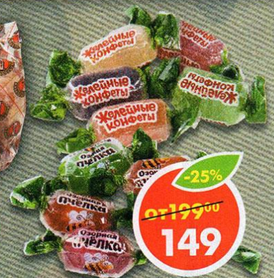
КОНФЕТЫ ОЗОРНАЯ ПЧЕЛКА; ПЧЕЛКА, желейные, неглазированные, 1 кг