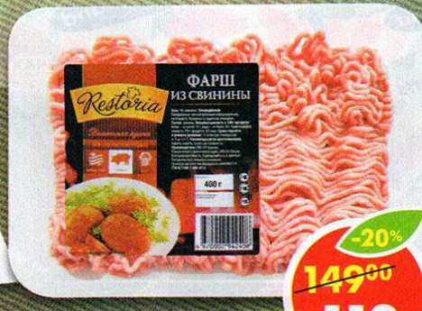
ФАРШ, из свинины, Restoria, 400 г