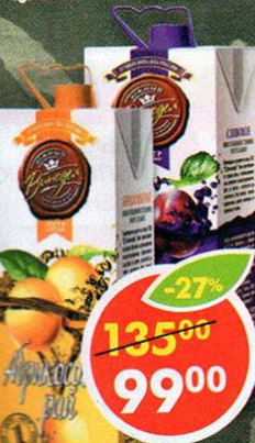
ВИНО СЛИВОВОЕ, полусладкое, плодое, 1л ВИНО АБРИКОВЫЙ РАИ, плодое, полусладкое, 1л