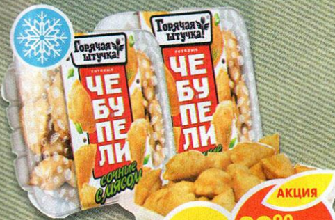
ЧЕБУПЕЛИ СОЧНЫЕ, с мясом, Горячая штучка, 300 г *Цена указана за 1 уп. при покупке 2 уп. одновременно