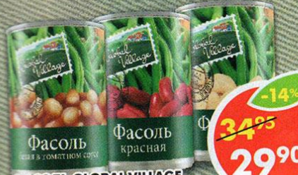
ФАСОЛЬ GLOBAL VILLAGE, красная; белая, в собственном соку; белая, в томатном соусе, 425 мл