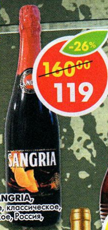
ВИНО SANGRIA, фруктовое, классическое, полусладкое, Россия, 0,75 л