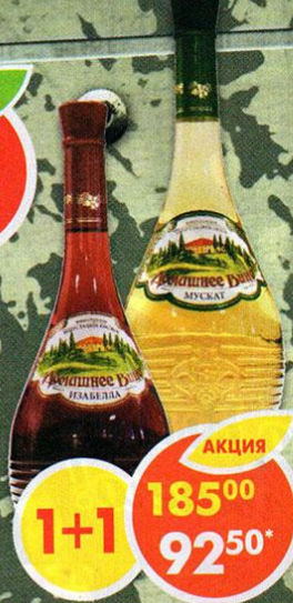
ВИНО ДОМАШНЕЕ ИЗАБЕЛЛА, красное, полусладкое; МУСКАТ, белое, полусладкое, Россия, 0,7 л *Цена указана за 1 шт. при покупке 2 шт. одновременно