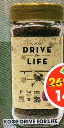
КОФЕ DRIVE FOR LIFE, 100 г