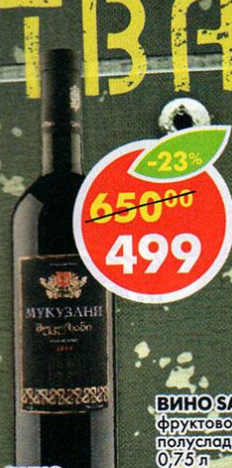
ВИНО МУКУЗАНИ, красное, сухое, Грузия, 0,75 л