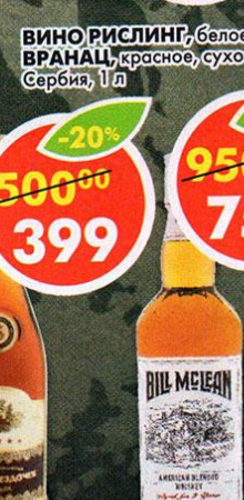
КОНЬЯК РОССИЙСКИЙ, пятилетний, 40%, 0,5 л