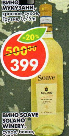
ВИНО SOAVE SOLANO WINERY, сухое, белое, 0,75 л