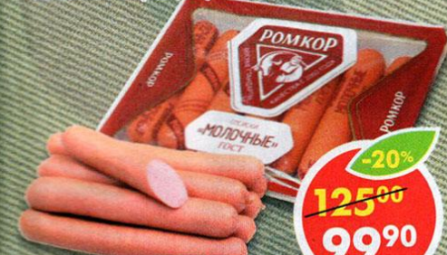
СОСИСКИ МОЛОЧНЫЕ, Ромкор, 350 г