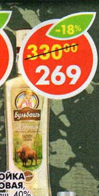
НАСТОЙКА ЗУБРОВАЯ, Бульбаш, 40%, 0,5 л