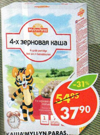
КАША MYLLYN PARAS, 4-х зерновая; хлопья, 300 г