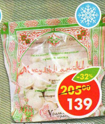
ПЕЛЬМЕНИ МУССУЛЬМАНСКИЕ, ИП Бирюкова, 900 г