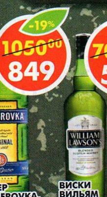
ЛИКЕР BESHEROVKA, горький, 38%, 0,7 л