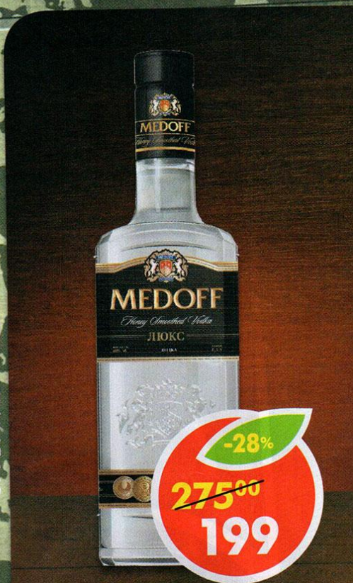
ВОДКА MEDOFF ЛЮКС, 40%, 0,5 л