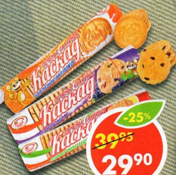
ПЕЧЕНЬЕ КАСКАД, сахарное, топленое молоко; с изюмом; сливочное масло, 290-300 г