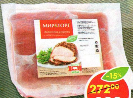
ЛОПАТКА, свинная, без кости, Мираторг, 1 кг