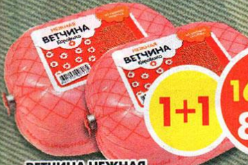
ВЕЧНИНА НЕЖНАЯ, из свиного окорока, Коровино, 500 г