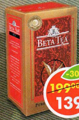
ЧАЙ BETA TEA ОПА, черный, цейлонский, байховый, 250 г