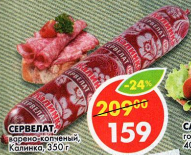
СЕРВЕЛАТ, варено-копченый, Калинка, 350 г