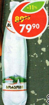
ВОДА МИНЕРАЛЬНАЯ, Borjomi, 0,75л