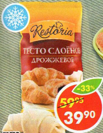
ТЕСТО, слоёное, дрожжевое, Restoria, 500 г

*Цена указана за 1 уп. при покупке 2 уп. одновременно