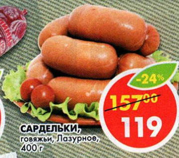
САРЕЛЬКИ, говяжьи, Лазурное, 400 г