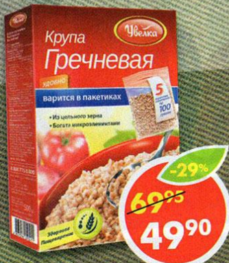
КРУПА ЭКСТРА, гречневая, Увелка, 5x100 г