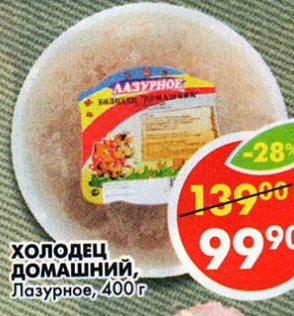
ХОЛОДЕЦ ДОМАШНИЙ, Лазурное, 400 г