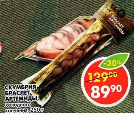
СКУМБРИЯ БРАСЛЕТ, АРТЕМИДЫ, холодного копчения, 250 г