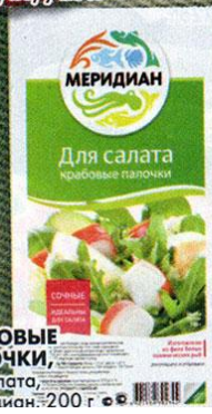
КРАБОВЫЕ ПАЛОЧКИ, для салата, Меридиан, 200 г