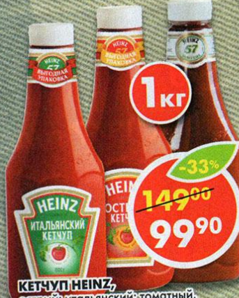
КЕТЧУП HEINZ, острый; итальянский; томатный, 1 кг