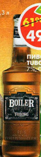
ПИВО BOILER TUBORG, 7%, 0,45 л