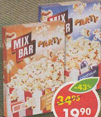
ПОПКОРН MIXBAR, сыр; соль, 85-100 г