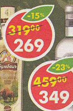
ВОДКА ПОСОЛЬСКАЯ, 40%, 0,5 л