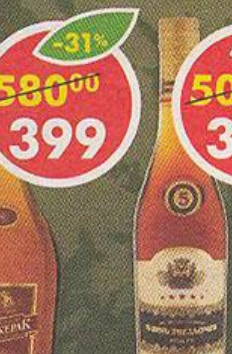
КОНЬЯК БЕРЖЕРАК, российский, четырёхлетний, 40%, 0,5 л