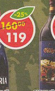
ВИННЫЙ НАПИТОК SANGRIA, газированный, Россия, 0,75 л