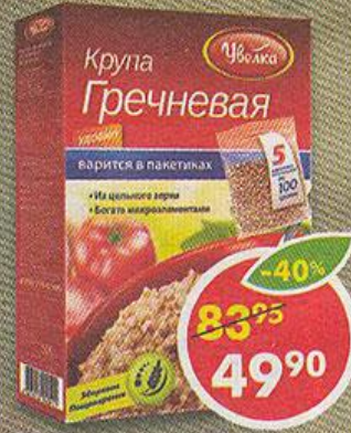
КРУПА УВЕЛКА ГРЕЧНЕВАЯ, 5 пак. x 100 г