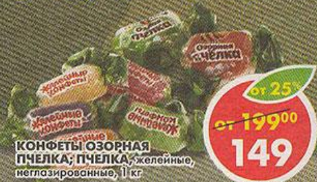
САХАРНЫЕ КОНФЕТЫ ОЗОРНАЯ ПЧЕЛКА; ПЧЕЛКА; Желейные, неглазированные, 1 кг