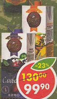
ВИНО АБРИКОСОВЫЙ РАЙ; СЛИВОВОЕ, плодовое, полусладкое, 12%, 1 л