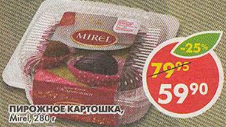
ПИРОЖНОЕ КАРТОШКА, Mirel, 280 г