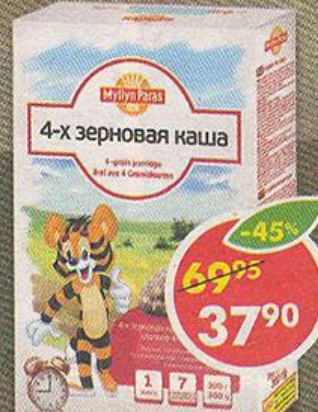
КАША MYLLYN PARAS, 4-х зерновая, хлопья, 300 г