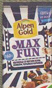
ШОКОЛАД ALPEN GOLD MAX FUN мармелад со вкусом колы, попкорн, взрывная карамель, 160 г