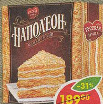
ТОРТ НАПОЛЕОН, Классический, слоеный, Русская нива, 450 г