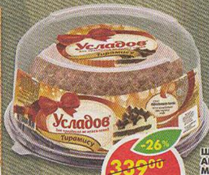
ТОРТ ТИРАМИСУ, Усладов, 750 г