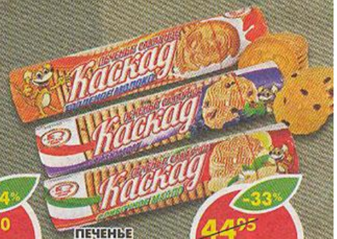
ПЕЧЕНЬЕ КАСКАД, сахарное, топленое молоко; с изюмом, сливочное масло, 290-300 г