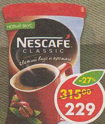
КОФЕ NESCAFE CLASSIC растворимый, 250 г