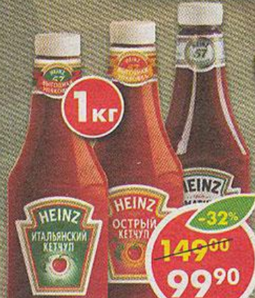
КЕТЧУП HEINZ, острый; итальянский; томатный, 1 кг