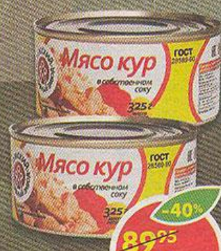
МЯСО КУР в собственном соку, МК Лужский, 325 г