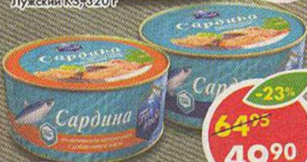
САРДИНА, натуральная, с добавлением масла, Fish House, 230 г