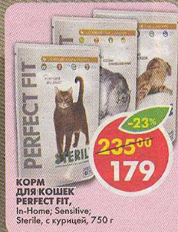
КОРМ ДЛЯ КОШЕК PERFECT FIT, In-Home; Sensitive; Sterile, с курицей, 750 г