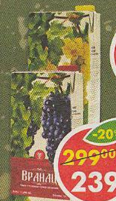
ВИНО РИСЛИНГ, белое; ВРАНАЦ, красное, сухое, Сербия, 1 л