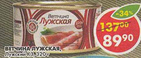
ВЕТЧИНА ЛУЖСКАЯ, Лужский КЗ, 320 г