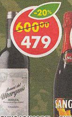
ВИНО LOMAS DEL MARQUES RIOJA CRIANZA, красное, сухое, Испания, 0,75 л