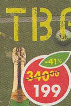
ВИНО СЕВАСТОПОЛЬСКОЕ, Крымское, игристое, белое, полусладкое, Россия, 0,75 л