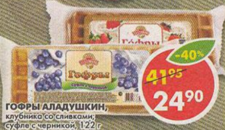
ГОФРЫ АЛАДУШКИН, клубника со сливками; суфле с черникой, 122 г