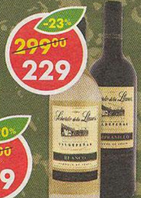
ВИНО SEÑORIO DE LOS LLANOS, красное; белое, сухое, Испания, 0,75 л