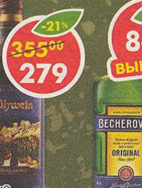
ВИННЫЙ НАПИТОК GLÜHWEIN, Глитвейн, Германия, 1 л