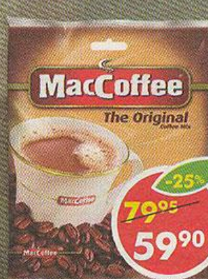
НАПИТОК КОФЕЙНЫЙ MACCOFFEE, растворимый, 3 в 1, 20 г, 10 шт