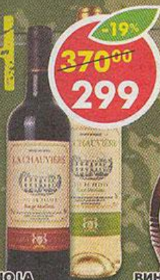
ВИНО LA CHAUVIERE, красное, белое, полусладкое, Франция, 0,75 л