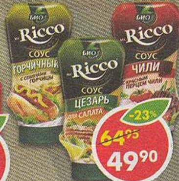
СОУС MR. RICCIO, горчичный; цезарь; чили, 310-335 г