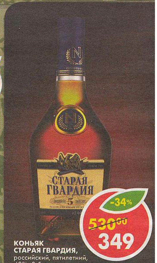
КОНЬЯК СТАРАЯ ГВАРДИЯ, российский, пятилетний, 40%, 0,5 л