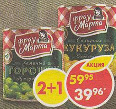
ГОРОШЕК-ЗЕЛЕНый; КУКУРУЗА, Фрау Марта, 310 г *Цена указана за 1 шт. при покупке 3 шт. одновременно.