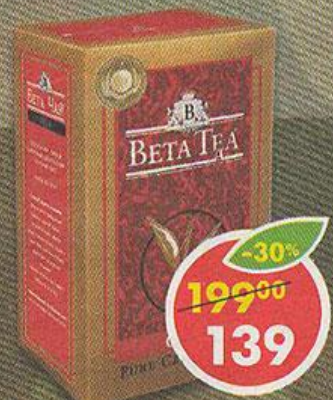
ЧАЙ BETA TEA, черный, цейлонский, байховый, 250 г