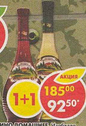
ВИНО ДОМАШНЕЕ, Изабелла, красное; Мускат, белое, полусладкое, Россия, 0,7 л *Цена указана за 1 шт. при покупке 2 шт. одновременно