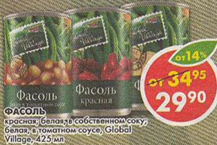
ФАСОЛЬ красная, белая, в собственном соку; белая, в томатном соусе, Global Village, 425 мл