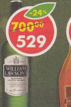
ВИСКИ WILLIAM LAWSON'S, 40%, Шотландия, 0,5 л