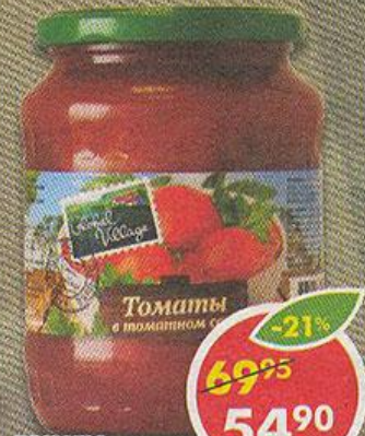
ТОМАТЫ, в томатном соке, Global Village, 700 мл