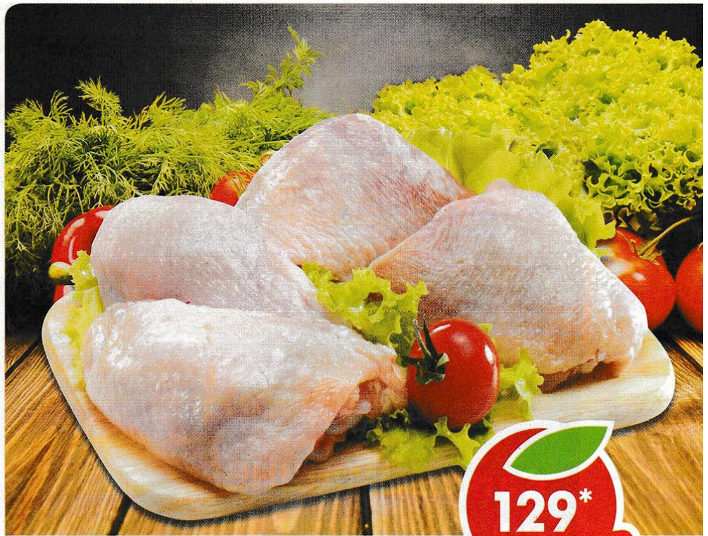
БЕДРО КУРИНОЕ, охлажденное, 1 кг *Предложение не действует в Респ. Коми