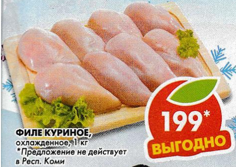
ФИЛЕ КУРИНОЕ, охлажденное, 1 кг *Предложение не действует в Респ. Коми