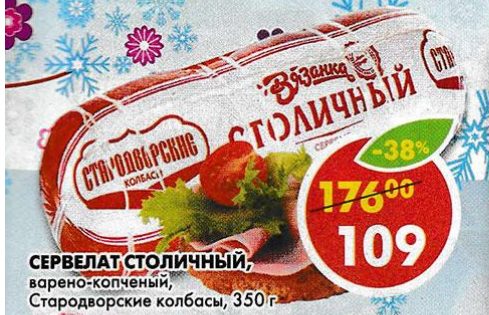
СЕРВЕЛАТ СТОЛИЧНЫЙ, варено-копченый, Стародворские колбасы, 350 г