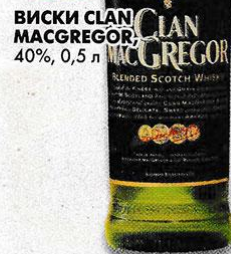
ВИСКИ CLAN MACGREGOR , 40%, 0,5 л