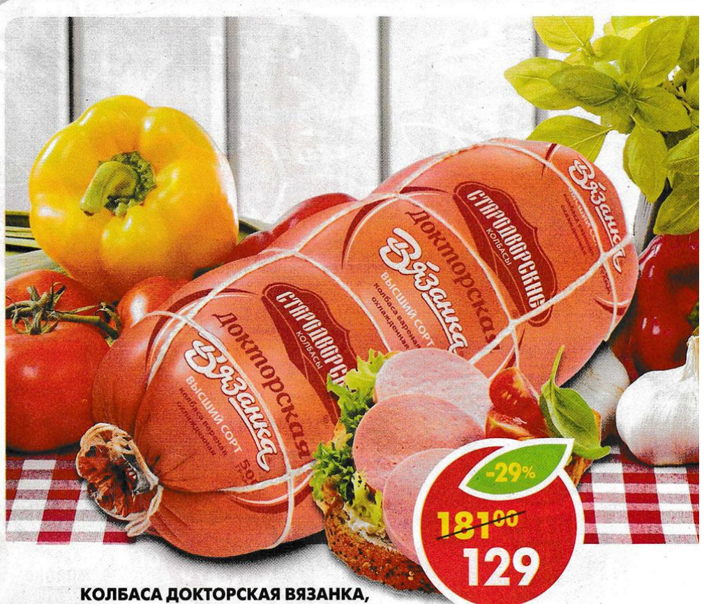
КОЛБАСА ДОКТОРСКАЯ ВЯЗАНКА, Стародворские колбасы, 500 г