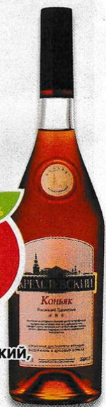
КОНЬЯК КРЕМЛЕВСКИЙ , Российский, трехлетний, 40%, 0,5 л