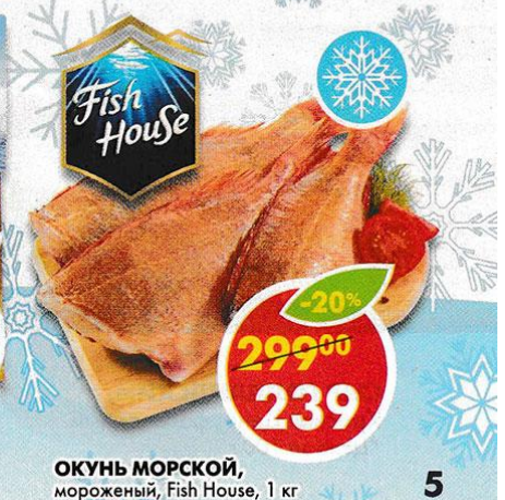
ОКУНЬ МОРСКОЙ, мороженный, Fish House, 1 кг