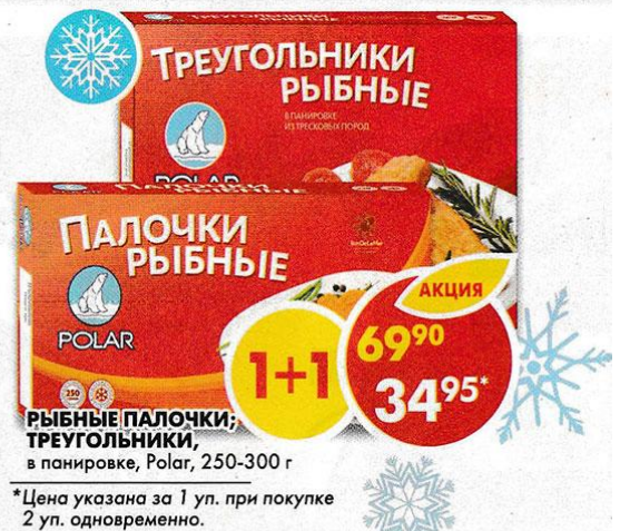
РЫБНЫЕ ПАЛОЧКИ; ТРЕУГОЛЬНИКИ, в панировке, Polar, 250-300 г

*Цена указана за 1 уп. при покупке 2 уп. одновременно.