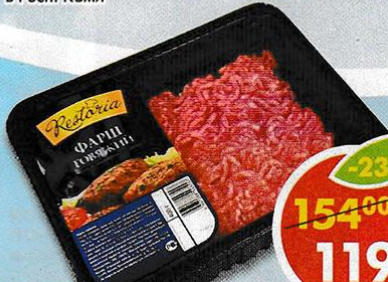
ФАРШ ГОВЯЖИЙ, охлажденный, Restoria, 400 г