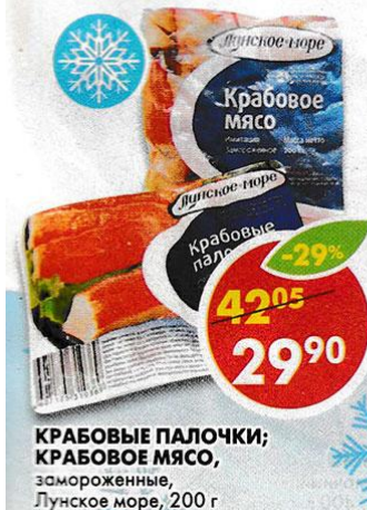
КРАБОВЫЕ ПАЛОЧКИ; КРАБОВОЕ МЯСО, замороженные, Лунское море, 200 г

*Цена указана за 1 уп. при покупке 2 уп. одновременно.