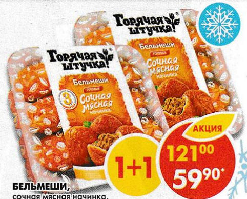
БЕЛЬМЕШИ, сочная мясная начинка, Горячая штучка, 300 г