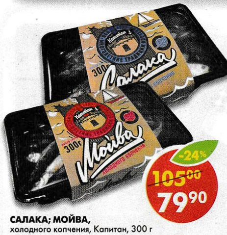
САЛАКА; МОЙВА, холодного копчения, Капитан, 300 г