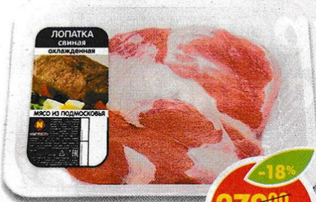
ЛОПАТКА СВИНАЯ, без кости, охлажденная, Останкино, 1 кг