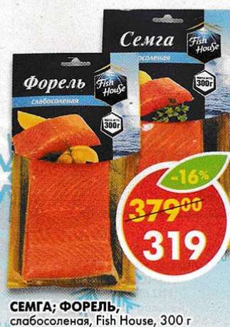
СЕМГА; ФОРЕЛЬ, слабосоленая, Fish House, 300 г