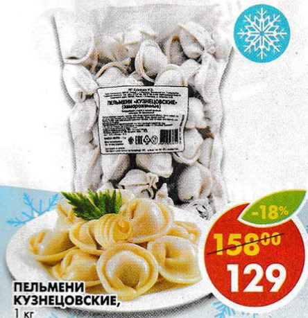
ПЕЛЬМЕНИ КУЗНЕЦОВСКИЕ, 1 кг

*Цена указана за 1 уп. при покупке 2 уп. одновременно.