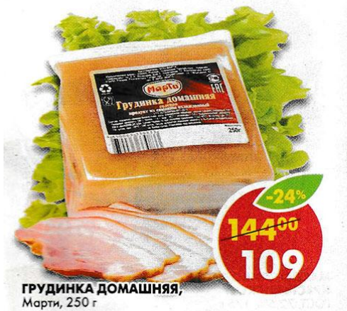
ГРУДИНКА ДОМАШНЯЯ, Мерти, 250 г