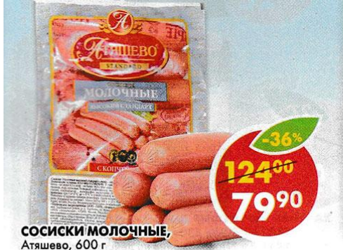
СОСИКИ МОЛОЧНЫЕ, Атышево, 600 г