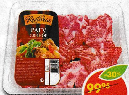
РАГУ СВИНОЕ, охлажденное, Restoria, 500 г