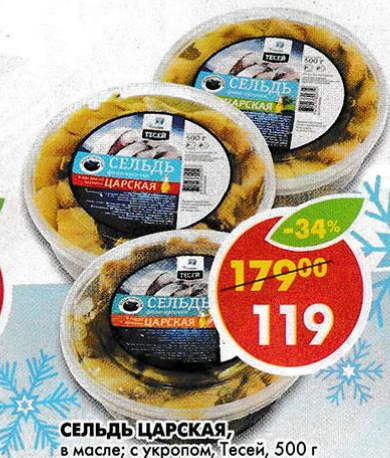
СЕЛЬДЬ ЦАРСКАЯ, в масле, с укропом, Тесей, 500 г