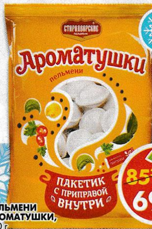
ПЕЛЬМЕНИ АРОМАТУШКИ, 430 г