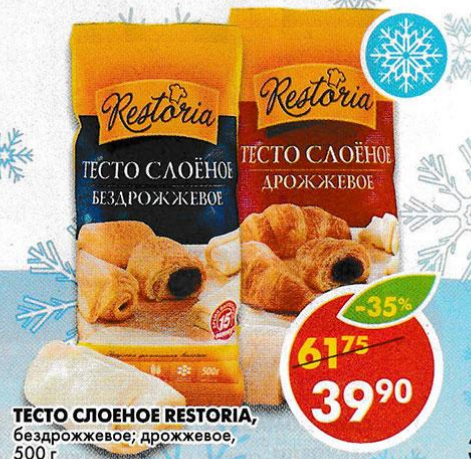
ТЕСТО СЛОЕНОЕ RESTORIA, бездрожжевое; дрожжевое, 500 г