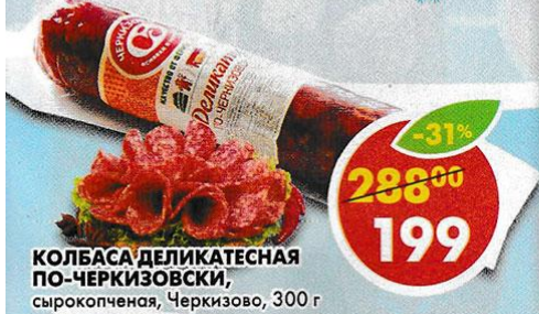
КОЛБАСА ДЕЛИКАТЕСНАЯ ПО-ЧЕРКИЗОВСКИ, сырокопченая, Черкизово, 300 г