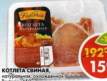
КОТЛЕТА СВИНАЯ, натуральная, охлажденная, Restoria, 450 г