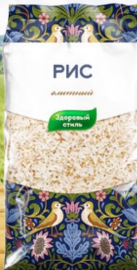
Рис пропаренный ЗДОРОВЫЙ СТИЛЬ 800 г