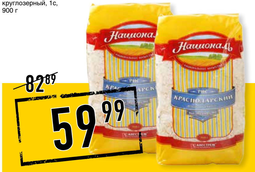
РИС НАЦИОНАЛЬ КРАСНОДАРСКИЙ, круглозерный, 1с, 900 г