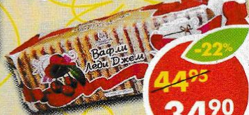
ВАФЛИ ЛЕДИ ДЖЕМ, вишня, 250 г