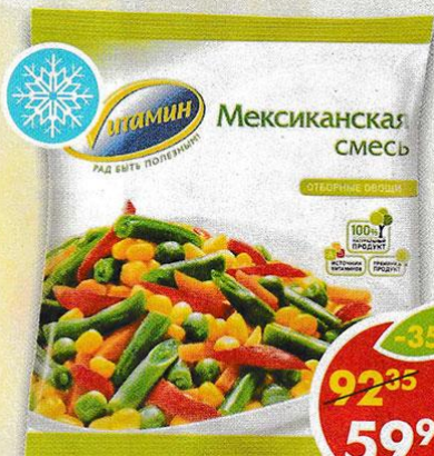
СМЕСЬ МЕКСИКАНСКАЯ, Витамин, 400 г