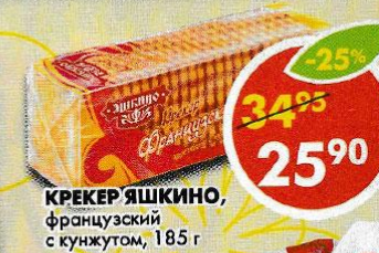
КРЕКЕР ЯШКИНО, французский с кунжутом, 185 г