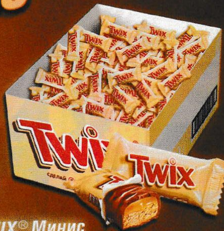
TWIX® Минис вразвес