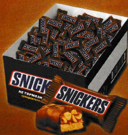
SNICKERS® Минис вразвес