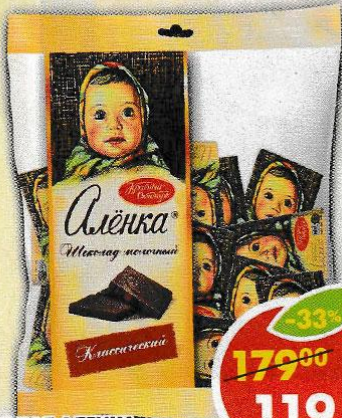
ШОКОЛАД 'АЛЕНКА,' Красный октябрь, 210 г