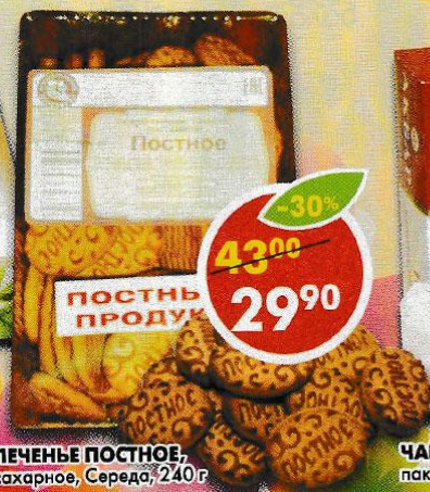
ПЕЧЕНЬЕ ПОСТНОЕ, сахарное, Серeda, 240 г