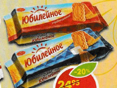
ПЕЧЕНЬЕ ЮБИЛЕЙНОЕ, витаминизированное; традиционное; молочное, 112 г