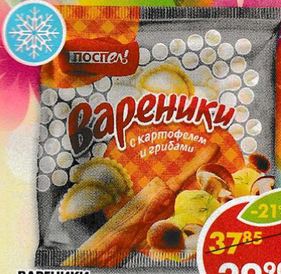
ВАРЕНИКИ, с картофелем и грибами, Поспел, 350 г