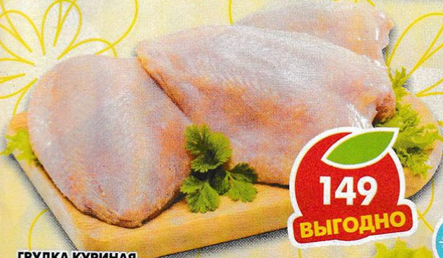
ГРУДКА КУРИНАЯ, охлажденная, 1 кг