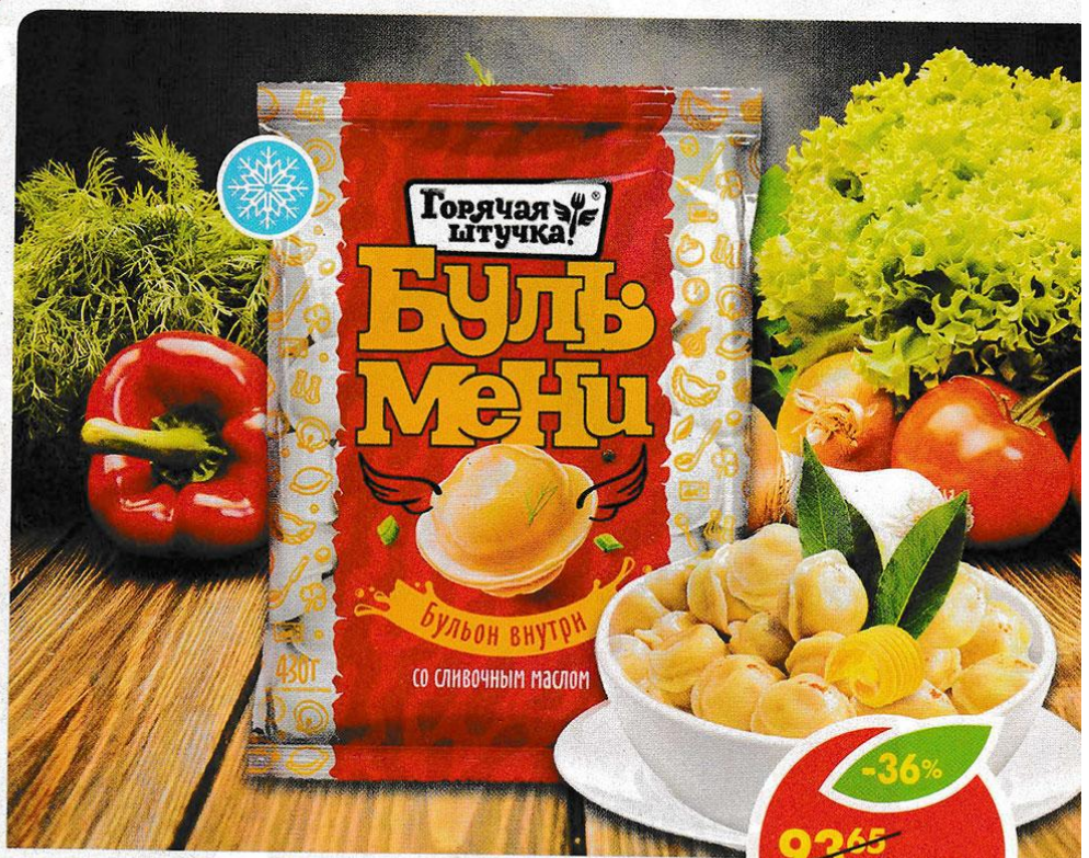
ПЕЛЬМЕНИ БУЛЬМЕНИ, со сливочным маслом, Горячая штука!, 430 г