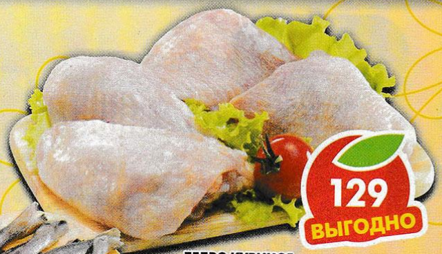
БЕДРО КУРИНОЕ, охлажденное, 1 кг