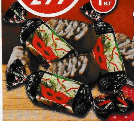
КОФЕ NESCAFE GOLD, растворимый, натуральный, 190 г КОНФЕТЫ МАСКА, 1 кг