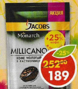
КОФЕ JACOBS MONARCH MILICANO, растворимый, 95 г