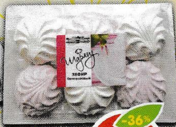
ЗЕФИР ШАРЛИЗ, бело-розовый, 180 г