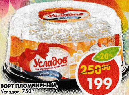
ТОРТ ПЛОМБИРНЫЙ, Усладов, 750 г