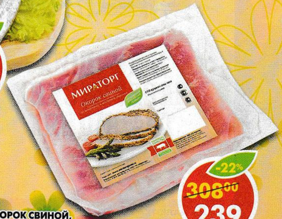
ОКОРОК СВИНОЙ, без кости, охлажденный, Мираторг, 1 кг