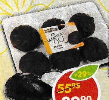
ЗЕФИР ШАРЛИЗ, ванильный глазированный, 240 г