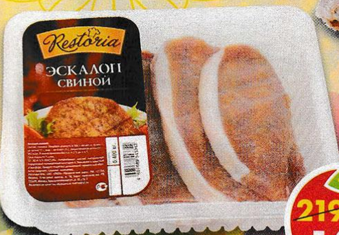
ЭСКАЛОП СВИНОЙ, охлажденный, Restoria, 400 г