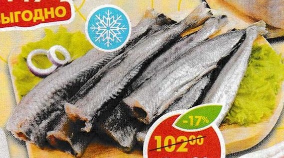
ПУТАССУ, неразделанная, замороженная, Наutilus, 800 г