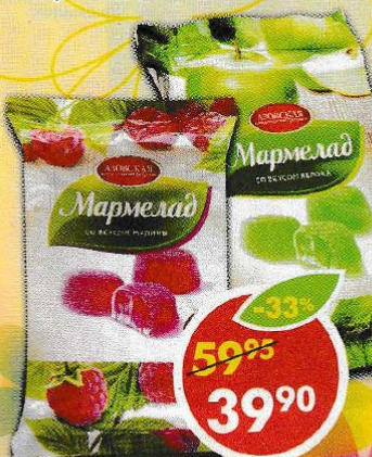
МАРМЕЛАД АЗОВСКАЯ КФ, малина; дыня; яблоко; лимон, 300 г