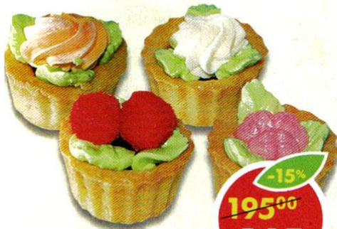
ПИРОЖНОЕ У ПАЛЫЧА, корзиночка, 280 г