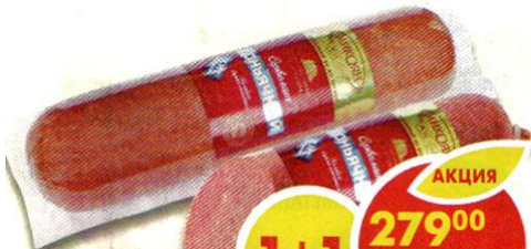
СЕРВЕЛАТ КОНЬЯЧНЫЙ , варено-копченый, Микоян, 500 г