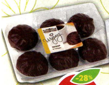
ЗЕФИР ШАРЛИЗ, ванильный глазированный, 240 г