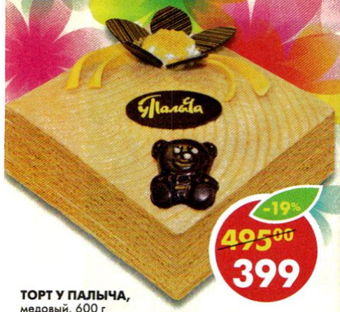
ТОРТ У ПАЛЫЧА, медовый, 600 г