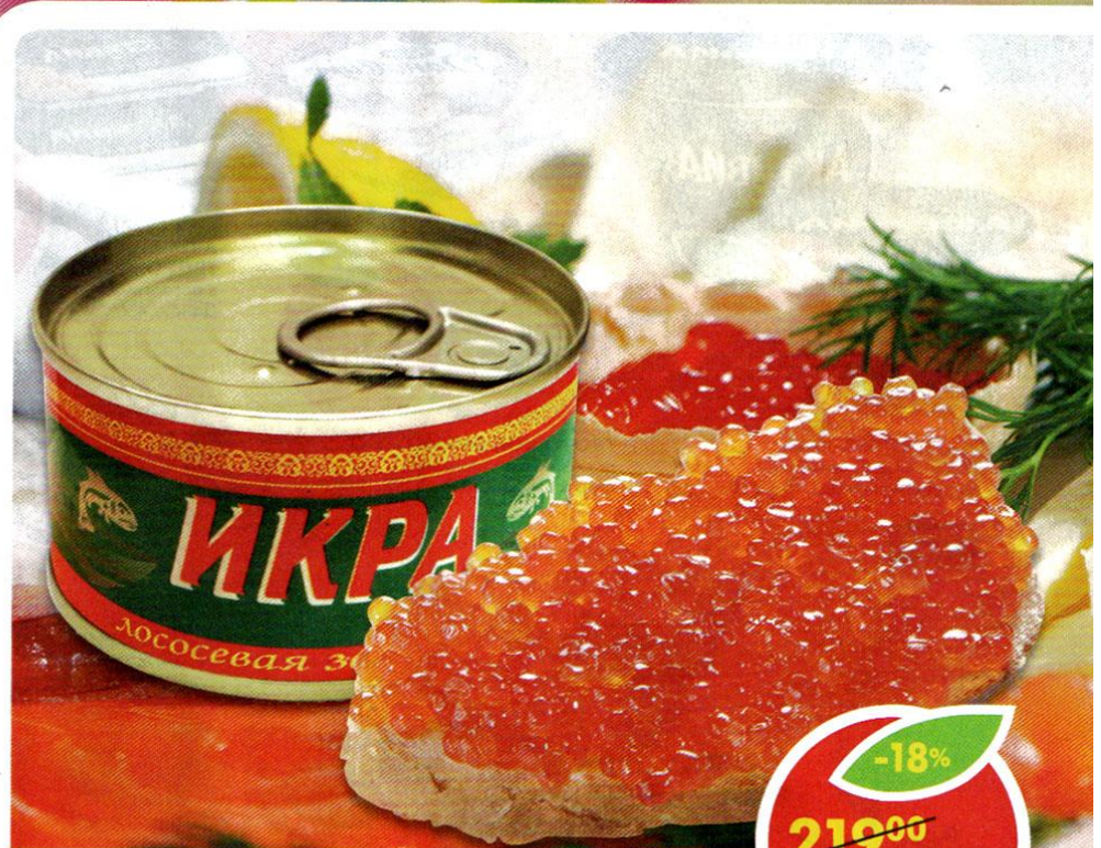
ИКРА , лососевая, 95 г