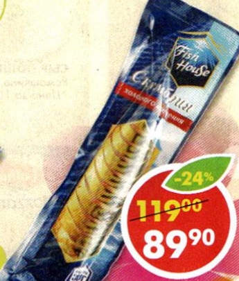
СКУМБРИЯ ХОЛОДНОГО КОПЧЕНИЯ , кусочки, Fish House, 300 г