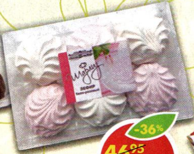
ЗЕФИР ШАРЛИЗ, бело-розовый, 180 г