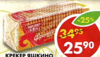
КРЕКЕР ЯШКИНО, французский с кунжутом, 185 г