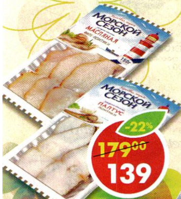
РЫБА МАСЛЯНАЯ; ПАЛТУС , ломтики, холодного копчения, Морской сезон, 150 г