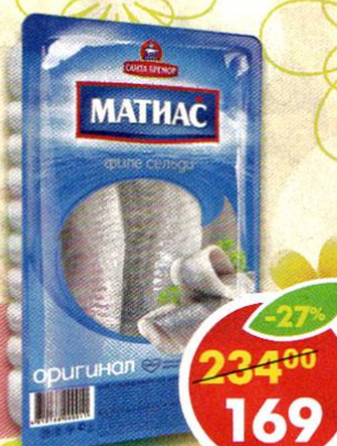
ФИЛЕ СЕЛЬДИ , оригинальное, Матнас, 500 г