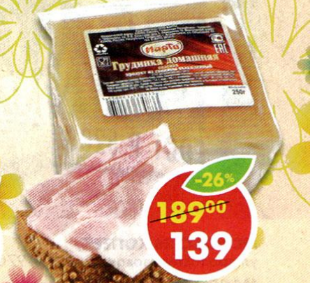
ГРУДИНКА МАРТИ , Домашняя, соленая, охлажденная, 250 г