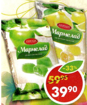
МАРМЕЛАД АЗОВСКАЯ КФ, малина; дыня; яблоко; лимон, 300 г