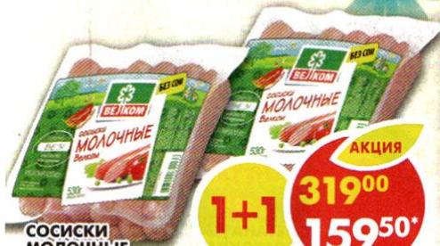
СОСИКИ МОЛОЧНЫЕ , Велком, 530 г