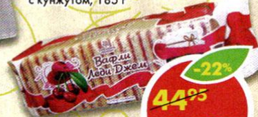
ВАФЛИ ЛЕДИ ДЖЕМ, вишня, 250 г