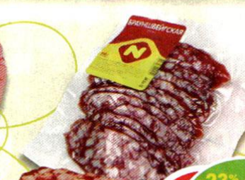
КОЛБАСА БРАУНШВЕЙГСКАЯ , сырокопченая, Останкино, 150 г