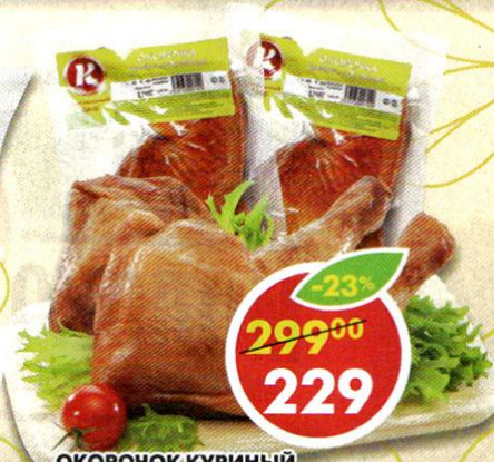
ОКОРОЧОК КУРИНЫЙ , варено-копченый, Коптильный двор, 1 кг