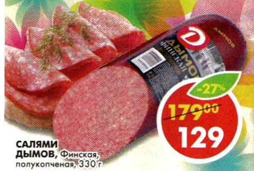
САЛЯМИ ДЫМОВ , Финская, полукопченая, 330 г