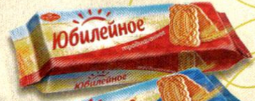
ПЕЧЕНЬЕ ЮБИЛЕЙНОЕ, витаминизированное, традиционное; молочное, 112 г