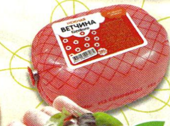
ВЕТЧИНА КОРОВИНО , из свиного окорока, 500 г