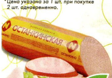
КОЛБАСА ОСТАНКИНСКАЯ , вареная, Останкино, 500 г

*Цена указана за 1 шт. при покупке 2 шт. одновременно.