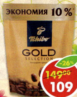
КОФЕ TCHIBO GOLD SELECTION, растворимый, 75 г