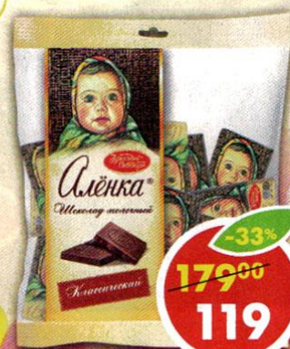
ШОКОЛАД АЛЕНКА, молочный, классический, Красный Октябрь, 210 г