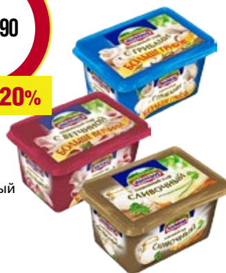
Сыр плавленый ХОХЛАНД • сливочный • с ветчиной • с грибами 400 г