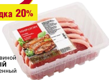
Стейк свиной СОЧНЫЙ охлажденный 500 г (Мираторг)