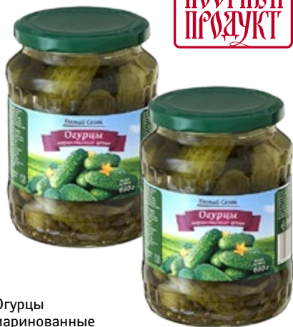
Огурцы маринованные ПЯТЫЙ СЕЗОН 720 мл