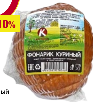
ФОНАРИК КУРИНЫЙ копчено-вареный 370 г