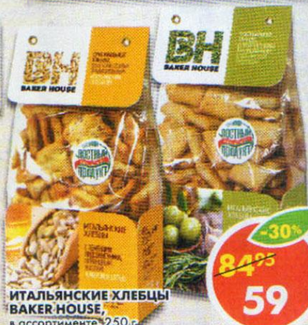
ИТАЛЬЯНСКИЕ ХЛЕБЦЫ BAKER HOUSE, в ассортименте, 250 г