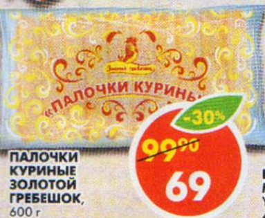
ПАЛОЧКИ КУРИНЫЕ ЗОЛОТОЙ ГРЕБЕШОК, 600 г