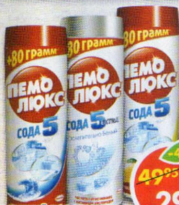
ЧИСТЯЩИЙ ПОРОШОК ПЕМОЛЮКС, лимон; морской бриз; ослепительно белый, 480 г