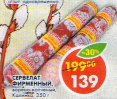
СЕРВЕЛАТ ФИРМЕННЫЙ, варено-копченый, Калинка, 350 г

*Цена указана за 1 шт. при покупке 2 шт. одновременно.