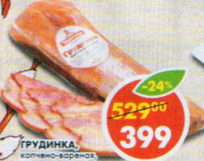
ГРУДИНКА, копчено-вареная, Щедрый вкус, 1 кг