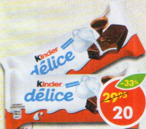
ПИРОЖНОЕ KINDER DELICE, бисквитное, какао с молочной мачинкой, 42 г