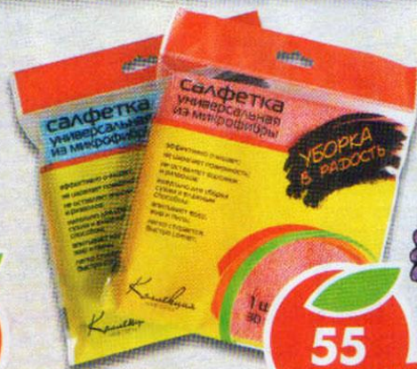
САЛФЕТКА МИКРОФИБРА, 30x30 см