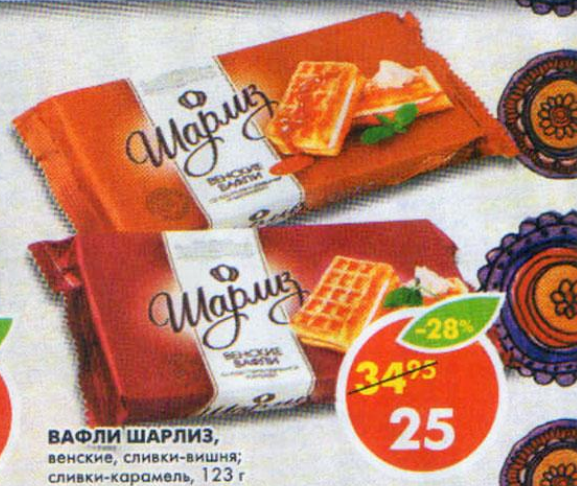
ВАФЛИ ШАРЛИЗ, венские, сливки-вишня; сливки-карамель, 123 г