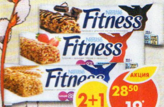
БАТОНЧИК NESTLE FITNESS, с цельными злаками и клубникой; с цельными злаками и шоколадом; с цельными злаками, 23,5 г