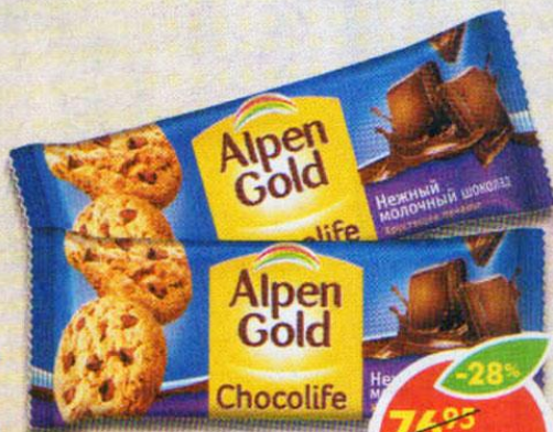
ПЕЧЕНЬЕ ALPEN GOLD CHOCOLIFE, с молочным шоколадом, 135 г