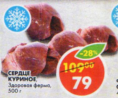
СЕРДЦЕ КУРИНОЕ, Здоровая ферма, 500 г