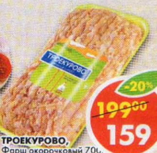
ТРОЕКУРОВО, Фарш окорочковый 700г.