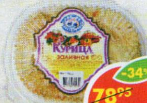
КУРИЦА ЗАЛИВНАЯ, 250 г