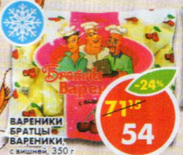
ВАРЕНИКИ БРАТЦЫ ВАРЕНИКИ, с вишней, 350 г