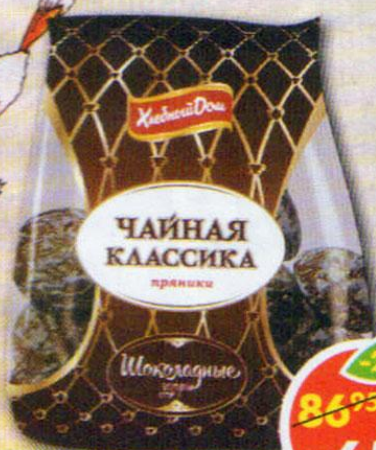
ПРЯНИКИ ХЛЕБНЫЙ ДОМ, шоколадные, 500 г