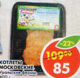
КОТЛЕТЫ МОСКОВСКИЕ, Уральские фермы, 400 г