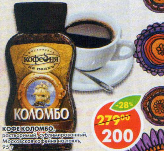
КОФЕ КОЛОМБО, растворимый, сублимированный, Московская кофейня на пахле, 95 г