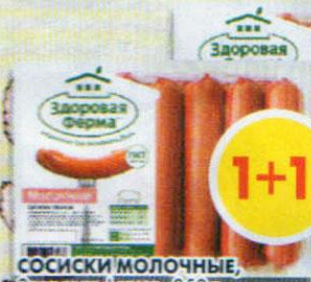
СОСИСКИ МОЛОЧНЫЕ, Здоровая ферма, 350 г