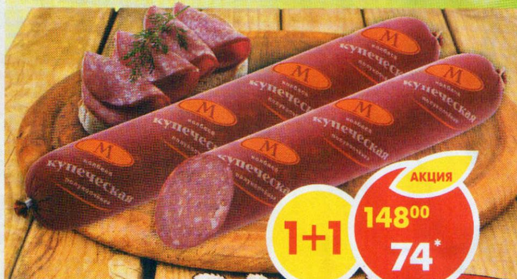
КОЛБАСА КУПЕЧЕСКАЯ, полукопченая, Микоян, 500 г