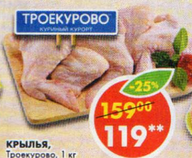
КРЫЛЬЯ, Троекурово, 1 кг