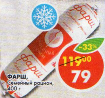
ФАРШ, Семейный рацион, 400 г