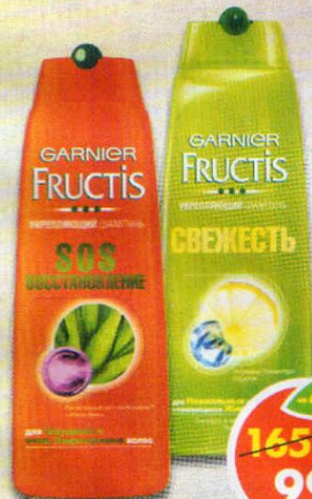
ШАМПУНЬ FRUCTIS, свежесть; sos восстановление, Garnier, 400 мл