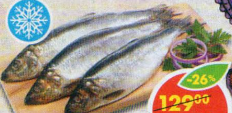
СЕЛЬДЬ, 1 кг