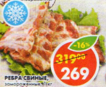
РЕБРА СВИНЫЕ, замороженные, 1 кг