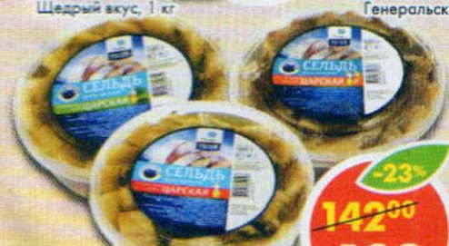
СЕЛЬДЬ ЦАРСКАЯ, в масле, в укропном соусе; Сдымком, Тесей, 500 г