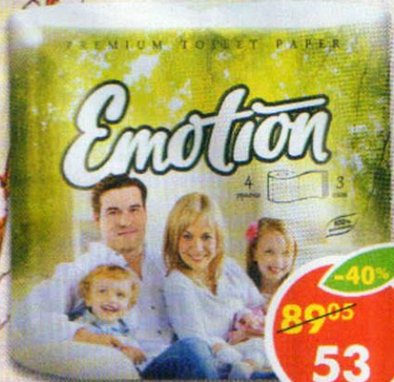
ТУАЛЕТНАЯ БУМАГА ЭМОТИОН, 3 слоя, 4 рулона