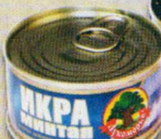
ИКРА ЛУКОМОРЬЕ, минтай; треска, 130 г