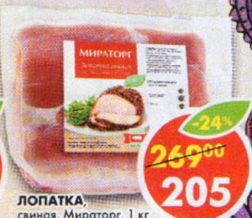
ЛОПАТКА, свинья, Мираторг, 1 кг