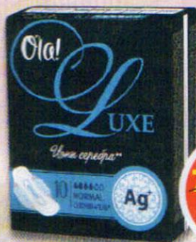
ПРОКЛАДКИ OLA! NORMAL, ионы серебра, 10 шт.