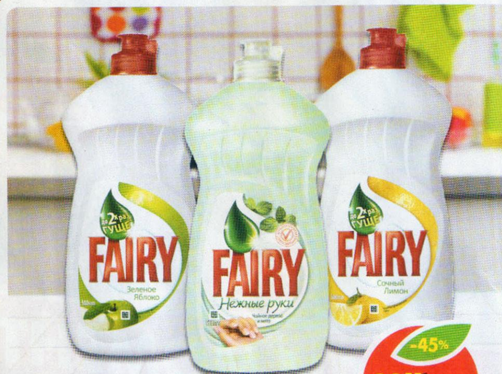
МОЮЩЕЕ СРЕДСТВО FAIRY, лимон; нежные руки; зеленое яблоко, 500 мл