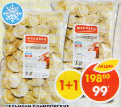
ПЕЛЬМЕНИ ДАНИЛОВСКИЕ, Мясовед, 900 г

*Цена указана за 1 шт. при покупке 2 шт. одновременно.