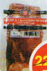
ШЕЙКА КОРОЛЕВСКАЯ, сырокопченая, Велес, 150 г