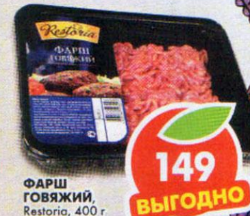
ФАРШ ГОВЯЖИЙ, Restoria, 400 г