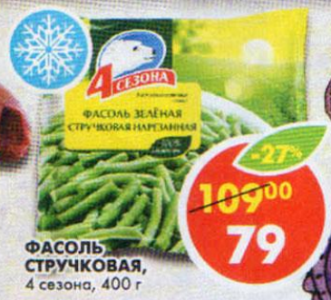
ФАСОЛЬ СТРУЧКОВАЯ, 4 сезона, 400 г