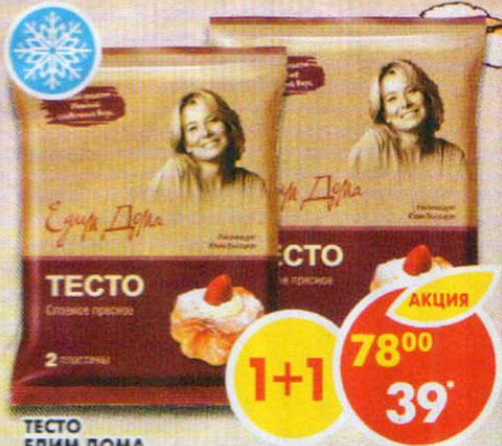
ТЕСТО ЕДИМ ДОМА, слоеное, пресное, 450 г