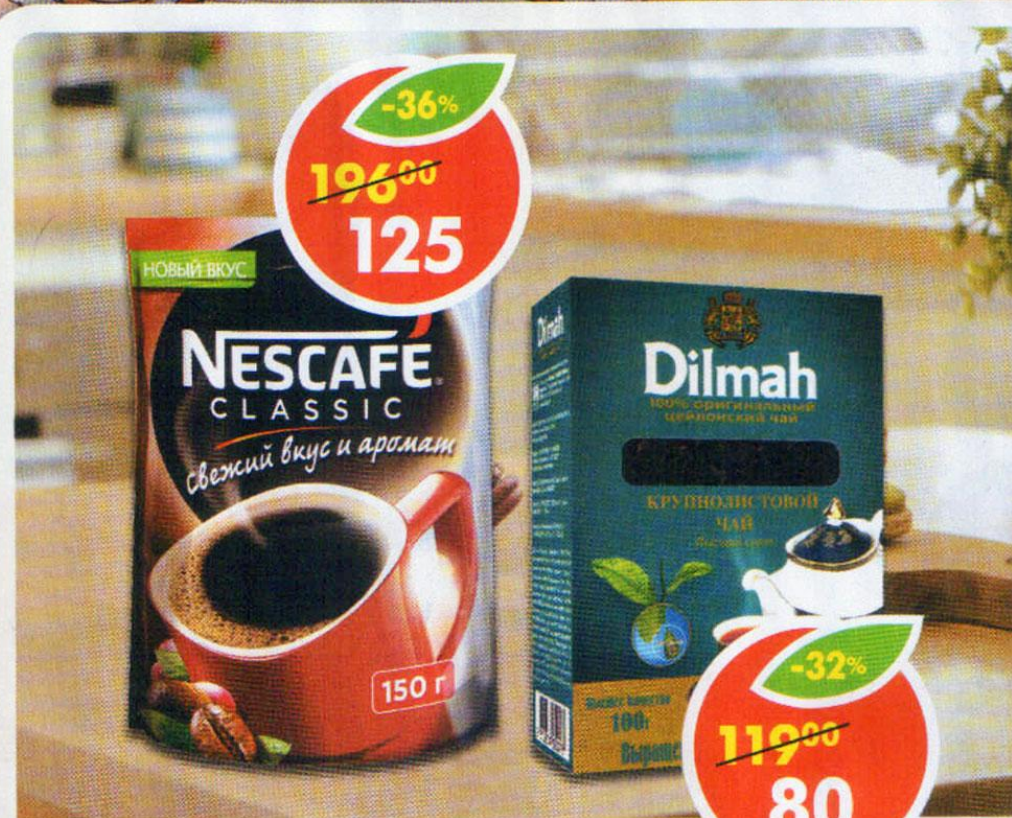
КОФЕ NESCAFE CLASSIC, натуральный, растворимый, 150 г ЧАЙ DILMAH, цейлонский, черный, крупнолистовой, 100 г