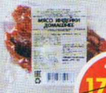
МЯСО ИНДЕЙКИ, варено-копченое, Копченов, 400 г