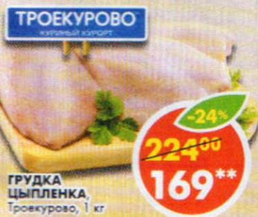
ГРУДКА ЦЫПЛЕНКА, Троекурово, 1 кг