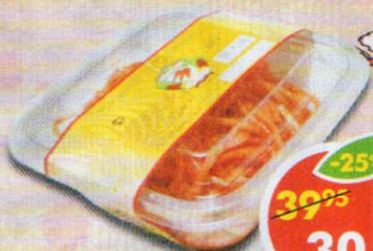
МОРКОВЬ ПО-КОРЕЙСКИ, Кореяна, 200 г