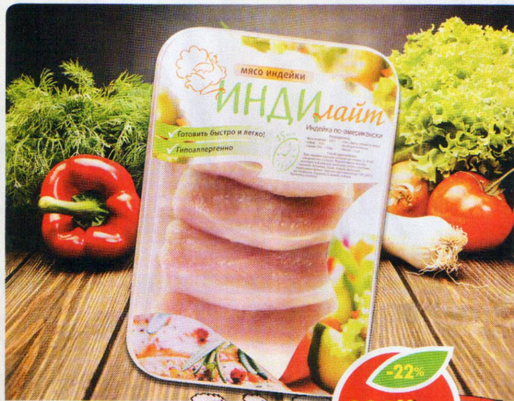
СТЕЙК ГРУДКИ, Индимайт, 700 г