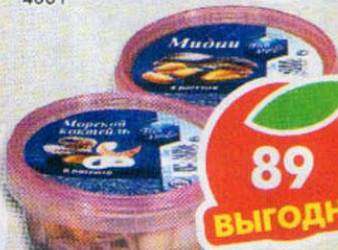
КОКТЕЙЛЬ FISH HOUSE, из морепродуктов, в рассоле, 300 г; МИДИИ FISH HOUSE, в рассоле, 300 г