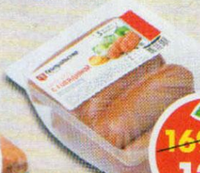
САРДЕЛЬКИ КЛАССИЧЕСКИЕ, с говядиной, Генеральские колбасы, 450 г