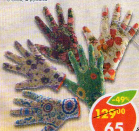
ПЕРЧАТКИ САДОВЫЕ, р. М-Л