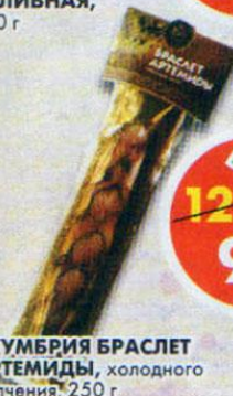
СКУМБРИЯ БРАСЛЕТ АРТЕМИДЫ, холодного копчения, 250 г