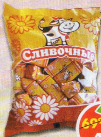
КОНФЕТЫ СЛИВОЧНЫЕ, 400 г