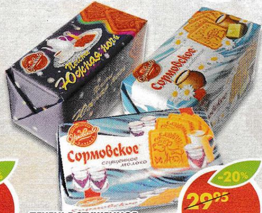
ПЕЧЕНЬE СТУЩЕННОЕ МОЛОКО; СЛИВОЧНОЕ; ЮЖНАЯ НОЧЬ, Сормовская КФ, 200 г