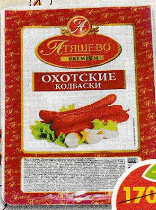
КОЛБАСКИ ОХОТСКИЕ, полукопченые, Атяшево, 500 г