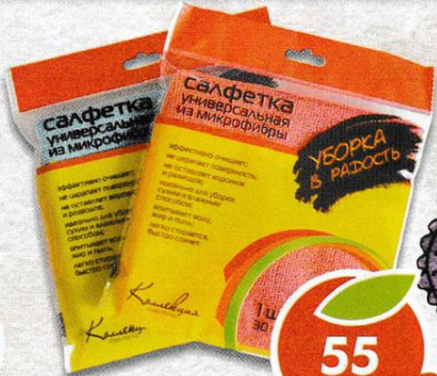
САЛФЕТКА МИКРОФИБРА, 30x30 см