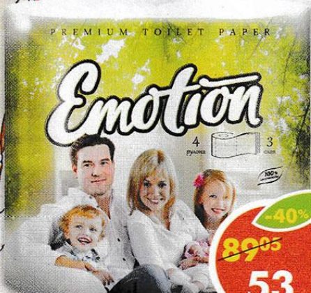
ТУАЛЕТНАЯ БУМАГА ЭМОТИОН, 3 слоя, 4 рулона