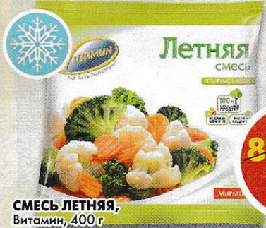
СМЕСЬ ЛЕТНЯЯ, Витамин, 400 г