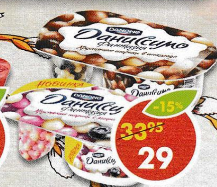
ЙОГУРТ ДАНИССИМО , хрустящие шарики, в шоколадной глазури; хрустящие шарики, ягодный вкус, Данон, 6,9%, 105 г