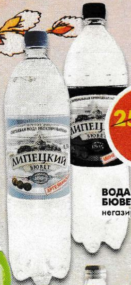
ВОДА ЛИПЕЦКИЙ БЮЕТ , газированная; негазированная, 1,5 л