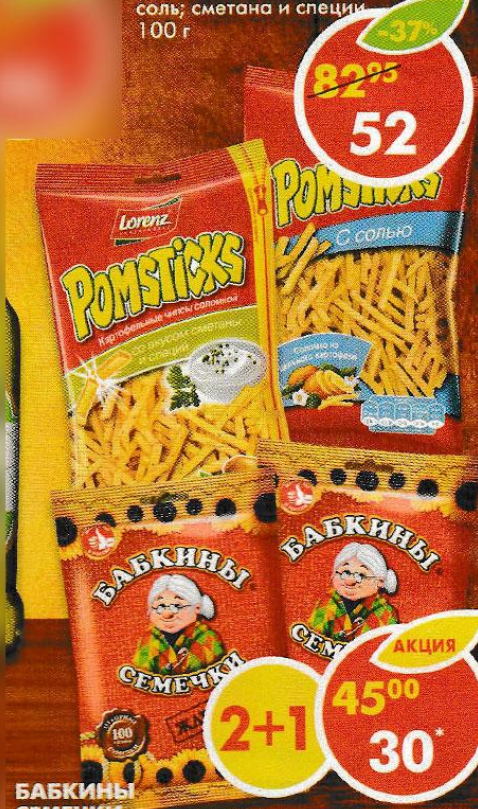
ЧИПСЫ POMSTICKS , соль; сметана и специи, 100 г