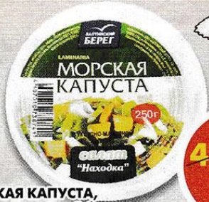
МОРСКАЯ КАПУСТА, находка; Балтийский берег, 250 г