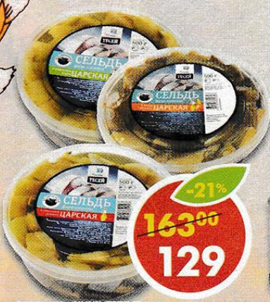
СЕЛЬДЬ ЦАРСКАЯ, в масле; в укропном соусе; с дымком, Тесей, 500 г