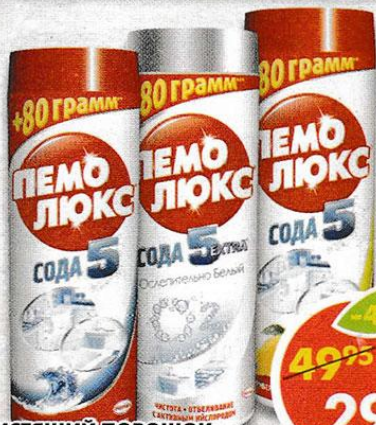
ЧИСТЯЩИЙ ПОРОШОК ПЕМОЛЮКС, лимон; морской бриз; ослепительно белый, 480 г