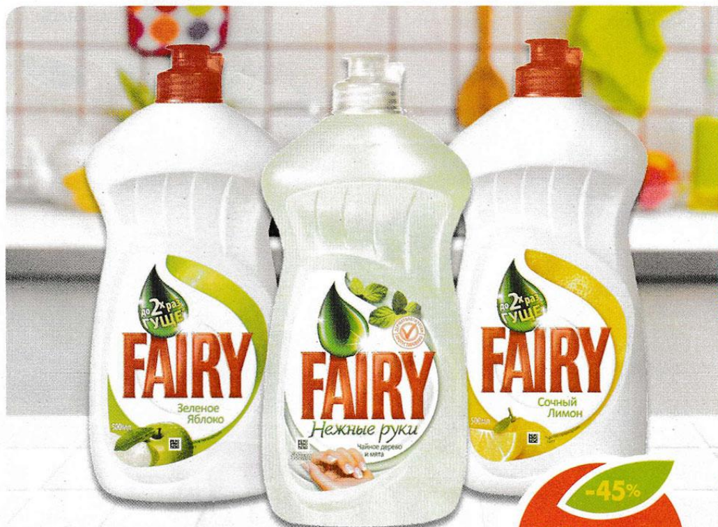
МОЮЩЕЕ СРЕДСТВО FAIRY, лимон; нежные руки; зеленое яблоко, 500 мл