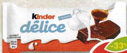
ПИРОЖНОЕ KINDER DELICE, бисквитное, какао с молочной начинкой, 42 г