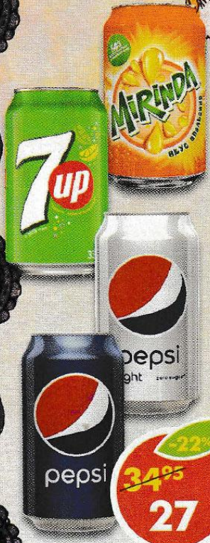
НАПИТОК , Пепси-Кола; Пепси-Лайт; Сeven-Ап; Миринда Оранж, 0,33 л