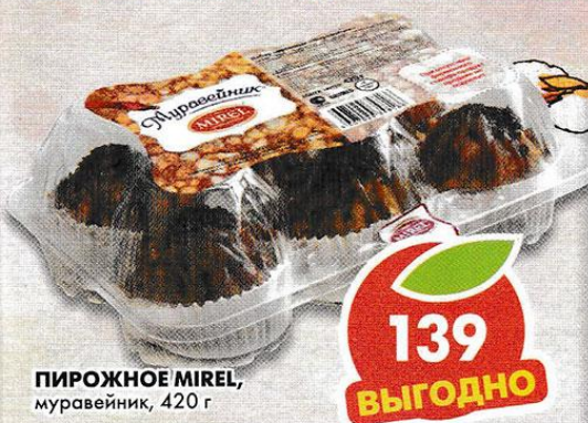
ПИРОЖНОЕ MIREL, муравейник, 420 г