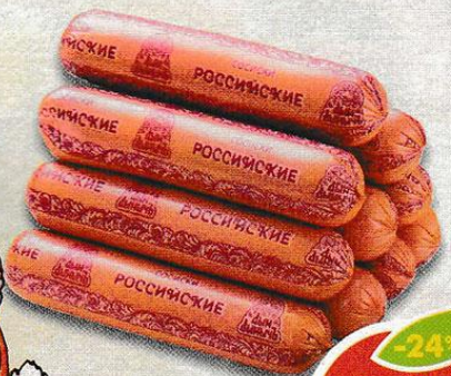
СОСИСКИ РОССИЙСКИЕ, Дымь Дымьч, 500 г * Предложение не действует в Иваново