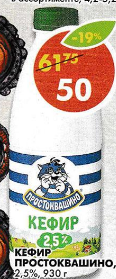
КЕФИР ПРОСТОКВАШИНО , 2,5%, 930 г