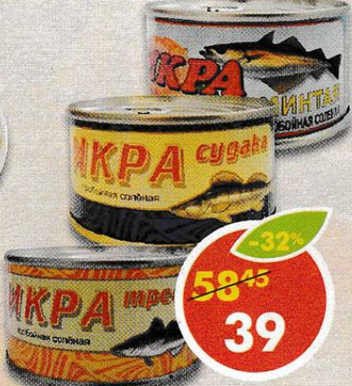
ИКРА МИНТАЯ; ТРЕСКИ; СУДАКА, Авистрон, 120 г