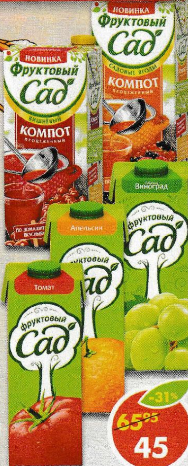
СОКИ И НЕКТАРЫ; КОМПОТ ФРУКТОВЫЙ САД , в ассортименте, 950 мл