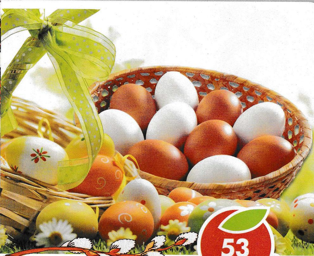
ЯЙЦО КУРИНОЕ , столовое С1, 10 шт.