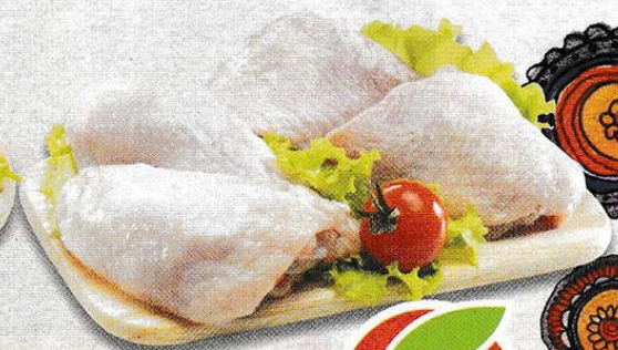
БЕДРО КУРИНОЕ, охлажденное, 1 кг