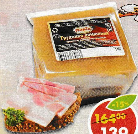
ГРУДИНКА ДОМАШНЯЯ, соленая, Марти, 250 г