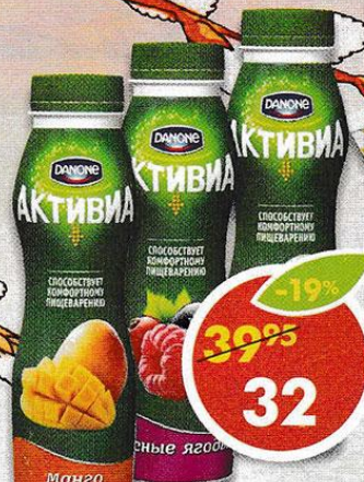
ЙОГУРТ ПИТЬЕВОЙ АКТИВИА , в ассортименте, Danone, 2-2,1%, 290 г