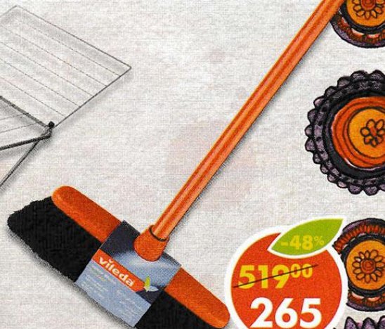
ШВАБРА- МЕТЛА, Vileda