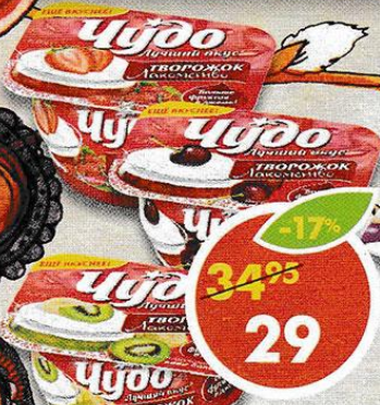
ТВОРОЖОК ЧУДО , в ассортименте, 4,2-5,2%, 100 г