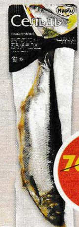
СЕЛЬДЬ, слабосоленая, Марти, 300 г