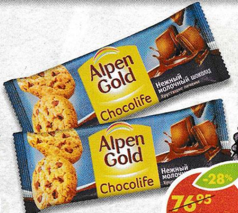
ПЕЧЕНЬE ALPEN GOLD CHOCOLIFE, с молочным шоколадом, 135 г