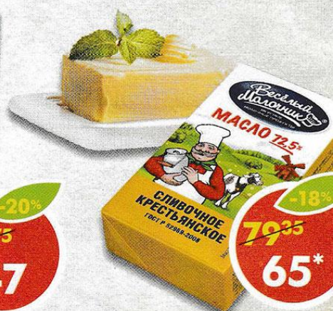
МАСЛО СЛИВОЧНОЕ ВЕСЕЛЫЙ МОЛОЧНИК , 72,5%, 180 г