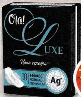
ПРОКЛАДКИ OLA! NORMAL, ионы серебра, 10 шт.