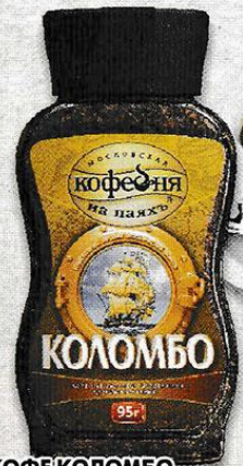
КОФЕ КОЛОМБО, растворимый, сублимированный, Московская кофейня на пахья, 95 г