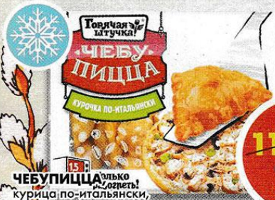
ЧЕБУПИЦА альо, допеть, курица по-итальянски, Горячая штучка, 250 г