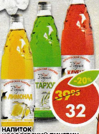
НАПИТОК КОРОЛЕВСКИЙ ПИНГВИН , груша; лимонад; тархун; мохито; клубника, безалкогольный, 0,5 л