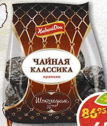
ПРЯНИКИ ХЛЕБНЫЙ ДОМ, шоколадные, 500 г;