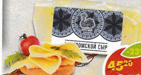
СЫР КОСТРОМСКИЙ , Русское молоко, фасованный *Цена указана за 100 г