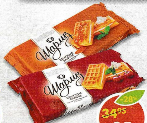
ВАФЛИ ШАРЛИЗ, венские, сливки-вишня; сливки-карамель, 123 г