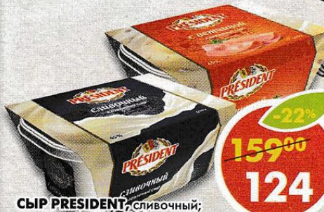
СЫР PRESIDENT , сливочный; с ветчиной, 45%, 400 г