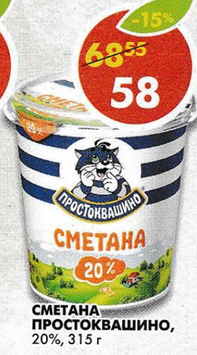
СМЕТАНА ПРОСТОКВАШИНО , 20%, 315 г