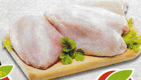
ГРУДКА КУРИНАЯ, охлажденная, 1 кг