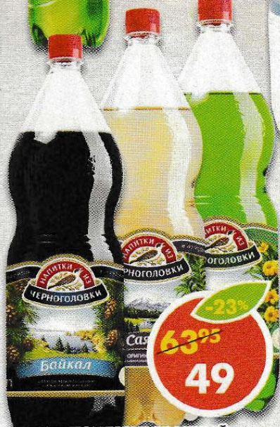
НАПИТОК ГАЗИРОВАННЫЙ ЧЕРНОГОЛОВКА , саяны; тархун; байкал; дюшес, 2 л