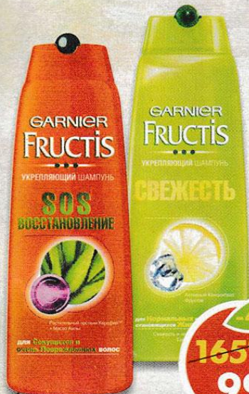
ШАМПУНЬ FRUCTIS, свежесть; sos восстановление, Garnier, 400 мл