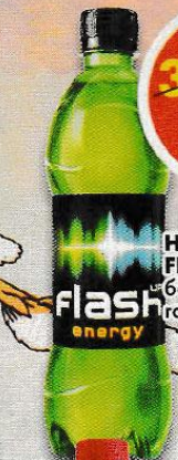
НАПИТОК FLASH ENERGY , безалкогольный, газированный, 0,5 л