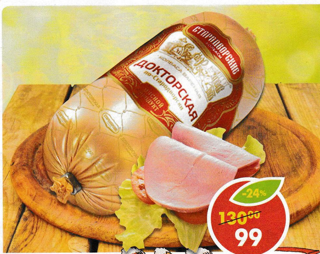
КОЛБАСА ДОКТОРСКАЯ ПО-СТАРОДВОРСКИ, 500 г