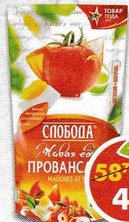
МАЙОНЕЗ ПРОВАНСАЛЬ , Слобода, 67%, 450 мл