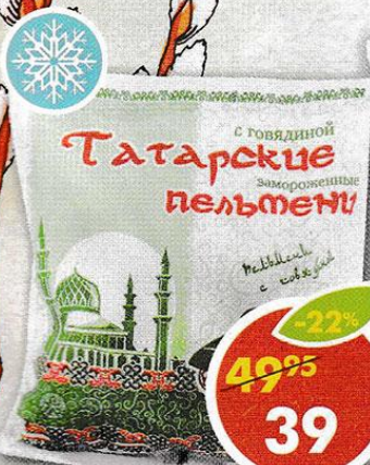
ПЕЛЬМЕНИ ТАТАРСКИЕ, с говядиной, 400 г