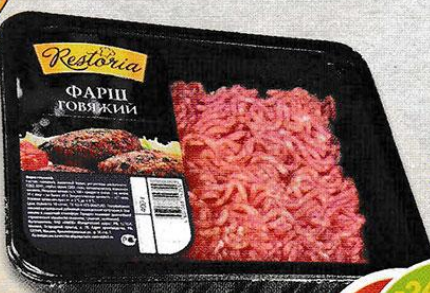
ФАРШ ГОВЯЖИЙ, охлажденный, Restoria, 400 г