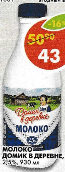
МОЛОКО ДОМИК В ДЕРЕВНЕ , 2,5%, 930 мл