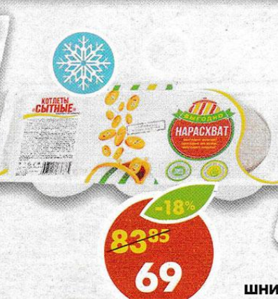
КОТЛЕТЫ СЫТНЫЕ, Нарасхват, 360 г