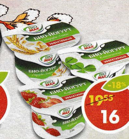
ЙОГУРТ BIO-MAX , натуральный; клубника; отруби-злаки, 2,5-3,1%, 115 г