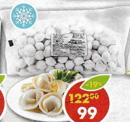
ПЕЛЬМЕНИ ИВАН ДА МАРЬЯ, 1 кг