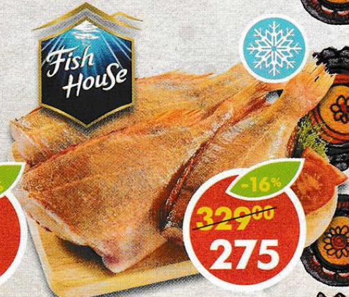
ОКУНЬ, морской, тушка, Fish House, 1 кг