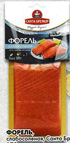
ФОРЕЛЬ, слабосоленая, Санта Бремор, 170 г