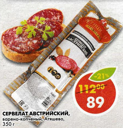
СЕРВЕЛАТ АВСТРИЙСКИЙ, варено-копченый, Атяшево, 350 г