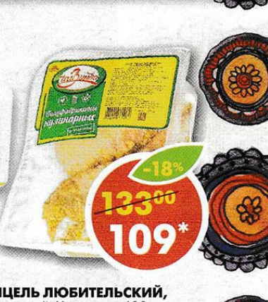
ШНИЦЕЛЬ ЛЮБИТЕЛЬСКИЙ, охлажденный, Чамзинка, 600 г *Предложение не действует в Респ. Чувашия и Марий-Эл