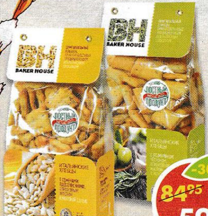
ИТАЛЬЯНСКИЕ ХЛЕБЦЫ BAKER HOUSE, в ассортименте, 250 г