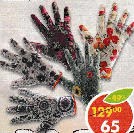
ПЕРЧАТКИ САДОВЫЕ, р. М-Л