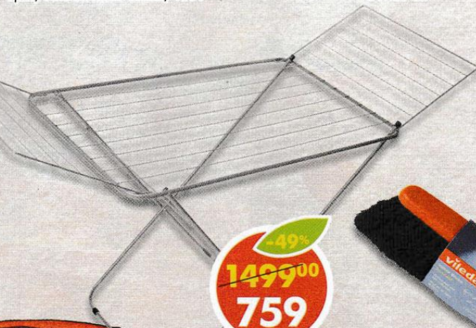
СУШИЛКА ДЛЯ БЕЛЬЯ НПТ, Dorado