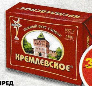
СПРЕД КРЕМЛЕВСКИЙ , 72,5%, 180 г