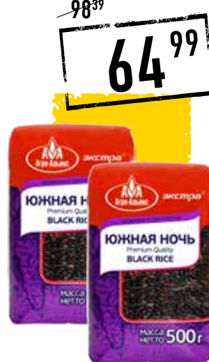
РИС ЧЕРНЫЙ ЮЖНАЯ НОЧЬ АГРО-АЛЬЯНС, 500 г