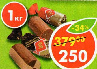
КОНФЕТЫ БАТОНЧИКИ; БАТОНЧИКИ, сливочно-шоколадные, РотФронт, 1 кг