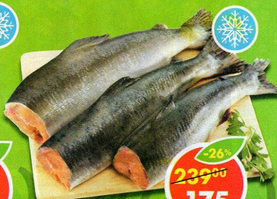
ГОРБУША, 1 кг