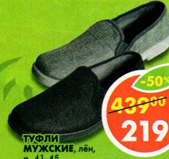
ТУФЛИ МУЖСКИЕ, лён, р. 41-45