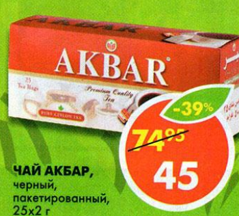
ЧАЙ АКБАР, черный, пакетированный, 25x2 г