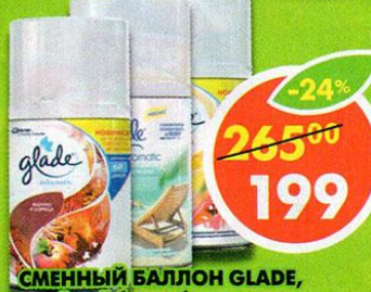
СМЕННЫЙ БАЛЛОН GLADE, гавайский бриз; яблоко и корица; океанский оазис 269 мл