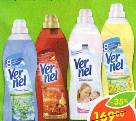
КОНДИЦИОНЕР ДЛЯ БЕЛЬЯ VERNEL, свежесть летнего утра; ароматерапия чувственности; детский; свежий бриз; ароматерапия безмятежности, 1 л