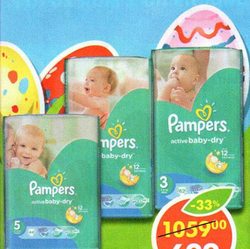
ПОДГУЗНИКИ PAMPERS, Active baby-dry, Midi, 62 шт.; Maxi, 54 шт.; Junior, 44 шт.