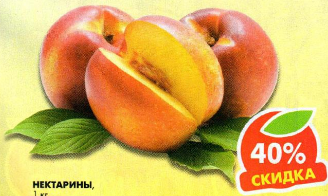
НЕКТАРИНЫ, 1 кг