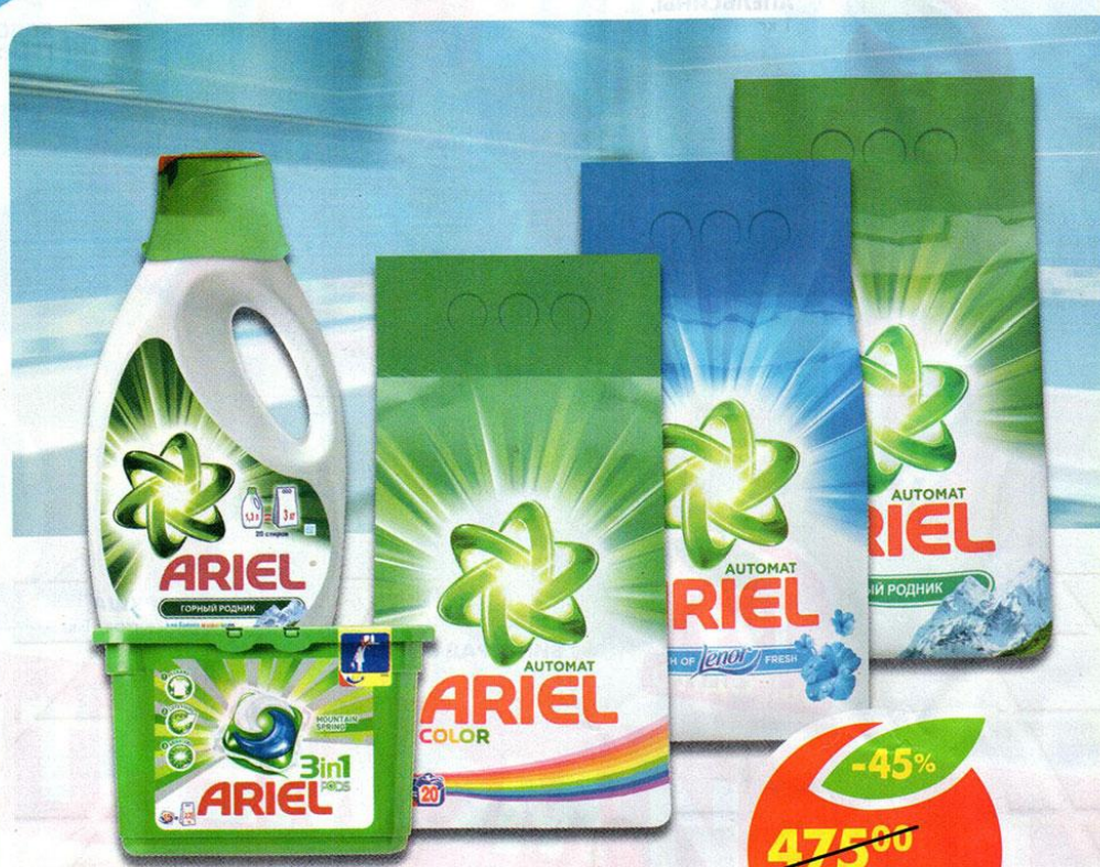
СРЕДСТВА ДЛЯ СТИРКИ ARIEL, кolor; ленор эффект; горный родник, 3 кг; горный родник, 15x28,8 г; горный родник 1,3 л