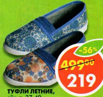
ТУФЛИ ЛЕТНИЕ, лён, р. 37-40