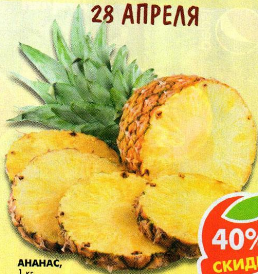
АНАНАС, 1 кг