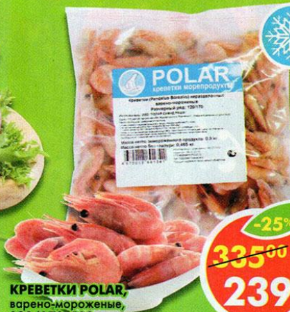
КРЕВЕТКИ POLAR, варено-мороженные, 120/170, 500 г