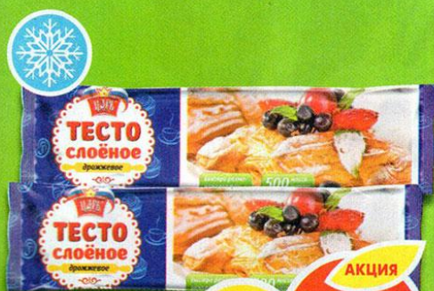
ТЕСТО ЦАРЬ, слоёное, дрожжевое, 500 г