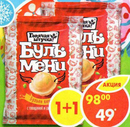
ПЕЛЬМЕНИ БУЛЬМЕНИ, говядина-свинина, Горячая штучка, 430 г