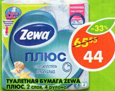
ТУАЛЕТНАЯ БУМАГА ZEWA ПЛЮС, 2 слоя, 4 рулона

*Цена указана за 1 шт. при покупке 2 шт. одновременно.