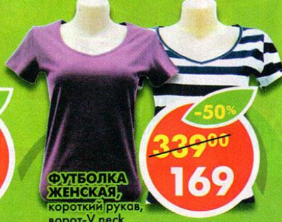
ФУТБОЛКА ЖЕНСКАЯ, короткий рукав, ворот-V neck