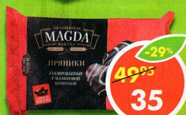
ПРЯНИКИ MAGDA, заварные, глазированные, с малиновой начинкой, 220 г