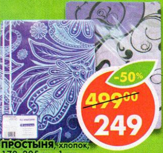
ПРОСТЫНЯ, хлопок, 170x205 см., 1 шт.