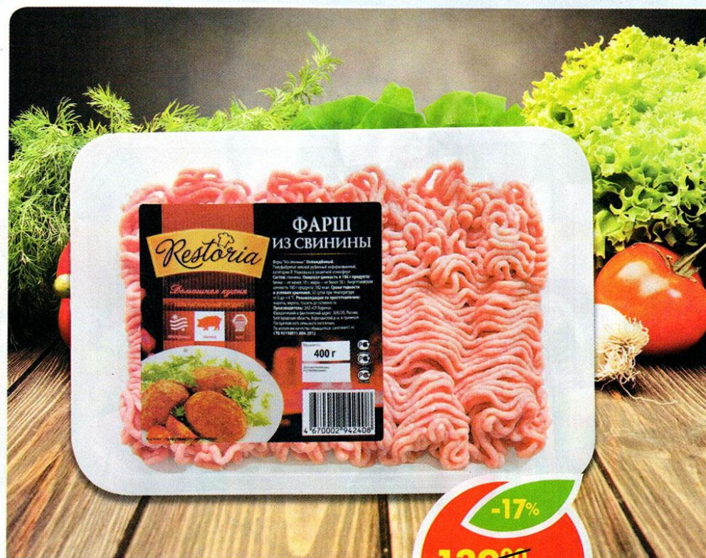
ФАРШ, из свинины, Restoria, 400 г