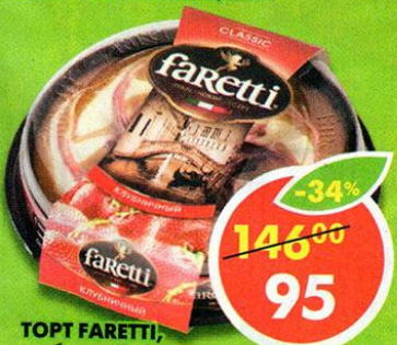
ТОРТ FARETTI, клубничный, 400 г