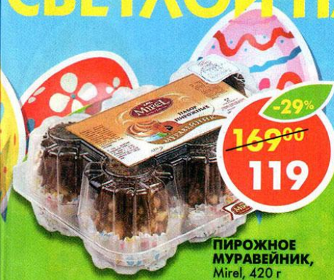
ПИРОЖНОЕ МУРАВЕЙНИК, Mirel, 420 г