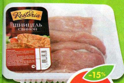
ШНИЦЕЛЬ, свиной, Restoria, 500 г

*Цена указана за 1 шт. при покупке 2 шт. одновременно.