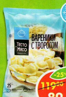
ВАРЕНИКИ, с творогом, 450 г