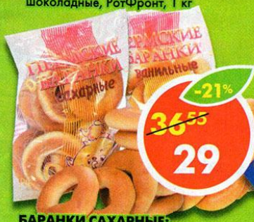
БАРАНКИ САХАРНЫЕ; ВАНИЛЬНЫЕ; МАКОВА, 400 г