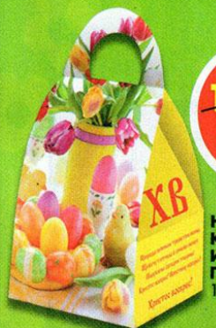
НАБОР КОНДИТЕРСКИХ ИЗДЕЛИЙ СВЕТАЯ ПАСХА, Свит презент, 120 г