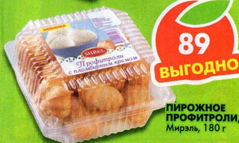
ПИРОЖНОЕ ПРОФИТРОЛИ, Мирэль, 180 г