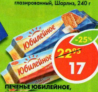
ПЕЧЕНЬЕ ЮБИЛЕЙНОЕ, витаминизированное, традиционное, молочное, 112 г