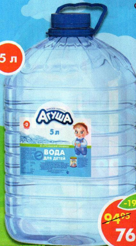
ВОДА АГУША*, для детей, 5 л