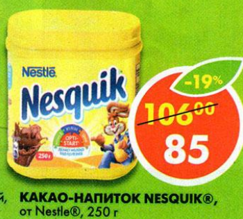
КАКАО-НАПИТОК NESQUIK®, от Nestle®, 250 г