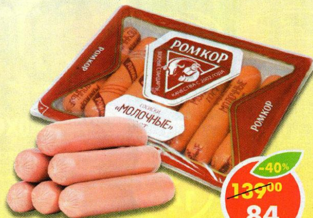
СОСИСКИ МОЛОЧНЫЕ, Ромкор, 350 г

Предложение действительно с первого дня акции в 2016 г. Количество товара ограничено. Акция проходит не во всех магазинах торговой сети. Все товары имеют необходимые сертификаты. Изображение товаров может отличаться от представленных в магазине «Пятёрочка». Все цены указаны в рублях. В течение проведения акции цена может быть дополнительно снижена относительно заявленной в рекламе. Подробности в магазине «Пятёрочка» и на сайте www.pyaterochka.ru . Реклама.