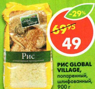
РИС GLOBAL VILLAGE , попаренный, шлифованный, 900 г