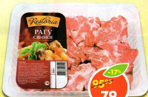
ПАГУ, свиное, Restoria, 500 г