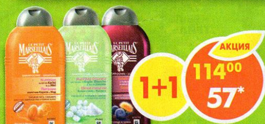
ШАМПУНЬ LE PETIT MARSEILLAIS, молочко карите и мёд, для сухих волос; белая глина и жасмин, для жирных волос; голубика и масло, 250 мл