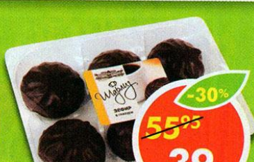
ЗЕФИР, ванильный, глазированный, Шарлиз, 240 г