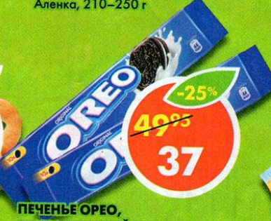
ПЕЧЕНЬЕ OREO, с какао и начинкой с ванильным вкусом, 95 г