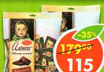
КОНФЕТЫ, ШОКОЛАД, Аленка, 210–250 г