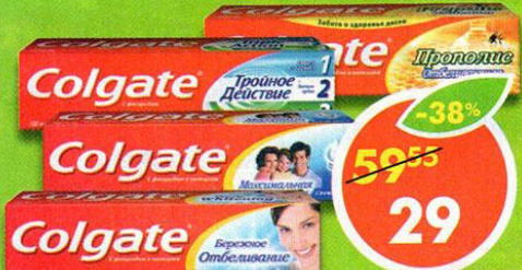
ЗУБНАЯ ПАСТА COLGATE, тройное действие; прополис, отбеливающая; защита от кариеса, свежая мята; бережное отбеливание, 100 мл