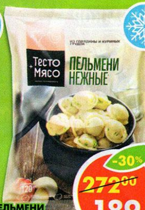
ПЕЛЬМЕНИ НЕЖНЫЕ, Калинка, 800 г