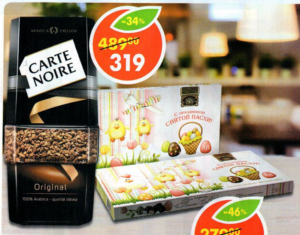
КОФЕ CARTE NOIRE, натуральный, растворимый, 95 г КОНФЕТЫ ПТИЧЬЕ ВОЛШЕБСТВО, Самарский кондитер, 250 г