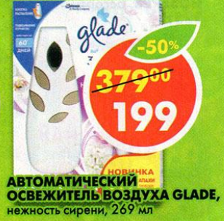
АВТОМАТИЧЕСКИЙ ОСВЕЖИТЕЛЬ ВОЗДУХА GLADE, нежность сирени, 269 мл