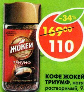
КОФЕ ЖОКЕЙ ТРИУМФ, натуральный, растворимый, 95 г