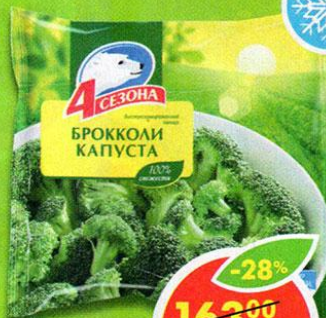
КАПУСТА БРОККОЛИ, 4 СЕЗОНА, 400 г