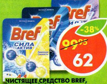
ЧИСТЯЩЕЕ СРЕДСТВО BREF, лимонная свежесть; с хлор-компонентом; свежесть лаванды, 50-51 г