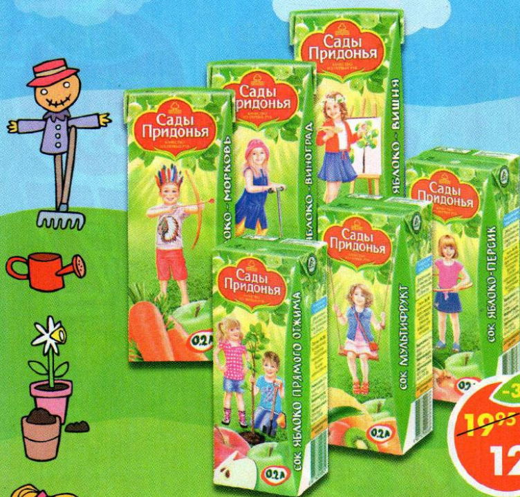
СОК САДЫ ПРИДОНЬЯ, ЯБЛОКО-ПЕРСИК; ЯБЛОКО-МОРКОВЬ*, в ассортименте**, 0,2 л

*Сведения о возрастных ограничениях смотрите на индивидуальной упаковке. Перед началом прикорма проконсультируйтесь со специалистом.