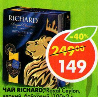
ЧАЙ RICHARD, Royal Ceylon, черный, байховый, 100x2 г