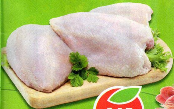
ГРУДКА КУРИНАЯ, охлажденная, 1 кг