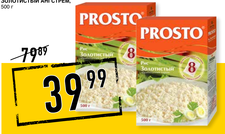
РИС PROSTO НАЦИОНАЛЬ ЗОЛОТИСТЫЙ АНГСТРЕМ, 500 г