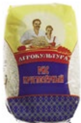
РИС круглозерный 800 г