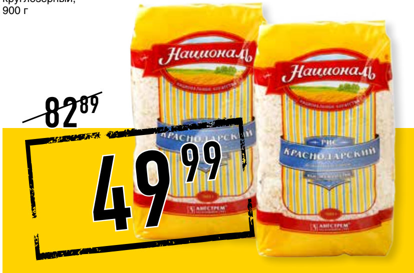
РИС КРАСНОДАРСКИЙ НАЦИОНАЛЬ, круглозерный, 900 г

ФАСОЛЬ БЕЛАЯ АНГСТРЕМ, калиброванная, отборная, 450 г