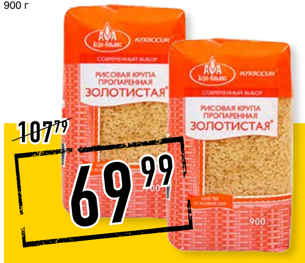
РИС ЗОЛОТИСТЫЙ АГРО-АЛЬЯНС, пропаренный, 900 г

ЛАПША БЫСТРОГО ПРИГОТОВЛЕНИЯ DOSHIRAK СЫТНЫЙ ОБЕД, с аппетитным соусом из говядины, 110 г