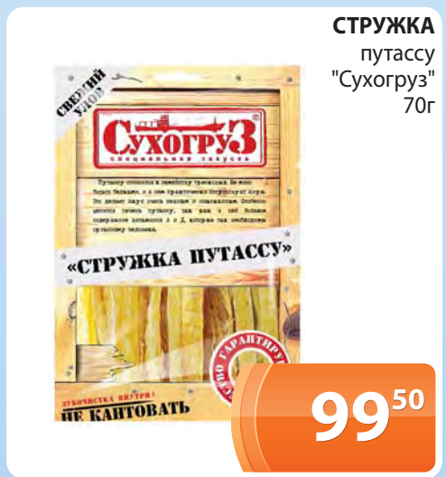
СТРУЖКА путассу "Сухогруз" 70г