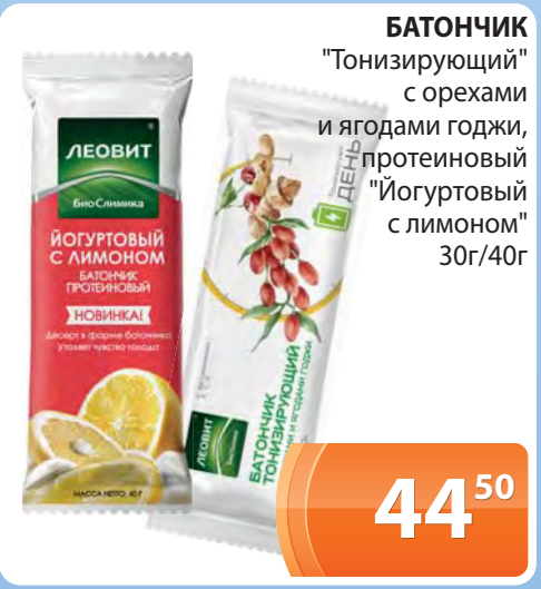
БАТОНЧИК "Тонизирующий" с орехами и ягодами годжи, протеиновый "Йогуртовый" с лимоном 30г/40г