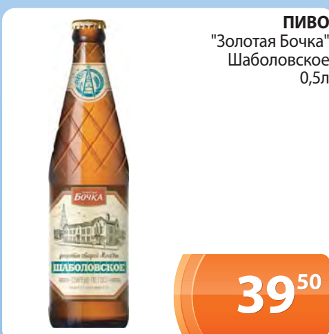
ПИВО "Золотая Бочка" Шаболовское 0,5л