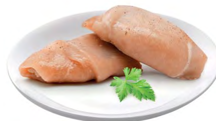
РУЛЕТ куриный с сыром 100г