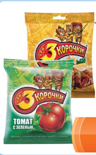
СУХАРИКИ ржаные "Три Корочки" с томатом и зеленью, с холодцом и хреном 100г