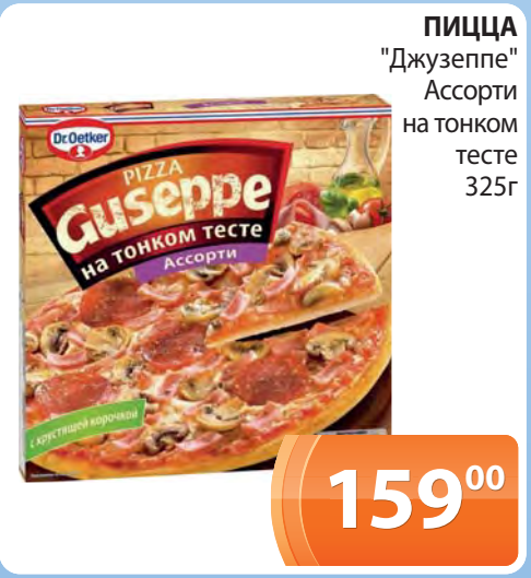
ПИЦЦА "Джузеппе" Ассорти на тонком тесте 325г