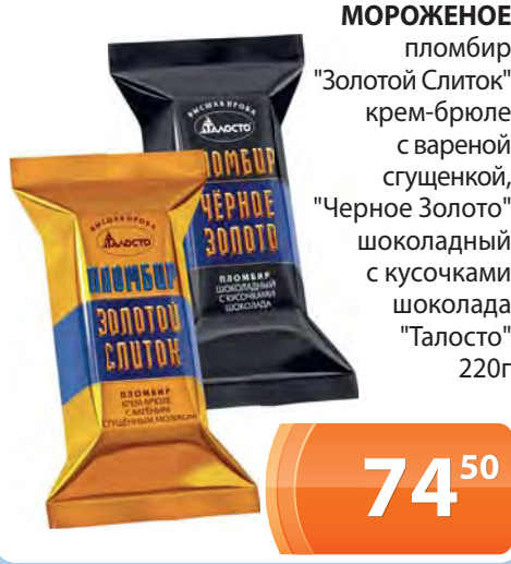
МОРОЖЕНОЕ пломбир "Золотой Слиток" крем-брюле с вареной сгущенкой, "Черное Золото" шоколадный с кусочками шоколада "Талосто" 220г