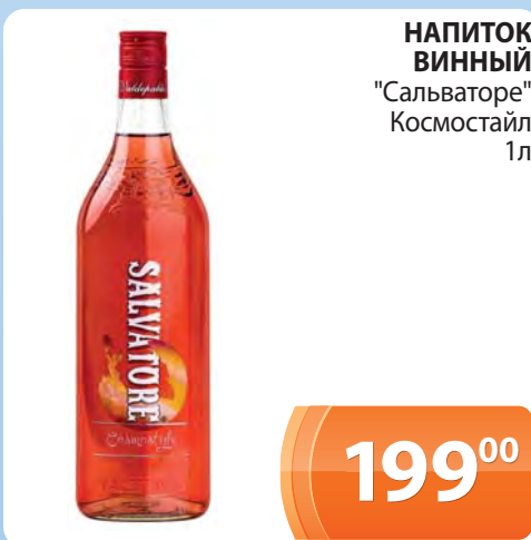
НАПИТОК ВИННЫЙ "Сальваторе" Космостайл 1л