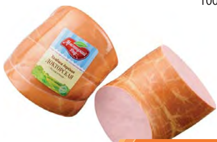
КОЛБАСА Докторская в синюге "Мясницкий ряд" 100г