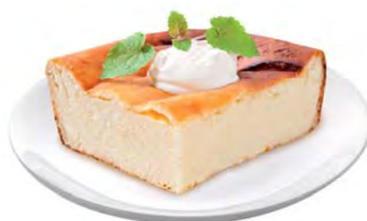
ЗАПЕКАНКА из творога 100г