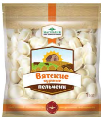
ПЕЛЬМЕНИ Вятские "Магнолия" 1000г