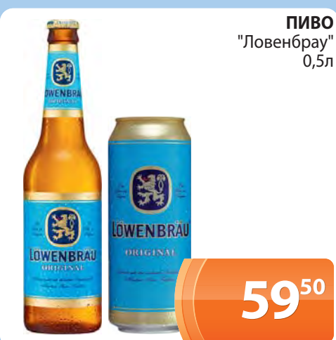
ПИВО "Ловенбрау" 0,5л