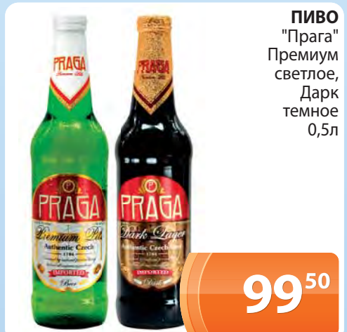
ПИВО "Прага" Премиум светлое, Дарк темное 0,5л