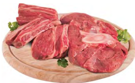
ГОВЯДИНА на кости охлажденная 100г