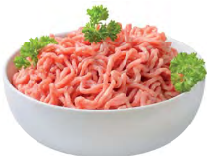
ФАРШ "Домашний" 100г