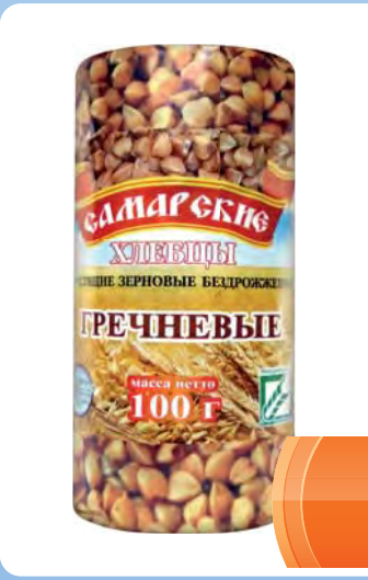
ХЛЕБЦЫ "Самарские" зерновые из гречки 100г