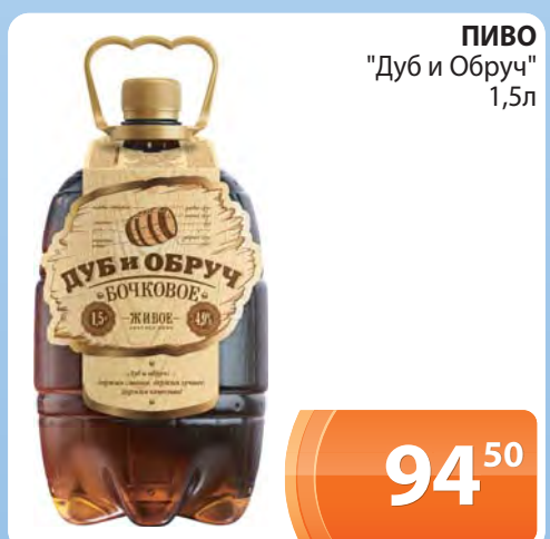
ПИВО "Дуб и Обруч" 1,5л