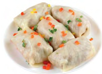
ГОЛУБЦЫ сельские 100г