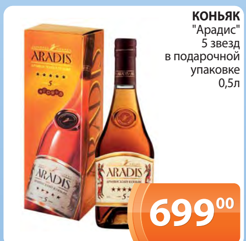
КОНЬЯК "Арадис" 5 звезд в подарочной упаковке 0,5л