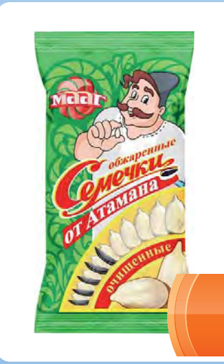
СЕМЕЧКИ "от Атамана" обжаренные 75г