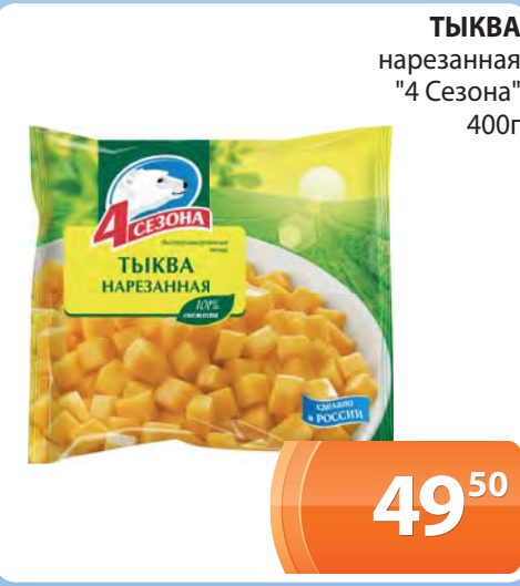
ТЫКВА нарезанная "4 Сезона" 400г