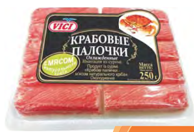
КРАБОВЫЕ ПАЛОЧКИ охлажденные с мясом натурального краба "VICI" 250г