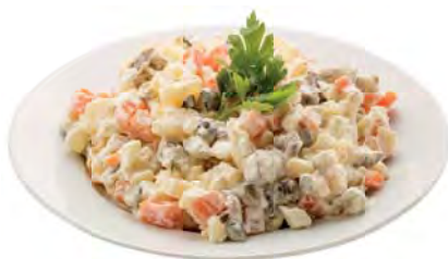
САЛАТ мясной 100г