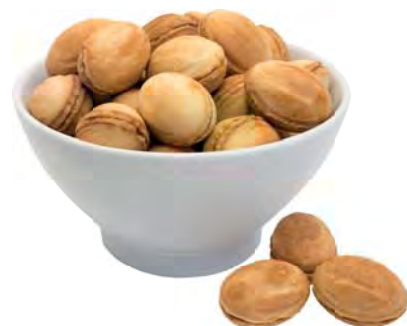
ПЕЧЕНЬЕ "Орешки со сгущенкой" 100г