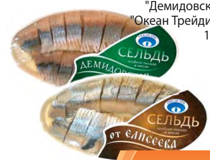
СЕЛЬДЬ филе "от Елисеева", "Демидовская" "Океан Трейдинг" 170г