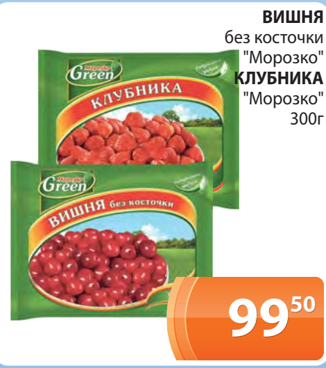
ВИШНЯ без косточки "Морозко" КЛУБНИКА "Морозко" 300г