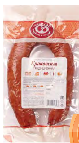
КОЛБАСА полукопченая "Краковская" Традиционная "Черкизово" 400г