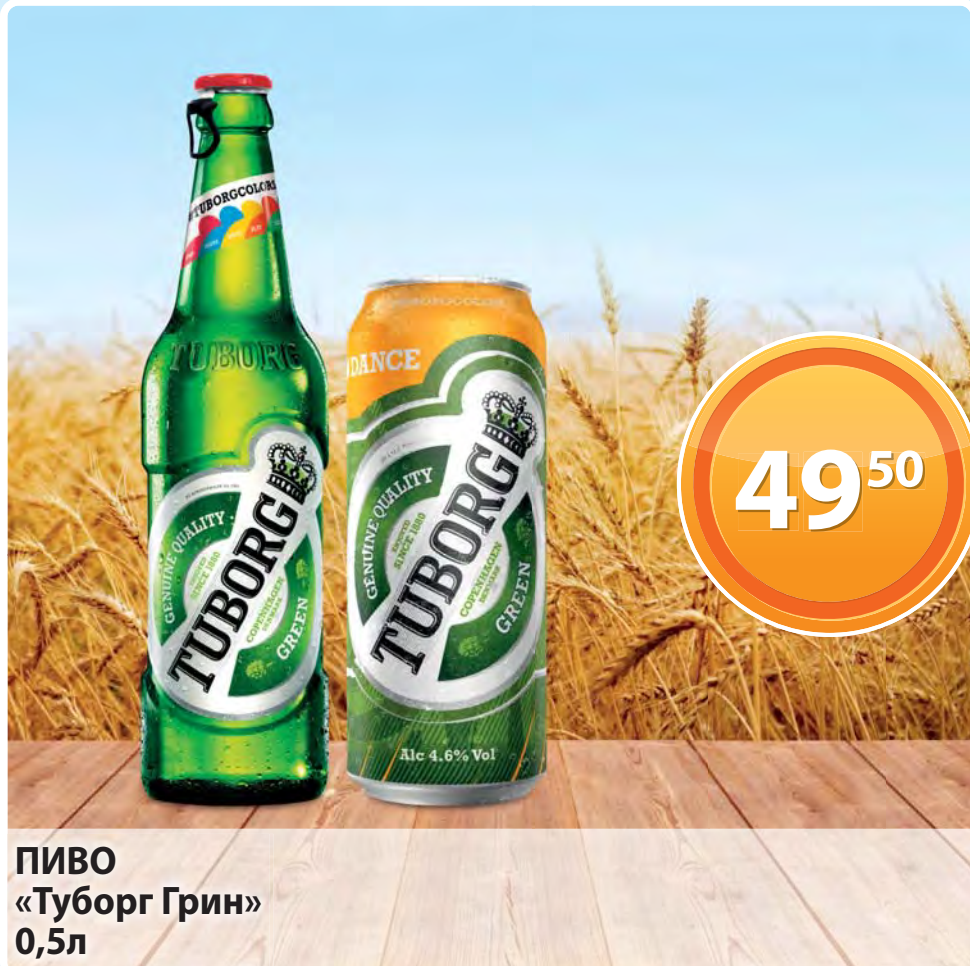
ПИВО «Туборг Грин» 0,5л