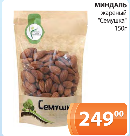
МИНДАЛЬ жареный "Семушка" 150г