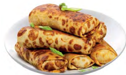
БЛИНЧИКИ с мясом 100г