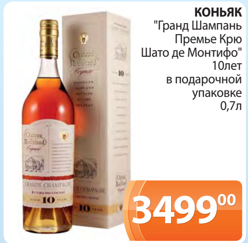
КОНЬЯК "Гранд Шампань Премье Крю Шато де Монтифо" 10лет в подарочной упаковке 0,7л