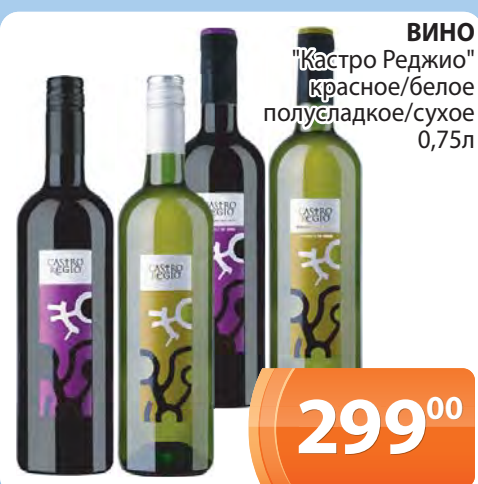
ВИНО "Кастро Реджио" красное/белое полусладкое/сухое 0,75л