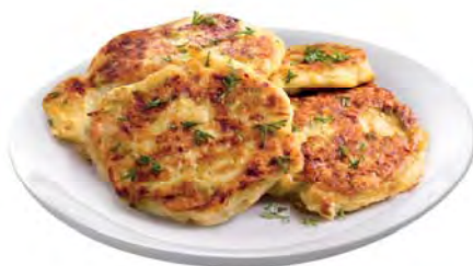
ОЛАДЫ куриные жареные 100г