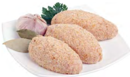
КОТЛЕТЫ куриные особые 100г