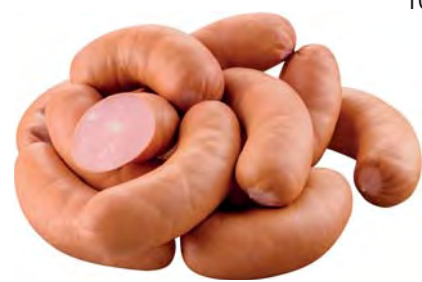
ШПИКАЧКИ для завтрака "Мясницкий ряд" 100г