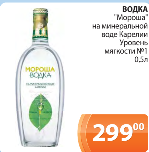
ВОДКА "Мороша" на минеральной воде Карелии Уровень мягкости №1 0,5л