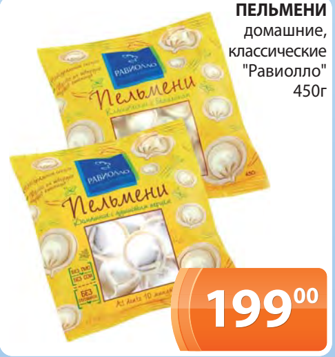
ПЕЛЬМЕНИ домашние, классические "Равиолло" 450г