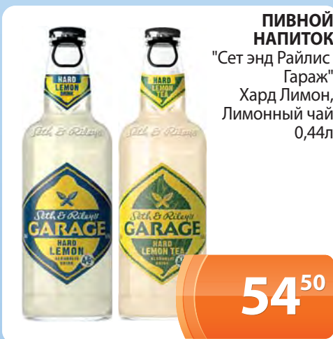
ПИВНОЙ НАПИТОК "Сет энд Райлис Гараж" Хард Лимон, Лимонный чай 0,44л