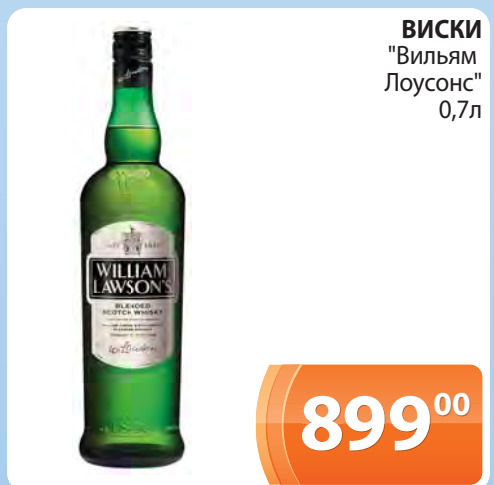
ВИСКИ "Вильям Лоусонс" 0,7л