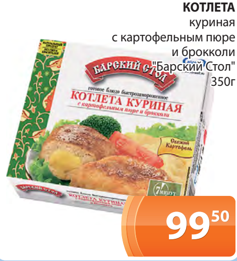
КОТЛЕТА куриная с картофельным пюре и брокколи "Барский Стол" 350г