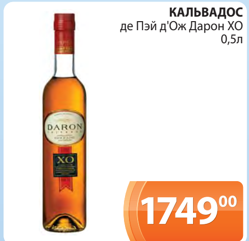
КАЛЬВАДОС де Пэй д'Ож Дарон XO 0,5л