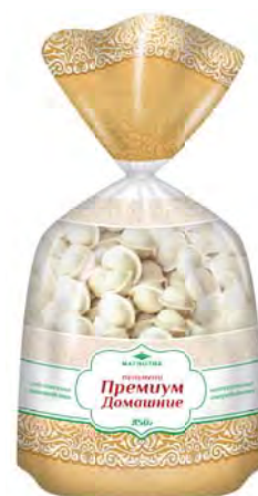
ПЕЛЬМЕНИ Домашние Премиум "Магнолия" 850г