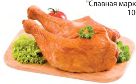
ОКОРОЧОК копченый охлажденный "Славная марка" 100г