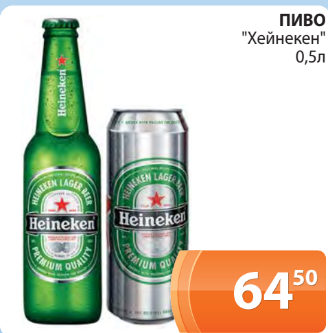
ПИВО "Хейнекен" 0,5л