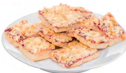
ПЕЧЕНЬЕ "Венское" 100г