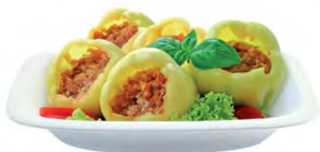
ПЕРЕЦ фаршированный 100г