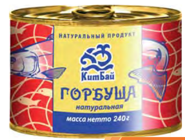
ГОРБУША натуральная "КитБай" 240г