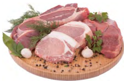
СВИНИНА на кости охлажденная 100г