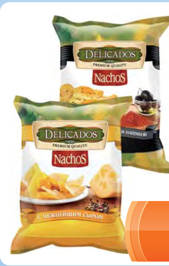
ЧИПСЫ кукурузные "Nachos" с сыром, с оливками и паприкой 75г