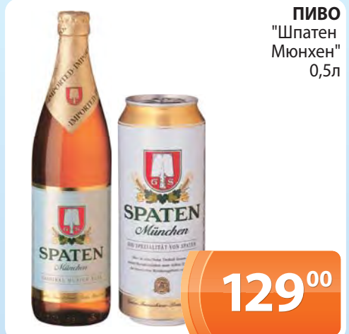
ПИВО "Шпатен" Мюнхен" 0,5л