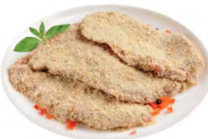
ШНИЦЕЛЬ свиной в панировке 100г