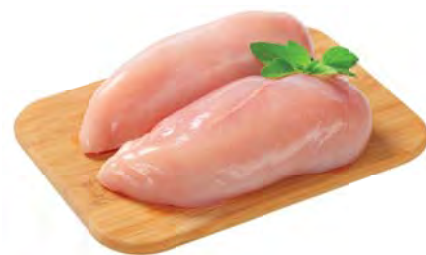
ФИЛЕ куриное 100г