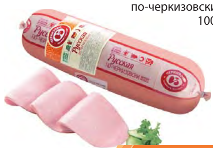
КОЛБАСА вареная "Русская по-черкизовски" 100г