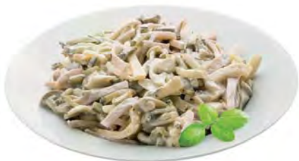
САЛАТ "Фаворит" 100г