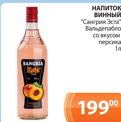
НАПИТОК ВИННЫЙ "Сангрия Эста" Вальдепабло со вкусом персика 1л