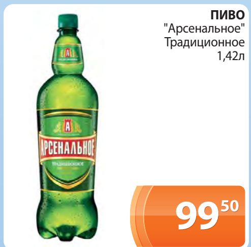
ПИВО "Арсенальное" Традиционное 1,42л