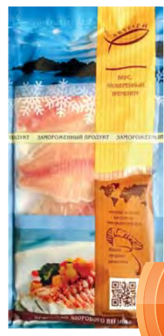
ФИЛЕ Тилапии без кожи "Артфиш" 400г