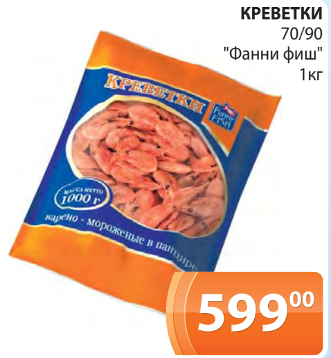
КРЕВЕТКИ 70/90 "Фанни фиш" 1кг