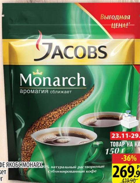
КОФЕ ЯКОБС МОНАРХ пакет 150г