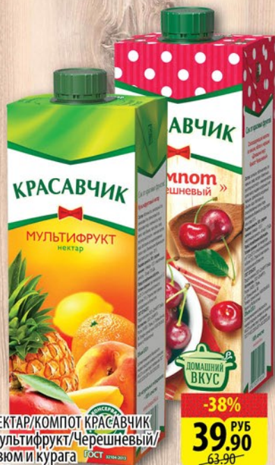
НЕКТАР/КОМПОТ КРАСАВЧИК Мультифрукт/Черешневый/ Изюм и курага 0,93л