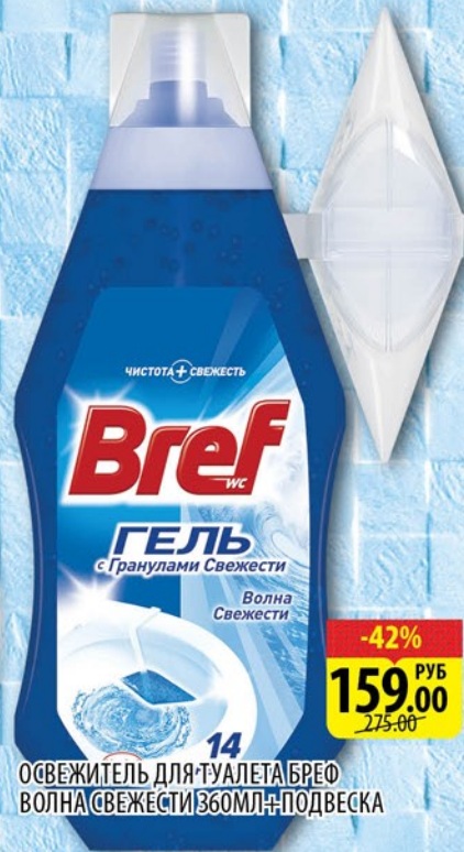
ОСВЕЖИТЕЛЬ ДЛЯ ТУАЛЕТА БРЕФ ВОЛНА СВЕЖЕСТИ 360МЛ+ПОДВЕСКА