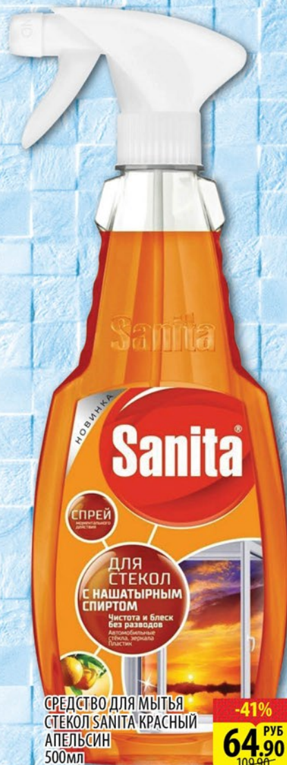
СРЕДСТВО ДЛЯ МЫТЬЯ СТЕКЛА SANITA КРАСНЫЙ АПЕЛЬСИН 500мл