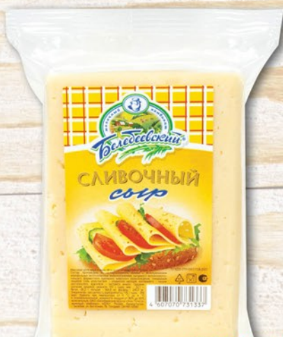
СЫР СЛИВОЧНЫЙ БЕЛЕБЕВСКИЙ 300г