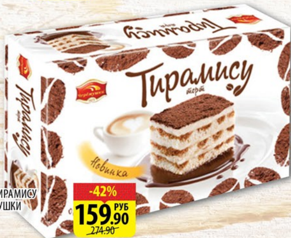
ТОРТ ТИРАМИСУ ЧЕРЕМУШКИ 700г