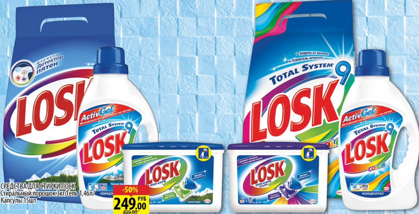
СРЕДСТВА ДЛЯ СТИРКИ LOSK Стиральный порошок 3кг/Гель 1,46л/ Капсулы 15шт