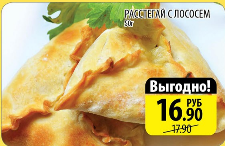
РАССТЕГАЙ С ЛОСОСЕМ 50г