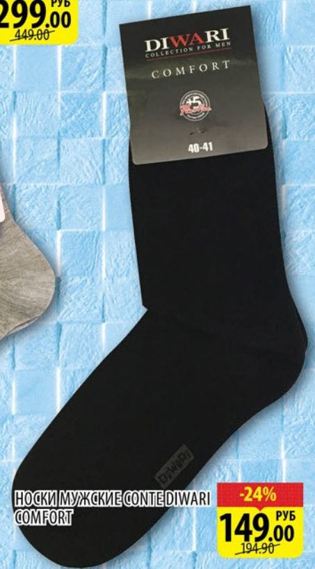
НОСКИ МУЖСКИЕ CONTE DIWARI COMFORT