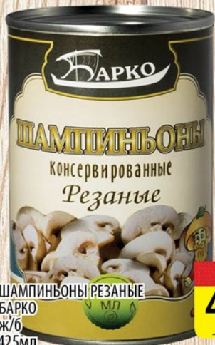
ШАМПИНЬОНЫ РЕЗАННЫЕ БАРКО ж/б 425мл