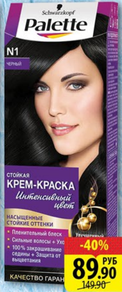
КРАСКА ДЛЯ ВОЛОС ПАLETTE КАЧЕСТВО ГАРАНТИРОВАНО