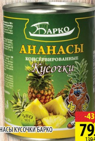
АНАНАСЫ КУСОЧКИ БАРКО ж/б 580мл

МЫ ПРЕДОСТАВЛЯЕМ СКИДКИ, НЕ ТРЕБУЯ ДИСКОНТНЫХ КАРТ!