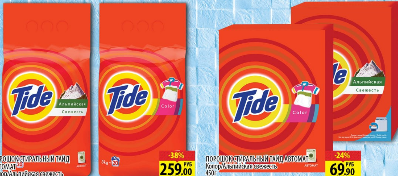
ПОРОШОК СТИРАЛЬНЫЙ ТАЙД АВТОМАТ 20 Колор/Альпийская свежесть 3кг