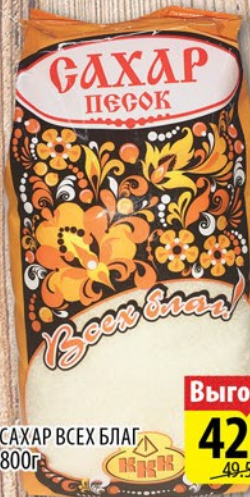
САХАР ВСЕХ БЛАГ 800г