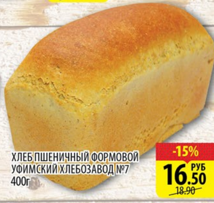
ХЛЕБ ПШЕНИЧНЫЙ ФОРМОВОЙ УФИМСКИЙ ХЛЕБОЗАВОД №7 400г