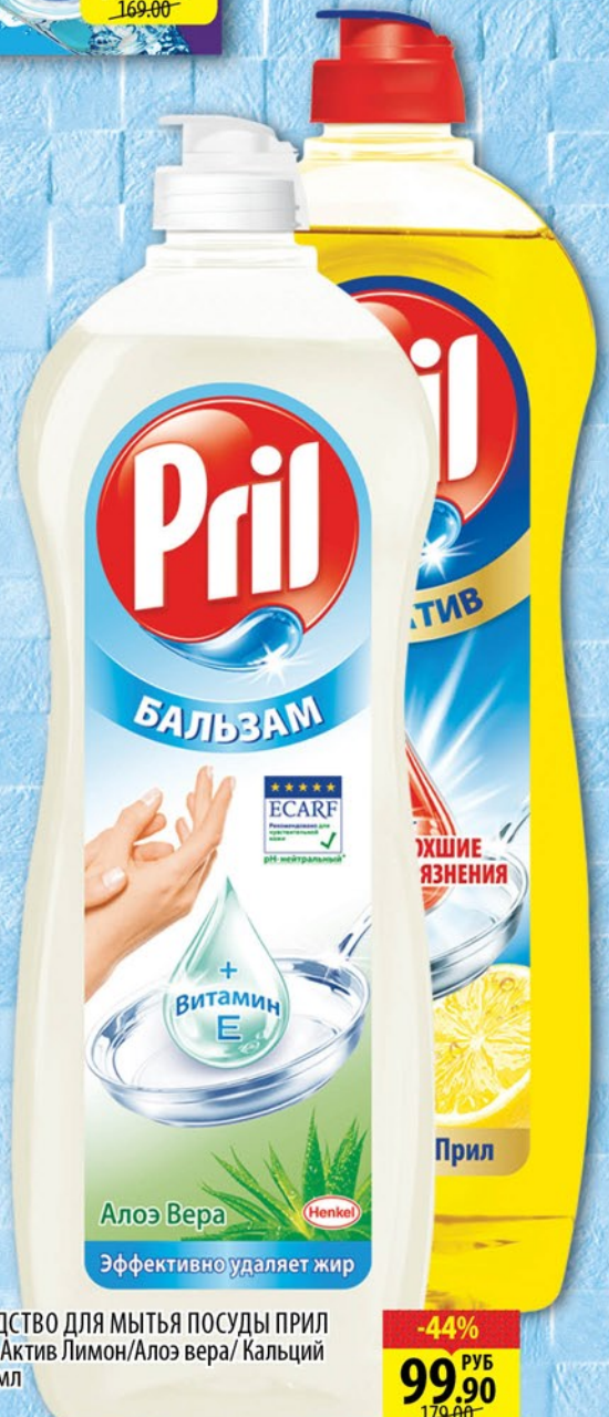
СРЕДСТВО ДЛЯ МЫТЬЯ ПОСУДЫ ПРИЛ Дуо Актив Лимон/Алоэ вера/ Кальций 900мл