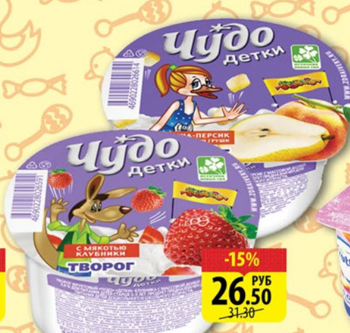
ТВОРОГ ЧУДО ДЕТКИ Груша и персик/Клубника 100г