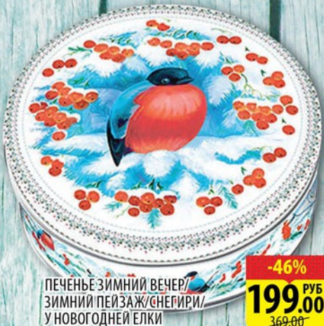
ПЕЧЕНЬЕ ЗИМНИЙ ВЕЧЕР/ ЗИМНИЙ ПЕЙЗАЖ/СНЕГИРИ/ У НОВОГОДНЕЙ ЕЛКИ 400г