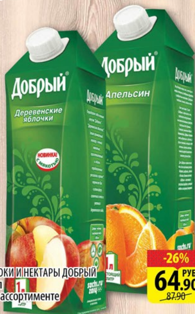
СОКИ И НЕКТАРЫ ДОБРЫЙ 1л в ассортименте