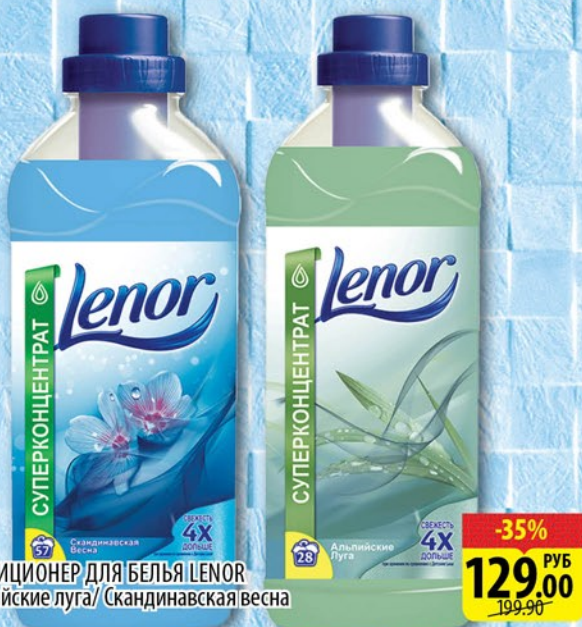
КОНДИЦИОНЕР ДЛЯ БЕЛЬЯ LENOR Альпийские луга/ Скандинавская весна 1л