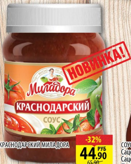
СОУС КРАСНОДАРСКИЙ МИЛАДОРА 500г