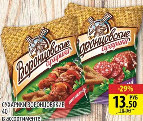
СУХАРИКИ ВОРОНЦОВСКИЕ 40 в ассортименте