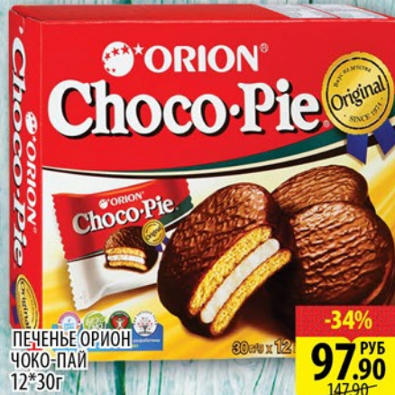
ПЕЧЕНЬЕ ОРИОН ЧОКО-ПАЙ 12*30г