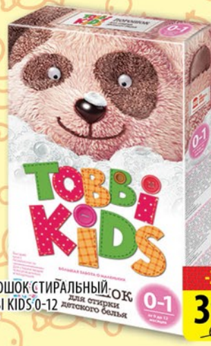
ПОРОШОК СТИРАЛЬНЫЙ ТОВБИ КИДС 0-12 400г