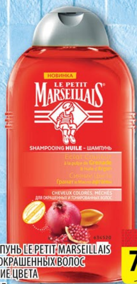
ШАМПУНЬ LE PETIT MARSEILLAIS для окрашенных волос СИЯНИЕ ЦВЕТА 250мл