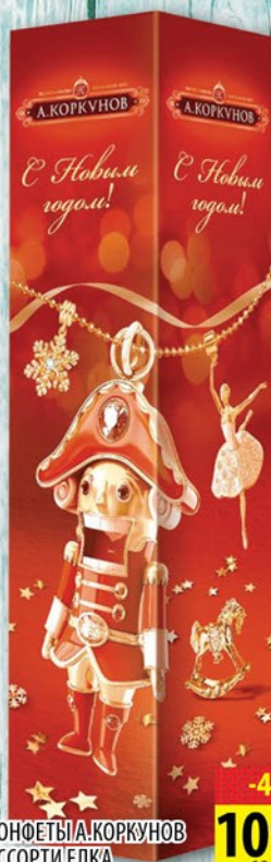
КОНФЕТЫ А.КОРКУНОВ АССОРТИ ЕЛКА 90г