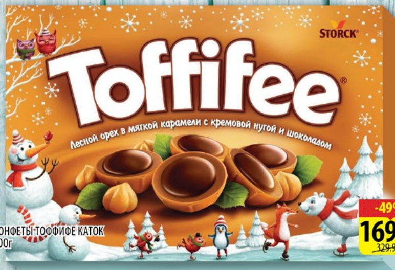
КОНФЕТЫ-ТОФИФЕЕ КАТОК 200г