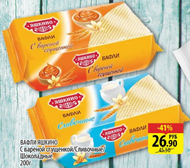
ВАФЛИ ЯШКИНО С вареной сгущенкой/Сливочные/ Шоколадные 200г