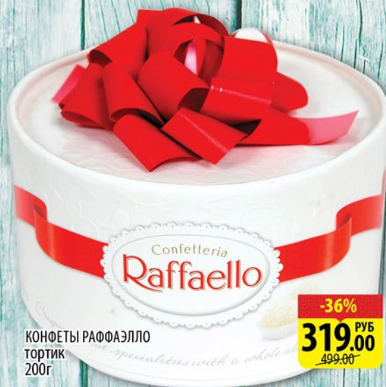
КОНФЕТЫ РАФАЭЛЛО ТОРТИК 200г