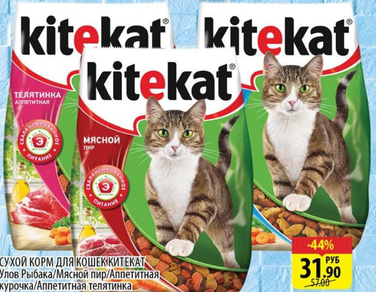
СУХОЙ КОРМ ДЛЯ КОШЕК КИТЕКАТ Улов Рыбака/Мясной пир/Аппетитная курочка/Аппетитная телятинка 350г