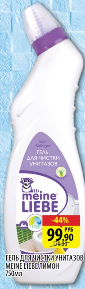
ГЕЛЬ ДЛЯ ЧИСТКИ УНИТАЗОВ MEINE LIEBE ЛИМОН 750мл