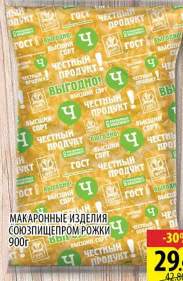
МАКАРОННЫЕ ИЗДЕЛИЯ СОЮЗ ПИЩЕПРОМ РОЖКИ 900г