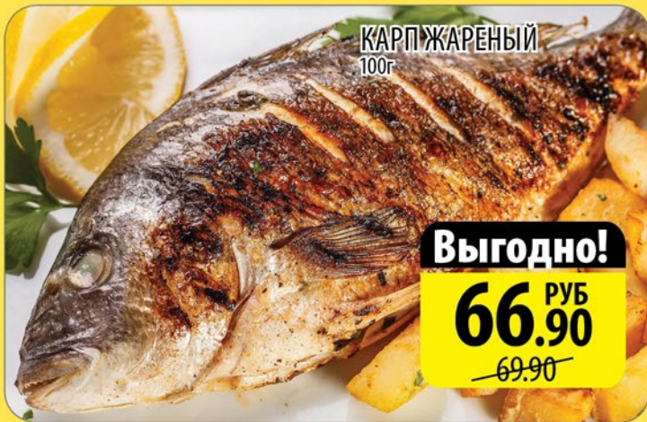
КАРП ЖАРЕННЫЙ 100г