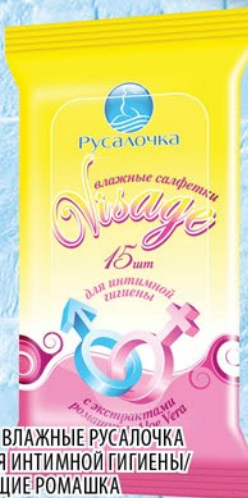
САЛФЕТКИ ВЛАЖНЫЕ РУСАЛОЧКА VISAGE ДЛЯ ИНТИМНОЙ ГИГИЕНЫ/ОСВЕЖАЮЩИЕ РОМАШКА 15ШТ