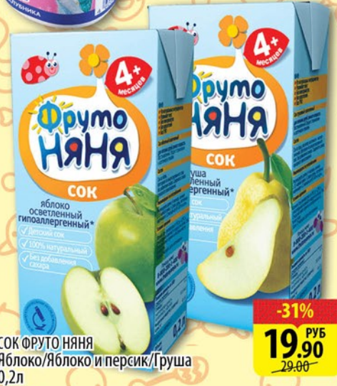
СОК ФРУТО НЯНЯ Яблоко/Яблоко и персик/Груша 0,2л