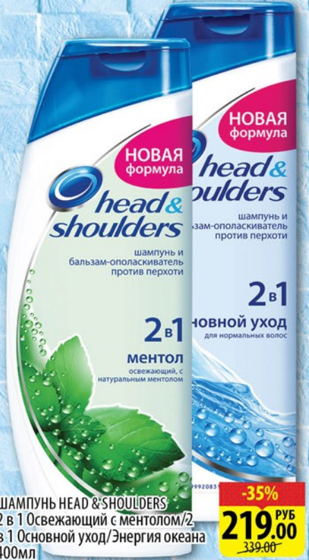
ШАМПУНЬ HEAD & SHOULDERS 2 в 1 Освежающий с ментолом/2, в 1 Основной уход/Энергия океана 400мл