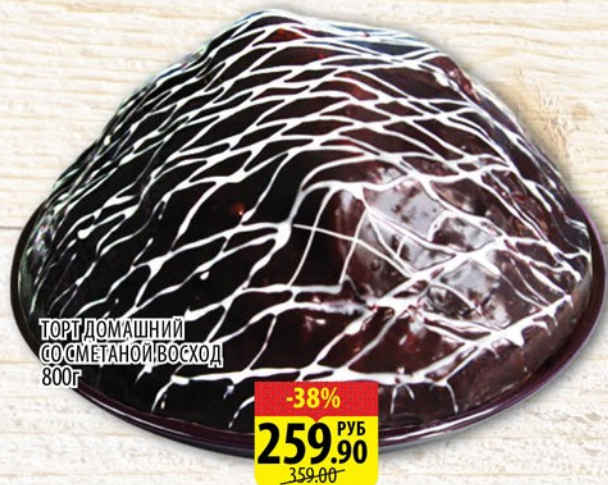
ТОРТ ДОМАШНИЙ СО СМЕТАНОЙ ВОСХОД 800г