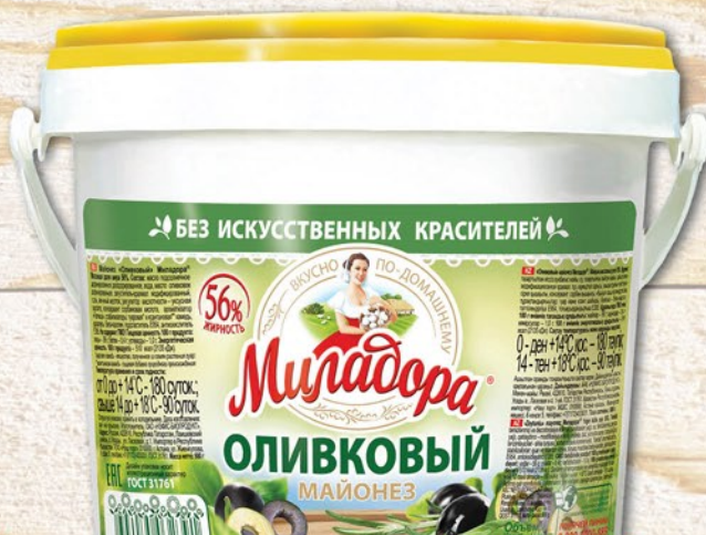
МАЙОНЕЗ МИЛАДОРА ОЛИВКОВЫЙ ведро 840мл