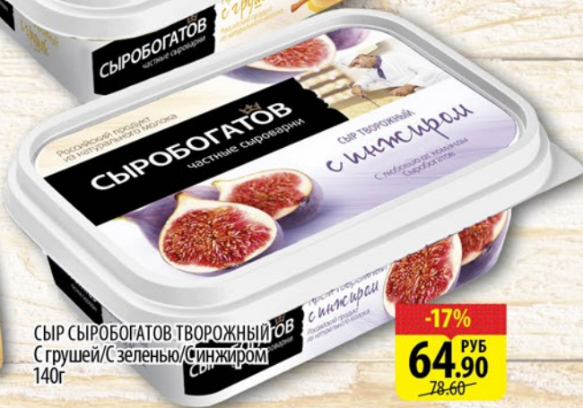
СЫР СЫРОБОГАТОВ ТВОРОЖНЫЙ С грушей/С зеленью/С киви/фран 140г