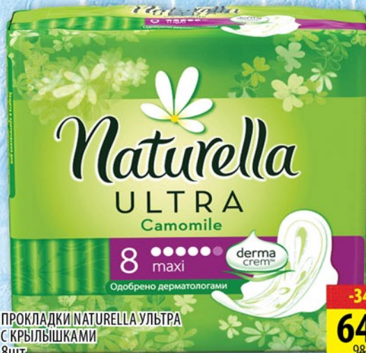
ПРОКЛАДКИ NATURELLA УЛЬТРА С КРЫЛЫШКАМИ 8ШТ