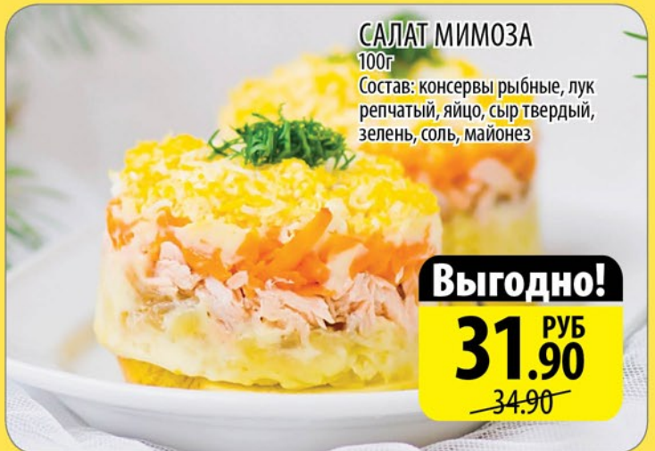
САЛАТ МИМОЗА 100г

Состав: консервы рыбные, лук репчатый, яйцо, сыр твердый, зелень, соль, майонез