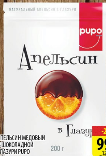
АПЕЛЬСИН МЕДОВЫЙ В ШОКОЛАДНОЙ ГЛАЗУРИ RUPO 200г