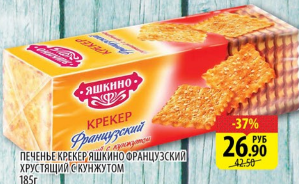
ПЕЧЕНЬЕ КРЕКЕР ЯШКИНО ФРАНЦУЗСКИЙ ХРУСТЯЩИЙ С КУНЖУТОМ 185г