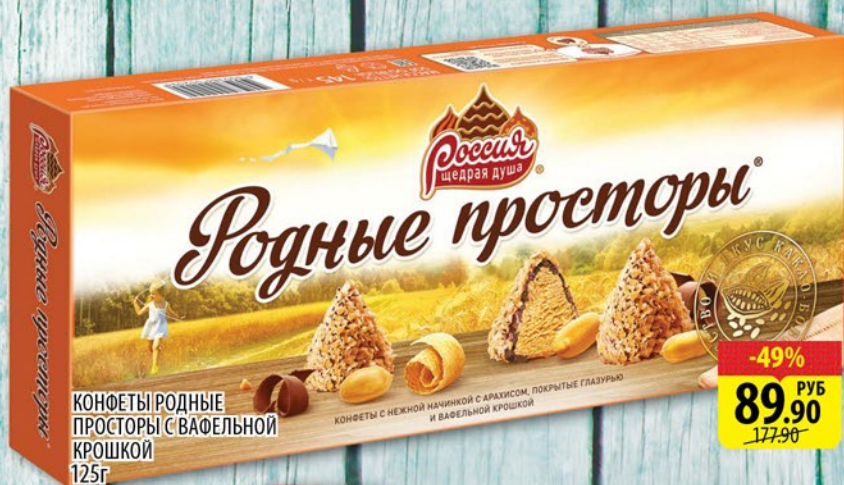
КОНФЕТЫ РОДНЫЕ ПРОСТОРЫ С ВАФЕЛЬНОЙ КРОШКОЙ 125г