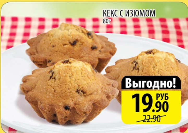
КЕКС С ИЗЮМОМ 80г