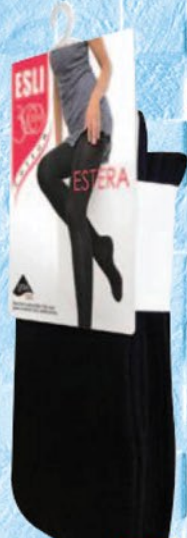
КОЛГОТКИ ESU ESTERA 300