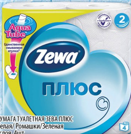
БУМАГА ТУАЛЕТНАЯ ЗЕВА ПЛЮС Белая/Ромашки/Зеленая 2слоя, 4ШТ