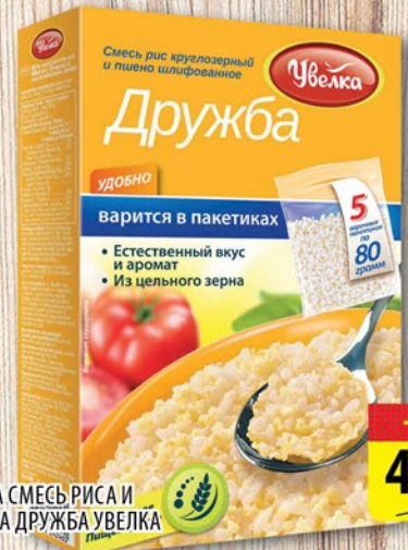
КРУПА СМЕСЬ РИСА И ПШЕНА ДРУЖБА УВЕЛКА 5*80г