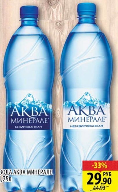
ВОДА АКВА МИНЕРАЛЕ 1,25л