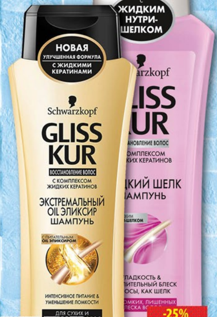
ШАМПУНЬ ГЛИССКУР Экстремальный Oil Эликсир/ Жидкий шелк 400мл