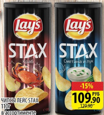
ЧИПСЫ ЛЕЙС СТАХ 110г в ассортименте