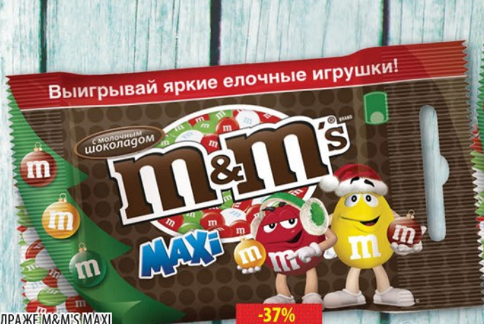
ДРАЖЕ M&M'S MAXI Арахис/Шоколад пакет 70г