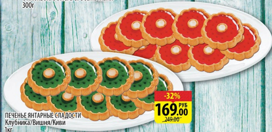
ПЕЧЕНЬЕ ЯНТАРНЫЕ СЛАДОСТИ Клубника/Вишня/Киви 1кг