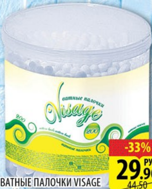
ВАТНЫЕ ПАЛОЧКИ VISAGE пл/банка 200шт