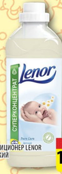
КОНДИЦИОНЕР LENOR ДЕТСКИЙ 1л