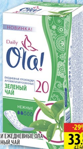
ПРОКЛАДКИ ЕЖЕДНЕВНЫЕ ОЛА DAILY ЗЕЛЕНЫЙ ЧАЙ 20ШТ