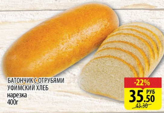
БАТОНЧИК С ОТРУБЯМИ УФИМСКИЙ ХЛЕБ нарезка 400г