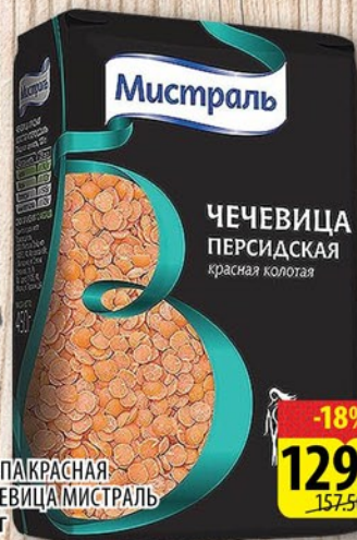
КРУПА КРАСНАЯ ЧЕЧЕВИЦА МИСТРАЛЬ 450г