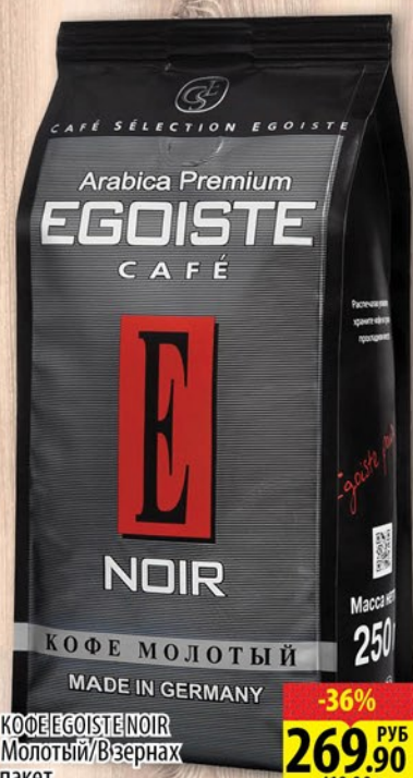
КОФЕ EGOISTE NOIR Молотый/В зернах пакет 250г