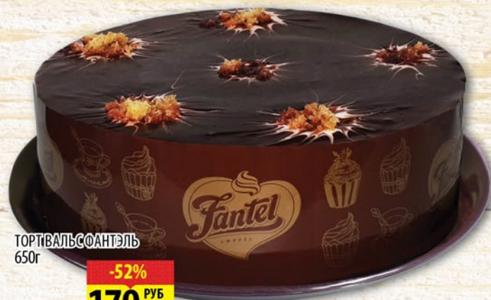
ТОРТ ВАЛЬСАНТЭЛЬ 650г