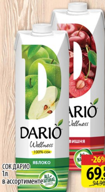
СОК ДАРИО ЯБЛОКО 1л в ассортименте