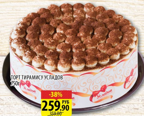
ТОРТ ТИРАМИСУ УСЛАДОВ 750г