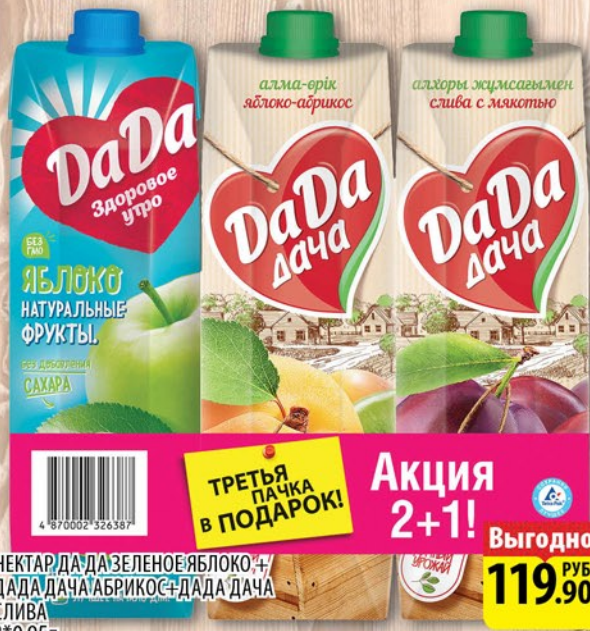
НЕКТАР ДА ДА ЗЕЛЕНОЯБЛОКО+ ДАДА ДАЧА АБРИКОС+ДАДА ДАЧА СЛИВА 3*0,95л