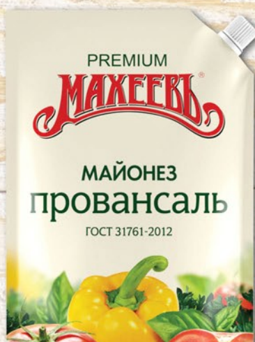
МАЙОНЕЗ МАХЕЕВЪ ПРОВАНСАЛЬ ЖЕЛТЫЙ 50,5% дой-пак 800мл