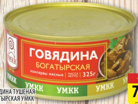
ГОВЯДИНА ТУШЕНАЯ БОГАТЫРСКАЯ УМКК 325г