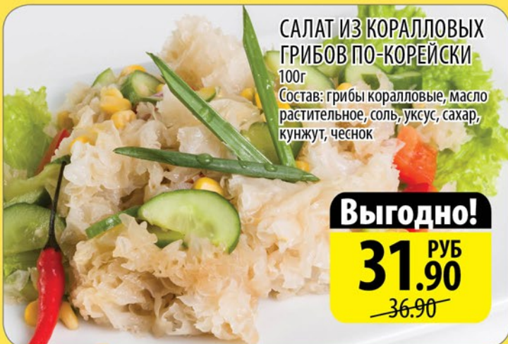
САЛАТ ИЗ КОРАЛЛОВЫХ ГРИБОВ ПО-КОРЕЙСКИ 100г

Состав: грибы коралловые, масло растительное, соль, уксус, сахар, кунжут, чеснок