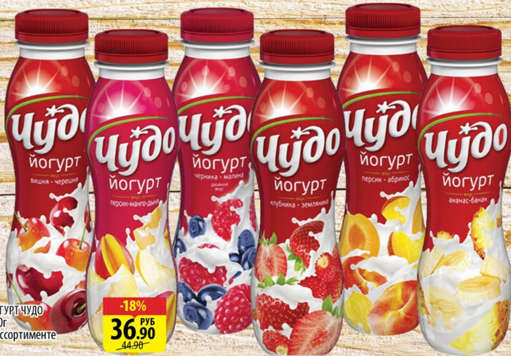
ЙОГУРТ ЧУДО 290г в ассортименте