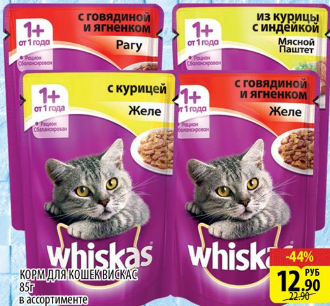
КОРМ ДЛЯ КОШЕК ВИСКАС 85г в ассортименте