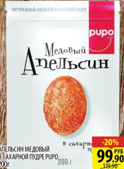
АПЕЛЬСИН МЕДОВЫЙ В САХАРНОЙ ПУДРЕ RUPO 200г