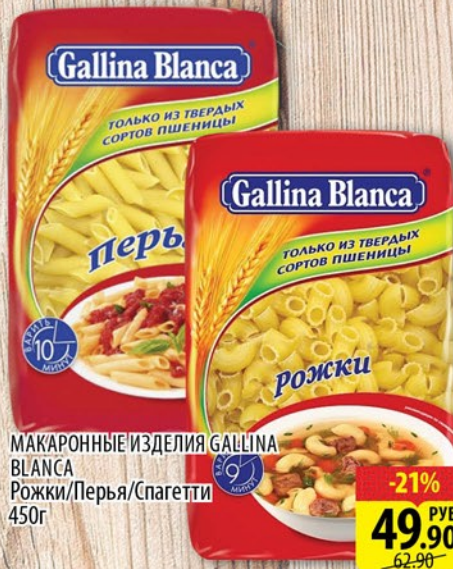
МАКАРОННЫЕ ИЗДЕЛИЯ GALLINA BLANCA Рожки/Перья/Спагетти 450г