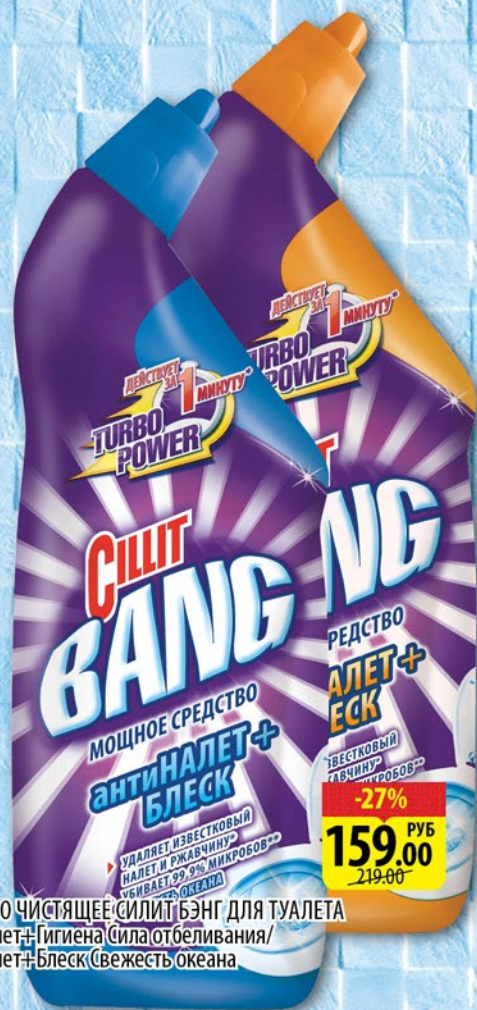
СРЕДСТВО ЧИСТЯЩЕЕ СИЛИТ БЭНГ ДЛЯ ТУАЛЕТА Анти-налет+Гигиена (сила отбеливания)/ Анти-налет+Блеск (свежесть океана) 750мл