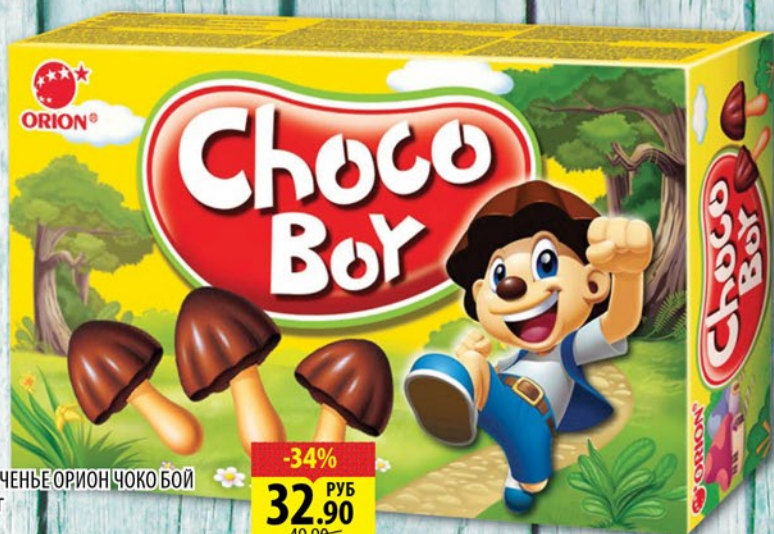
ПЕЧЕНЬЕ ОРИОН ЧОКО БОЙ 45г