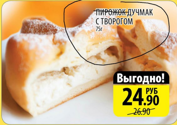
ПИРОЖОК ДУЧМАК С ТВОРОГОМ 75г