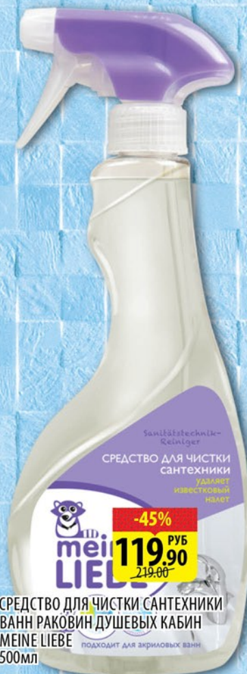
СРЕДСТВО ДЛЯ ЧИСТКИ САНТЕХНИКИ ВАНН РАКОВИН ДУШЕВЫХ КАБИН MEINE LIEBE ПОДХОДИТ ДЛЯ АКРИЛОВЫХ ВАНН 500мл