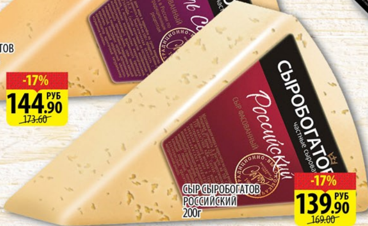
СЫР СЫРОБОГАТОВ РОССИЙСКИЙ 200г