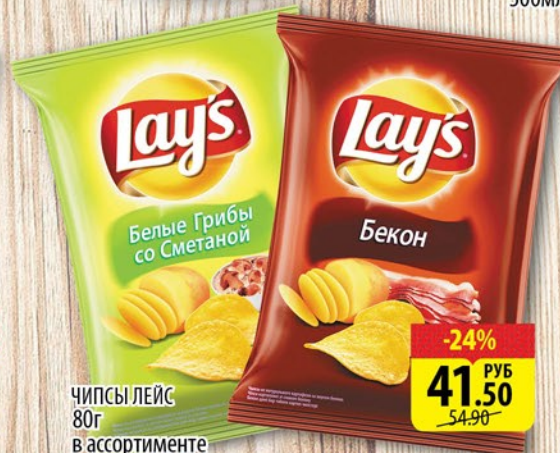
ЧИПСЫ ЛЕЙС 80г в ассортименте