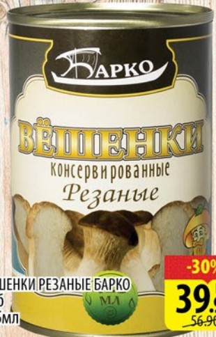
ВЕШЕНКИ РЕЗАННЫЕ БАРКО ж/б 425мл