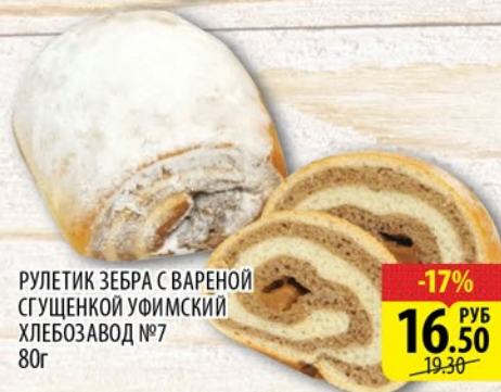
РУЛЕТИК ЗЕБРА С ЗАРЕННОЙ СГУЩЕННОЙ УФИМСКИЙ ХЛЕБОЗАВОД №7 80г