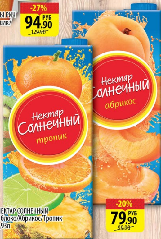
НЕКТАР СОЛНЕЧНЫЙ Яблоко/Абрикос/Тропик 1,93л