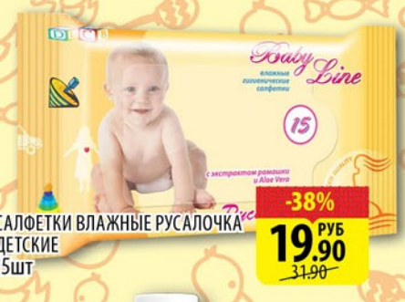
САЛФЕТКИ ВЛАЖНЫЕ РУСАЛОЧКА ДЕТСКИЕ 15шт