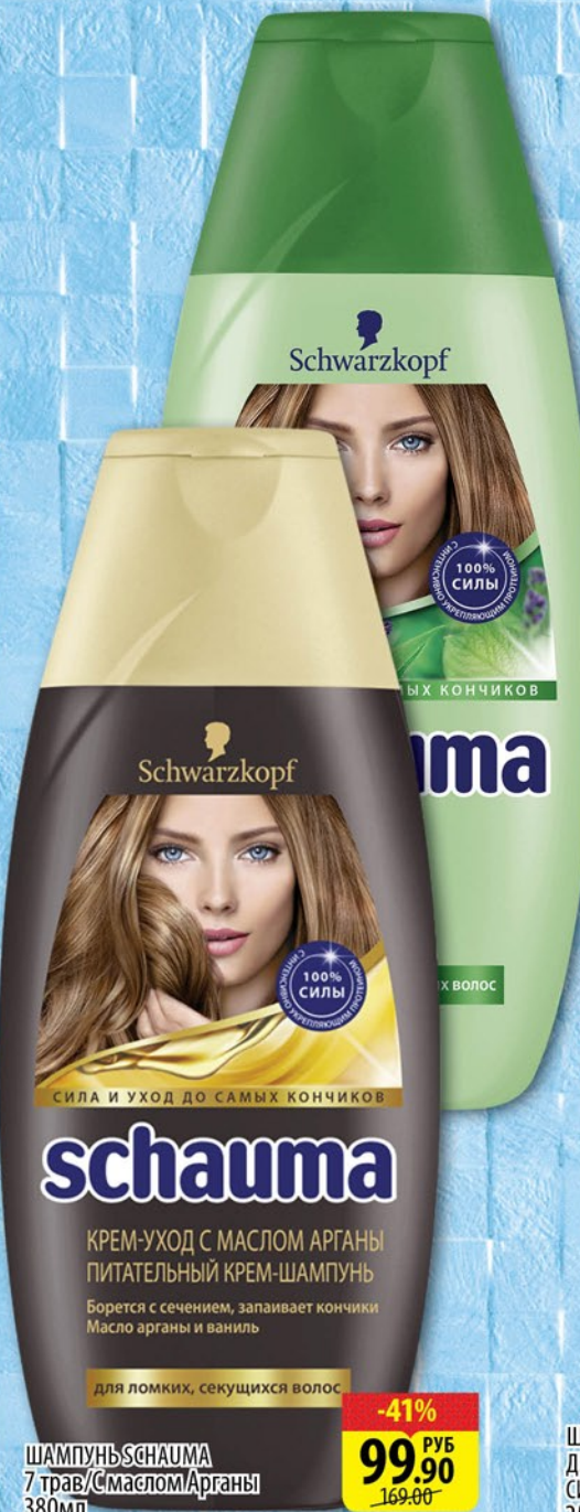
ШАМПУНЬ SCHAUMA 7 трав/с маслом Арганы 380мл