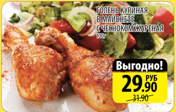
ГОЛЕНЬ КУРИНАЯ В МАЙОНЕЗЕ С ЧЕСНОКОМ ЖАРЕНАЯ 100г