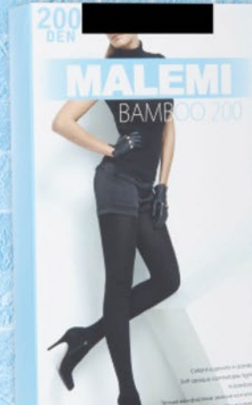
КОЛГОТКИ MALEMI BAMBOO 200