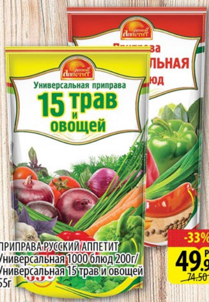
ПРИПРАВА РУССКИЙ АППЕТИТ Универсальная 1000 блюд 200г/ Универсальная 15 трав и овощей 55г