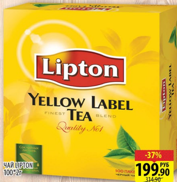
ЧАЙ LIPTON 100*2г