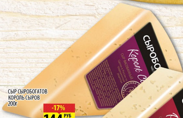
СЫР СЫРОБОГАТОВ КОРОЛЬ СЫРОВ 200г