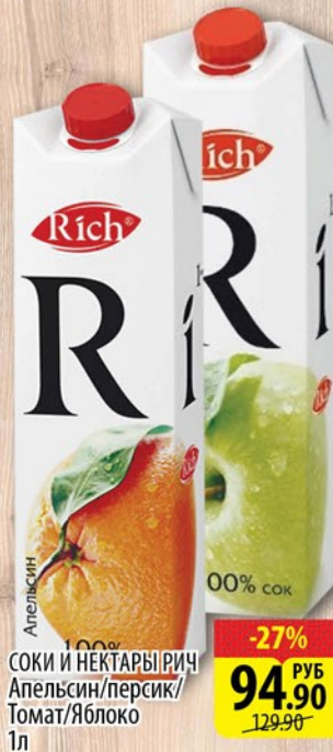
СОКИ И НЕКТАРЫ РИЧ Апельсин/персик/ Томат/Яблоко 1л