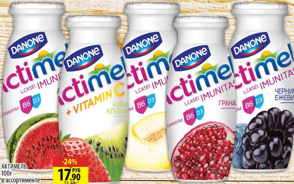
АКТИМЕЛЬ 100г в ассортименте