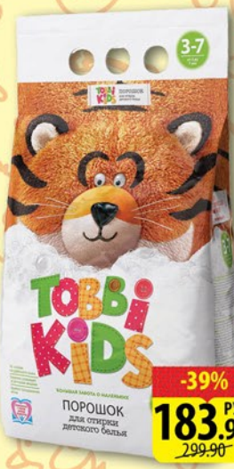
ПОРОШОК ТОВБИ КИДС 2,4кг