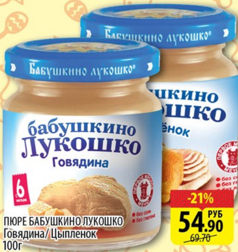
ПЮРЕ БАБУШКИНО ЛУКОШКО Говядина/Цыпленок 100г