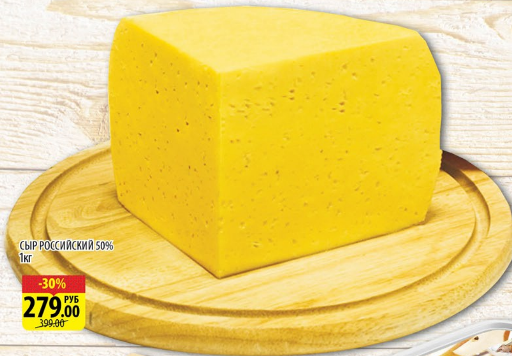
СЫР РОССИЙСКИЙ 50% 1кг