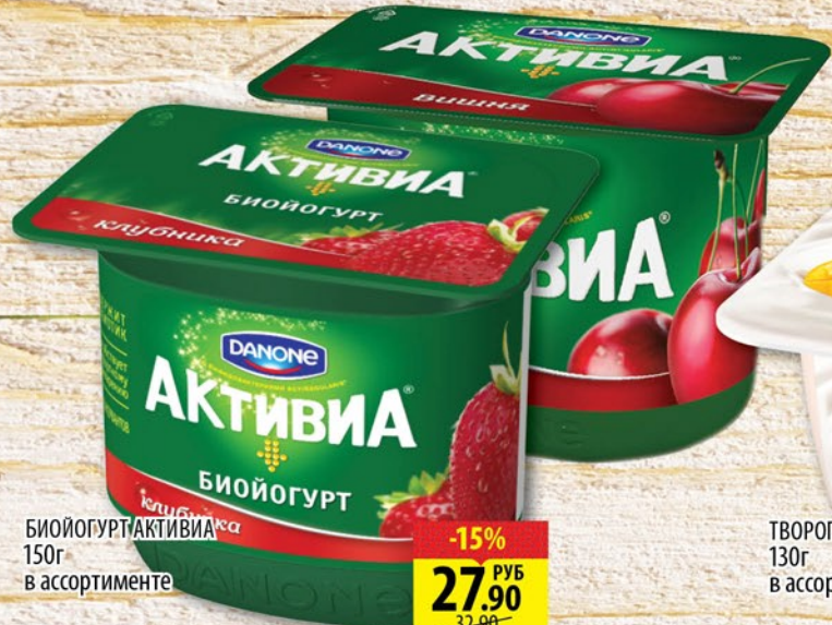
БИОЙОГУРТ АКТИВИА 150г в ассортименте