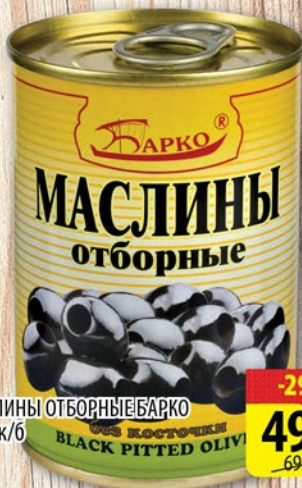
МАСЛИНЫ ОТБОРНЫЕ БАРКО б/к, ж/б 280г