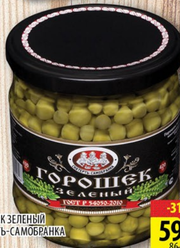
ГОРОШЕК ЗЕЛЕНый СКАТЕРТЬ-САМОБРАНКА СТ/б 430мл