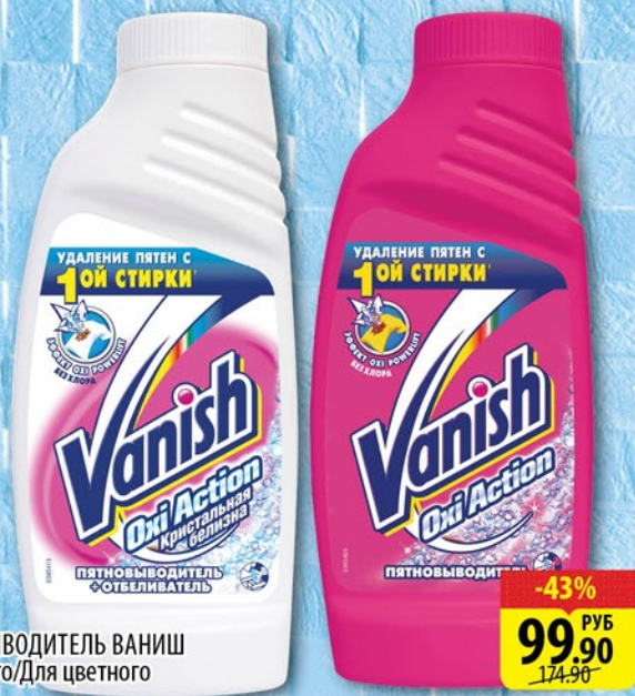
ПЯТНОВЫВОДИТЕЛЬ ВАНИШ Для белого/Для цветного 450мл