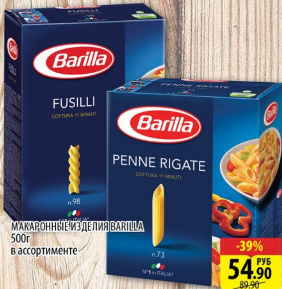
МАКАРОННЫЕ ИЗДЕЛИЯ BARILLA 500г в ассортименте