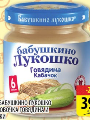
ПЮРЕ БАБУШКИНО ЛУКОШКО ДЮЙМОВИЧКА ГОВЯДИНА И КАБАЧКИ 100г