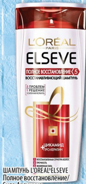
ШАМПУНЬ L'OREAL ELSEVE Полное восстановление/ Сила Аргинина 250мл