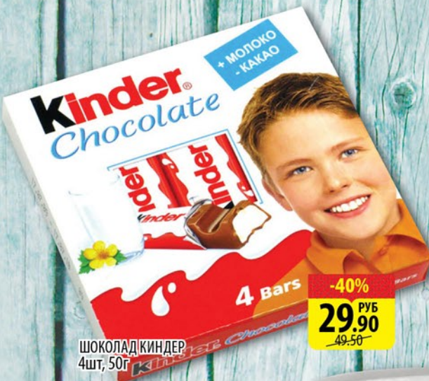
ШОКОЛАД КИНДЕР 4шт, 50г