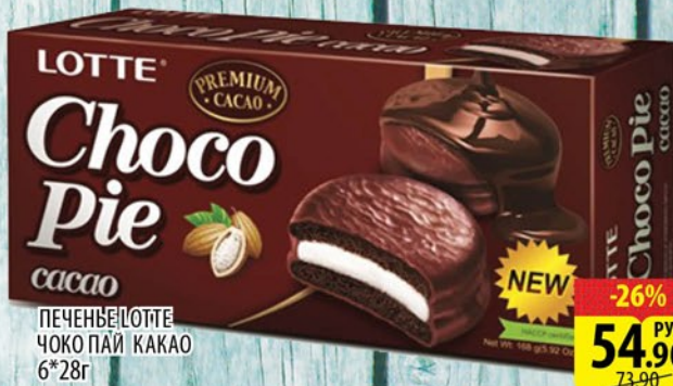
ПЕЧЕНЬЕ ЛОТТЕ ЧОКО ПАЙ КАКАО 6*28г