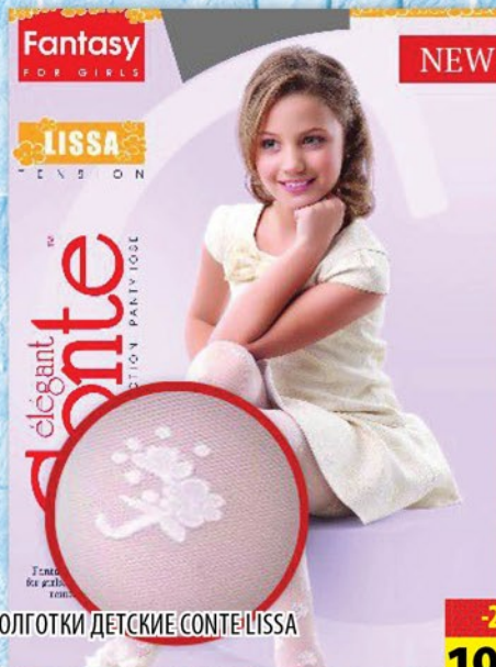
КОЛГОТКИ ДЕТСКИЕ CONTE LISSA