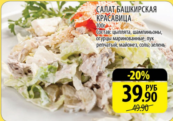
САЛАТ БАШКИРСКАЯ КРАСАВИЦА 100г

Состав: цыплята, шампиньоны, огурцы маринованные, лук репчатый, майонез, соль, зелень