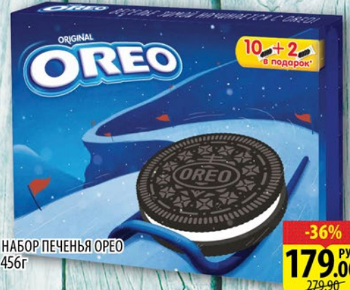
НАБОР ПЕЧЕНЬЯ ОРЕО 456г