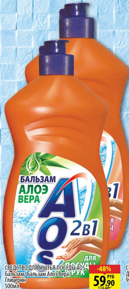
СРЕДСТВО ДЛЯ МЫТЬЯ ПОСУДЫ AOS Бальзам / Бальзам Алоэ Вера / Глицерин 500мл