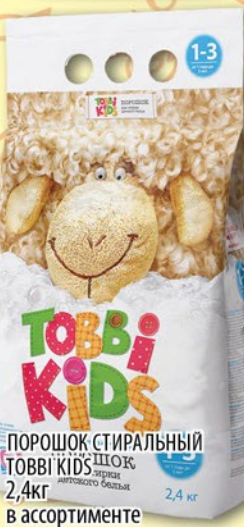
ПОРОШОК СТИРАЛЬНЫЙ ТОВБИ КИДС ШОК 2,4кг в ассортименте