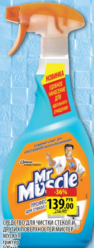
СРЕДСТВО ДЛЯ ЧИСТКИ СТЕКОЛ И ДРУГИХ ПОВЕРХНОСТЕЙ МИСТЕР МУСКУЛ триггер 500мл