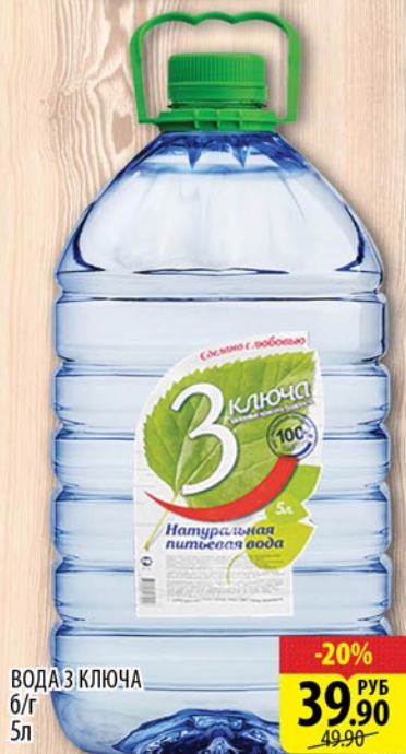
ВОДА 3 КЛЮЧА 6/Г 5л