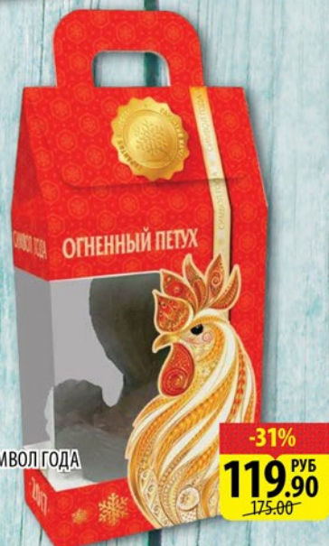
ШОКОЛАД СИМВОЛ ГОДА ФИГУРКА 60г