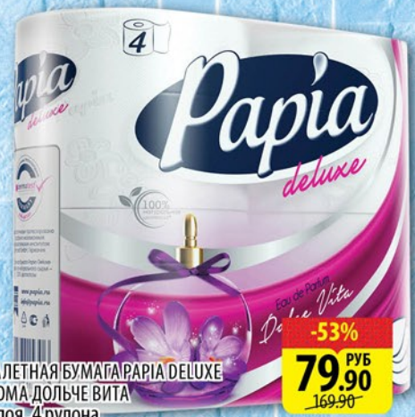
ТУАЛЕТНАЯ БУМАГА PAPIA DELUXE АРОМА ДОЛЬЧЕ ВИТА 4 слоя, 4 рулона