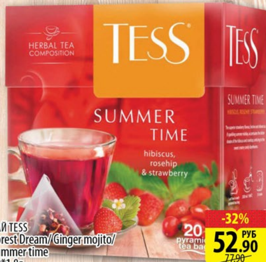
ЧАЙ TESS Forest Dream/Ginger mojito/ Summer time 20*1,8г