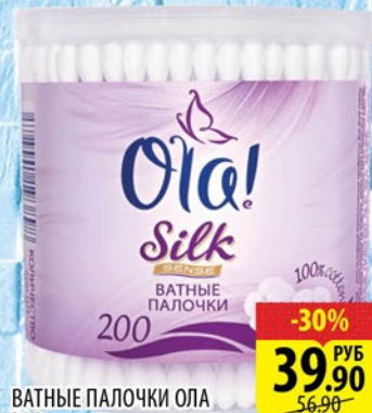
ВАТНЫЕ ПАЛОЧКИ ОЛА 200ШТ