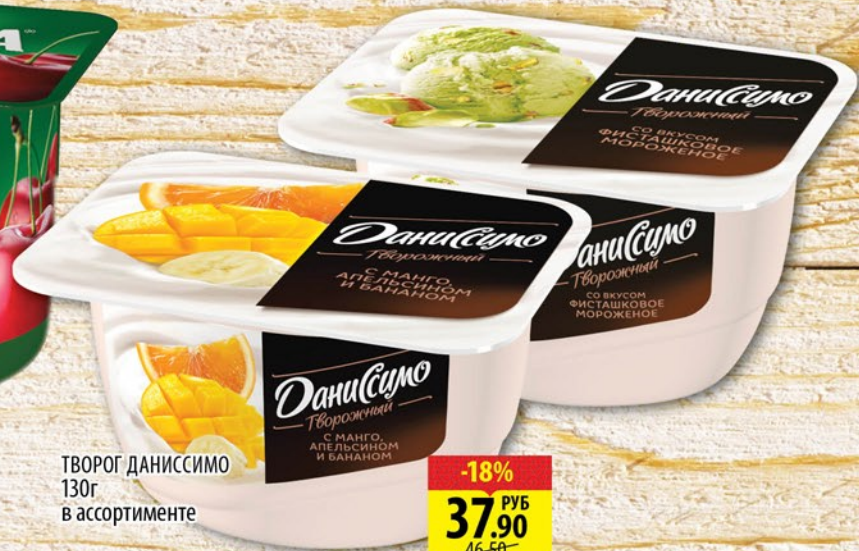
ТВОРОГ ДАНИССИМО 130г в ассортименте