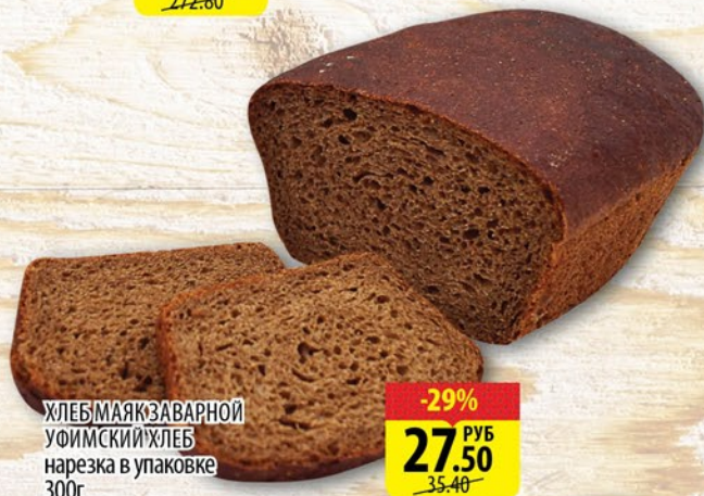
ХЛЕБ МАЯК ЗАВАРНОЙ УФИМСКИЙ ХЛЕБ нарезка в упаковке 300г