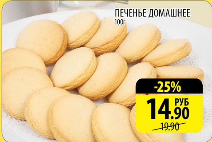
ПЕЧЕНЬЕ ДОМАШНЕЕ 100г