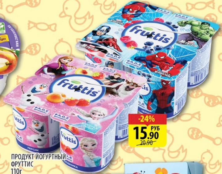
ПРОДУКТ ЙОГУРТНЫЙ ФРУТТИС 110г