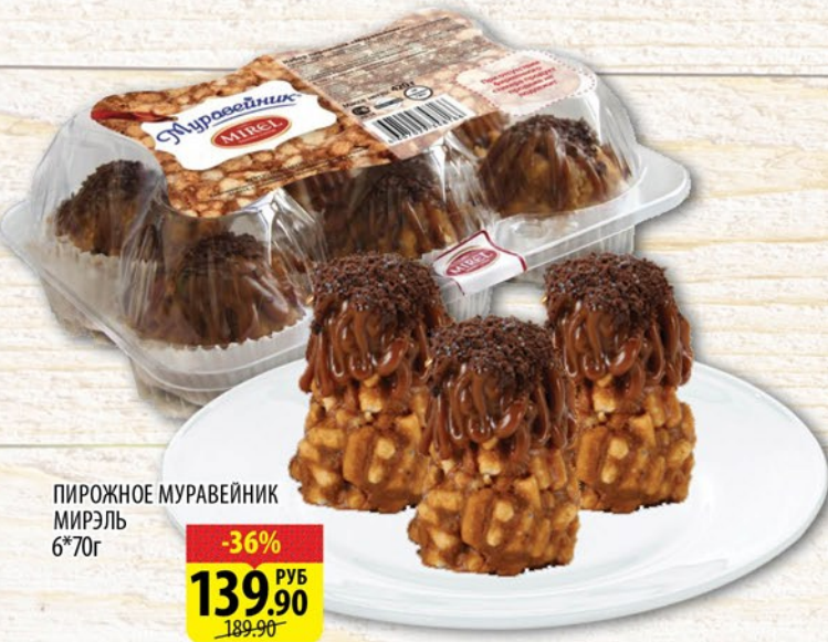
ПИРОЖНОЕ МУРАВЕЙНИК МИРЭЛЬ 6*70г