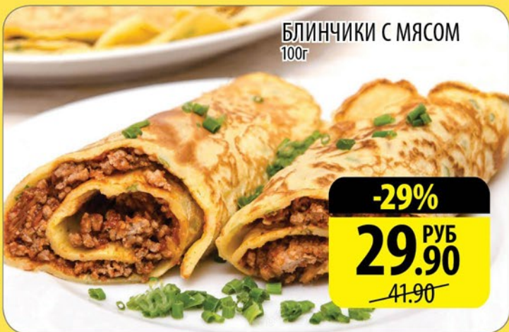
БЛИНЧИКИ С МЯСОМ 100г