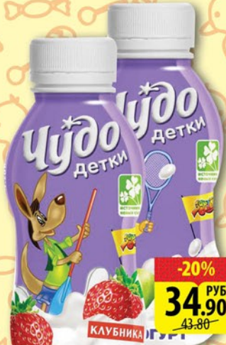
ЙОГУРТ ПИТЬЕВОЙ ЧУДО ДЕТКИ Клубника/Яблоко и банан 200г