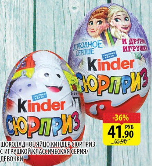
ШОКОЛАДНОЕ ЯЙЦО КИНДЕР СЮРПРИЗ С ИГРУШКОЙ КЛАССИЧЕСКАЯ СЕРИЯ/ ДЕВОЧКИ