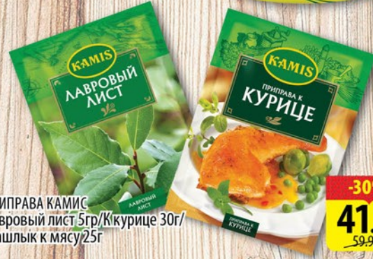
ПРИПРАВА КАМИС Лавровый лист 5г/К курице 30г/ Шашлык к мясу 25г