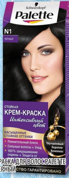
КРАСКА ДЛЯ ВОЛОС ПАLETTE ЧЕРНЫЙ ЦВЕТ ГАРАНТИРОВАНО