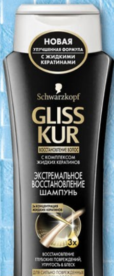
ШАМПУНЬ ГЛИССКУР Жидкий шелк/Экстремальное Восстановление 250мл