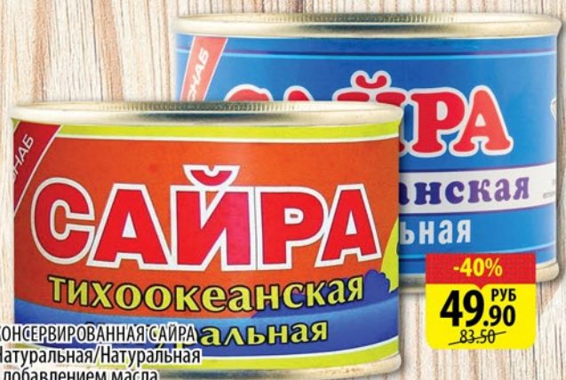
КОНСЕРВИРОВАННАЯ САЙРА альная Натуральная/Натуральная с добавлением масла 250г