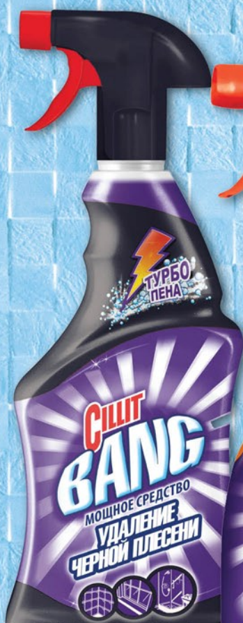
СРЕДСТВО ЧИСТЯЩЕЕ СИЛИТ БЭНГ Черная плесень/Анти-Жир/От налета и грязи курок 750мл