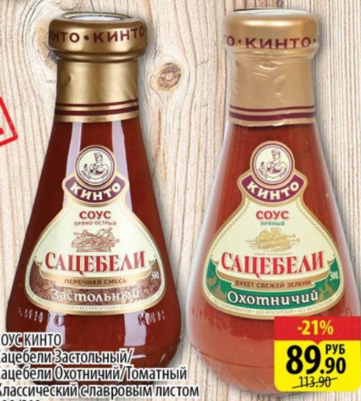
СОУС КИНТО Сацебели Застольный/ Сацебели Охотничий/Томатный Классический (Славровым листом) 300/310г