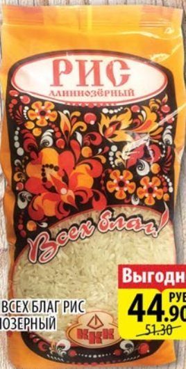
КРУПА ВСЕХ БЛАГ РИС ДЛИННОЗЕРНЫЙ 800г