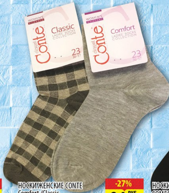
НОСКИ ЖЕНСКИЕ CONTE Comfort / Classic