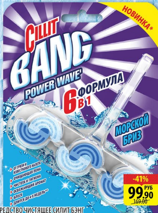
СРЕДСТВО ЧИСТЯЩЕЕ СИЛИТ БЭНГ МОРСКОЙ БРИЗ блок 39г

С НАМИ ПРОЩЕ! МЫ ПРЕДОСТАВЛЯЕМ СКИДКИ, НЕ ТРЕБУЯ ДИСКОНТНЫХ КАРТ!