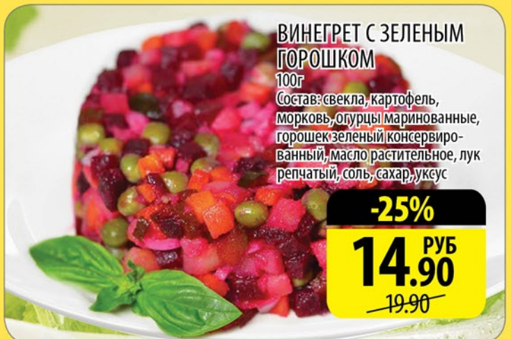
ВИНЕГРЕТ С ЗЕЛЕНЫМ ГОРОШКОМ 100г

Состав: свекла, картофель, морковь, огурцы маринованные, горошек зеленый консервиро- ванный, масло растительное, лук репчатый, соль, сахар, уксус