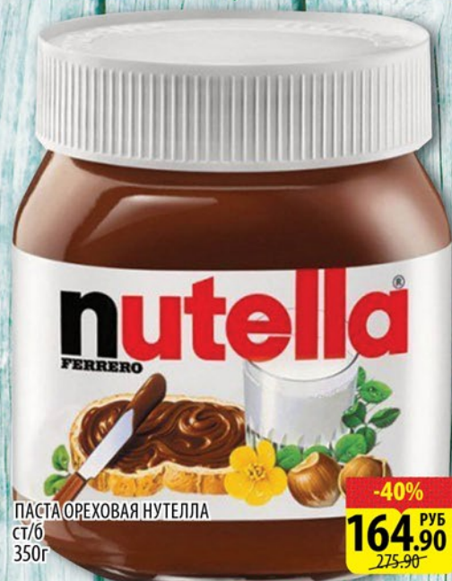
ПАСТА ОРЕХОВАЯ НУТЕЛЛА СТ/Б 350г