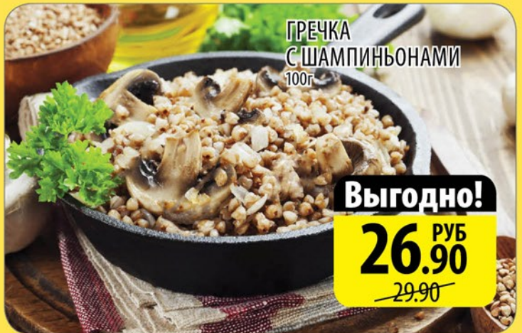
ГРЕЧКА С ШАМПИНЬОНАМИ 100г