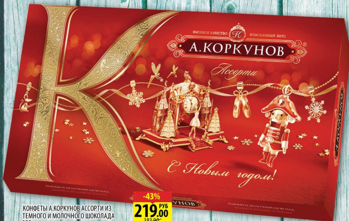
КОНФЕТЫ А.КОРКУНОВ АССОРТИ ИЗ ТЕМНОГО И МОЛОЧНОГО ШОКОЛАДА 190г