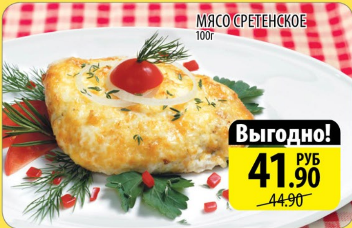
МЯСО СРЕТЕНСКОЕ 100г