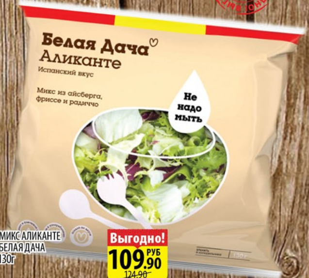
МИКС АЛИКАНТЕ БЕЛАЯ ДАЧА 130г