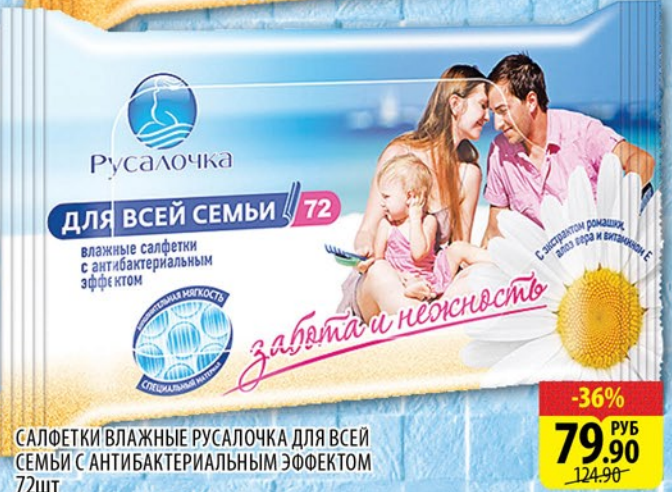
САЛФЕТКИ ВЛАЖНЫЕ РУСАЛОЧКА ДЛЯ ВСЕЙ СЕМЬИ С АНТИБАКТЕРИАЛЬНЫМ ЭФФЕКТОМ 72ШТ