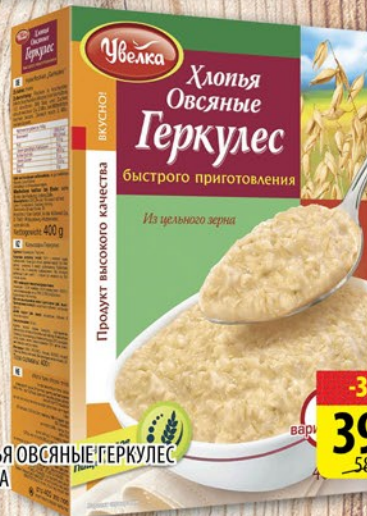
ХЛОПЬЯ ОВСЯНЫЕ ГЕРКУЛЕС УВЕЛКА 400г