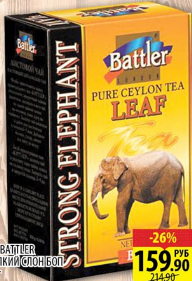
ЧАЙ БАТТЛЕР КРЕПКИЙ СЛОНБОЛ 250г