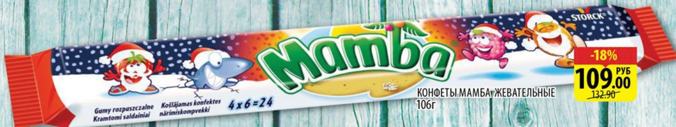
КОНФЕТЫ МАМБА ЖЕВАТЕЛЬНЫЕ 106г