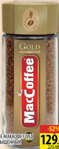
КОФЕ МАККОФЕ ГОЛД НАСЫЩЕННЫЙ ст/б 100г