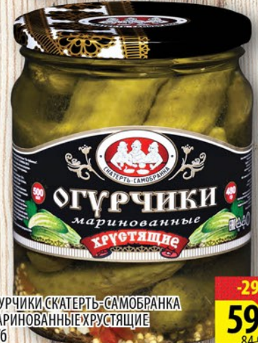
ОГУРЧИКИ СКАТЕРТЬ-САМОБРАНКА МАРИНОВАННЫЕ ХРУСТЯЩИЕ СТ/б 500мл