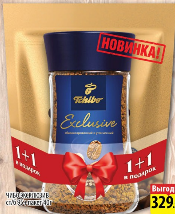
ЧИБО ЭКСКЛЮЗИВ ст/б 95+пакет 40г