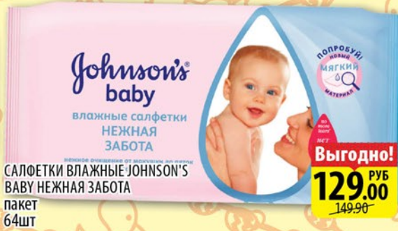
САЛФЕТКИ ВЛАЖНЫЕ JOHNSON'S BABY НЕЖНАЯ ЗАБОТА пакет 64шт