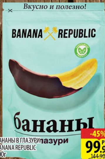
БАНАНЫ В ГЛАЗУРИ BANANA REPUBLIC 200г