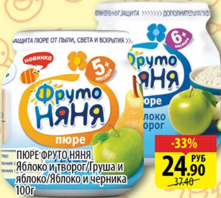
ПЮРЕ ФРУТО НЯНЯ Яблоко и творог/Груша и яблоко/Яблоко и черника 100г