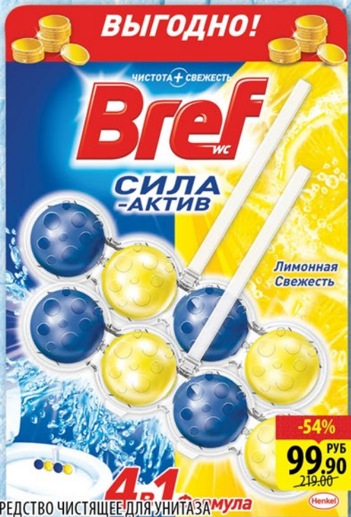
СРЕДСТВО ЧИСТЯЩЕЕ ДЛЯ УНИТАЗА БРЕФ СИЛА-АКТИВ ЛИМОННАЯ СВЕЖЕСТЬ 2*50г