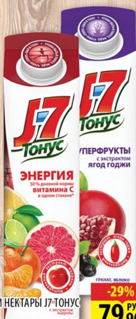
СОКИ И НЕКТАРЫ J7-ТОНУС 0,9л в ассортименте