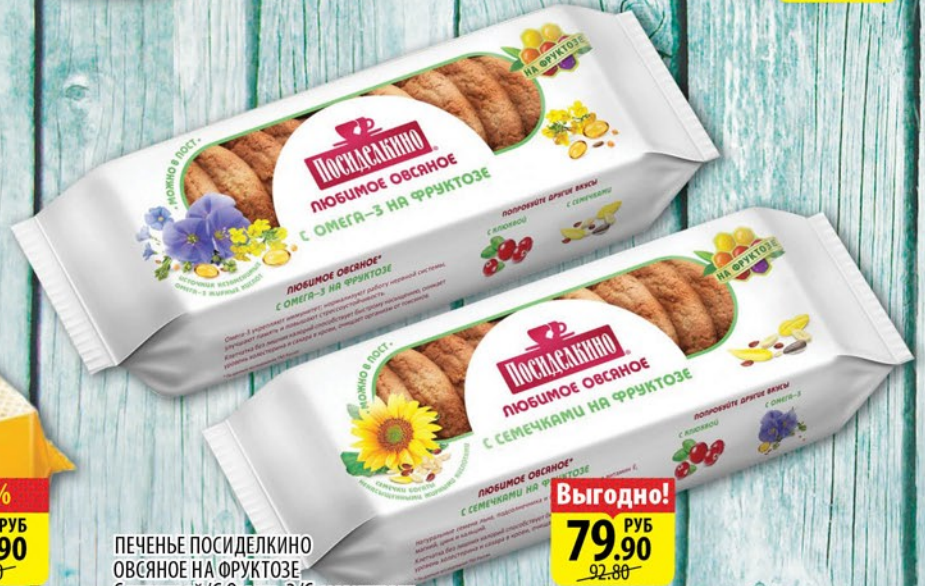
ПЕЧЕНЬЕ ПОСИДЕЛКИНО ОВСЯНОЕ НА ФРУКТОЗЕ С клюквой/С Омега-3/С семечками 300г