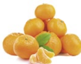
МАНДАРИНЫ 1 кг 60 90 ₽