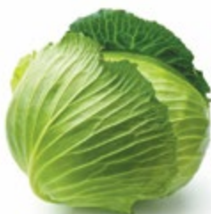
КАПУСТА свежая 1 кг 14 90 ₽