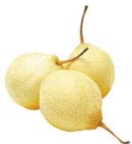
ГРУША КИТАЙСКАЯ 1 кг 76 90 ₽