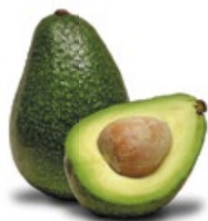
АВОКАДО 1 шт. 58 50 ₽

ЦЕНА НА ТОВАР ДЕЙСТВУЕТ В ПЕРИОД С 30.11.2016 ПО 13.12.2016