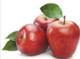
ЯБЛОКИ КРАСНЫЕ свежие 1 кг 69 90 ₽