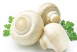
ШАМПИньОНЫ свежие 400 г (1 уп.) 129 90 ₽

* Ассортимент товаров, участвующих в акции, выделен на полке акционным ценником, размещенном в каждом торговом объекте. Возврат товара по акции осуществляется согласно условиям акции. Количество товара ограничено. АО «Тандер» оставляет за собой право изменить цену в случае резкого изменения цены поставщиком/производителем. Товары, подлежащие обязательной сертификации, сертифицированы. Указанные в данном каталоге сведения носят информационный характер и не являются публичной офертой. Доакционная цена в каталоге указана средняя по сети гипермаркетов «Магнит». Акционная цена рассчитана с учетом указанной скидки и округлена в пользу покупателя. Скидка в каталоге указана средняя по сети.