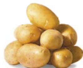
КАРТОФЕЛЬ свежий 1 кг 12 90 ₽

ЦЕНА НА ТОВАР ДЕЙСТВУЕТ В ПЕРИОД С 07.12.2016 ПО 13.12.2016