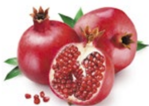
ГРАНАТ 1 кг 114 90 ₽

ЦЕНА НА ТОВАР ДЕЙСТВУЕТ В ПЕРИОД С 30.11.2016 ПО 06.12.2016