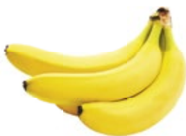
БАНАНЫ 1 кг 57 90 ₽