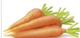
МОРКОВЬ свежая 1 кг 15 50 ₽

ЦЕНА НА ТОВАР ДЕЙСТВУЕТ В ПЕРИОД С 30.11.2016 ПО 13.12.2016