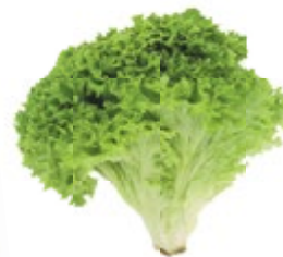
САЛАТ ЛИСТОВОЙ свежий 1 шт. 43 90 ₽