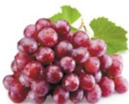
ВИНОГРАД РЕД ГЛОБ красный 1 кг 179 90 ₽