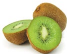
КИВИ 1 кг 79 90 ₽

ЦЕНА НА ТОВАР ДЕЙСТВУЕТ В ПЕРИОД С 07.12.2016 ПО 13.12.2016