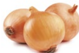
ЛУК РЕПЧАТЫЙ свежий 1 кг 15 90 ₽