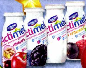
Напиток Актимель, в ассортименте, 2,5%, 100 г