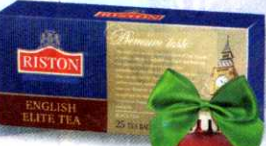
Чай Riston English Elite , черный, цейлонский, 25x2 г