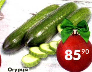
Огурцы среднеплодные, гладкие, 600 г