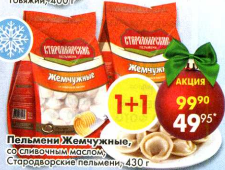
Пельмени Жемчужные , со сливочным маслом, Стародворские пельмени, 430 г