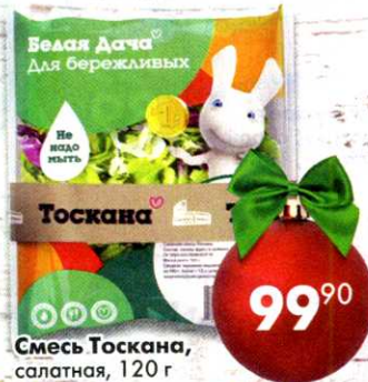
Смесь Тоскана, салатная, 120 г