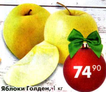
Яблоки Голден, 1 кг