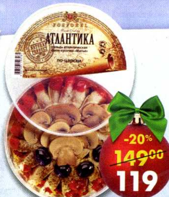
Сельдь Атлантика , филе-кусочки, по-царски, Fosforel, 400 г