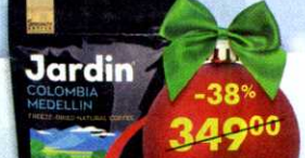
Кофе Jardin Colombia Medellin , сублимированный, растворимый, 150 г