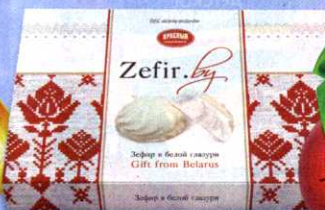
Зефир Красный пищевой , в белой глазури, 230 г