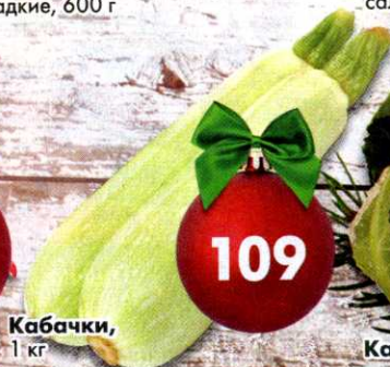
Кабачки, 1 кг