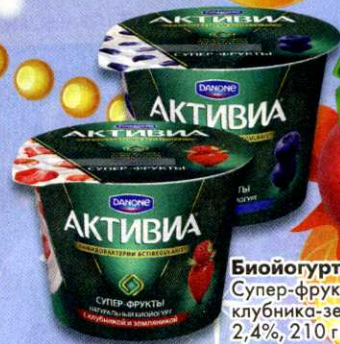
Биоюгurt Активиа, Супер-фрукты, черника, клубника-земляника, 2,4%, 210 г