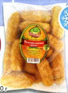
Палочки куриные , Край Лип, 800 г