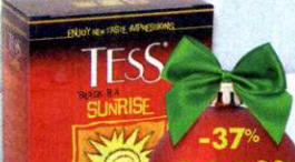
Чай Tess Sunrise , черный, цейлонский, 100x1,8 г