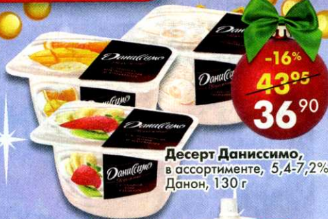
Десерт Даниссимо, в ассортименте, 5,4-7,2%, Данон, 130 г