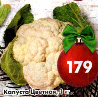
Капуста Цветная, 1 кг