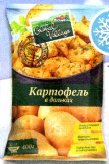
Картофель Global Village , в дольках, 400 г