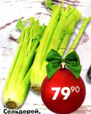
Сельдерей, стебель, 1 шт.