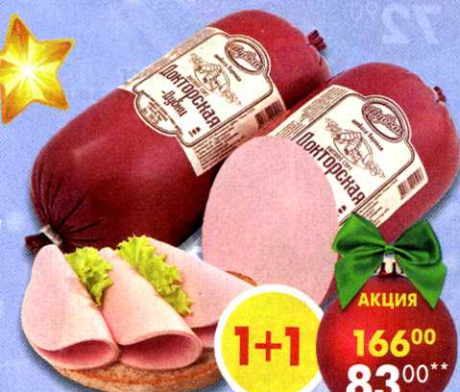
Колбаса Докторская , вареная, Дубки, 500 г