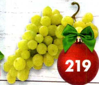
Виноград Белый, 1 кг