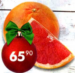
Грейпфрут красный, 1 кг