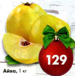
Айва, 1 кг