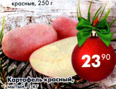
Картофель красный, мытый, 1 кг