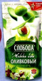
Майонез Слобода, оливковый, 67%, 400 мл