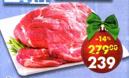
Лопатка свинья , охлажденная, Дальние дали**; Останкино, 1 кг