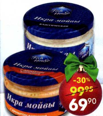
Икра мойвы Fish House , классическая; с ароматом копчения, 180 г