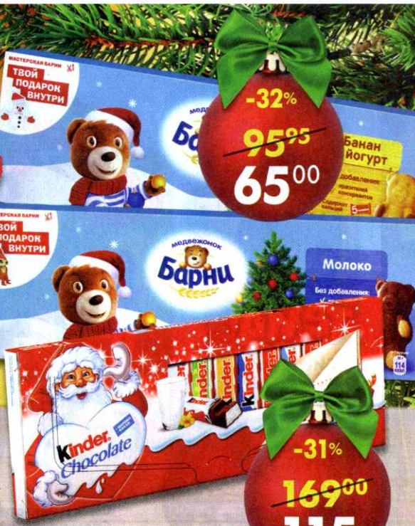
Шоколад Kinder Chocolate , молочный, с молочной начинкой, 150 г