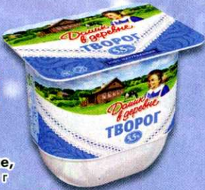
Творог Домик в деревне, мягкий, 5,5%, 200 г