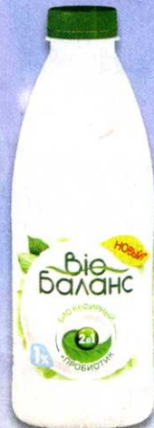
Кефирный продукт Био-Баланс, 1%, 930 мл