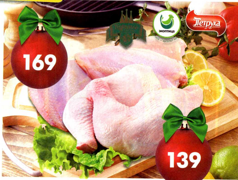
Куриные грудки , охлажденные, Экоптица; Куриное царство; Петруха, 1 кг Куриный окорочок , охлажденный, Экоптица; Куриное царство; Петруха, 1 кг