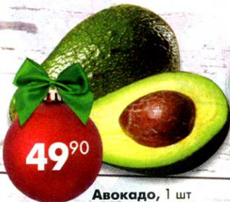
Авокадо, 1 шт