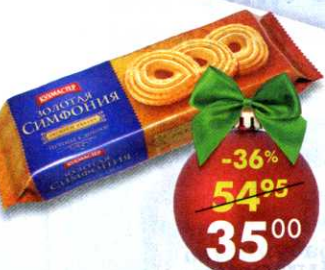
Печенье Золотая симфония , Кухмастер, 230 г