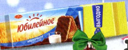
Печенье Юбилейное , молочное, с глазурию, 348 г