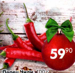
Перец Чили, 100 г