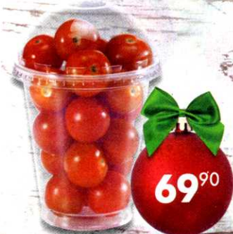
Томаты Черри Шейкер, красные, 250 г