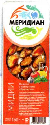
Мидии Меридиан , в масле с пряностями Брушетта, 150 г