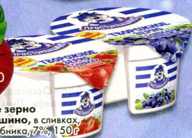
Творожное зерно Простоквашино, в сликах, черника; клубника, 7%, 150 г