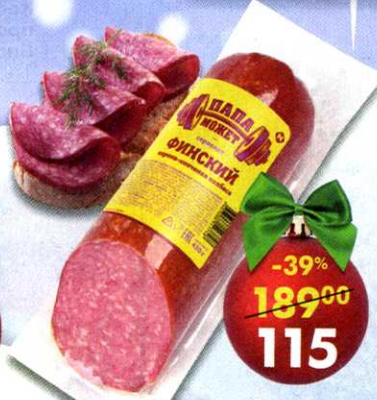
Сервелат Финский , варено-копченый, Останкино, 420 г