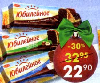
Печенье Юбилейное , в ассортименте, 112-116 г