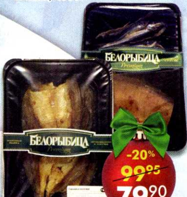
Рыбавяленая Белорыбца*** , тарашка; густера и корюшка, 120-130 г