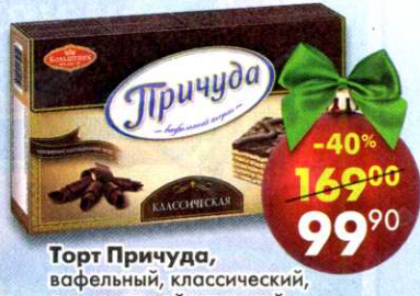
Торт Причуда , вафельный, классический, с арахисовой начинкой и с темным шоколадом, 370 г