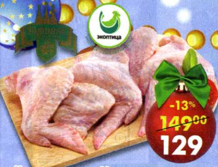
Куриные крылья** , охлажденные, Экоптица; Куриное царство, 1 кг