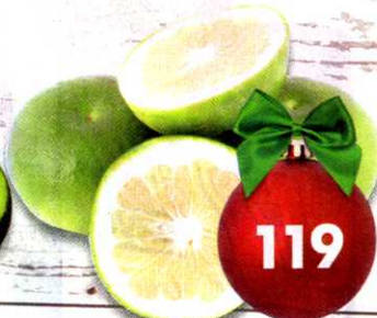
Грейпфрут Свити, 1 кг