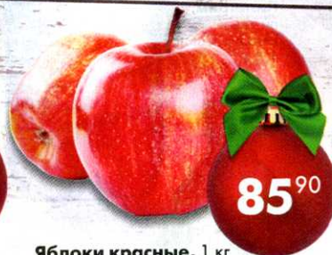
Яблоки красные, 1 кг