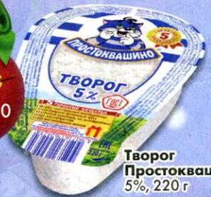
Творог Простоквашино, 5%, 220 г