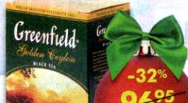
Чай Greenfield Golden Ceylon , крупнолистовой, 100 г