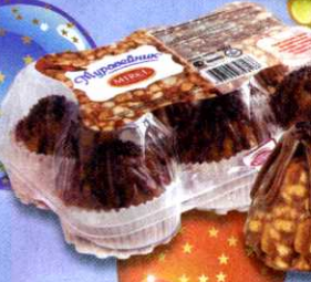
Пирожное Муравейник* , Mirel, 420 г