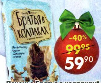
Печенье Братья в колпаках* , шоколадное, 265 г