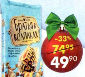
Печенье Братья в колпаках* , с абрикосовой начинкой*, 190 г