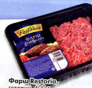
Фарш Restoria , говяжий, 400 г