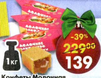
Конфеты Молочная лакомка , сливочный вкус, Ивкон, 1 кг