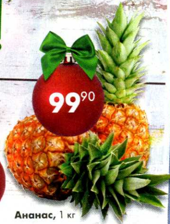
Ананас, 1 кг