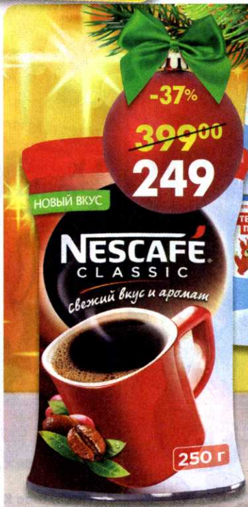
Кофе Nescafe Classic , натуральный, растворимый, 250 г