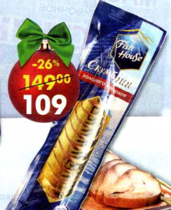
Скумбрия Fish House , холодного посола, 300 г