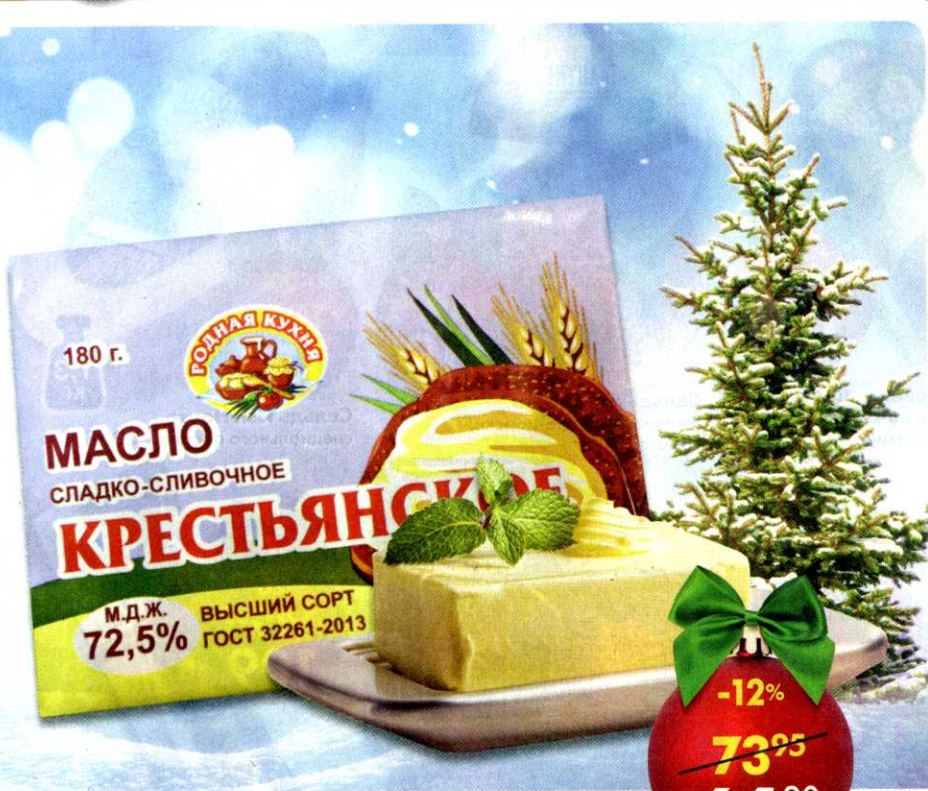
180 г. ГОДНАЯ КУХНЯ МАСЛО СЛАДКО-СЛИВОЧНОЕ КРЕСТЬЯНСКОЕ М.Д.Ж. 72,5% ВЫСШИЙ СОРТ ГОСТ 32261-2013