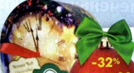
Чай Ahmad tea , новгородная ночь, черный, 60 г