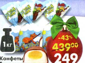
Конфеты Ежик кот , желейные, с молочной начинкой, 1 кг