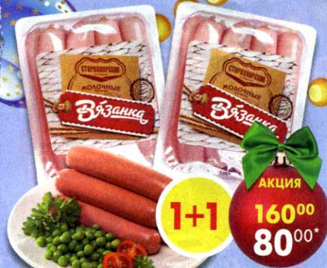
Сосиски Вязанка , молочные, Стародворские Колбасы, 500 г