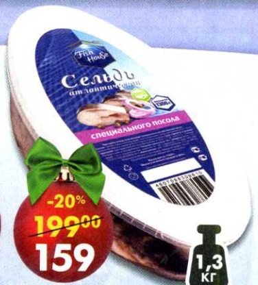
Сельдь Fish House , специального посола, 1300 г