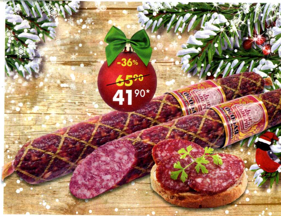
Колбаса Особая , сырокопченая, Дым Дымыч