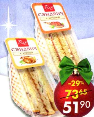
Сэндвич Robin's cafe*** , с курицей; с ветчиной, 150 г