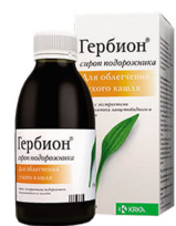
Гербион сироп плюща/ сироп подорожника/ сироп первоцвета