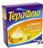
Терафлю вкус лимона №10