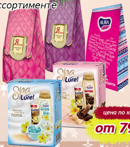
Подарочный набор, в ассортименте