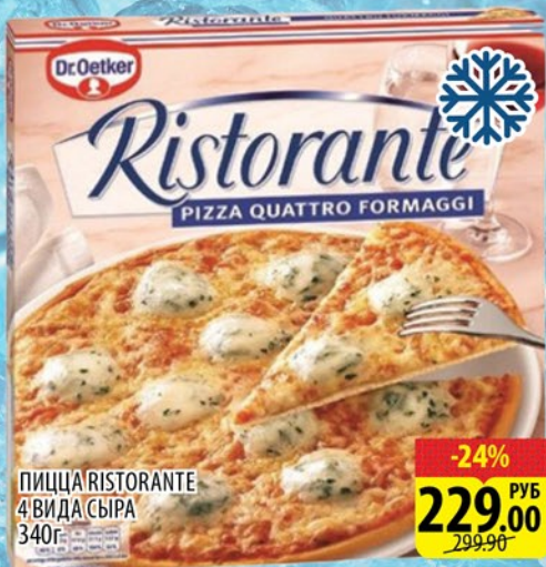
ПИЦЦА RISTORANTE 4 ВИДА СЫРА 340г