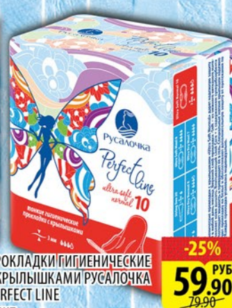
ПРОКЛАДКИ ГИГИЕНИЧЕСКИЕ С КРЫЛЫШКАМИ РУСАЛОЧКА PERFECT LINE 10шт