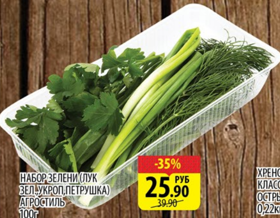
НАБОР ЗЕЛЕНИ (ЛУК ЗЕЛ., УКРОП, ПЕТРУШКА) АГРОСТИЛЬ 100г