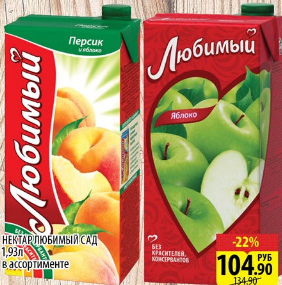
НЕКТАР ЛЮБИМЫЙ САД 1,93л в ассортименте