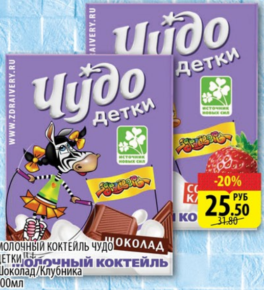
МОЛОЧНЫЙ КОКТЕЙЛЬ ЧУДО ДЕТКИ Шоколад/Клубника 200мл