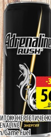
НАПИТОК ЭНЕРГЕТИЧЕСКИЙ ADRENALINE Rush/Game Fuel ж/6 0,25л