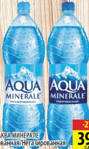
ВОДА АКВА МИНЕРАЛЕ Газированная/Негазированная 2л