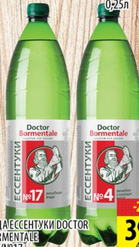
ВОДА ЭСSENТУКИ DOCTOR BORMENTALE №4/№17 пл/6 1,5л