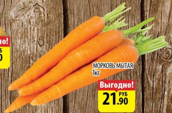
МОРКОВЬ МЫТАЯ 1кг