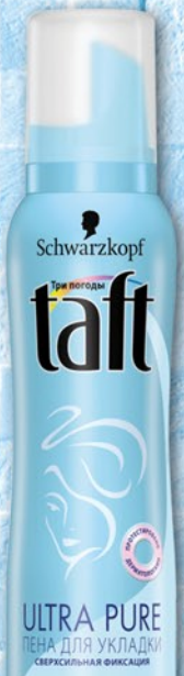
ПЕНА ДЛЯ ВОЛОС ТАФТ КЛАССИК Густые и Пышные Сверхсильная фиксация/Сила объема сверхсильная фиксация 150мл