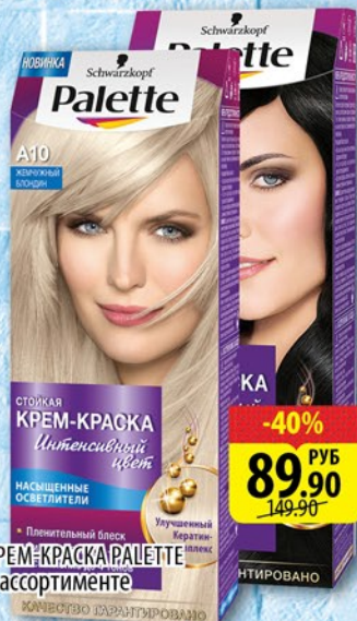
КРЕМ-КРАСКА ПАЛЕТТЕ в ассортименте