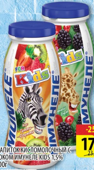
НАПИТОККИ С МОЛОЧНЫМ СОКОМ ИМУНЕЛЕ KIDS 1,5% 100г в ассортименте