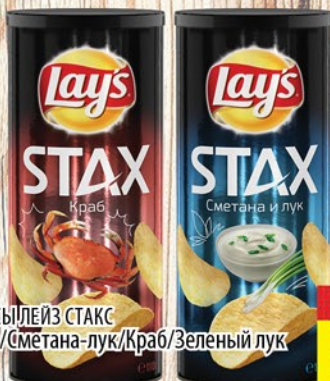
ЧИПСЫ ЛЕЙЗ СТАКС Соль/Сметана-лук/Краб/Зеленый лук 110г