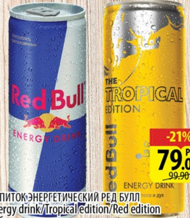
НАПИТОК ЭНЕРГЕТИЧЕСКИЙ РЕД БУЛЛ Energy drink/Tropical edition/Red edition ж/6 0,25л