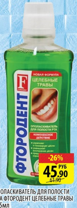
ОПОЛАСКИВАТЕЛЬ ДЛЯ ПОЛОСТИ РТА ФТОРОДЕНТ ЦЕЛЕБНЫЕ ТРАВЫ 275мл