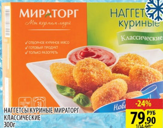
НАГГЕТСЫ КУРИНЫЕ МИРАТОРГ КЛАССИЧЕСКИЕ 300г