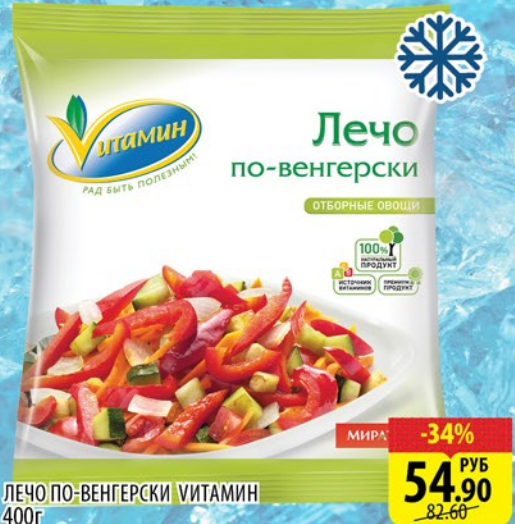
ЛЕЧО ПО-ВЕНГЕРСКИ ВИТАМИН 400г