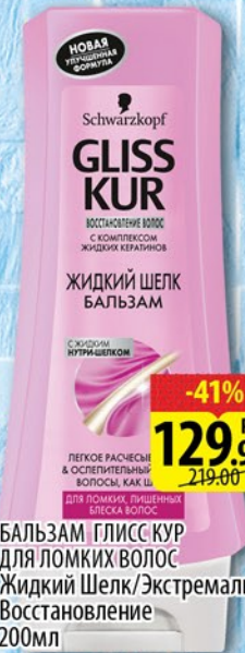
БАЛЬЗАМ ГЛИСС КУР ДЛЯ ЛОМКИХ ВОЛОС Жидкий Шелк/Экстремальное Восстановление 200мл