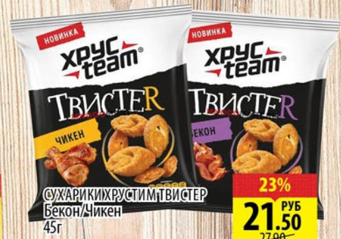
СУХАРИКИ ХРУСТИМ ТВИСТЕР Бекон/Чикен 45г