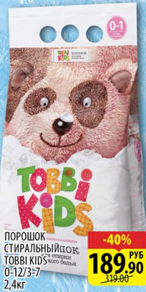
ПОРОШОК СТИРАЛЬНЫЙ ТОВБИ KIDS 0-12/3-7 2,4кг