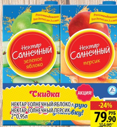
НЕКТАР СОЛНЕЧНЫЙ ЯБЛОКО и персик 2*0,95л