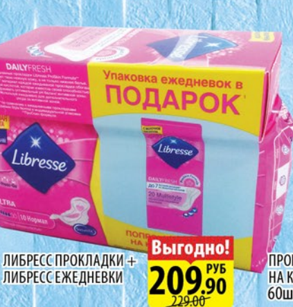
ЛИБРЕСС ПРОКЛАДКИ + ЛИБРЕСС ЕЖЕДНЕВКИ