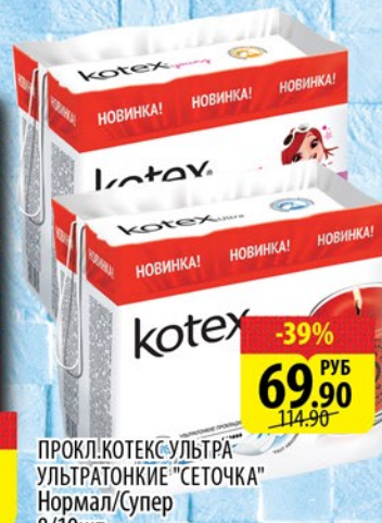
ПРОКЛ.КОТЕКС УЛЬТРА- УЛЬТРАТОНКИЕ "СЕТОЧКА" Нормал/Супер 8/10шт