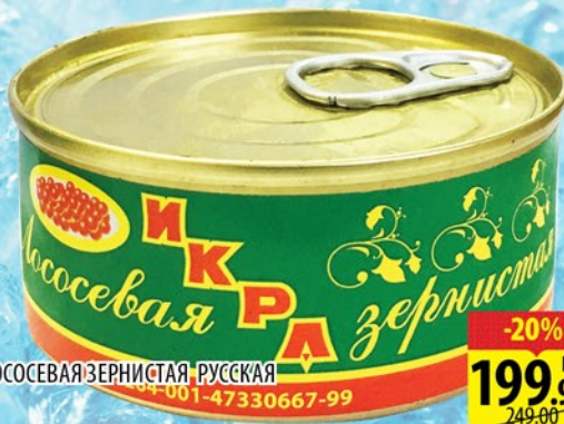
ИКРА ЛОСОСЕВАЯ ЗЕРНИСТАЯ РУССКАЯ ж/б 95г