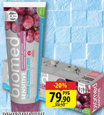
ЗУБНАЯ ПАСТА СПЛАТ БИОМЕД СЕНСЕТИВ 100г