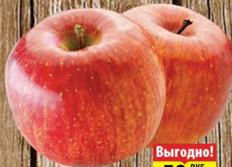
ЯБЛОКИ ФУДЖИ/ФУШИ 1кг