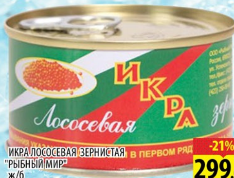
ИКРА ЛОСОСЕВАЯ ЗЕРНИСТАЯ "РЫБНЫЙ МИР" ж/б 130г