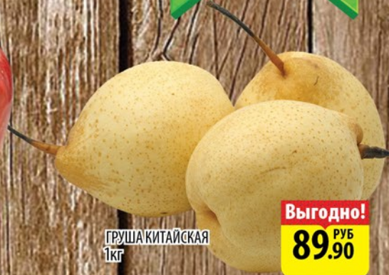
ГРУША КИТАЙСКАЯ 1кг