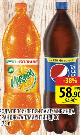
ВОДА ПЕПСИ/ПЕПСИ ЛАЙТ/МИРИНДА ОРАНДЖ/7АП/МАУНТИНДЮ 1,75 л