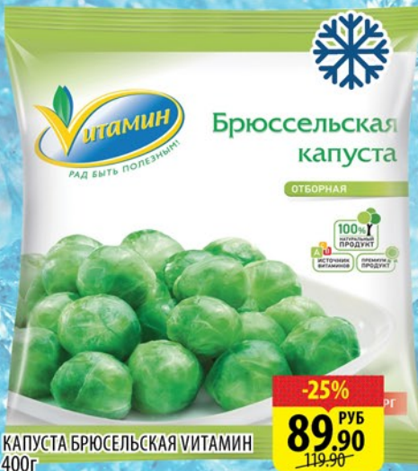
КАПУСТА БРЮССЕЛЬСКАЯ ВИТАМИН 400г