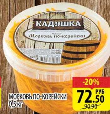
МОРКОВЬ ПО-КОРЕЙСКИ 0,5 кг