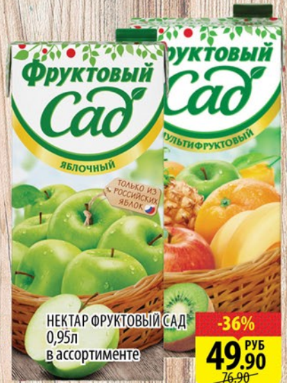
НЕКТАР ФРУКТОВЫЙ САД 0,95л в ассортименте