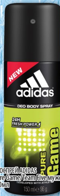
ДЕОСПРЕЙ ADIDAS Pure Game/Team Five мужской 150мл