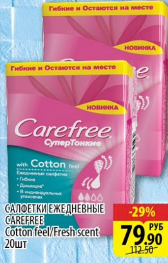
САЛОТКИ ЕЖЕДНЕВНЫЕ CAREFREE Cotton feel/Fresh scent 20шт