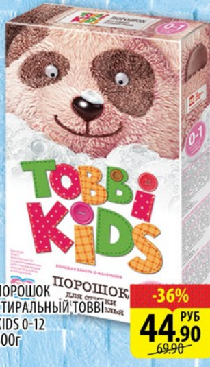
ПОРОШОК СТИРАЛЬНЫЙ ТОВБИ KIDS 0-12 400г