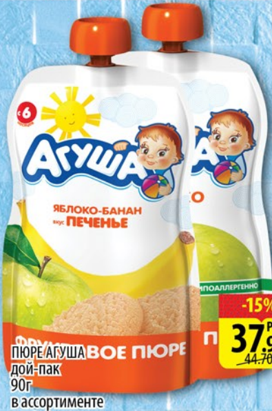
ПЮРЕ АГУША ДОЙ-ПАК 90г в ассортименте