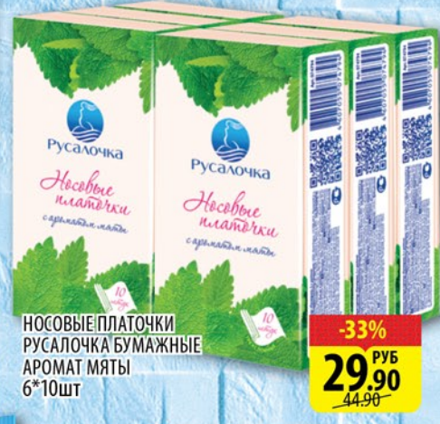
НОСОВЫЕ ПЛАТОЧКИ РУСАЛОЧКА БУМАЖНЫЕ АРОМАТ МЯТЫ 6*10ШТ