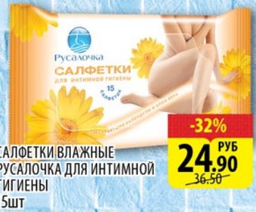
САЛОТКИ ВЛАЖНЫЕ РУСАЛОЧКА ДЛЯ ИНТИМНОЙ ГИГИЕНЫ 15шт в ассортименте