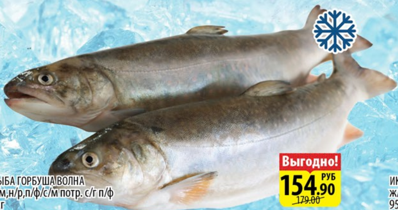
РЫБА ГОРБУША/ВОЛНА с/м/н/р/п/ф/с/м потр. с/г п/ф 1кг