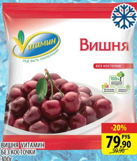
ВИШНЯ ВИТАМИН БЕЗ КОСТОЧКИ 300г