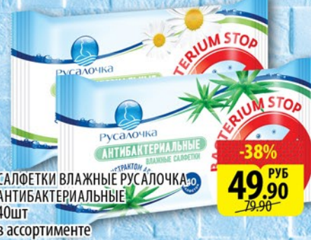
САЛОТКИ ВЛАЖНЫЕ РУСАЛОЧКА АНТИБАКТЕРИАЛЬНЫЕ в ассортименте