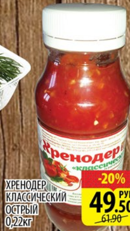
ХРЕНОДЕР КЛАССИЧЕСКИЙ ОСТРЫЙ 0,22кг