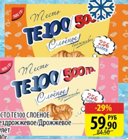
ТЕСТО ТЕ100 СЛОЕНОЕ Бездрожжевое/Дрожжевое рулет 500г