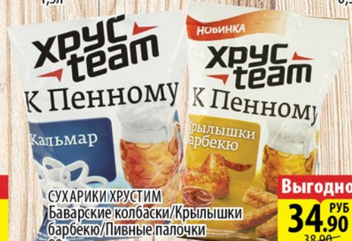
СУХАРИКИ ХРУСТИМ Баварские колбаски/Крылышки барбекю/Пивные палочки 90г