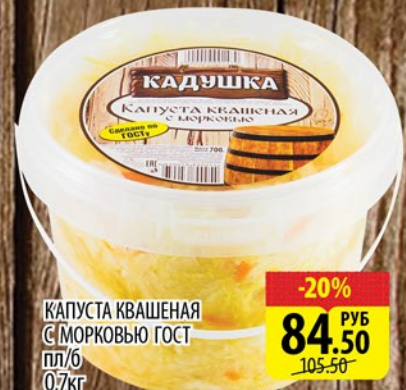
КАПУСТА КВАШЕНАЯ С МОРКОВЬЮ ГОСТ ПЛ/6 0,7кг