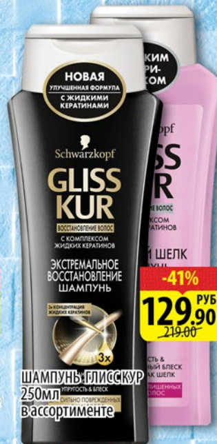
ШАМПУНЬ ГЛИССКУР 250мл в ассортименте