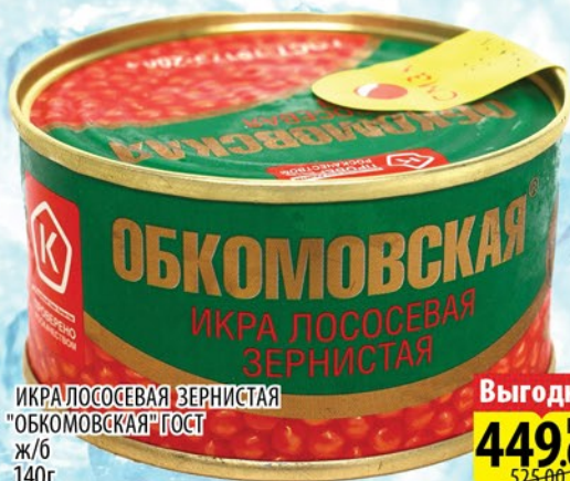
ИКРА ЛОСОСЕВАЯ ЗЕРНИСТАЯ "ОБКОМОВСКАЯ" ГОСТ ж/б 140г