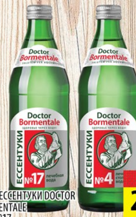
ВОДА ЭСSENТУКИ DOCTOR BORMENTALE №4/№17 ст/6 0,5л