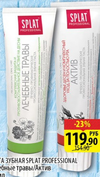
ПАСТА ЗУБНАЯ SPLAT PROFESSIONAL Лечебные травы/Актив 100мл