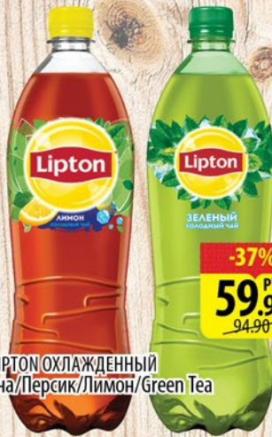
ЧАЙ LIPTON ОХЛАЖДЕННЫЙ Малина/Персик/Лимон/Green Tea пл/6 1,5л