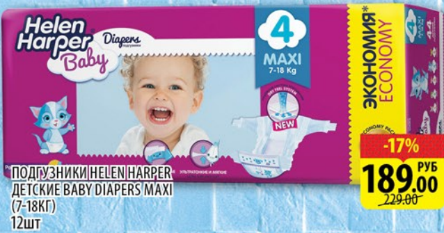
ПОДГУЗНИКИ HELEN HARPER ДЕТСКИЕ BABY DIAPERS MAXI (7-18KG) 12шт