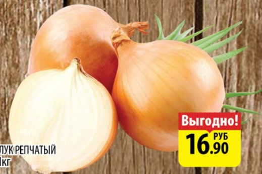
ЛУК РЕПЧАТЫЙ 1кг