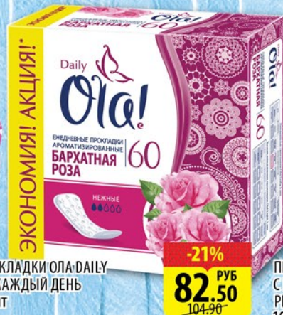
ПРОКЛАДКИ ОЛА-DAILY НА КАЖДЫЙ ДЕНЬ 60шт