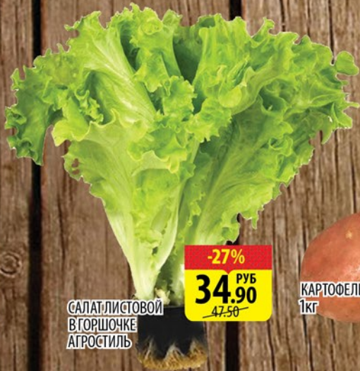
САЛАТ ЛИСТОВОЙ В ГОРШОЧКЕ АГРОСТИЛЬ