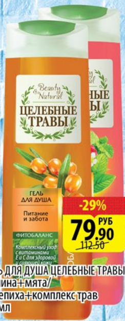
ГЕЛЬ ДЛЯ ДУША ЦЕЛЕБНЫЕ ТРАВЫ Малина+мята/ Облепиха+комплекс трав 260мл