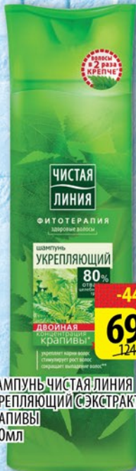
ШАМПУНЬ ЧИСТАЯ ЛИНИЯ УКРЕПЛЯЮЩИЙ ЭКСТРАКТОМ КРАПИВЫ 400мл