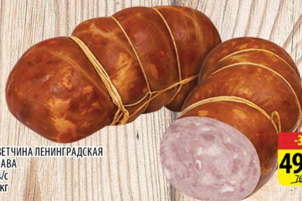
ВЕТЧИНА ЛЕНИНГРАДСКАЯ САВА в/с 1кг