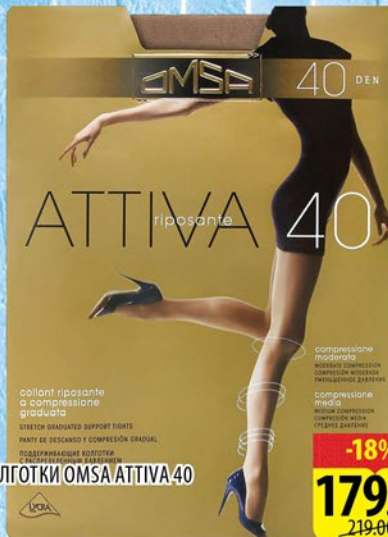
КОЛГОТКИ OMSA ATTIVA 40