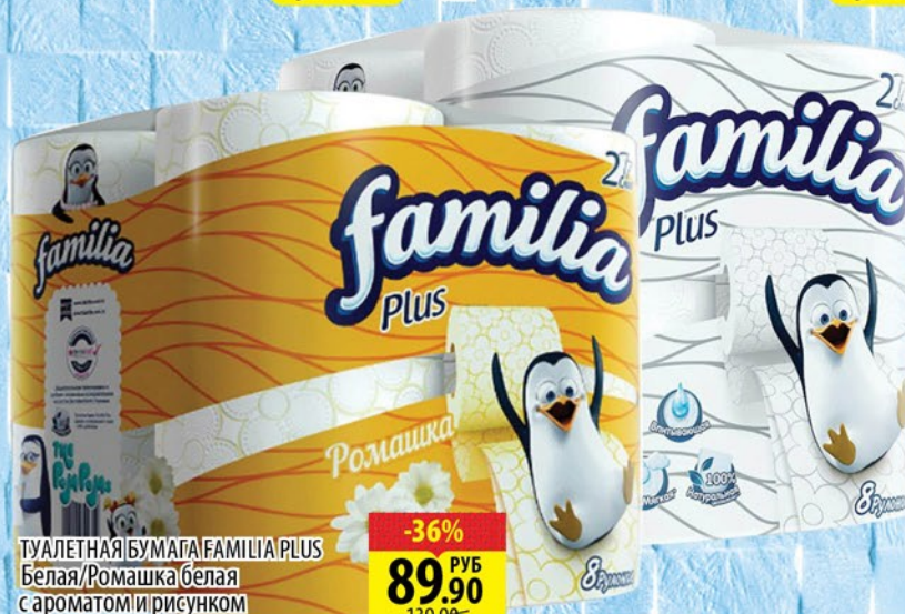
ТУАЛЕТНАЯ БУМАГА FAMILIA PLUS Белая/Ромашка белая с ароматом и рисунком 2сл, 8шт