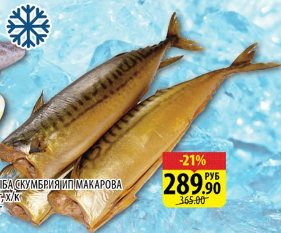
РЫБА СКУМБРИЯ И П. МАКАРОВА б/г, х/к 1кг