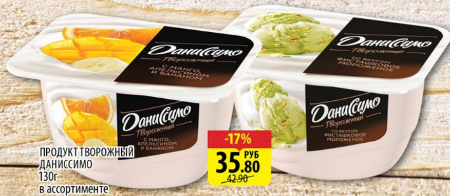
ПРОДУКТ ТВОРОЖНЫЙ ДАНИССИМО 130г в ассортименте