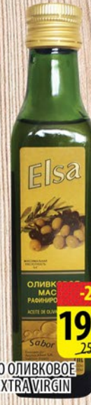
МАСЛО ОЛИВКОВОЕ ELSA EXTRA VIRGIN 0,25л