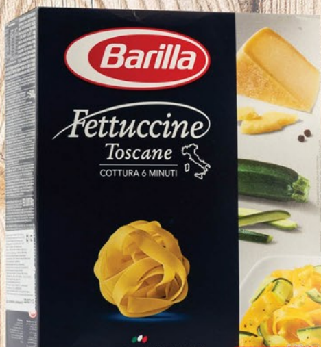
МАКАРОННЫЕ ИЗДЕЛИЯ BARILLA ФЕТТУЧИНЕ 500г