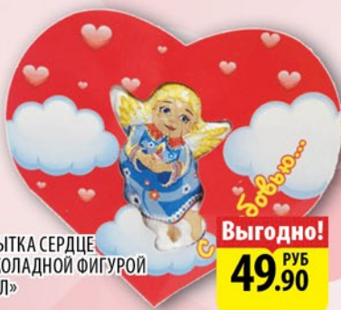
ОТКРЫТКА СЕРДЦЕ С ШОКОЛАДНОЙ ФИГУРОЙ «АНГЕЛ» 10г