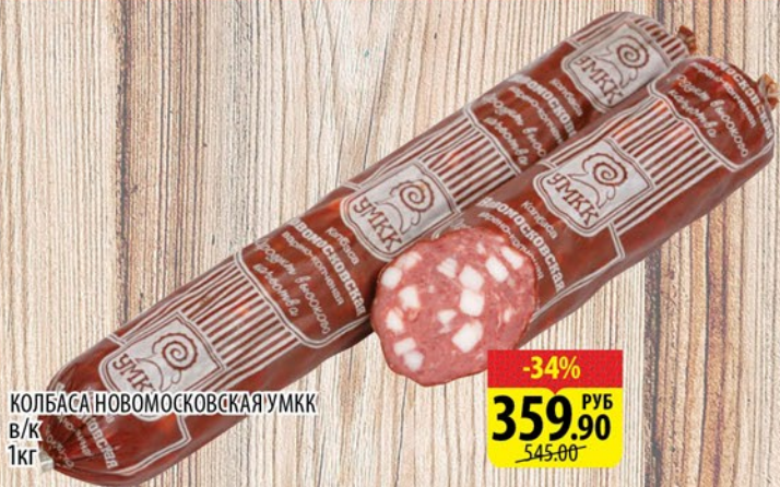
КОЛБАСА НОВОМОСКОВСКАЯ УМКК в/к 1кг