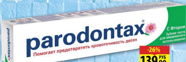
ПАСТА ЗУБНАЯ PARODONTAX С ФТОРОМ 75мл