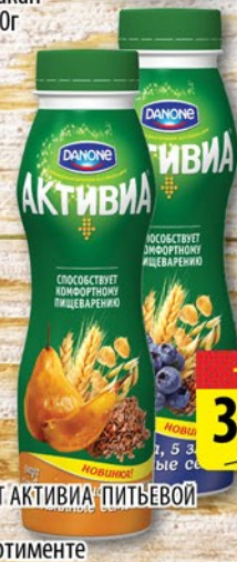
ЙОГУРТ АКТИВИЯ ПИТЬЕВОЙ 290г в ассортименте