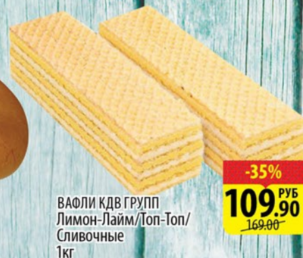
ВАФЛИ КДВ ГРУПП Лимон-Лайм/Топ-Топ/ Сливочные 1кг