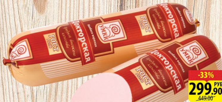
КОЛБАСА ДОКТОРСКАЯ УМКК 1кг