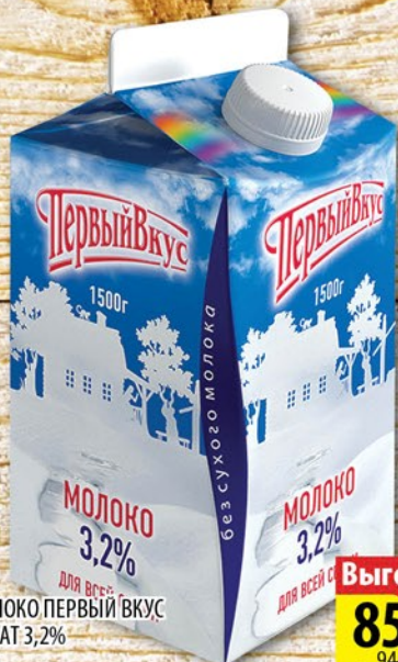
МОЛОКО ПЕРВЫЙ ВКУС АЛЛАТ 3,2% 1,5л