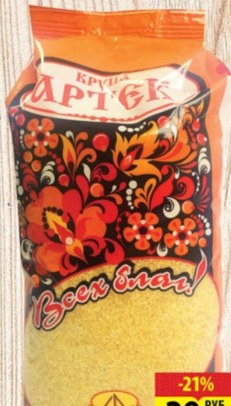
КРУПА ВСЕХ БЛАГ ПШЕНИЧНАЯ «АРТЕК» 700г