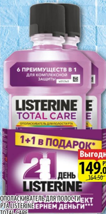
ОПОЛАСКИВАТЕЛЬ ДЛЯ ПОЛОСТИ РТА ЛИСТЕРИН TOTAL CARE 250мл