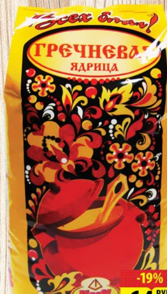
КРУПА ВСЕХ БЛАГ ГРЕЧНЕВАЯ ЯДРИЦА 800г