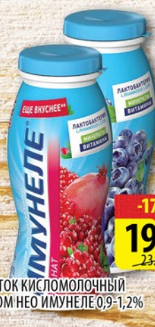
НАПИТОК КИСЛОМОЛОЧНЫЙ С СОКОМ НЕО ИМУНЕЛЕ 0,9-1,2% 100г в ассортименте