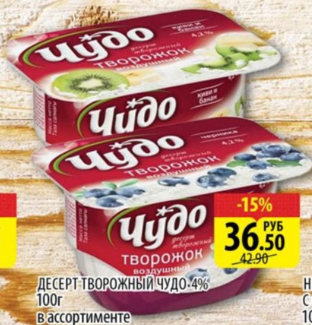
ДЕСЕРТ ТВОРОЖНЫЙ ЧУДО 4% 100г в ассортименте