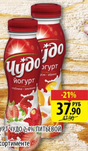
ЙОГУРТ ЧУДО 2,4% ПИТЬЕВОЙ 290г в ассортименте