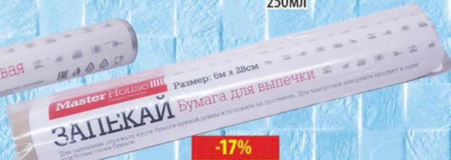
БУМАГА ДЛЯ ВЫПЕЧКИ ЗАПЕКАЙ