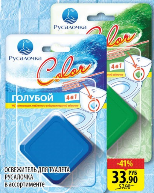
ОСВЕЖИТЕЛЬ ДЛЯ ТУАЛЕТА РУСАЛОЧКА в ассортименте