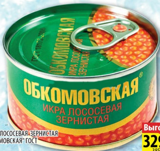
ИКРА ЛОСОСЕВАЯ ЗЕРНИСТАЯ "ОБКОМОВСКАЯ" ГОСТ ж/б 100г