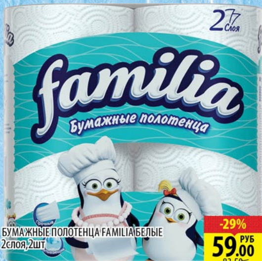
БУМАЖНЫЕ ПОЛОТЕНЦА FAMILIA БЕЛЫЕ 2слоя, 2шт