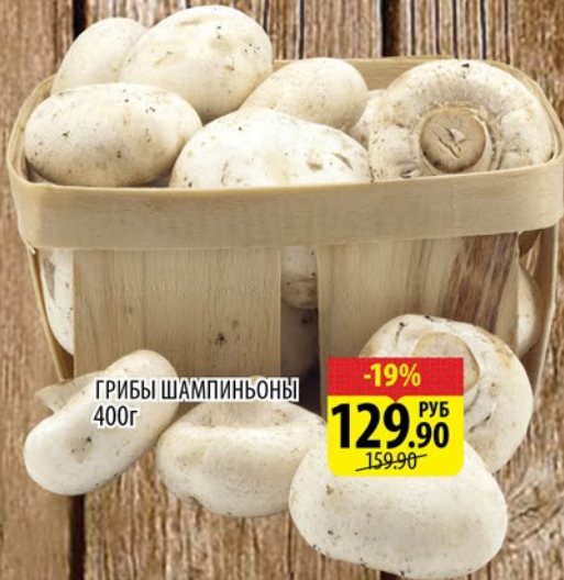
ГРИБЫ ШАМПИЬОНЫ 400г