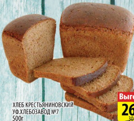
ХЛЕБ КРЕСТЬЯНИНОВСКИЙ УФ.ХЛЕБОЗАВОД №7 500г