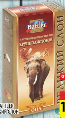
ЧАЙ BATTLER ВЕЛИКИЙ СЛОН 250г