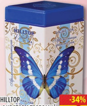
ЧАЙ HILLTOP Вальс цветов / Стравми / Ароматная фантазия ж/б 100г