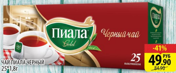
ЧАЙ ПИАЛА ЧЕРНЫЙ 25*1,8г