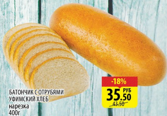
БАТОНЧИК СОТРУБЯМИ УФИМСКИЙ ХЛЕБ нарезка 400г