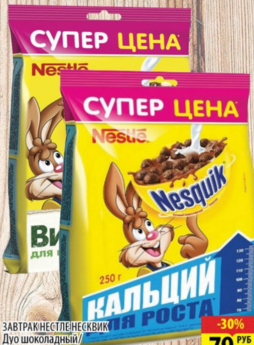
ЗАВТРАК НЕСТЛЕ НЕСКВИК Дуо шоколадный/ Молоко+шоколад пакет 250г