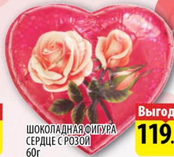
ШОКОЛАДНАЯ ФИГУРА СЕРДЦЕ С РОЗОЙ 60г