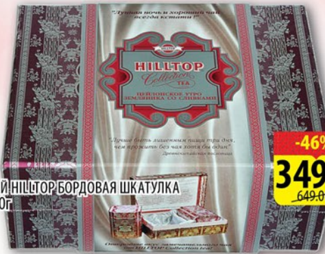
ЧАЙ HILLTOP БОРДОВАЯ ШКАТУЛКА 120г