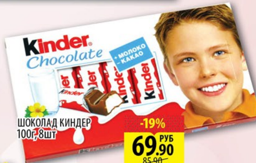
ШОКОЛАД КИНДЕР 100г, 8шт