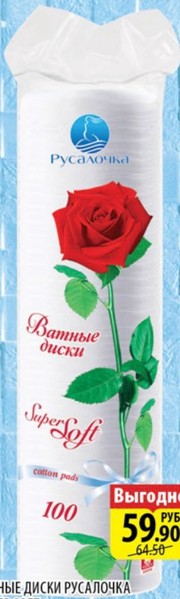
ВАТНЫЕ ДИСКИ РУСАЛОЧКА SUPER-SOFT 100шт