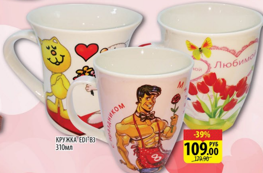
КРУЖКА EDI-B3 310мл