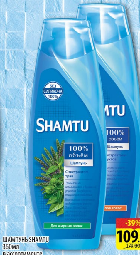
ШАМПУНЬ SHAMTU 360мл в ассортименте