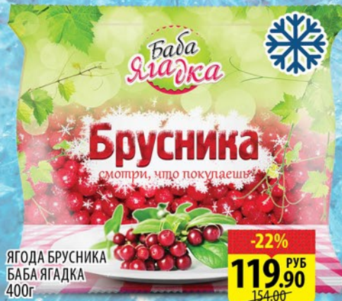
ЯГОДА БРУСНИКА БАБА ЯГАДКА 400г