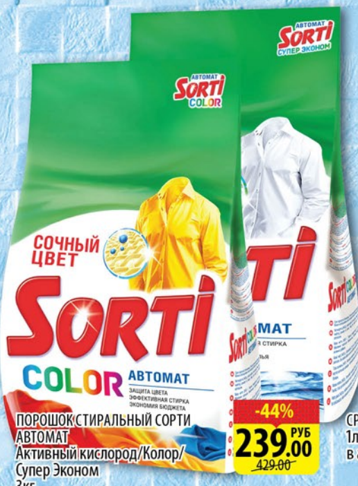
ПОРОШОК СТИРАЛЬНЫЙ СОРТИ АВТОМАТ Активный кислород/Колор/Супер Эконом 3кг