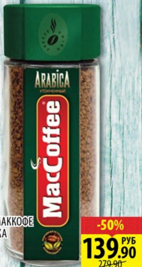
КОФЕ МАККОФЕ АРАБИКА ст/б 100г