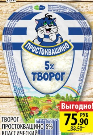
ТВОРОГ ПРОСТОКВАШИНО 5% КЛАССИЧЕСКИЙ 220г