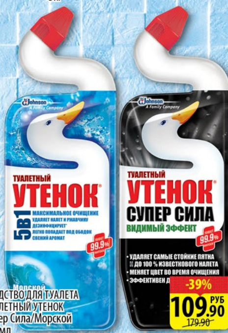
СРЕДСТВО ДЛЯ ТУАЛЕТА ТУАЛЕТНЫЙ УТЕНОК Супер Сила/Морской 750мл