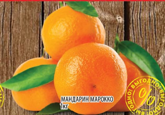
МАНДАРИН МАРОККО 1кг