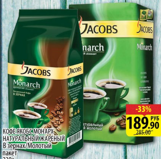
КОФЕ ЯКОБС МОНАРХ НАТУРАЛЬНЫЙ ЖАРЕННЫЙ В зёрнах/Молотый пакет 230г