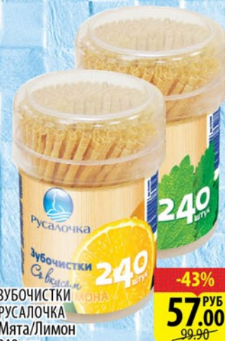
ЗУБОЧИСТКИ РУСАЛОЧКА Мята/Лимон 240 шт