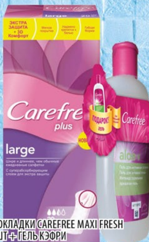
ПРОКЛАДКИ CAREFREE MAXI FRESH 20шт + ГЕЛЬ КЭФРИ