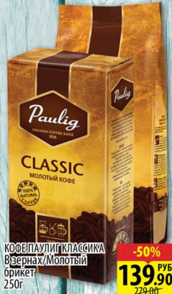
КОФЕ ПАУЛИГ КЛАССИКА В зёрнах/Молотый брикет 250г