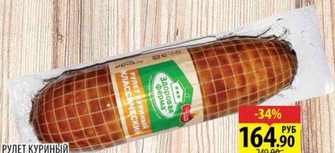
РУЛЕТ КУРИНЫЙ ЗДОРОВАЯ ФЕРМА в/к, в/у 1кг