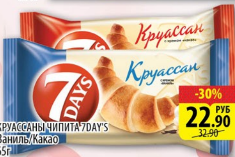
КРУАССАНЫ ЧИПИТА 7 DAYS Ваниль/Какао 65г