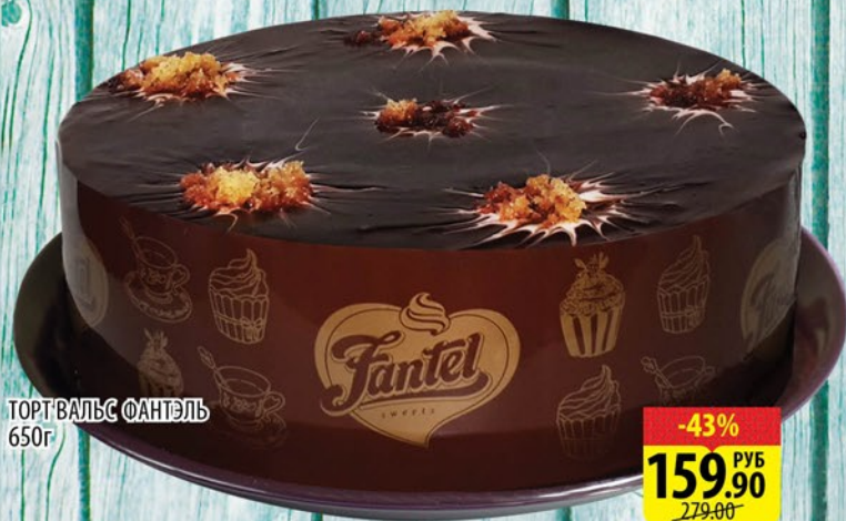
ТОРТ ВАЛЬС ФАНТЭЛЬ 650г