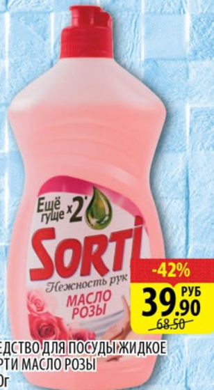
СРЕДСТВО ДЛЯ ПОСУДЫ ЖИДКОЕ СОРТИ МАСЛО РОЗЫ 520г