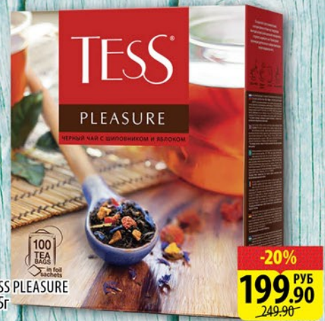
ЧАЙ TESS PLEASURE 100*1,5г