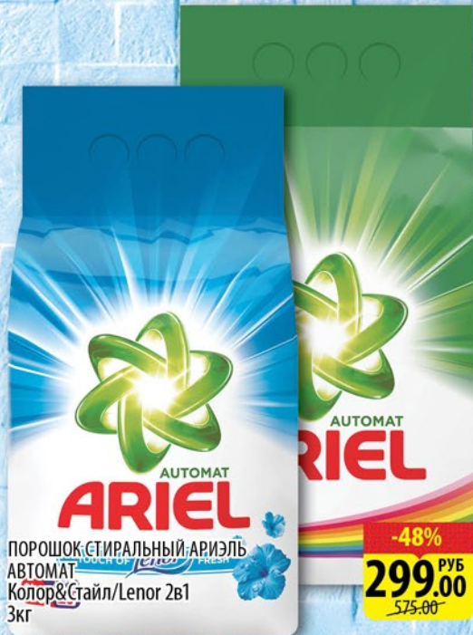
ПОРОШОК СТИРАЛЬНЫЙ АРИЭЛЬ АВТОМАТ Колор&Стайл/Lenor 2в1 3кг