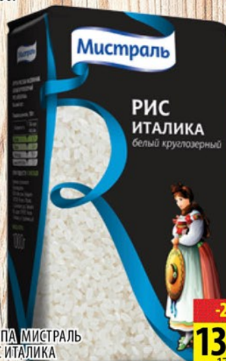
КРУПА МИСТРАЛЬ РИС ИТАЛИКА к/з 1кг