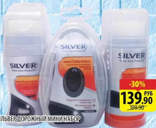
СИЛВЕР ДОРОЖНЫЙ МИНИ НАБОР