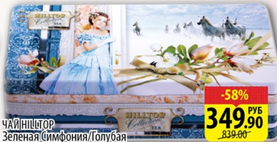
ЧАЙ HILLTOP Зеленая Симфония / Голубая лагуна / Ожидание ж/б 125/160/150г