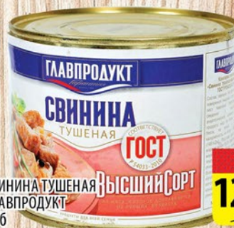
СВИНИНА ТУШЕНАЯ ВЫСШИЙ СОРТ ГЛАВПРОДУКТ ст/б 525г