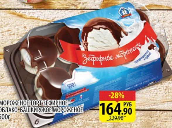
МОРОЖЕНОЕ ТОРТ ЗЕФИРНОЕ ОБЛАКО БАШКИРСКОЕ МОРОЖЕНОЕ 500г