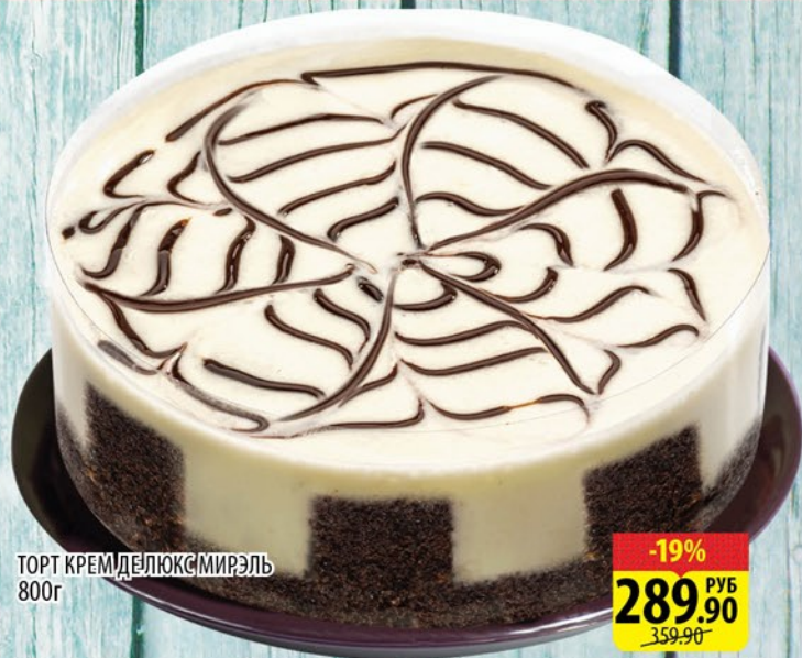
ТОРТ КРЕМ ДЕЛЮКС МИРЭЛЬ 800г