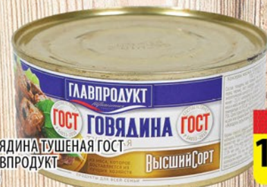
ГОВЯДИНА ТУШЕНАЯ ГЛАВПРОДУКТ ВЫСШИЙ СОРТ ст/б 500г