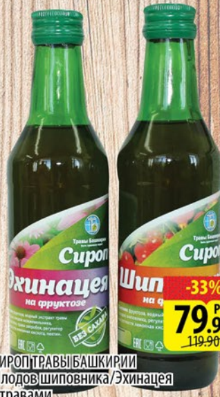
СИРОП ТРАВЫ БАШКИРИИ Плодов шиповника/Эхинацея с травами 240мл