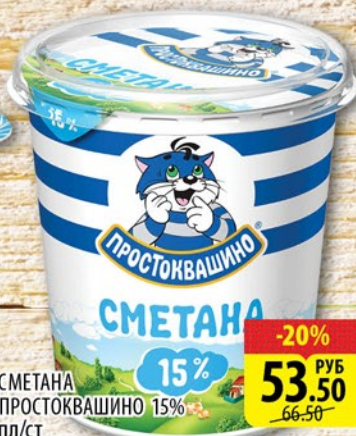
СМЕТАНА ПРОСТОКВАШИНО 15% пл/ст 315г