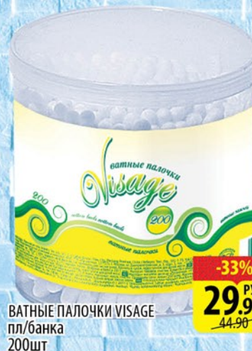
ВАТНЫЕ ПАЛОЧКИ VISAGE пл/банка 200шт