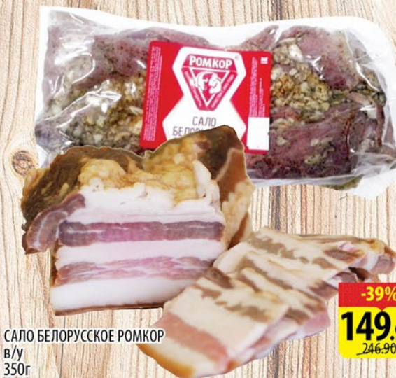
САЛО БЕЛОРУССКОЕ РОМКОР в/у 350г