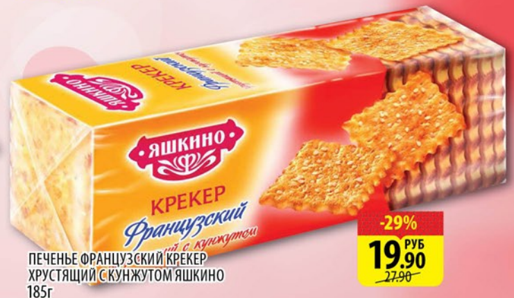
ПЕЧЕНЬЕ ФРАНЦУЗСКИЙ КРЕКЕР ХРУСТАЯЩИЙ С КУНЖУТОМ ЯШКИНО 185г