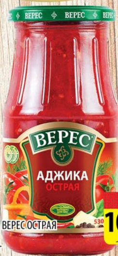
АДЖИКА ВЕРЕС ОСТРАЯ ст/б 515-530г