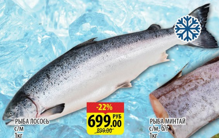
РЫБА ЛОСОСЬ с/м 1кг