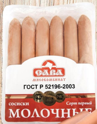
СОСИСКИ МОЛОЧНЫЕ ГОСТ САВА 300г