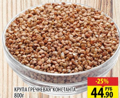
КРУПА ГРЕЧНЕВАЯ 'КОНСТАНТА' 800г