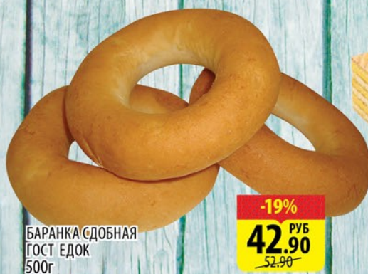
БАРАНКА СДОБНАЯ ГОСТ ЕДОК 500г