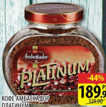
КОФЕ АМБАССАДОР ПЛАТИНУМ ст/б 95г