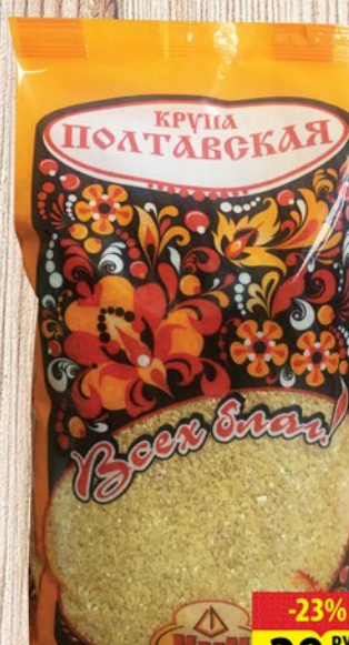
КРУПА ВСЕХ БЛАГ ПОЛТАВСКАЯ 700г