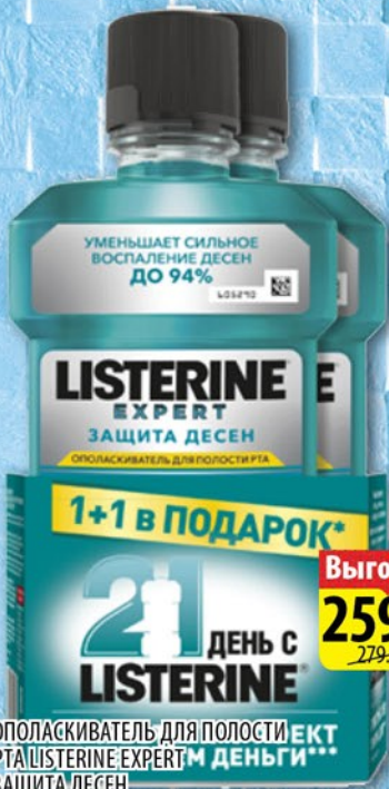
ОПОЛАСКИВАТЕЛЬ ДЛЯ ПОЛОСТИ РТА ЛИСТЕРИН ЭКСПЕРТ ЗАЩИТА ДЕСЕН 250мл