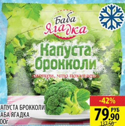
КАПУСТА БРОККОЛИ БАБА ЯГАДКА 400г