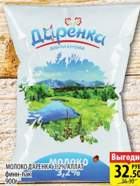
МОЛОКО ДАРЕНКА 3,2% АЛЛАТ финн-пак 900г