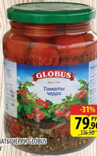
ТОМАТЫ ЧЕРРИ GLOBUS 680г