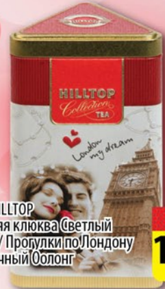
ЧАЙ HILLTOP Зимняя клюква / Светлый ангел / Пролулки по Лондону / Молочный Оолонг ж/б 50г