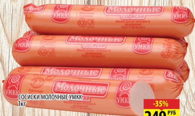
СОСИСКИ МОЛОЧНЫЕ УМКК 1кг