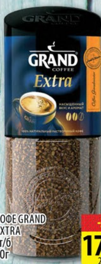
КОФЕ GRAND EXTRA ст/б 90г