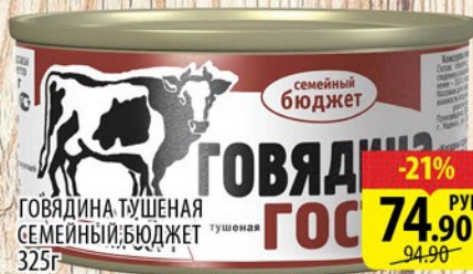
ГОВЯДИНА ТУШЕНАЯ СЕМЕЙНЫЙ БЮДЖЕТ 325г