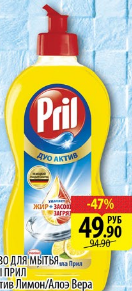
СРЕДСТВО ДЛЯ МЫТЬЯ ПОСУДЫ ПРИЛ ДУО-АКТИВ Лимон/Алоэ Вера 450мл