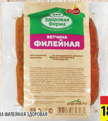
ВЕТЧИНА ФИЛЕЙНАЯ ЗДОРОВАЯ ФЕРМА 1кг