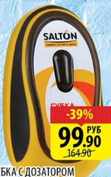
ГУБКА С ДОЗАТОРОМ САЛТОН ДЛЯ ОБУВИ ИЗ ГЛАДКОЙ КОЖИ Черный