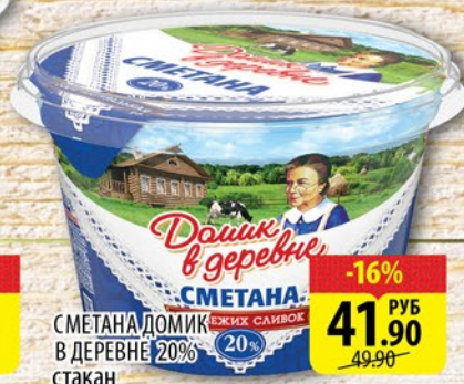
СМЕТАНА ДОМИК В ДЕРЕВНЕ 20% стакан 180г