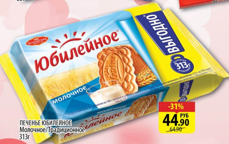
ПЕЧЕНЬЕ ЮБИЛЕЙНОЕ Молочное / Традиционное 313г