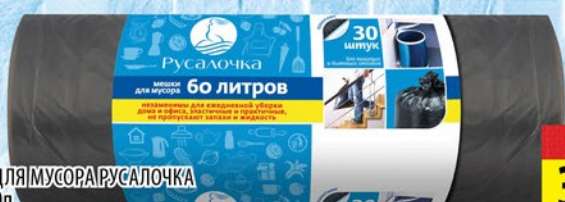
МЕШКИ ДЛЯ МУСОРА РУСАЛОЧКА 30шт*60л