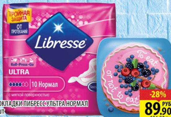
ПРОКЛАДКИ ЛИБРЕСС-УЛЬТРА НОРМАЛ 10шт