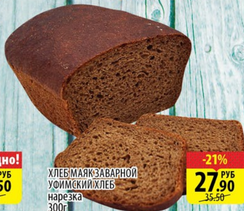
ХЛЕБ МАЯК ЗАВАРНОЙ УФИМСКИЙ ХЛЕБ нарезка 300г