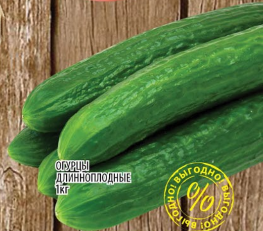
ОГУРЦЫ ДЛИННОПЛОДНЫЕ 1кг