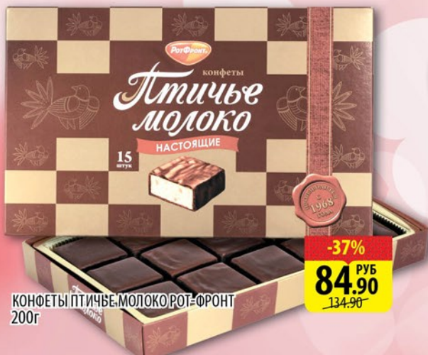
КОФЕТЫ ПТИЧЬЕ МОЛОКО РОТ-ФРОНТ 200г