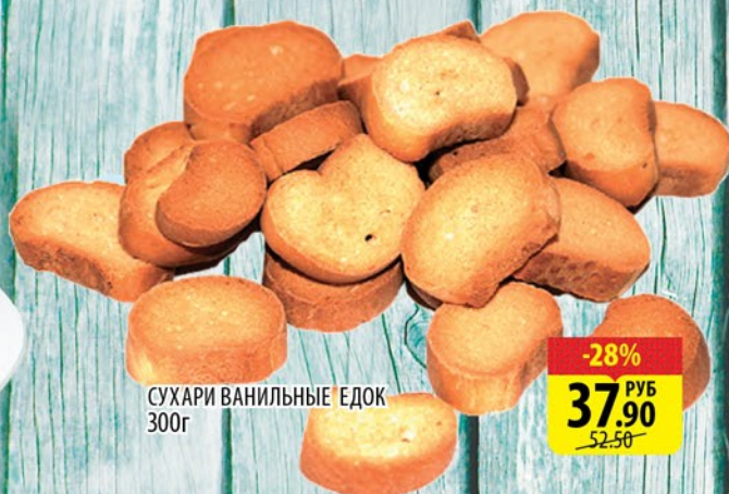
СУХАРИ ВАНИЛЬНЫЕ ЕДОК 300г