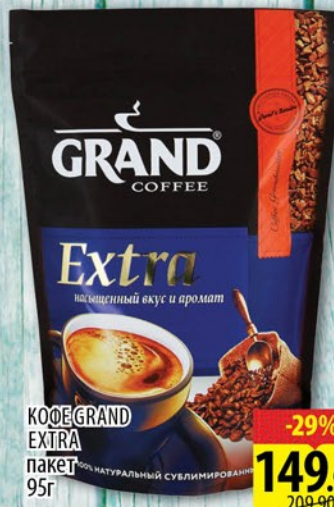
КОФЕ GRAND EXTRA пакет 95г