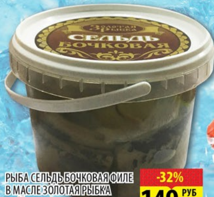
РЫБА СЕЛЬДЬ БОЧКОВАЯ ФИЛЕ В МАСЛЕ ЗОЛОТАЯ РЫБКА пл/б 500г