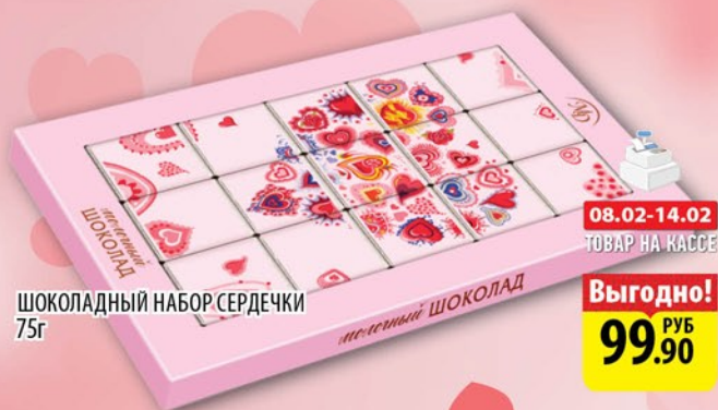
ШОКОЛАДНЫЙ НАБОР СЕРДЕЧКИ 75г