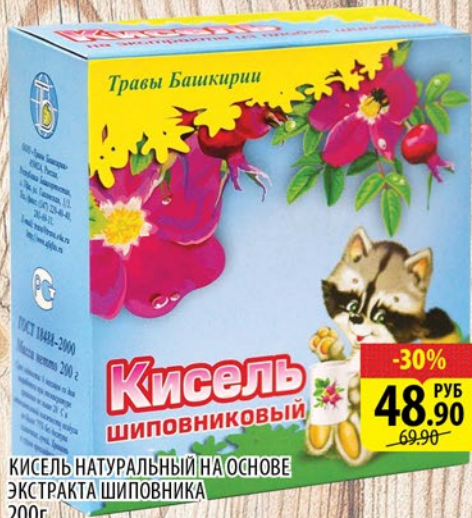
КИСЕЛЬ НАТУРАЛЬНЫЙ НА ОСНОВЕ ЭКСТРАКТА ШИПОВНИКА 200г