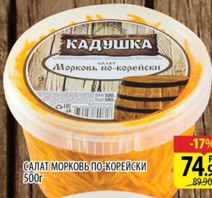
САЛАТ МОРКОВЬ ПО-КОРЕЙСКИ 500г