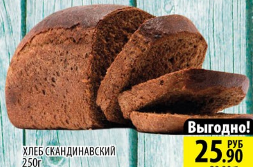
ХЛЕБ СКАНДИНАВСКИЙ 250г