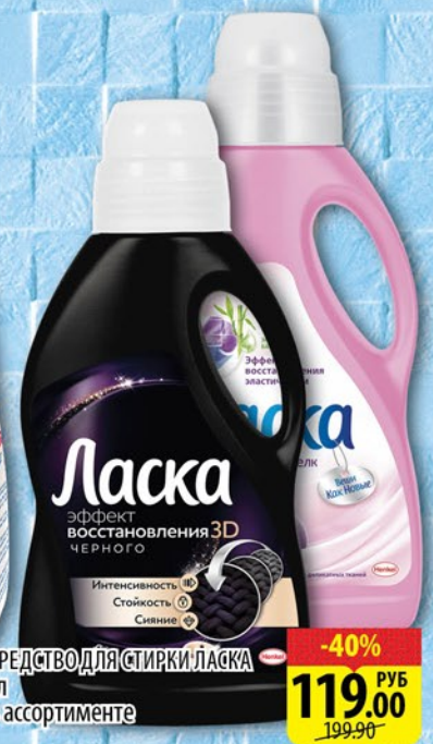
СРЕДСТВО ДЛЯ СТИРКИ ЛАСКА 1л в ассортименте