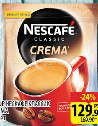
КОФЕ НЕСКАФЕ КЛАССИК КРЕМА пакет 70г