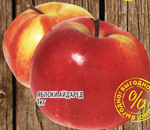
ЯБЛОКИ АЙ ДАРЕД 1кг