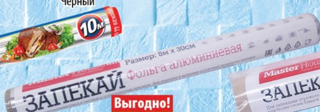
ФОЛЬГА АЛЮМИНИЕВАЯ ПИЩЕВАЯ ЗАПЕКАЙ 5м*30см