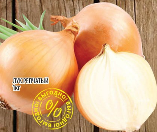
ЛУК РЕПЧАТЫЙ 1кг