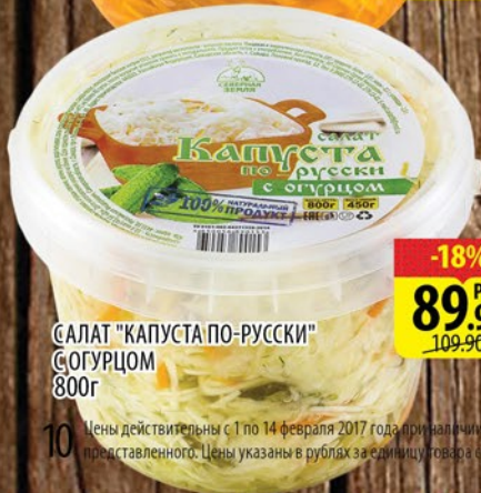
САЛАТ "КАПУСТА ПО-РУССКИ" С ОГУРЦОМ 800г