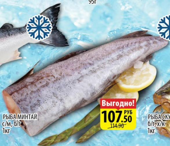
РЫБА МИНТАЙ с/м, б/г 1кг