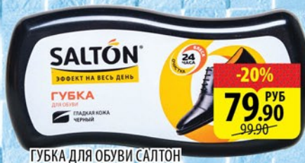
ГУБКА ДЛЯ ОБУВИ САЛТОН ИЗ ГЛАДКОЙ КОЖИ ВОЛНА