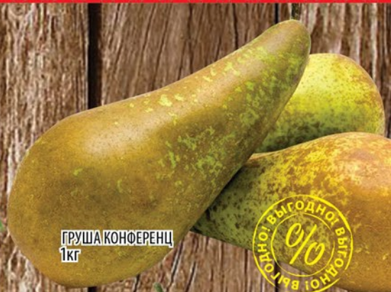
ГРУША КОНФЕРЕНЦ 1кг