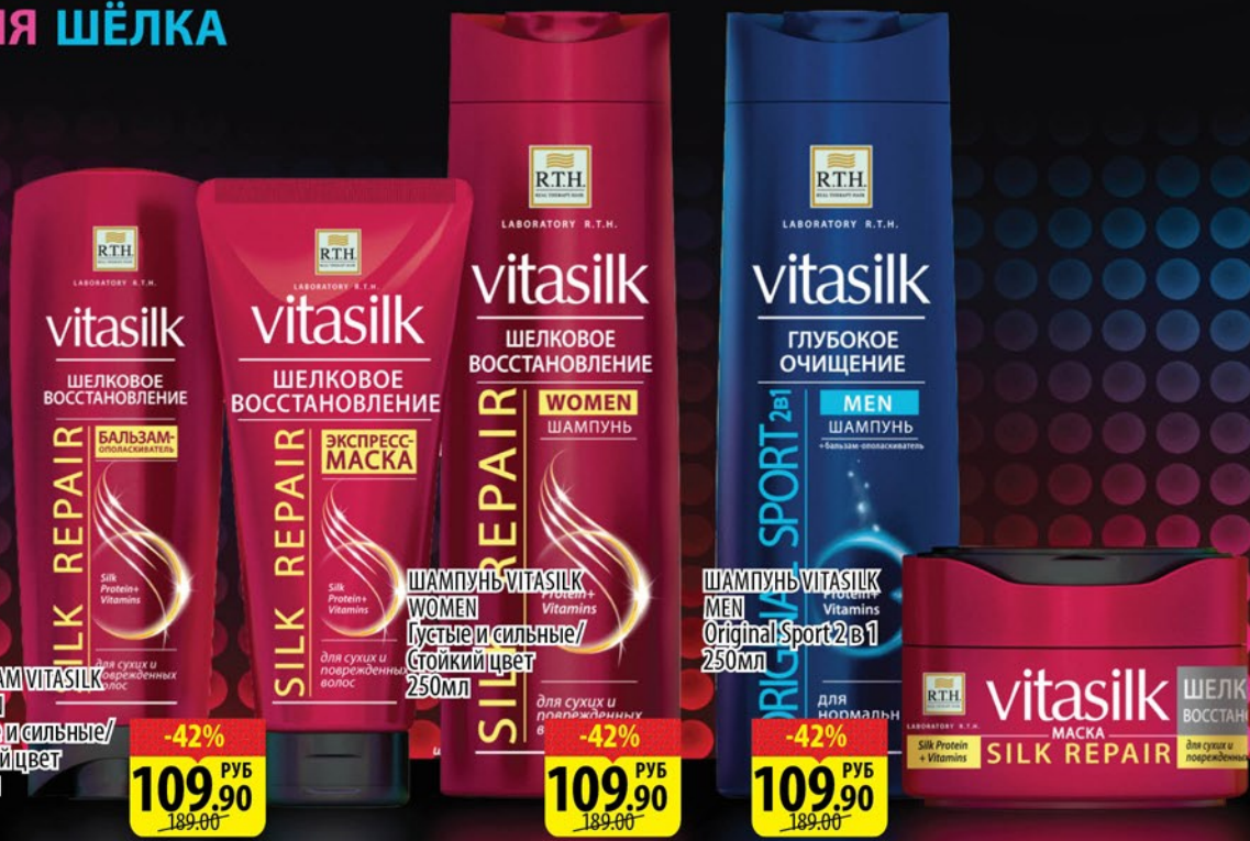
БАЛЬЗАМ VITASILK WOMEN Густые и сильные/стойкий цвет 220мл