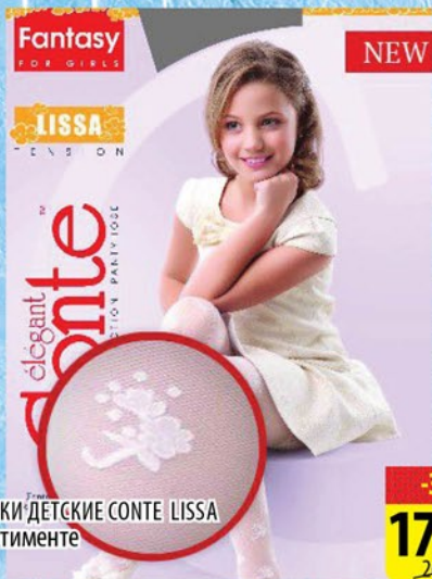
КОЛГОТКИ ДЕТСКИЕ CONTE LISSA в ассортименте