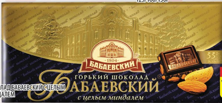
ШОКОЛАД БАБАЕВСКИЙ С ЦЕЛЫМ МИНДАЛЕМ 200г