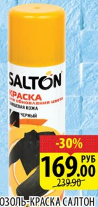
АЭРОЗОЛЬ-КРАСКА САЛТОН КЛАССИК ДЛЯ ЗАМШИ Черный 250мл