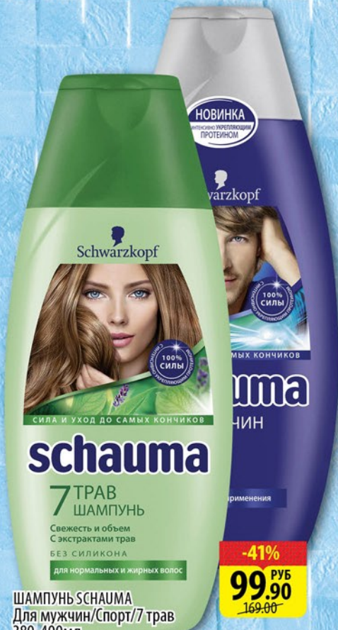
ШАМПУНЬ СЧАУМА Для мужчин/Спорт/7 трав 380-400мл