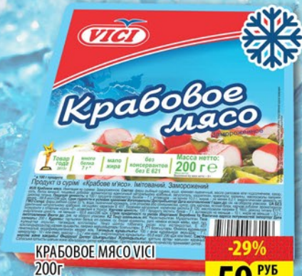
КРАБОВОЕ МЯСО VICI 200г