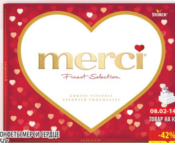
КОФЕТЫ МЕРСИ СЕРДЦЕ 250г