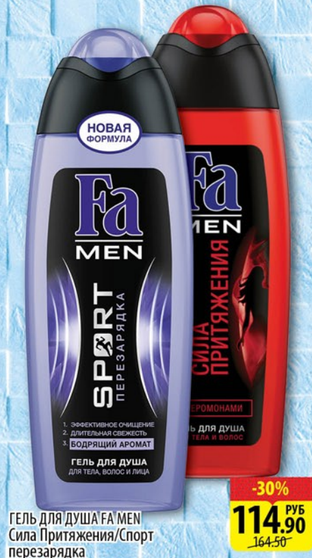
ГЕЛЬ ДЛЯ ДУША FA MEN СИЛА ПРИТЯЖЕНИЯ/Спорт перезарядка 250мл