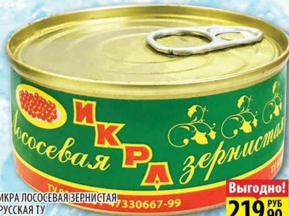
ИКРА ЛОСОСЕВАЯ ЗЕРНИСТАЯ РУССКАЯ ТУ с/к ж/б 95г