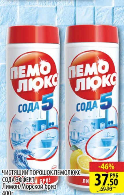
ЧИСТЯЩИЙ ПОРОШОК ПЕМОЛЮКС СОДА ЭФФЕКТ БРИЗ Лимон/Морской бриз 400г