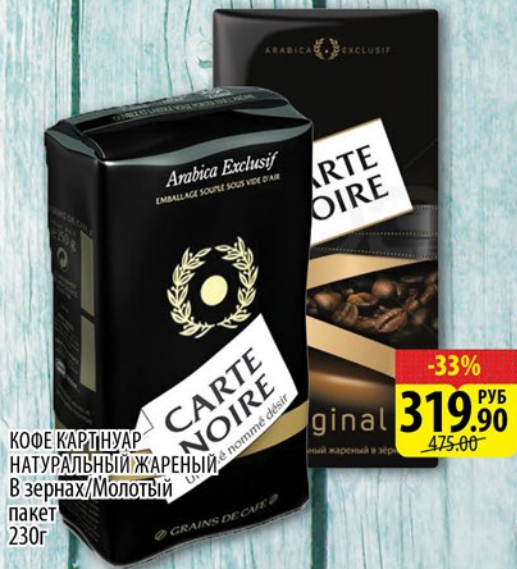
КОФЕ КАРТНУАР НАТУРАЛЬНЫЙ ЖАРЕННЫЙ В зёрнах/Молотый пакет 230г