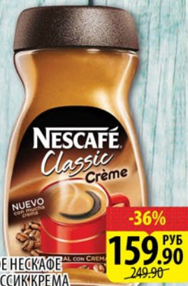
КОФЕ НЕСКАФЕ КЛАССИК КРЕМА ст/б 95г