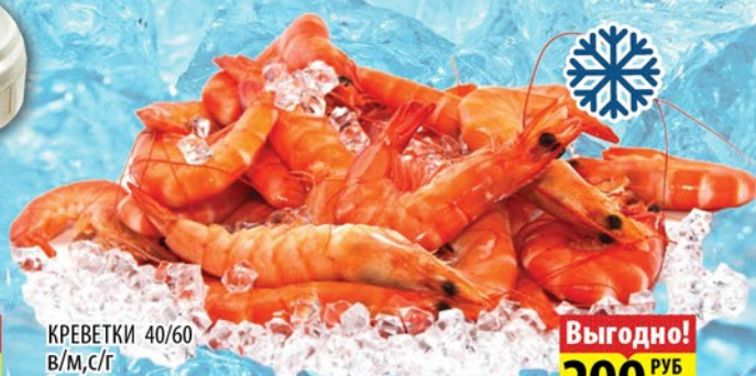
КРЕВЕТКИ 40/60 в/м, с/г 1кг