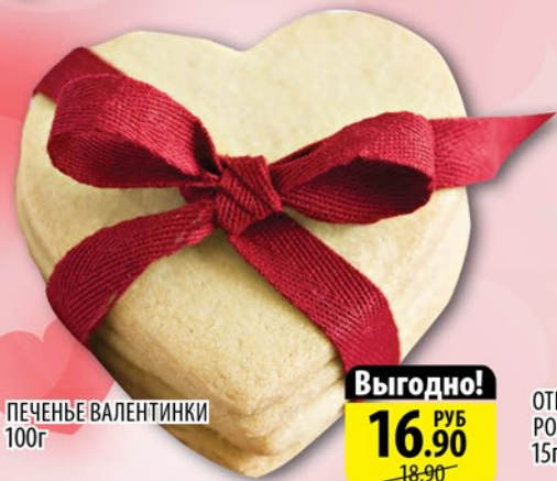
ПЕЧЕНЬЕ ВАЛЕНТИНКИ 100г