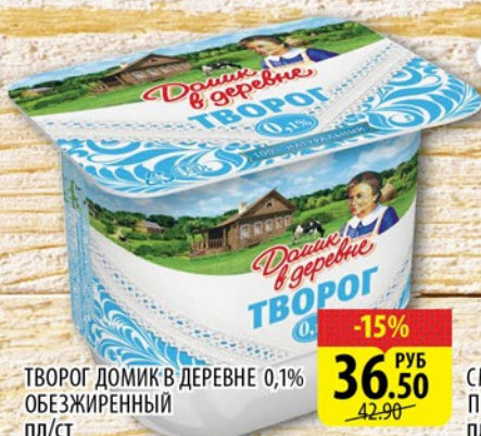
ТВОРОГ ДОМИК В ДЕРЕВНЕ 0,1% ОБЕЗЖИРЕННЫЙ пл/ст 180г