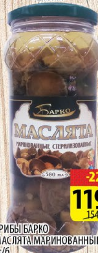
ГРИБЫ БАРКО МАСЛЯТА МАРИНОВАННЫЕ ст/б 580мл