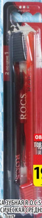
ЩЕТКА ЗУБНАЯ R.O.C.S. КЛАССИЧЕСКАЯ СРЕДНЯЯ 1шт + 1шт

08.02-14.02 ТОВАР НА КАССЕ -20% 199.90 РУБ 249.90