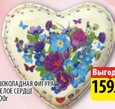
ШОКОЛАДНАЯ ФИГУРА БЕЛОЕ СЕРДЦЕ 100г