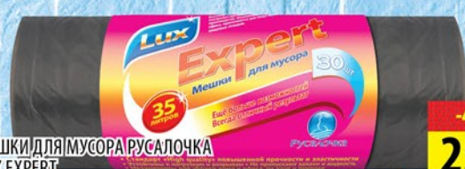
МЕШКИ ДЛЯ МУСОРА РУСАЛОЧКА LUX EXPERT 30шт*35л