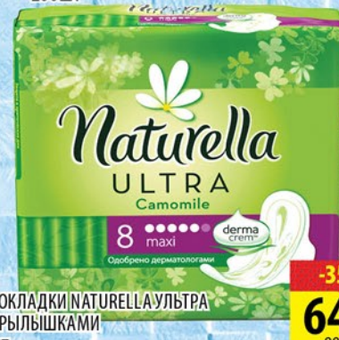
ПРОКЛАДКИ NATURELLA УЛЬТРА С КРЫЛЫШКАМИ 8шт