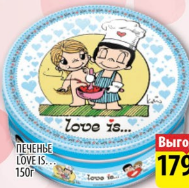
ПЕЧЕНЬЕ LOVE IS... 150г