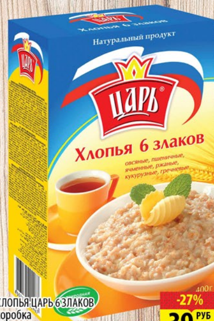
ХЛОПЬЯ ЦАРЬ 6 ЗЛАКОВ коробка 400г