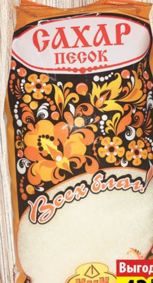
САХАР ВСЕХ БЛАГ 800г