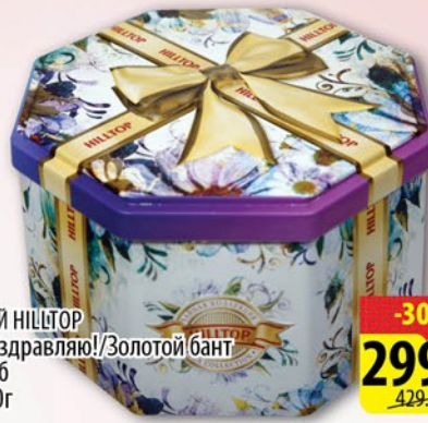
ЧАЙ HILLTOP Поздравляю! / Золотой бант ж/б 150г