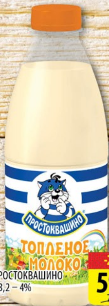
МОЛОКО ПРОСТОКВАШИНО ТОПЛЕНОЕ 3,2 – 4% пл/б 0,93л