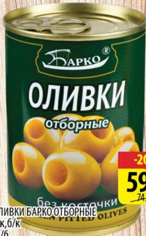
ОЛИВКИ БАРКО ОТБОРНЫЕ с/к, б/к ж/б 280г