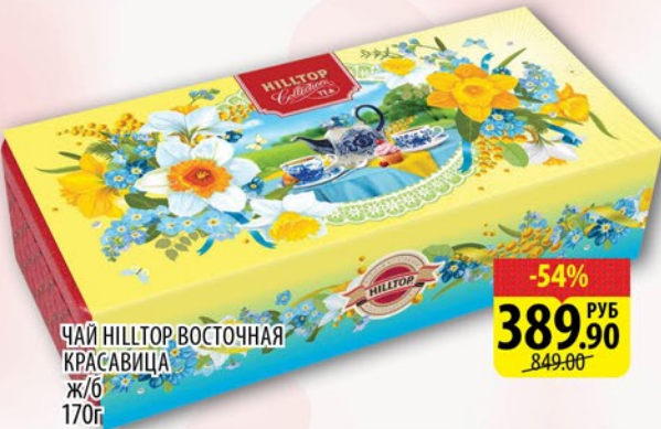
ЧАЙ HILLTOP ВОСТОЧНАЯ КРАСАВИЦА ж/б 170г