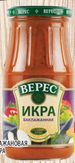
ИКРА БАКЛАЖАНОВАЯ ВЕРЕС ЭКСТРА ст/б 500г