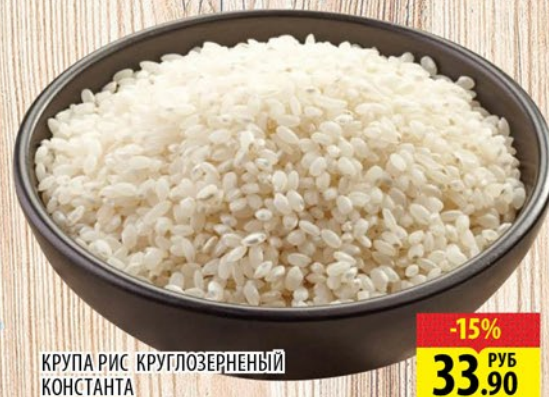
КРУПА РИС КРУГЛОЗЕРНЫЙ КОНСТАНТА 800г