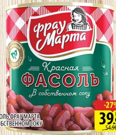
ФАСОЛЬ ФРАУМАРТА В СОБСТВЕННОМ СОКУ ж/б 310г