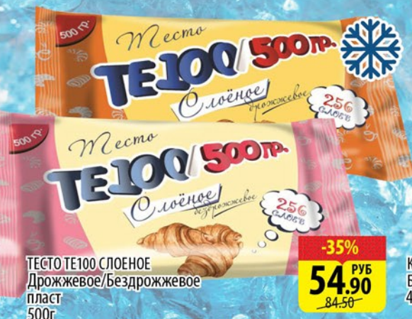
ТЕСТО ТЕ100 СЛОЕНОЕ Дрожжевое/Бездрожжевое пласт 500г