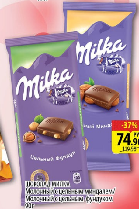
ШОКОЛАД МИЛКА Молочный с целым миндалем / Молочный с целым фундуком 90г