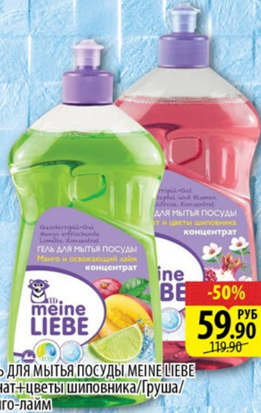
ГЕЛЬ ДЛЯ МЫТЬЯ ПОСУДЫ МЕЙНЕ ЛИБЕ Гранат+цветы шиповника/Груша/Манго-лайм 500мл