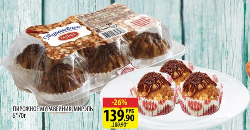
ПИРОЖНОЕ МУРАВЕЙНИК, МИРЭЛЬ 6*70г