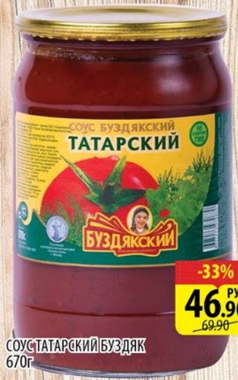
СОУС ТАТАРСКИЙ БУЗДЯК 670г