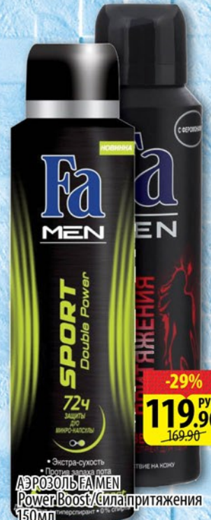
АЭРОЗОЛЬ FA MEN PowerBoost/СИЛА ПРИТЯЖЕНИЯ 150мл

08.02-14.02 ТОВАР НА КАССЕ -20% 199.90 РУБ 249.90