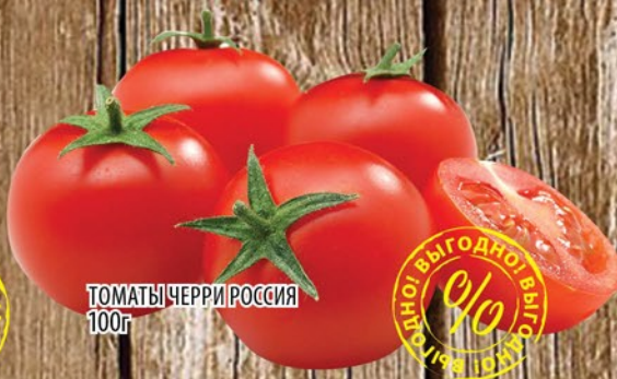
ТОМАТЫ ЧЕРРИ РОССИЯ 100г