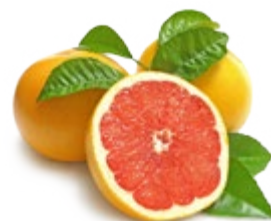
ГРЕЙПФРУТ свежий 1 кг