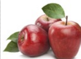
ЯБЛОКИ КРАСНЫЕ свежие 1 кг