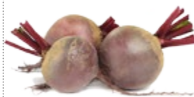
СВЕКЛА свежая 1 кг