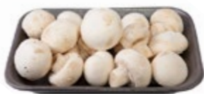
ШАМПИНЬОНЫ свежие 400 г (1 уп.)

ЦЕНА НА ТОВАР ДЕЙСТВУЕТ В ПЕРИОД С 15.02.2017 ПО 21.02.2017