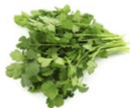
ПЕТРУШКА листовая свежая 50 г (1 уп.)