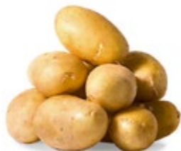
КАРТОФЕЛЬ свежий 1 кг

ЦЕНА НА ТОВАР ДЕЙСТВУЕТ В ПЕРИОД С 08.02.2017 ПО 21.02.2017