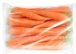
МОРКОВЬ свежая фасованная в п/э 1 кг (1 уп.)