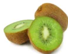
КИВИ 1 кг