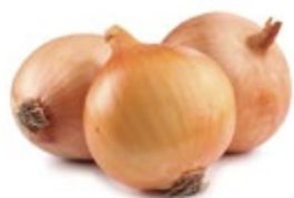
ЛУК РЕПЧАТЫЙ свежий 1 кг

ЦЕНА НА ТОВАР ДЕЙСТВУЕТ В ПЕРИОД С 08.02.2017 ПО 14.02.2017