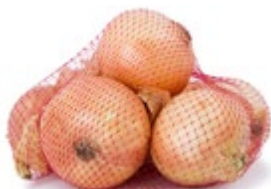
ЛУК РЕПЧАТЫЙ свежий, в сетке 1 кг