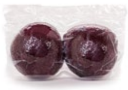
СВЕКЛА вареная очищенная в в/у 500 г (1 уп.)