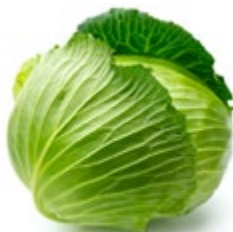
КАПУСТА свежая 1 кг