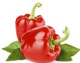
ПЕРЕЦ БОЛГАРСКИЙ КРАСНЫЙ 1 кг