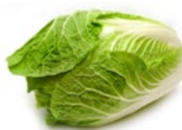
КАПУСТА ПЕКИНСКАЯ свежая 1 кг