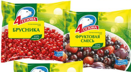
4 Сезона 300 г • брусника быстрозамороженная