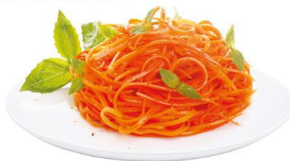
Морковь Ча 100 г 30 руб.