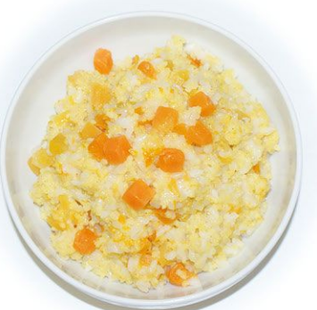
Каша постная Артек 100 г 15 руб.