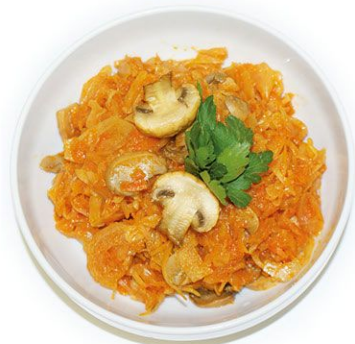
Капуста тушеная с грибами 100 г 25 руб.