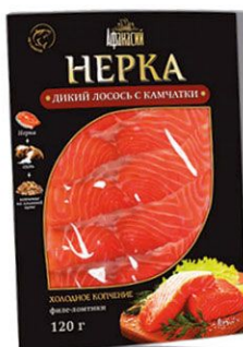
Нерка «Афанасий» х/к филе-ломтики в/у 120 г