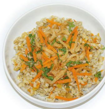
Каша перловая с луком и морковью 100 г 20 руб.