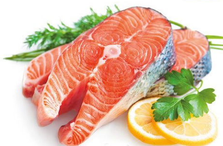
Семга стейк охл. 1 кг