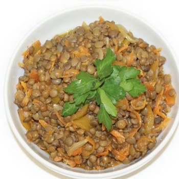
Чечевица по южному 100 г 34 руб.