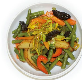
Рагу овощное с черносливом 100 г 47 руб.