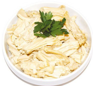
Спаржа Хе 100 г 35 руб.