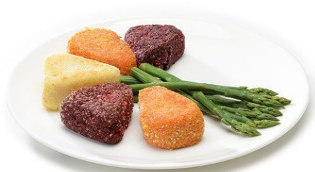
Котлеты овощные (морковные, картофельные, капустные, свекольные)