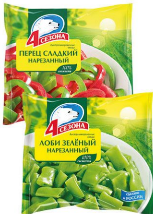
4 Сезона 300 г • перец сладкий нарезанный быстрозамороженный