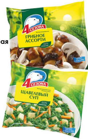
4 Сезона 300 г • грибы ассорти