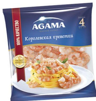
Креветки Агама №4 Королевские д/пасты в/м очищенные 300 г пакет