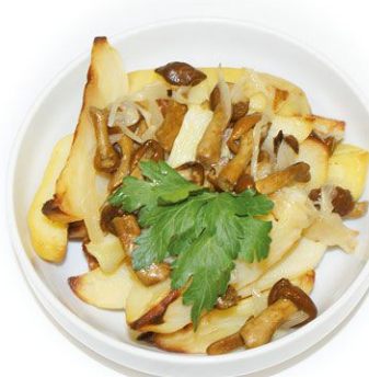
Картофель жареный с опятами 100 г 35 руб.