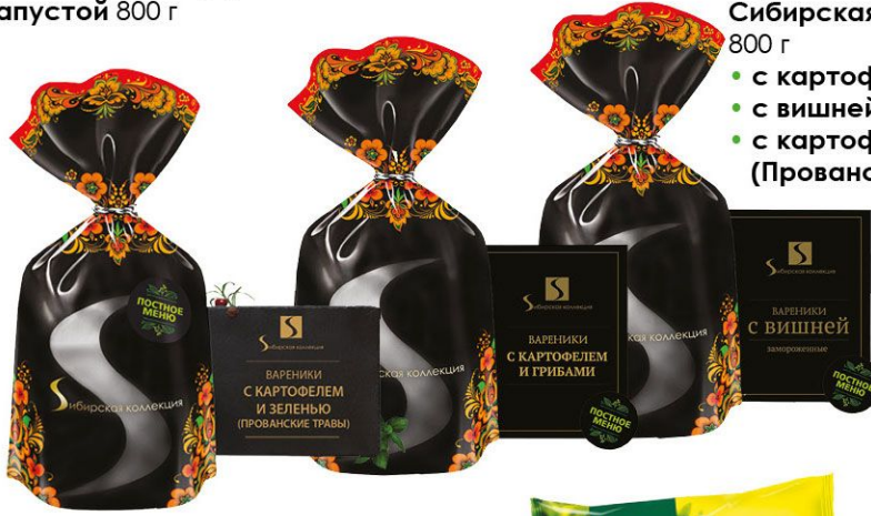
Вареники Сибирская коллекция 800 г • с картофелем и грибами • с вишней • с картофелем и зеленью (Прованские травы)