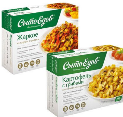
Сытоедов Постное блюдо 300 г