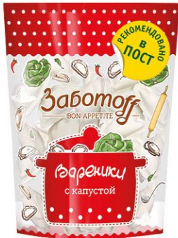
Вареники Заботофф с капустой 800 г