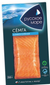
Семга слабосоленая филе-кусок «Русское море» 250 г