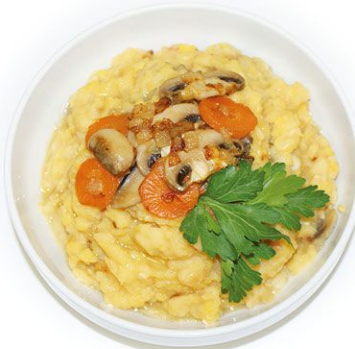
Горох отварной с грибами и морковью 100 г 18 руб.