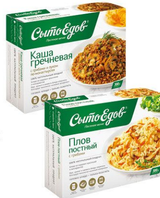
Сытоедов Постное блюдо 300 г