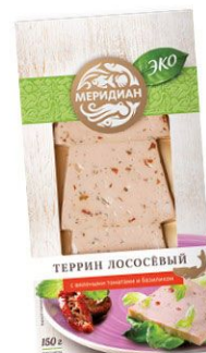
Террин лососевый с вялеными томатами и базиликом 150 г