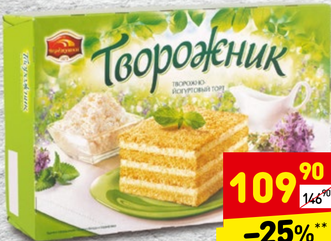
ТОРТ «ТВОРОЖНИК» «Черемушки», 400 г