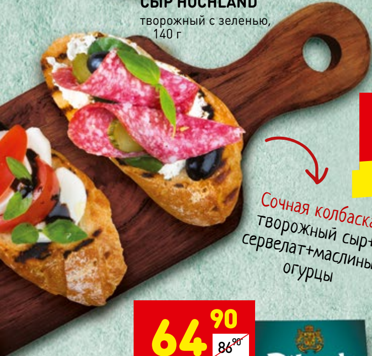
СЫР HOCHLAND творожный с зеленью, 140 г

Сочная колбаска:*** творожный сыр+ сервелат+маслины+ огурцы