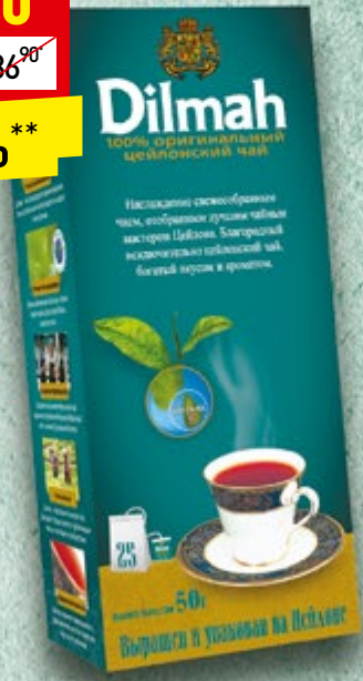
ЧАЙ DILMAN цейлонский, пак. с/ярд., 25x2 г, 50 г