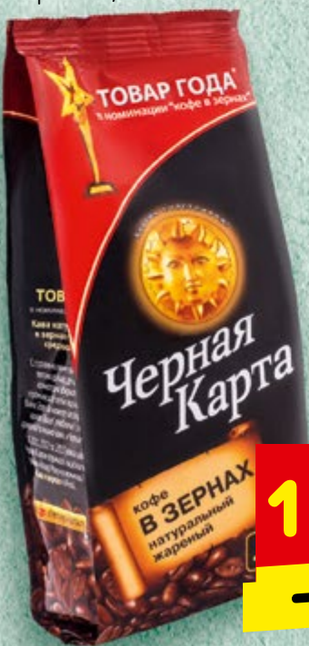
КОФЕ «ЧЕРНАЯ КАРТА» зерновой, 250 г