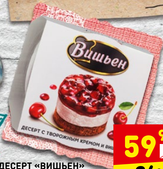
ДЕСЕРТ «ВИШЬЕН» с творожным кремом и вишней, 90 г