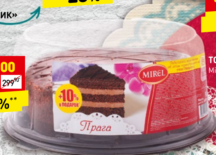
ТОРТ «ПРАГА» Mirel, 600 г