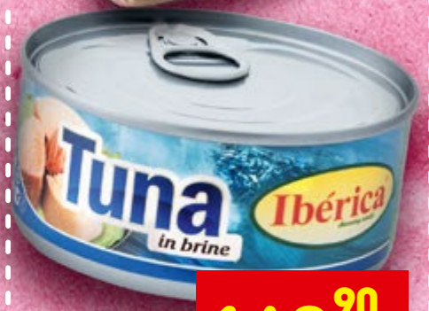
ТУНЕЦ IBERICA 160 г