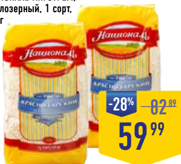
РИС КРАСНОДАРСКИЙ НАЦИОНАЛЬ АНГСТРЕМ, круглозерный, 1 сорт, 900 г