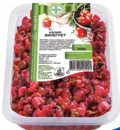
САЛАТ «Винегрет» 500 г (Великоросс)