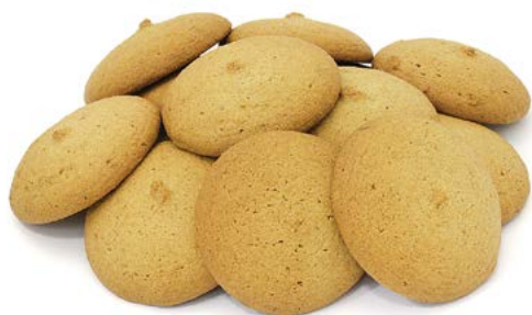
ПЕЧЕНЬЕ «Овсяное» 350 г