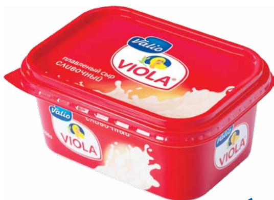
СЫР плавленный сливочный «Виола» 400 г