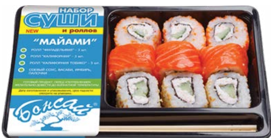
НАБОР СУШИ «Майами» 270 г (Бонсай)