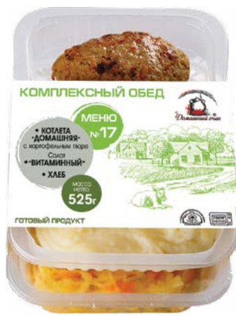
КОМПЛЕКСНЫЙ ОБЕД Котлета домашняя с картофельным пюре и хлебом 525 г (Домашний Очаг)