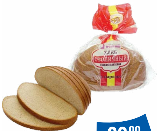
ХЛЕБ «Старорусский Тихвинский» в нарезке 300 г