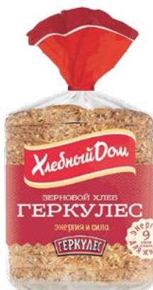
ХЛЕБ «Геркулес» – зерновой – с отрубями в нарезке 250 г (Хлебный дом)