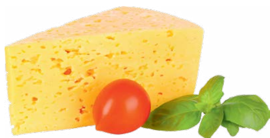
СЫР «Костромской» 45% 1 кг