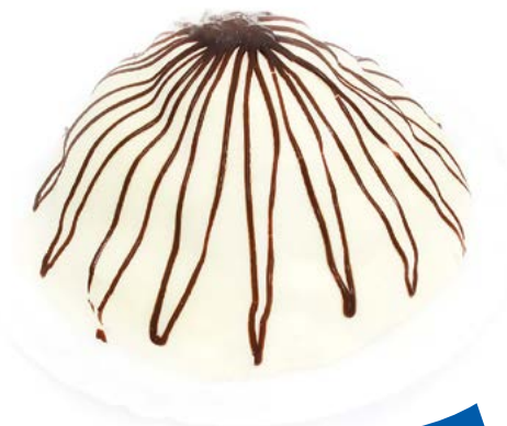
ТОРТ «Сметанник» 500 г