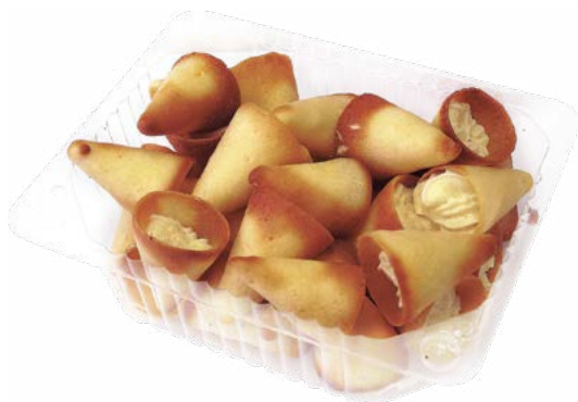
НАБОР ПИРОЖНЫХ «Знаменитое сахарное» 180 г (Невские Берега)