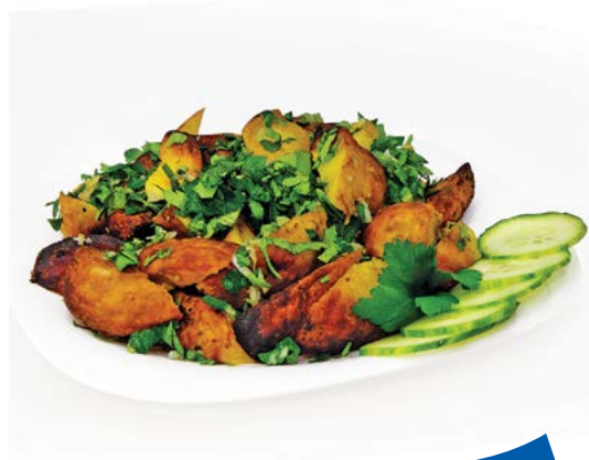
КАРТОФЕЛЬ запечённый 100 г