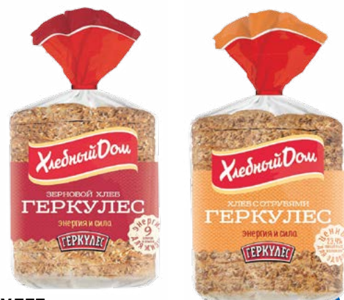
ХЛЕБ «Геркулес» – зерновой – с отрубями в нарезке 250 г (Хлебный дом)