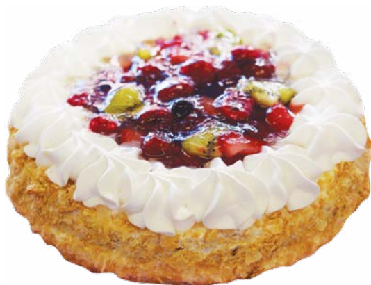
ТОРТ «Сметанник» фруктовый 1100 г