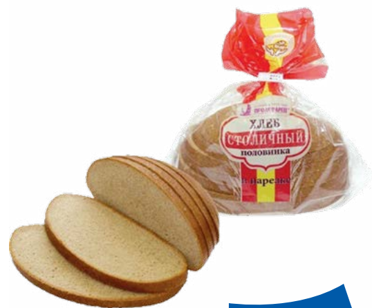
ХЛЕБ «Старорусский Тихвинский» в нарезке 300 г