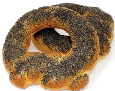
КРЕНДЕЛЬ с маковой посыпкой 200 г