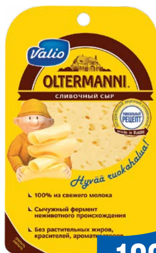
СЫР «Олтермани» 45% в нарезке 130 г