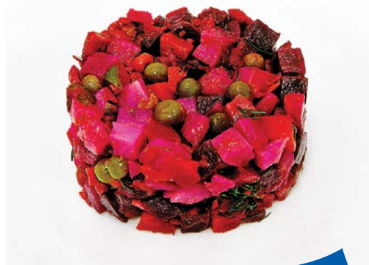
САЛАТ «Винегрет» 250 г