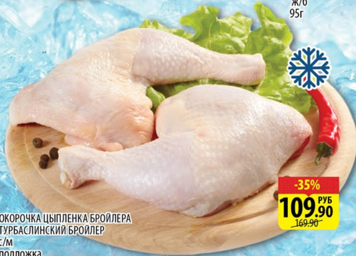
ОКОРОЧКА ЦЫПЛЕНКА БРОЙЛЕРА ТУРБАСЛИНСКИЙ БРОЙЛЕР с/м подложка 1кг