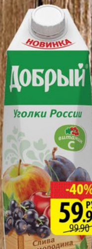
НЕКТАР ДОБРЫЙ УГОЛКИ РОССИИ Гранат+виноград/Груша/Слива+смородина+яблоко+вишня 1л