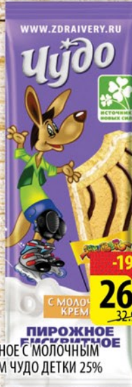
ПИРОЖНОЕ С МОЛОЧНЫМ КРЕМОМ ЧУДО ДЕТКИ 25% 28г