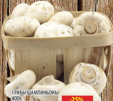
ГРИБЫ ШАМПИЬОНЫ 400г