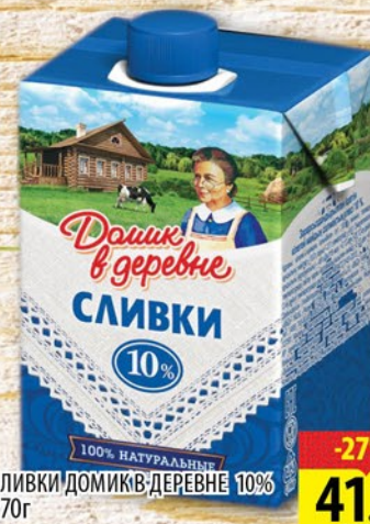
СЛИВКИ ДОМИК В ДЕРЕВНЕ 10% 270г