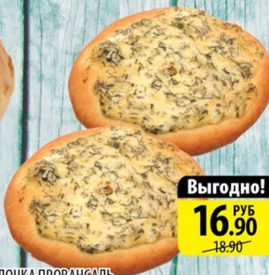
БУЛОЧКА ПРОВАНСАЛЬ 110г