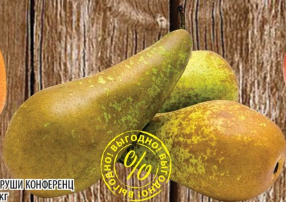
ГРУШИ КОНФЕРЕНЦ 1кг