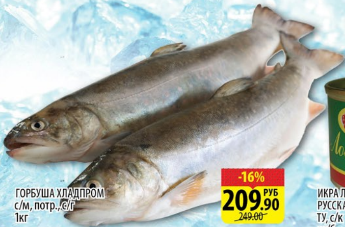
ГОРБУША ХЛАДПРОМ с/м, потр., с/г 1кг