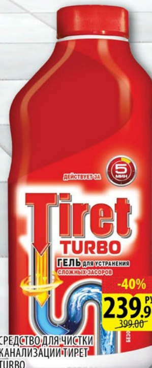
СРЕДСТВО ДЛЯ ЧИСТКИ КАНАЛИЗАЦИИ ТИРЕТ TURBO 500мл