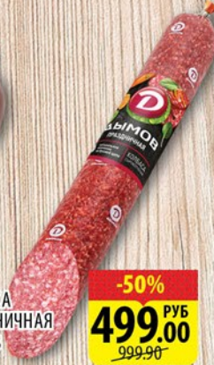
КОЛБАСА ПРАЗДНИЧНАЯ ДЫМОВ С/К 1кг