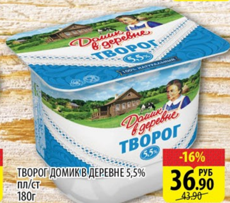
ТВОРОГ ДОМИК В ДЕРЕВНЕ 5,5% пл/ст 180г