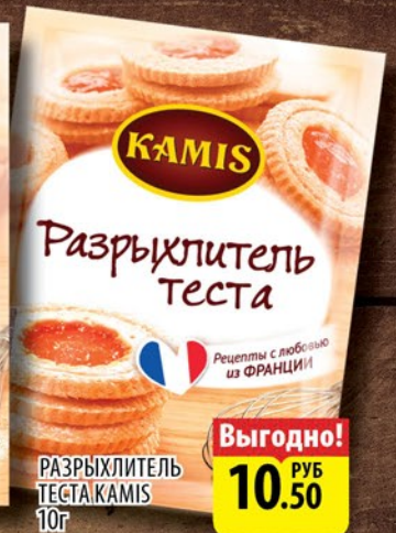
РАЗРЫХЛИТЕЛЬ ТЕСТА КАМИС 10г