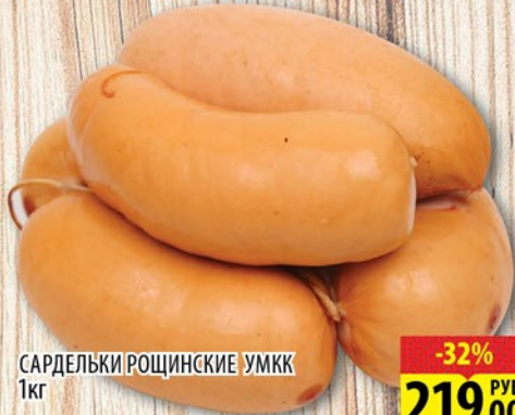
САРДЕЛЬКИ РОЩИНСКИЕ УМКК 1кг