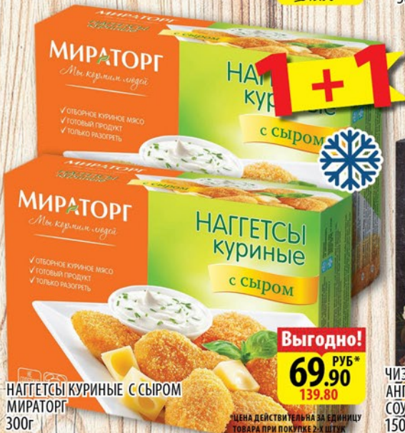
НАГГЕТСЫ КУРИНЫЕ С СЫРОМ МИРАТОРГ 300г