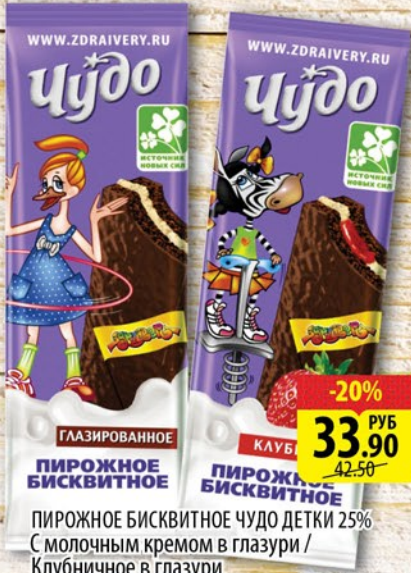
ПИРОЖНОЕ БИСКВИТНОЕ ЧУДО ДЕТКИ 25% С молочным кремом в глазури / Клубничное в глазури 30г