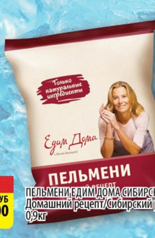
ПЕЛЬМЕНИ, ЕДИМ ДОМА СИБИРСКИЙ ГУРМАН Домашний рецепт/Сибирский рецепт 0,9кг