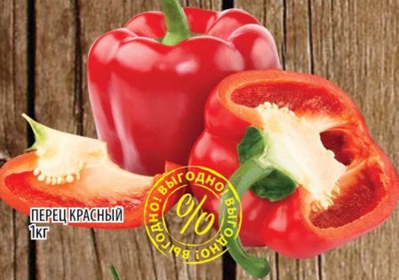
ПЕРЕЦ КРАСНЫЙ 1кг