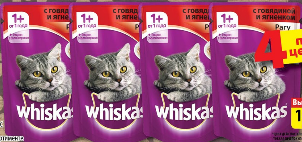
ВИСКАС 85г в ассортименте