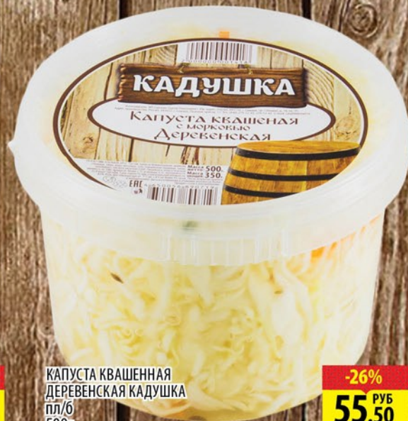
КАПУСТА КВАШЕННАЯ ДЕРЕВЕНСКАЯ КАДУШКА пл/б 500г