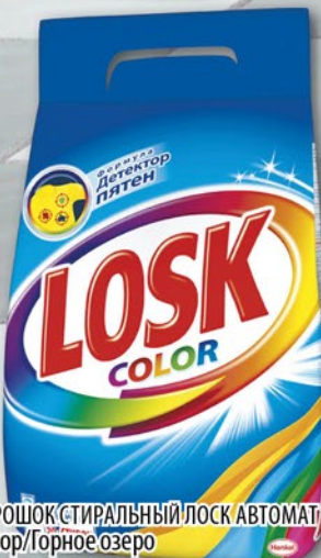
ПОРОШОК СТИРАЛЬНЫЙ ЛОСК АВТОМАТ Колор/Горное озеро 3кг