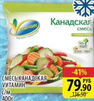
СМЕСЬ КАНАДСКАЯ ВИТАМИН с/м 400г