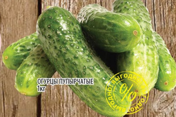
ОГУРЦЫ ПУПЫРЧАТЫЕ 1кг