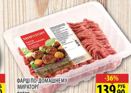
ФАРШ ПО-ДОМАШНЕМУ МИРАТОРГ ЛОТОК 500г