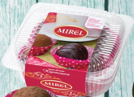
ПИРОЖНОЕ КАРТОШКА МИРЭЛЬ 280г