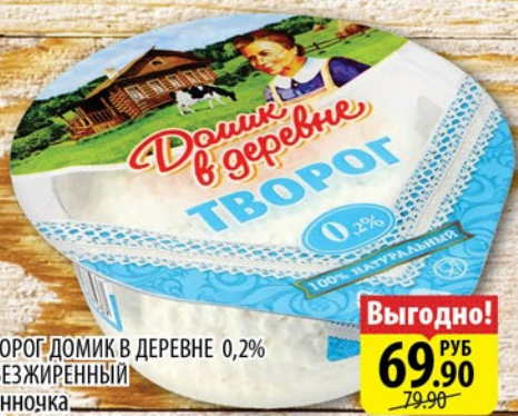
ТВОРОГ ДОМИК В ДЕРЕВНЕ 0,2% ОБЕЗЖИРЕННЫЙ ванночка 170г