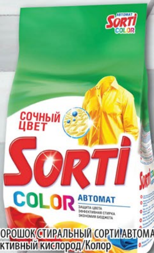
ПОРОШОК СТИРАЛЬНЫЙ СОРТИ АВТОМАТ Активный кислород/Колор 3кг