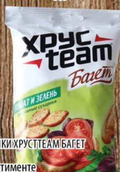
СУХАРИКИ ХРУСТ TEAM БАГЕТ 60г в ассортименте