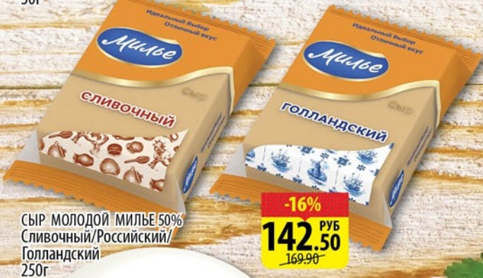
СЫР МОЛОДОЙ МИЛБЕ 50% Сливочный / Российский / Голландский 250г