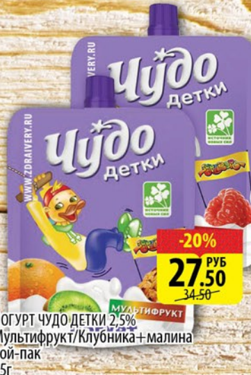
ЙОГУРТ ЧУДО ДЕТКИ 2,5% Мультифрукт / Клубника + малина дой-пак 85г