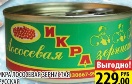
ИКРА ЛОСОСЕВАЯ ЗЕРНИСТАЯ РУССКАЯ ТУ, с/к ж/б 95г