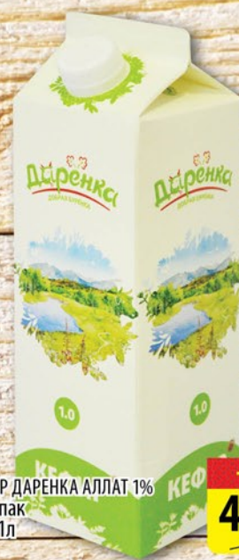
КЕФИР ДАРЕНКА АЛЛАТ 1% пюр-пак 0,95-1л