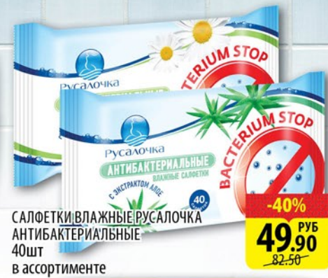
САЛОФЕТКИ ВЛАЖНЫЕ РУСАЛОЧКА АНТИБАКТЕРИАЛЬНЫЕ 40шт в ассортименте