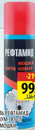
АЭРОЗОЛЬ РЕФАМИД МАКСИМУМ ЗВУК КЛЕЩА, МОШКИ, КОМАРОВ 147мл