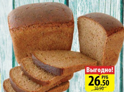
ХЛЕБ КРЕСТЬЯНИНОВСКИЙ УФИМСКИЙ ХЛЕБОЗАВОД №7 500г