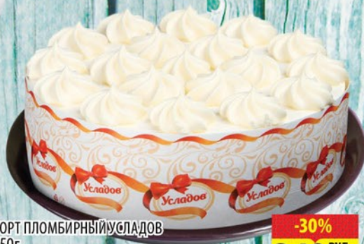
ТОРТ ПЛОМБИРНЫЙ УСАДОВ 750г