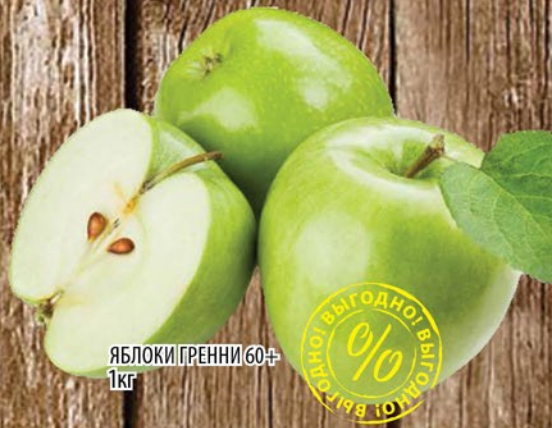
ЯБЛОКИ ГРЕННИ 60+ 1кг