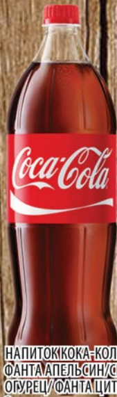
НАПИТОК КОКА-КОЛА/СПРАЙТ/ ФАНТА АПЕЛЬСИН/СПРАЙТ ОГУРЕЦ/ФАНТА ЦИТРУС 2л