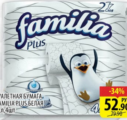
ТУАЛЕТНАЯ БУМАГА, ФАМИЛИЯ PLUS БЕЛАЯ 2сл, 4шт