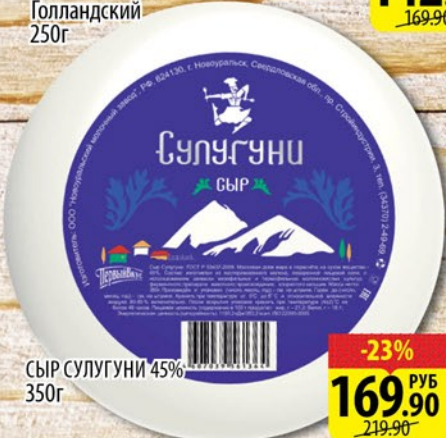
СЫР СУЛУГУНИ 45% 350г