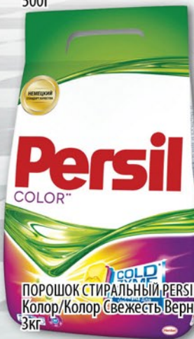
ПОРОШОК СТИРАЛЬНЫЙ PERSIL АВТОМАТ Колор/Колор Свежесть Вернеля 3кг