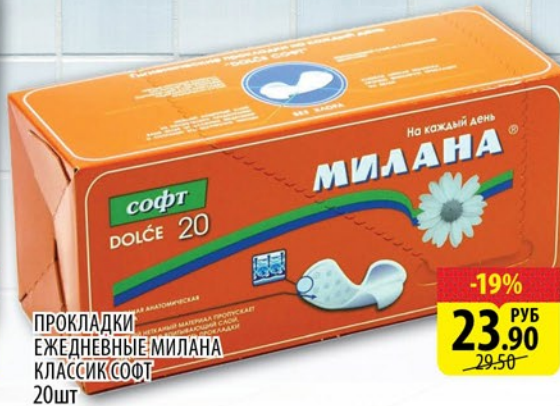
ПРокладки ЕЖЕДНЕВНЫЕ МИЛАНА КЛАССИК(СОФТ) 20шт