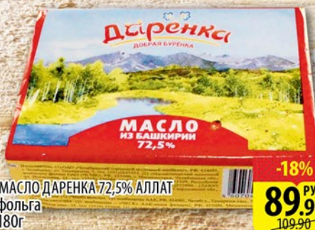
МАСЛО ДАРЕНКА 72,5% АЛЛАТ фольга 180г