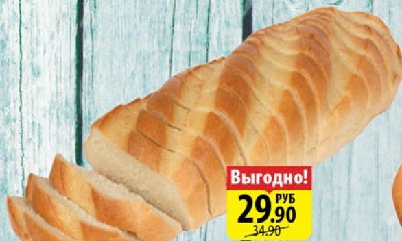
БАТОН СТОЛИЧНЫЙ УФИМСКИЙ ХЛЕБОЗАВОД №7 нарезка 400г