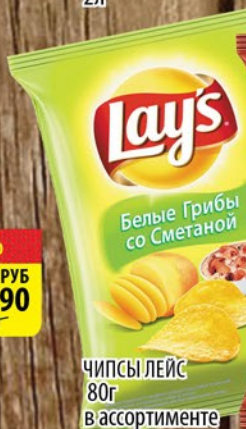
ЧИПСЫ ЛЕЙС 80г в ассортименте