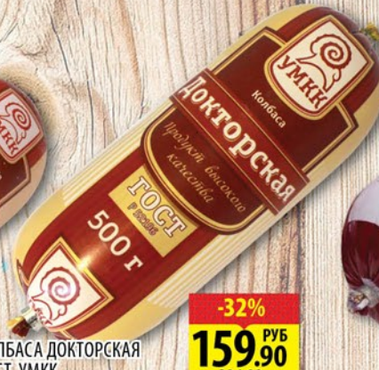
КОЛБАСА ДОКТОРСКАЯ ГОСТ УМКК 500г