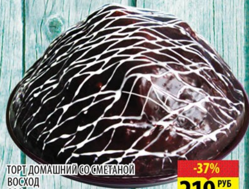
ТОРТ ДОМАШНИЙ СО СМЕТАНОЙ ВОСХОД 800г