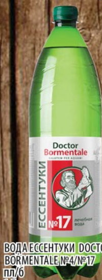
ВОДА ЭССЕНТУКИ DOCTOR BORMENTALE №4/№17 пл/б 1,5л