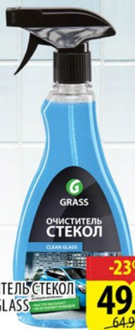
ОЧИСТИТЕЛЬ СТЕКОЛ CLEAN GLASS 500мл

С НАМИ ПРОЩЕ! МЫ ПРЕДОСТАВЛЯЕМ СКИДКИ, НЕ ТРЕБУЯ ДИСКОНТНЫХ КАРТ!