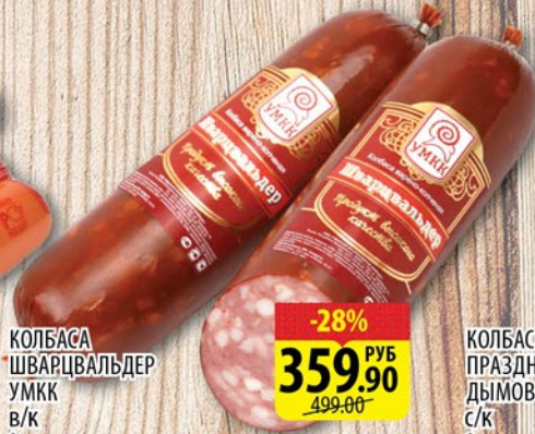
КОЛБАСА ШВАРЦВАЛЬДЕР УМКК В/К 1кг