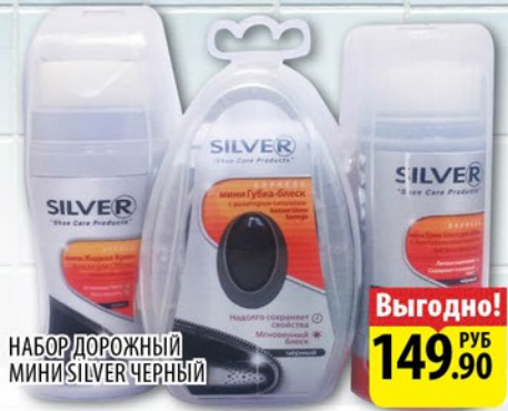
НАБОР ДОРОЖНЫЙ МИНИ SILVER ЧЕРНЫЙ