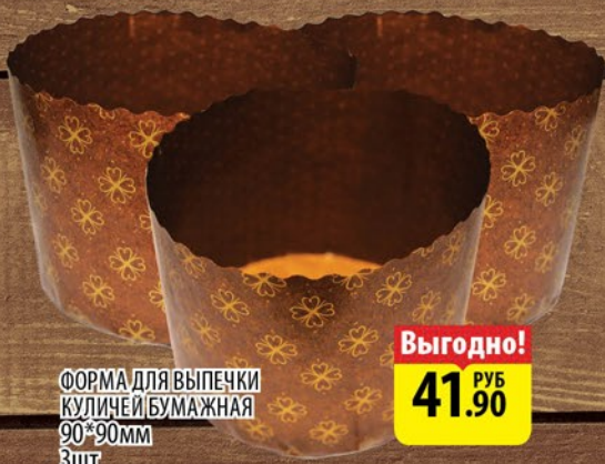
ФОРМА ДЛЯ ВЫПЕЧКИ КУЛИЧЕЙ БУМАЖНАЯ 90*90мм 3шт