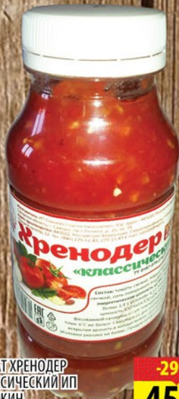
САЛАТ ХРЕНОДЕР КЛАССИЧЕСКИЙ ИП СОРОКИН 220г