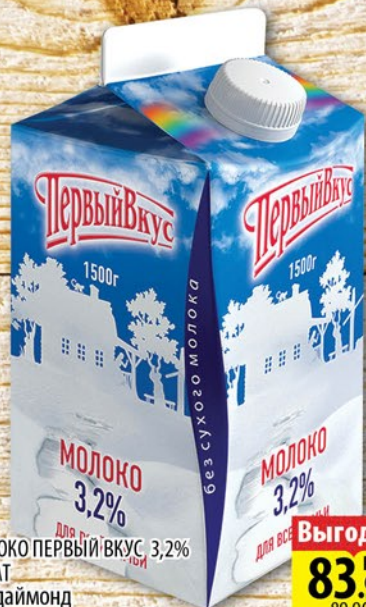
МОЛОКО ПЕРВЫЙ ВКУС 3,2% АЛЛАТ биг-даймонд 1,5л