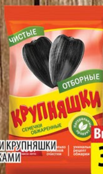
СЕМЕЧКИ КРУПНЯШКИ СОРЕШКАМИ 100г