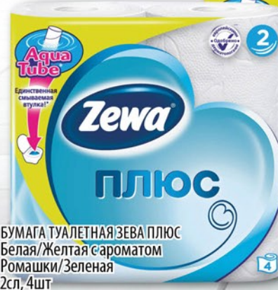
БУМАГА ТУАЛЕТНАЯ ЗЕВА ПЛЮС Белая/Желтая с ароматом Ромашки/Зеленая 2сл, 4шт