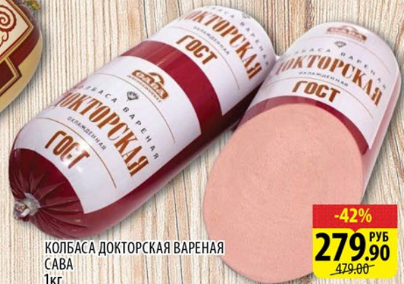
КОЛБАСА ДОКТОРСКАЯ ВАРЕНАЯ САВА 1кг