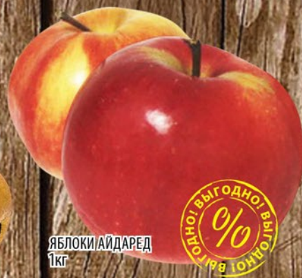
ЯБЛОКИ АЙДАРЕД 1кг