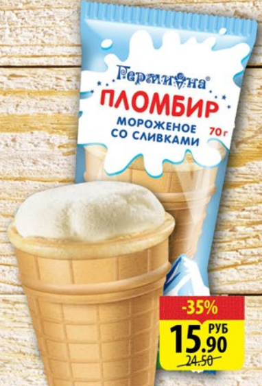
МОРОЖЕНОЕ ПЛОМБИР СО СЛИВКАМИ 15% ГЕРМИОНА вафельный стаканчик 70г