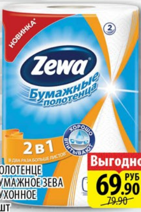
ПОЛОТЕНЦЕ БУМАЖНОЕ ЗЕВА КУХОННОЕ 2шт