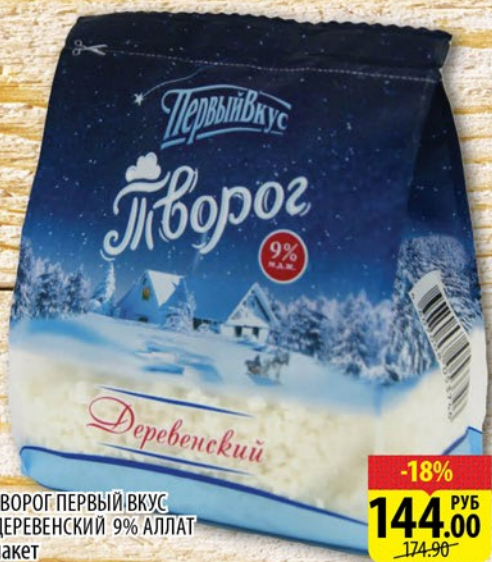
ТВОРОГ ПЕРВЫЙ ВКУС ДЕРЕВЕНСКИЙ 9% АЛЛАТ пакет 450г