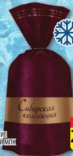
ПЕЛЬМЕНИ КЛАССИЧЕСКИЕ ЩЕЛКОВСКИЙ МПК 800г