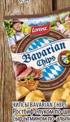
ЧИПСЫ BAVARIAN CHIPS Ростбиф/слукомпо-швабски/ Сыр с тмином по-альпийски 75г