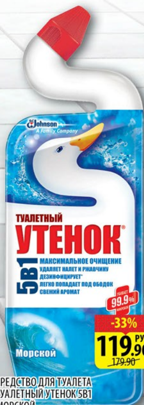
СРЕДСТВО ДЛЯ ТУАЛЕТА ТУАЛЕТНЫЙ УТЕНОК 5В1 МОРСКОЙ 750мл