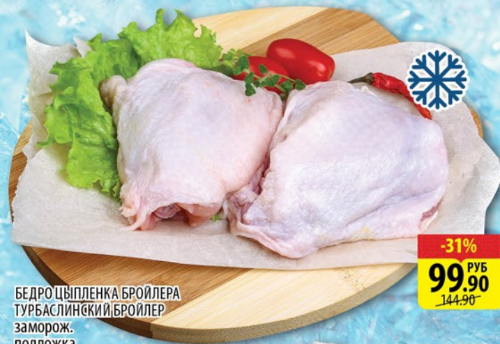
БЕДРО ЦЫПЛЕНКА БРОЙЛЕРА ТУРБАСЛИНСКИЙ БРОЙЛЕР заморож. подложка 1кг