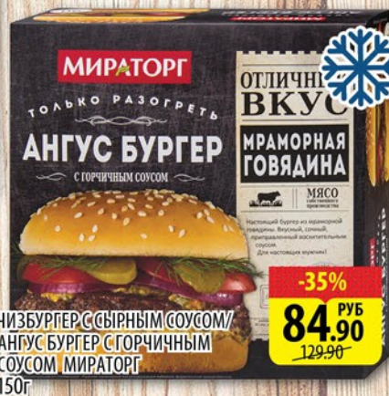
ЧИЗБУРГЕР С СЫРНЫМ СОУСОМ/ АНГУС БУРГЕР С ГОРЧИЧНЫМ СОУСОМ МИРАТОРГ 150г

ЦЕНА ДЕЙСТВИТЕЛЬНА ЗА ЕДИНИЦУ ТОВАРА ПРИ ПОКУПКЕ 2-Х ШТУК ЕДИНОВРЕМЕННО