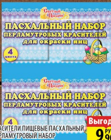
КРАСИТЕЛИ ПИЩЕВЫЕ ПАСХАЛЬНЫЙ ПЕРЛАМУТРОВЫЙ НАБОР