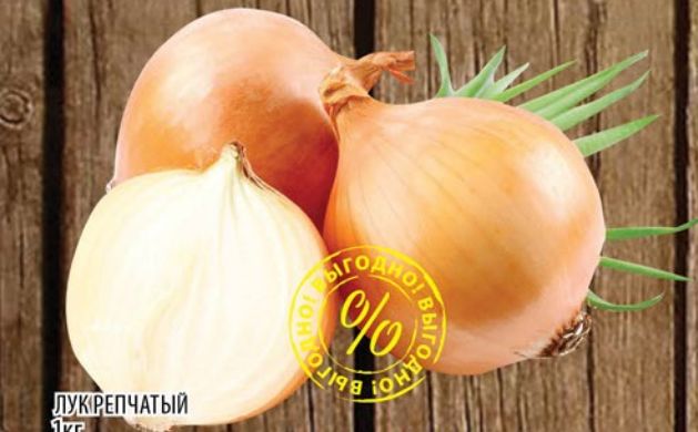
ЛУК РЕПЧАТЫЙ 1кг