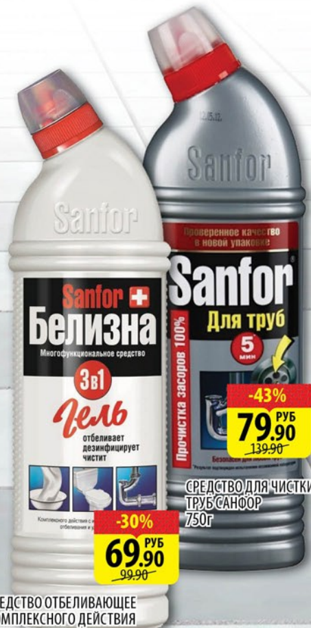
СРЕДСТВО ОТБЕЛИВАЮЩЕЕ КОМПЛЕКСНОГО ДЕЙСТВИЯ БЕЛИЗНА-ГЕЛЬ 700мл