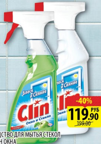
СРЕДСТВО ДЛЯ МЫТЬЯ СТЕКОЛ КЛИН ОКНА курок 500/750мл