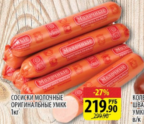
СОСИСКИ МОЛОЧНЫЕ ОРИГИНАЛЬНЫЕ УМКК 1кг