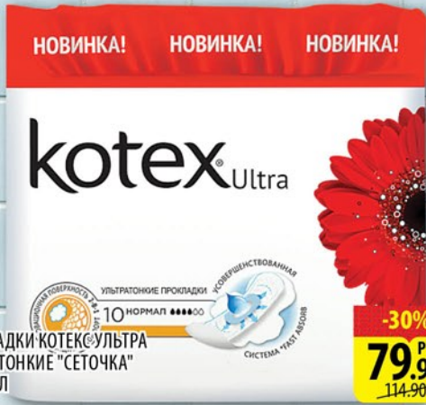
ПРокладки КОТЕКС УЛЬТРА УЛЬТРАТОНКИЕ "СЕТОЧКА" НОРМАЛ 10шт