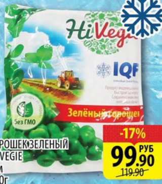
ГОРОШЕК ЗЕЛЕНЫЙ HI VEGGIE с/м 400г