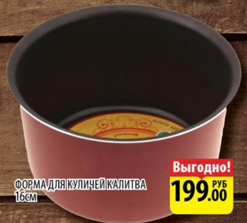
ФОРМА ДЛЯ КУЛИЧЕЙ КАЛИТВА 16см