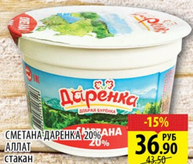
СМЕТАНА ДАРЕНКА 20% АЛЛАТ стакан 200г