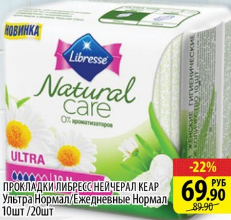
ПРокладки ЛИБРЕСС НЕЙЧЕРАЛ КЕАР Ульттра Нормал/Ежедневные Нормал 10шт / 20шт