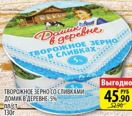
ТВОРОЖНОЕ ЗЕРНО СО СЛИВКАМИ ДОМИК В ДЕРЕВНЕ 5% пл/ст 130г