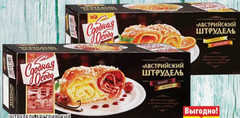
ШТРУДЕЛЬ АВСТРИЙСКИЙ С ДОБНОЙ ОСОБА Вишня+ваниль/Лимон+апельсин 400г