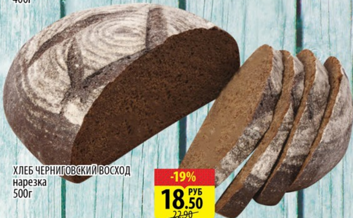
ХЛЕБ ЧЕРНИГОВСКИЙ ВОСХОД нарезка 500г