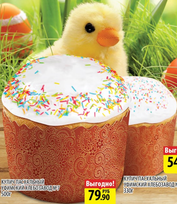
КУЛИЧ ПАСХАЛЬНЫЙ УФИМСКИЙ ХЛЕБОЗАВОД №7 500г