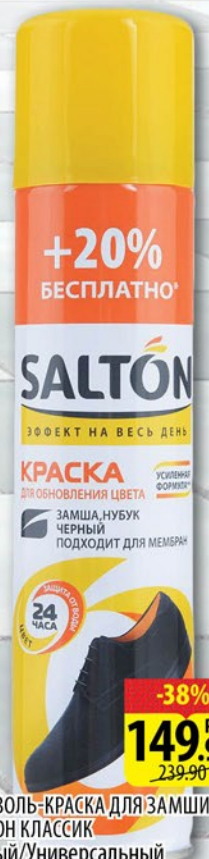
АЭРОЗОЛЬ-КРАСКА ДЛЯ ЗАМШИ САЛТОН КЛАССИК Черный/Универсальный 250мл