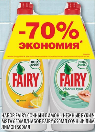
НАБОР FAIRY СОЧНЫЙ ЛИМОН+НЕЖНЫЕ РУКИ ЧАЙНОЕ ДЕРЕВО И МЯТА 650МЛ/НАБОР FAIRY 650МЛ СОЧНЫЙ ЛИМОН+MR.PROPER ЛИМОН 500МЛ