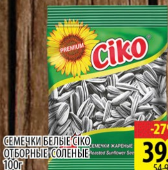
СЕМЕЧКИ БЕЛЫЕ СИКО ОТБОРНЫЕ СОЛЕННЫЕ 100г