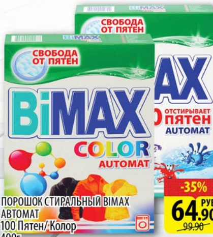
ПОРОШОК СТИРАЛЬНЫЙ ВИМАХ АВТОМАТ 100 Пятен/Колор 400г