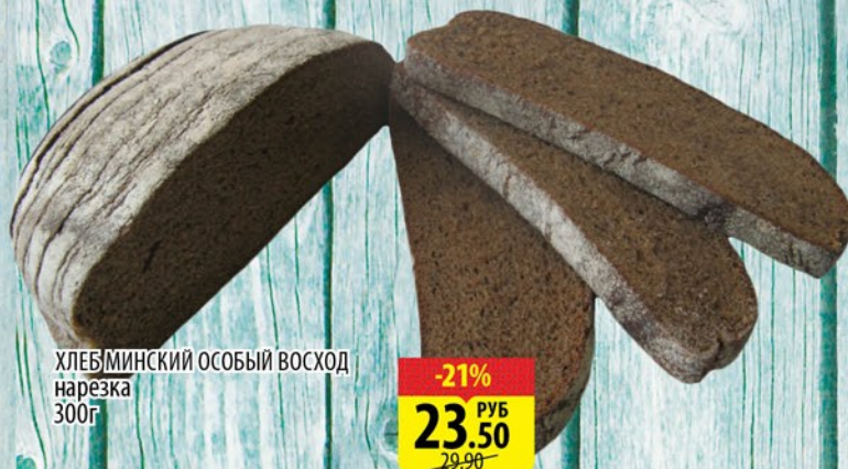
ХЛЕБ МИНСКИЙ ОСОБЫЙ ВОСХОД нарезка 300г