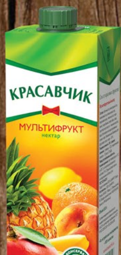
НЕКТАР КРАСАВЧИК Абрикос-облепиха/Яблоко-персик/Мультифрукт 0,93л