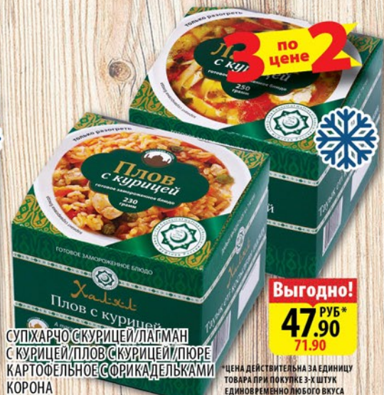
СУПХАРЧО С КУРИЦЕЙ ЛАГМАН С КУРИЦЕЙ/ПЛОВ С КУРИЦЕЙ/ПЮРЕ КАРТОФЕЛЬНОЕ С ФРИКАДЕЛЬКАМИ КОРОНА 230-250г