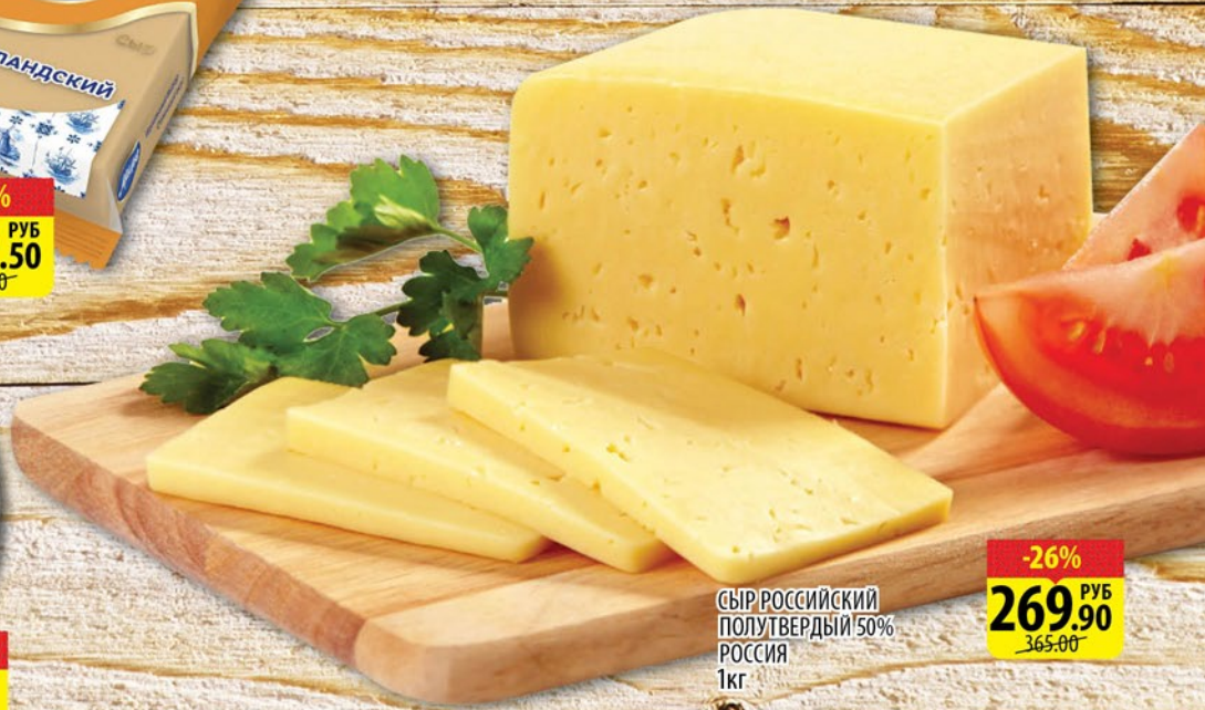
СЫР РОССИЙСКИЙ ПОЛУТВЕРДЫЙ 50% РОССИЯ 1кг