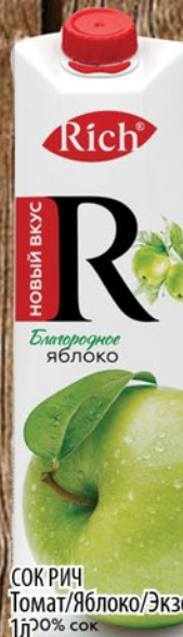
СОК РИЧ Томат/Яблоко/Экзотик/Персик 1л 20% сок