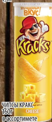
ЧИПСЫ КРАКС CHEESE в ассортименте 160г