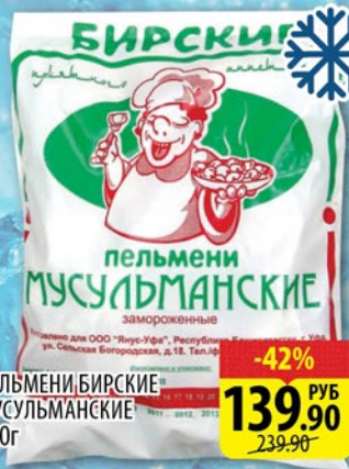
ПЕЛЬМЕНИ БИРСКИЕ- МУСУЛЬМАНСКИЕ 800г