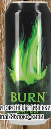
НАПИТОК ЭНЕРГЕТИЧЕСКИЙ BURN Original/Яблоко-киви ж/б 0,5л