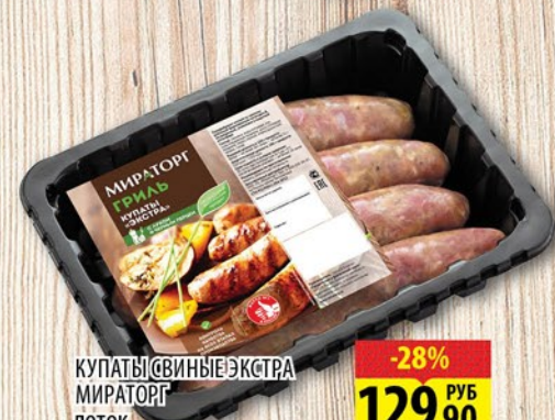
КУПАТЫ СВИНЫЕ ЭКСТРА МИРАТОРГ ЛОТОК 400г