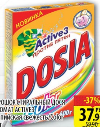
ПОРОШОК СТИРАЛЬНЫЙ ДОСЯ АВТОМАТ АКТИВЭЗ Альпийская свежесть/Color 400г