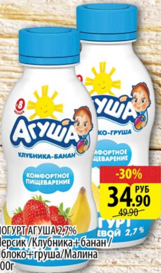
ЙОГУРТ АГУША 2,7% Персик / Клубника + банан / Яблоко + груша / Малина 200г