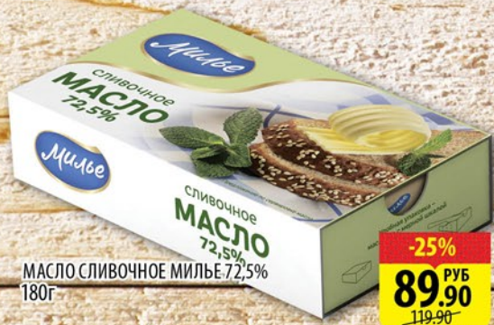
МАСЛО СЛИВОЧНОЕ МИЛЬЕ 72,5% 180г