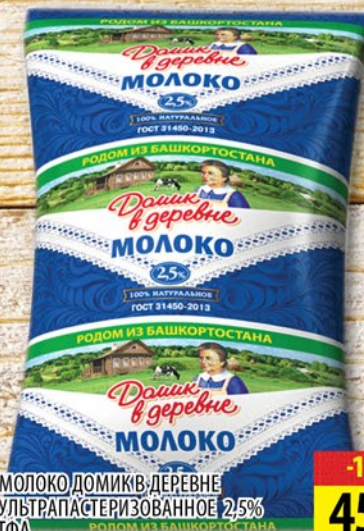
МОЛОКО ДОМИК В ДЕРЕВНЕ УЛЬТРАПАСТЕРИЗОВАННОЕ 2,5% ТФА 900г