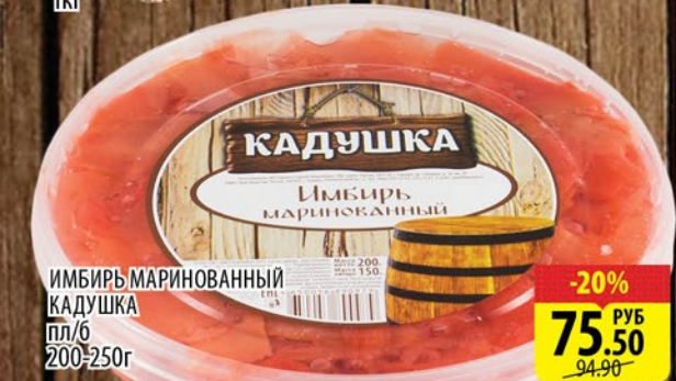
ИМБИРЬ МАРИНОВАННЫЙ КАДУШКА пл/б 200-250г