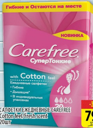
САЛОФЕТКИ ЕЖЕДНЕВНЫЕ CAREFREE Cotton feel/Fresh scent 20шт