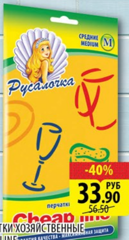
ПЕРЧАТКИ ХОЗЯЙСТВЕННЫЕ SHEAR LINE Малые/Средние/Большие