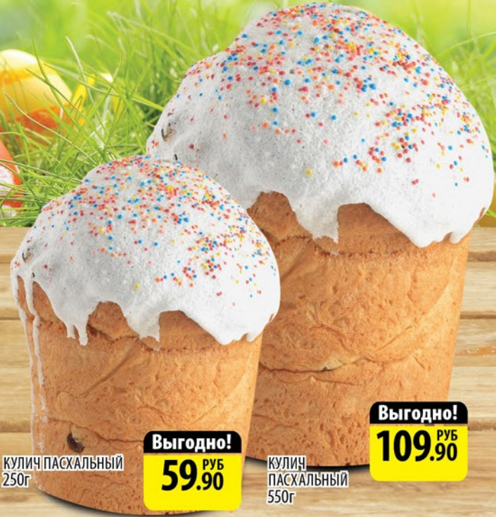
КУЛИЧ ПАСХАЛЬНЫЙ 250г