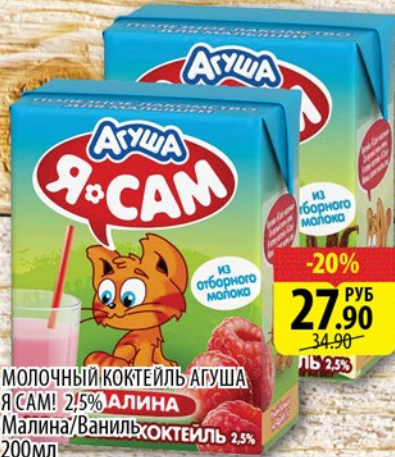
МОЛОЧНЫЙ КОКТЕЙЛЬ АГУША Я САМ! 2,5% АЛИНА Малина / Ваниль КОКТЕЙЛЬ 2,5% 200мл