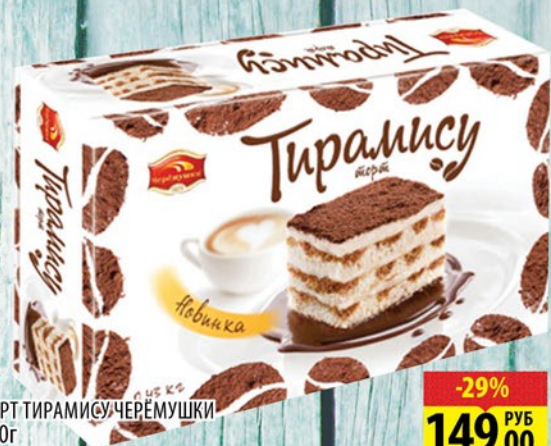
ТОРТ ТИРАМИСУ ЧЕРЕМУШКИ 430г