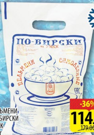
ПЕЛЬМЕНИ, ПО-БИРСКИ УМКК 800г