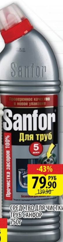
СРЕДСТВО ДЛЯ ЧИСТКИ ТРУБ САНФОР 750г