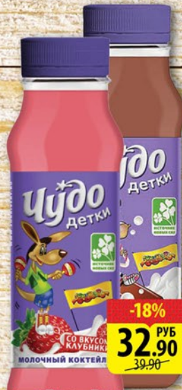
МОЛОЧНЫЙ КОКТЕЙЛЬ ЧУДО ДЕТКИ 2,5% / 3,2% Шоколад / Клубника 255мл / 260мл