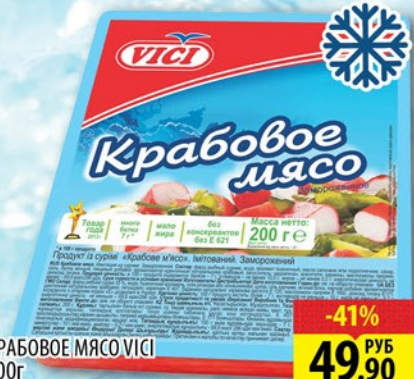
КРАБОВОЕ МЯСО VICI 200г