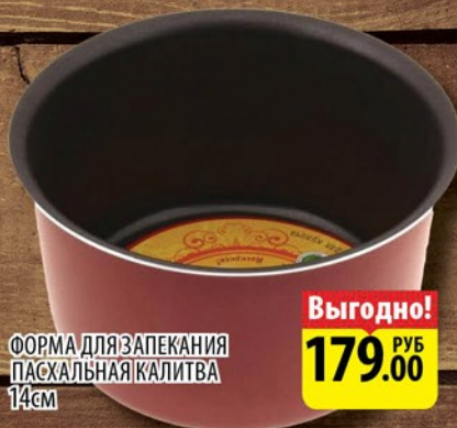
ФОРМА ДЛЯ ЗАПЕКАНИЯ ПАСХАЛЬНАЯ КАЛИТВА 14см