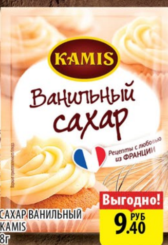
САХАР ВАНИЛЬНЫЙ КАМИС 8г