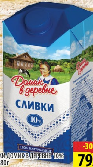
СЛИВКИ ДОМИК В ДЕРЕВНЕ 10% 470-480г