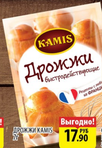
ДРОЖЖИ КАМИС 7г