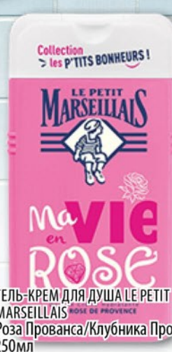
ГЕЛЬ-КРЕМ ДЛЯ ДУША LE PETIT MARSEILLAIS Роза Прованса/Клубника Прованса 250мл