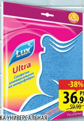
САЛФЕТКА УНИВЕРСАЛЬНАЯ РУСАЛОЧКА ULTRA ИЗ МИКРОФИБРЫ 30*30см 1шт.