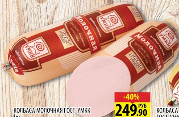
КОЛБАСА МОЛОЧНАЯ ГОСТ УМКК 1кг